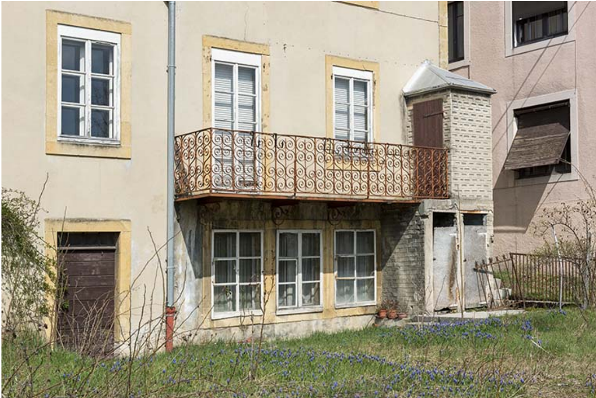
Façade postérieure en hiver : fenêtres multiples et balcon.