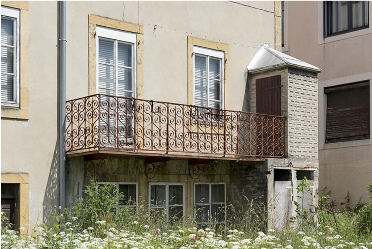
Façade postérieure : fenêtres multiples et balcon.