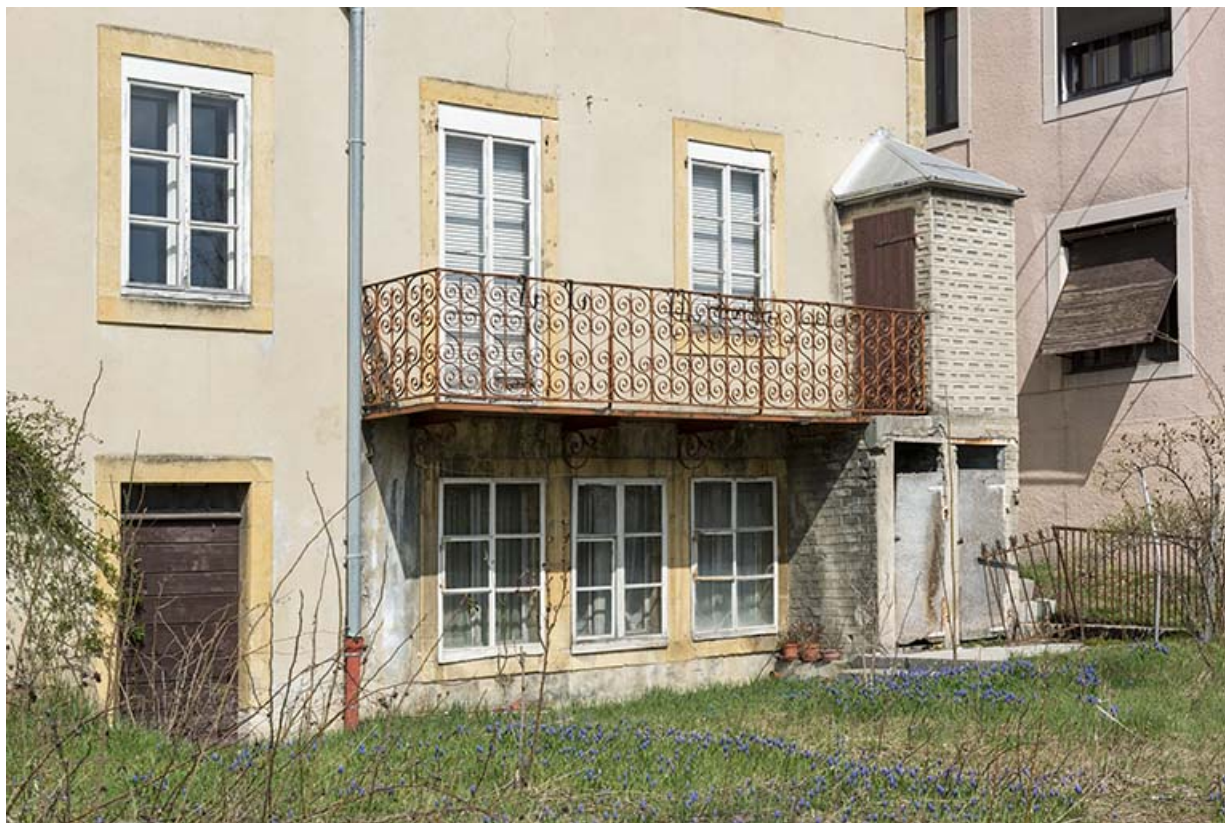
Façade postérieure en hiver : fenêtres multiples et balcon.