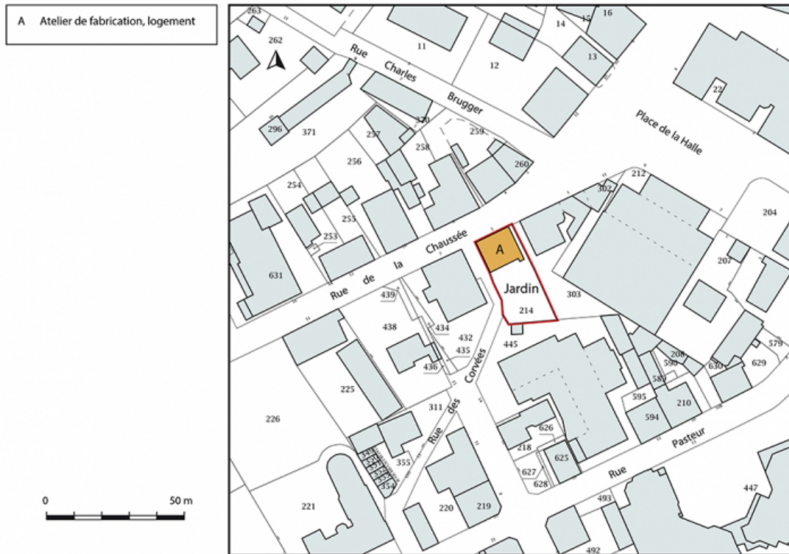
Plan-masse et de situation. Extrait du plan cadastral, 2018, section AA, 1/1 000. 25, Morteau, 5 rue de la Chaussée