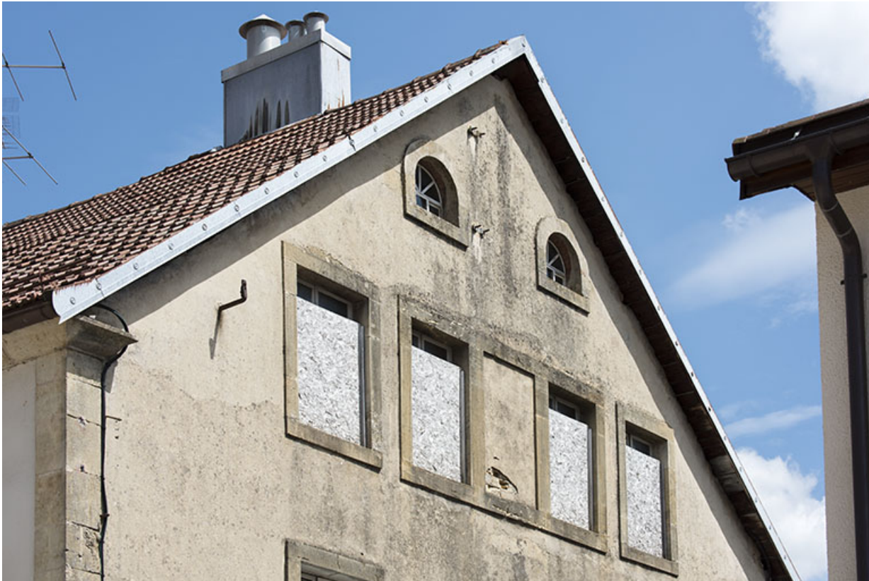
Façade latérale droite : fenêtres multiples dans le pignon.