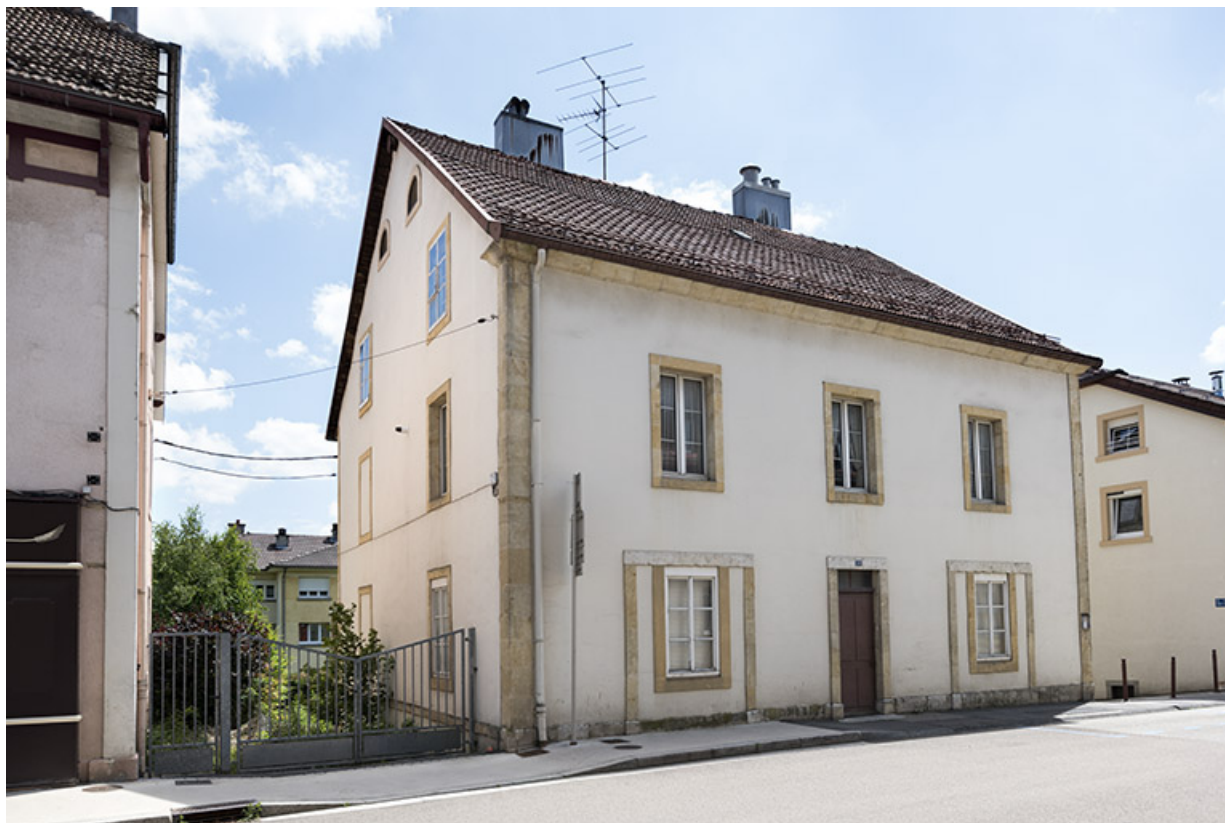
Vue d'ensemble, de trois quarts gauche. 25, Morteau, 5 rue de la Chaussée