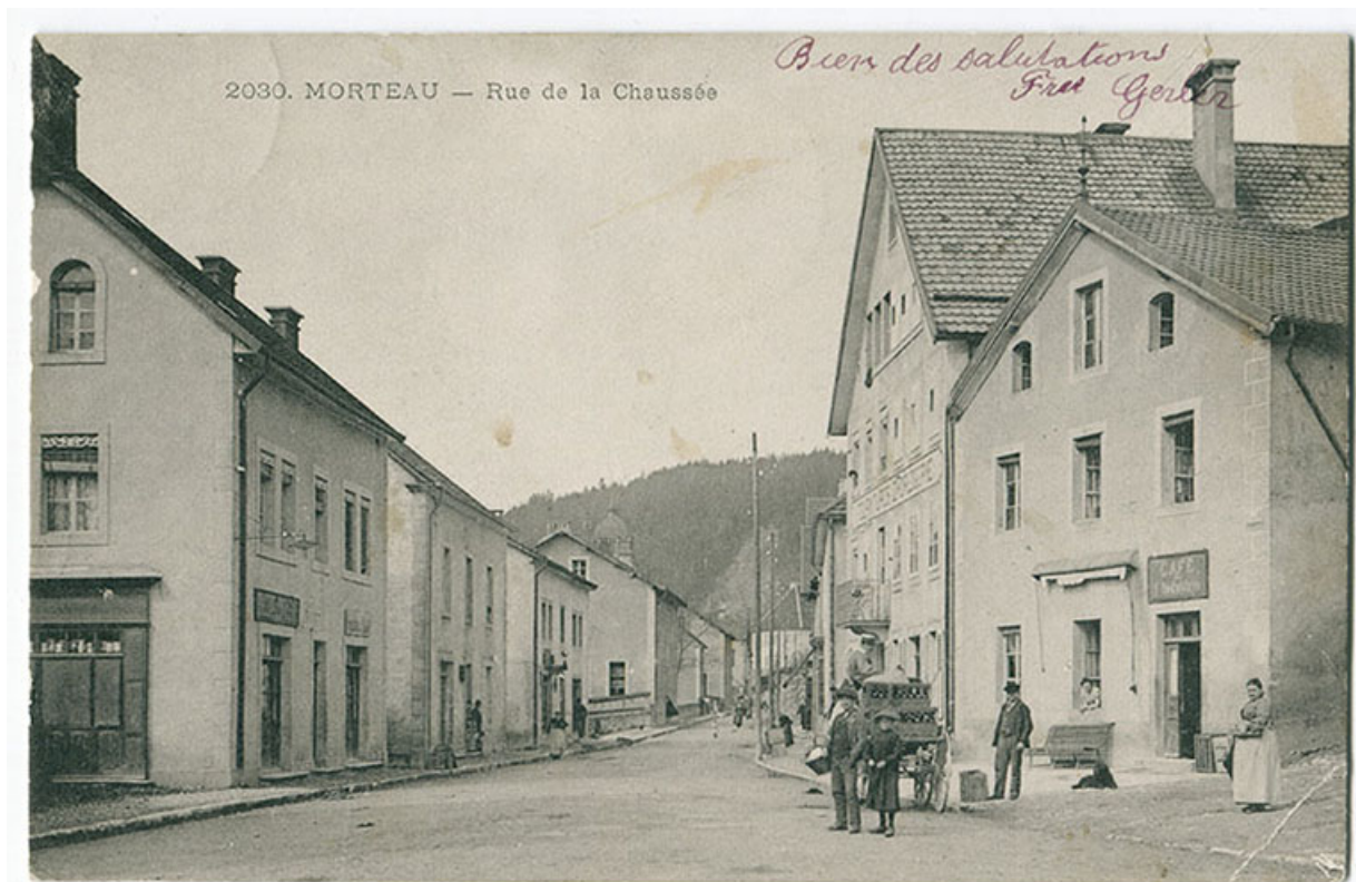
2030. Morteau - Rue de la Chaussée [vue de la place de la Halle], 4e quart 19e siècle. La maison est la deuxième à gauche. 25, Morteau

2030. Morteau - Rue de la Chaussée [vue de la place de la Halle], carte postale, s.n., [4e quart 19e siècle], J. Farine éd. au Locle et à Morteau.