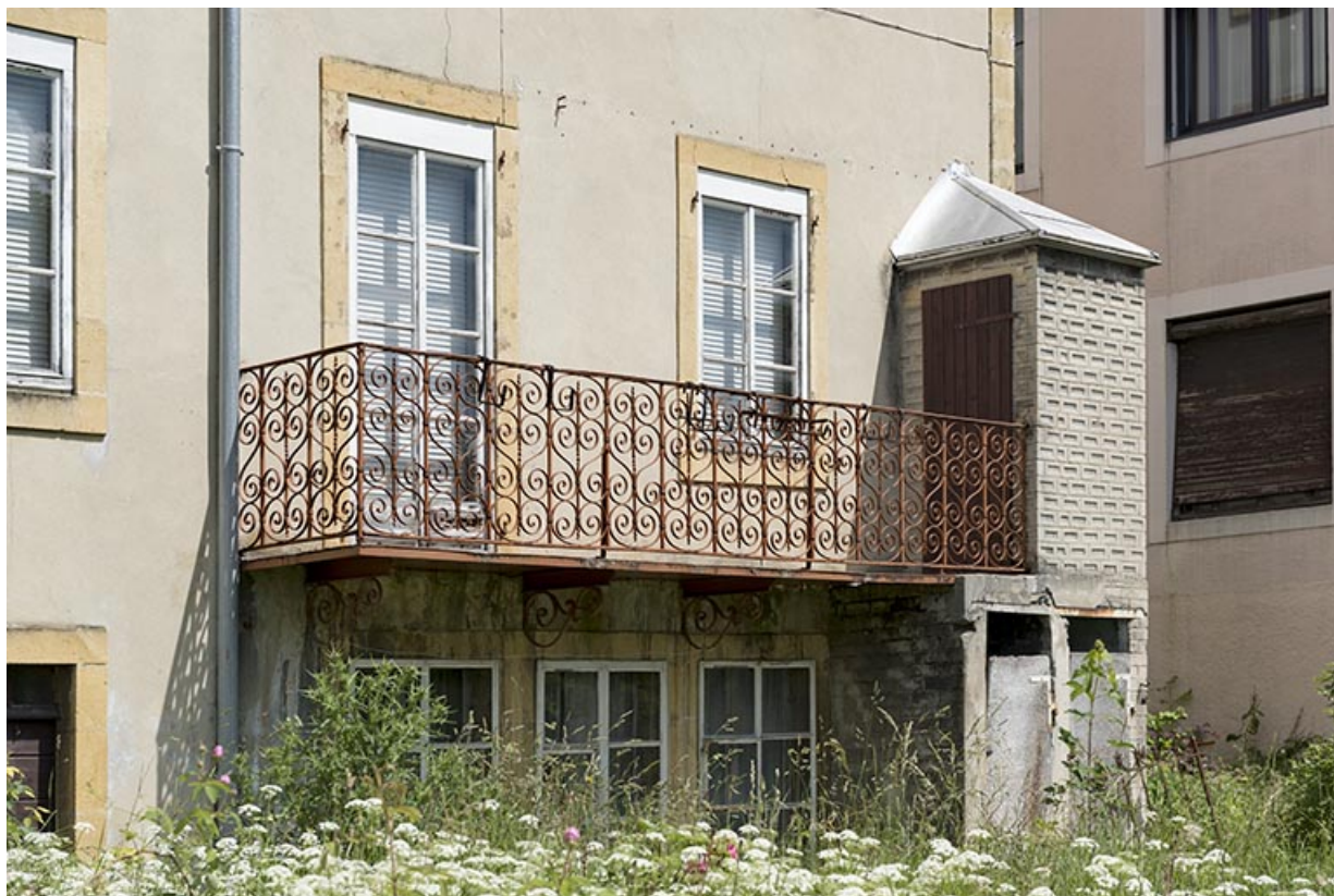
Façade postérieure : fenêtres multiples et balcon.