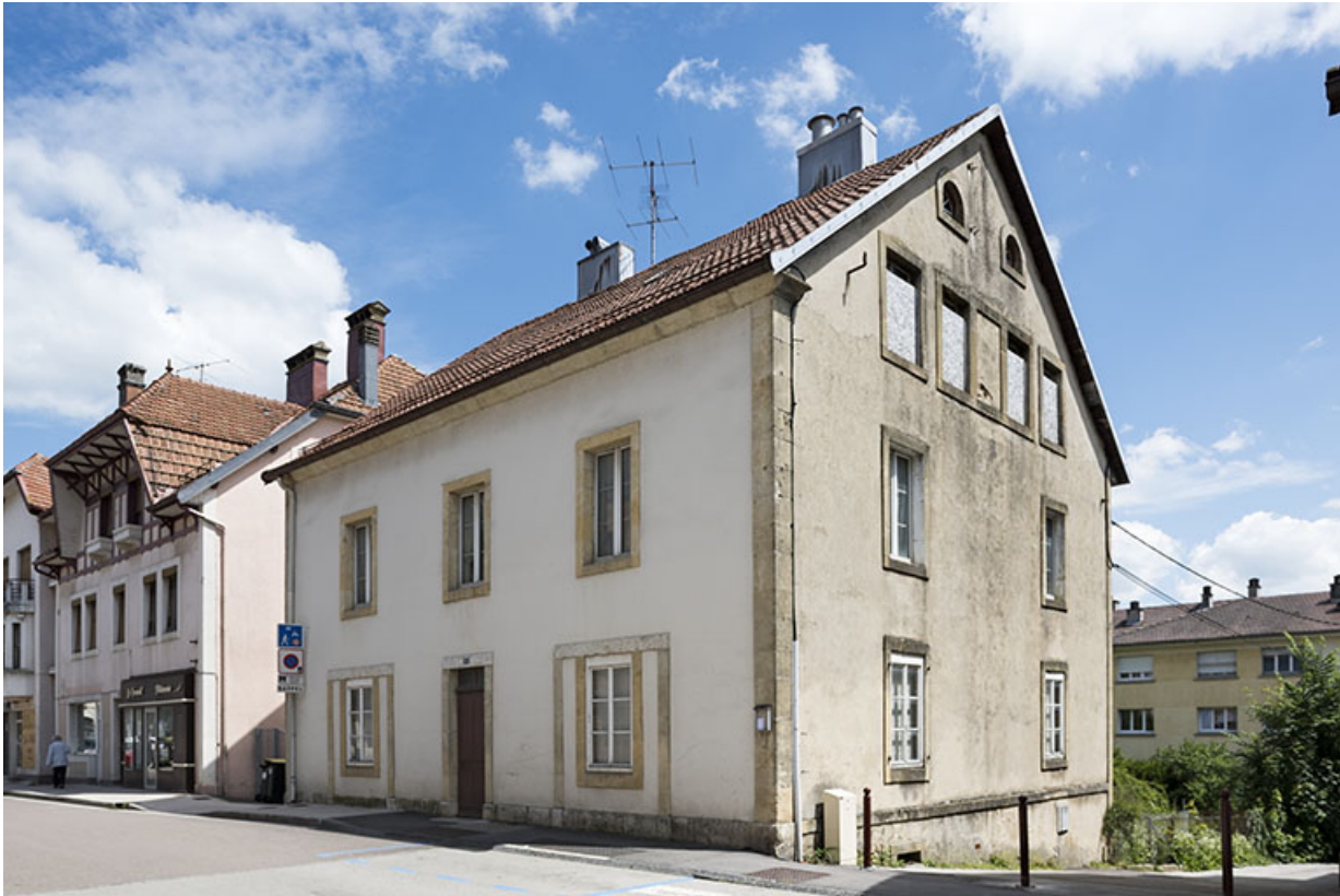
Vue d'ensemble, de trois quarts droite.