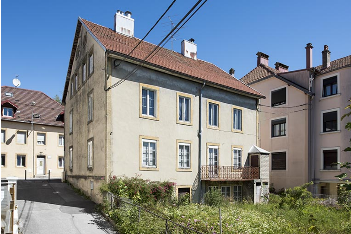
Façade postérieure, de trois quarts gauche.