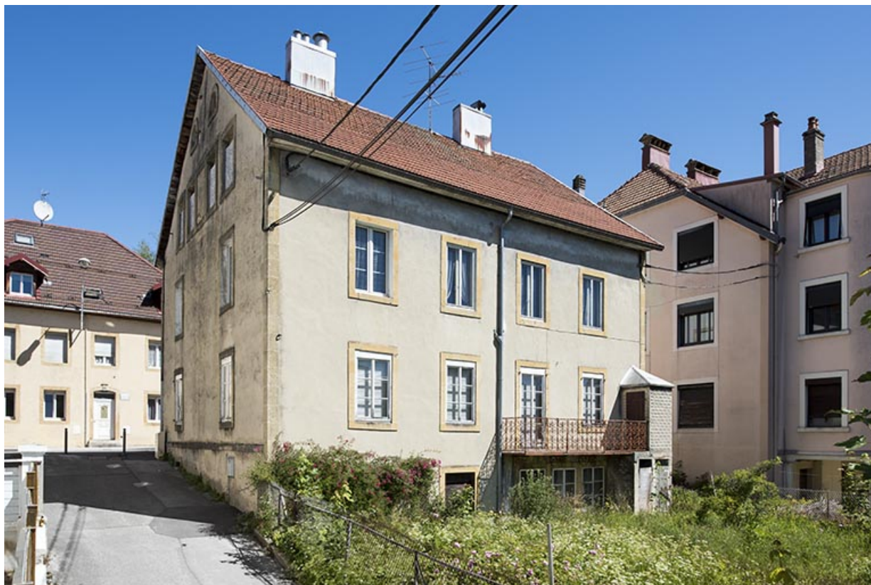
Façade postérieure, de trois quarts gauche. 25, Morteau, 5 rue de la Chaussée