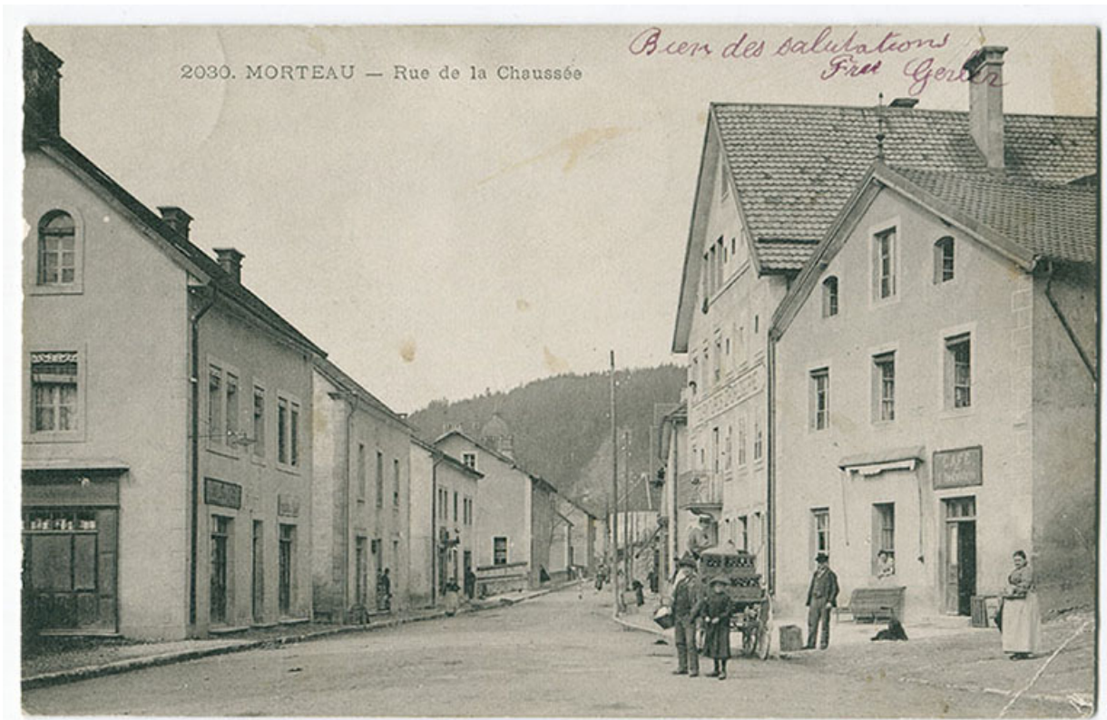
2030. Morteau - Rue de la Chaussée [vue de la place de la Halle], 4e quart 19e siècle. La maison est la deuxième à gauche. 25, Morteau