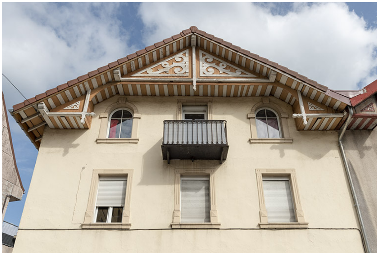
Maison au n° 1 rue Pasteur : façade antérieure, vue en contre-plongée. 25, Morteau, 1-3 rue Pasteur