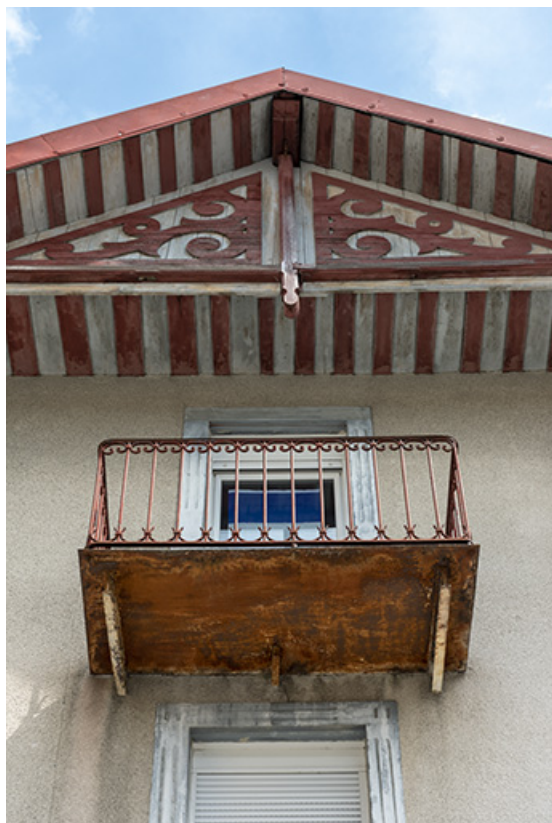
Maison au n° 3 rue Pasteur, façade antérieure : balcon et décor du pignon. 25, Morteau, 1-3 rue Pasteur