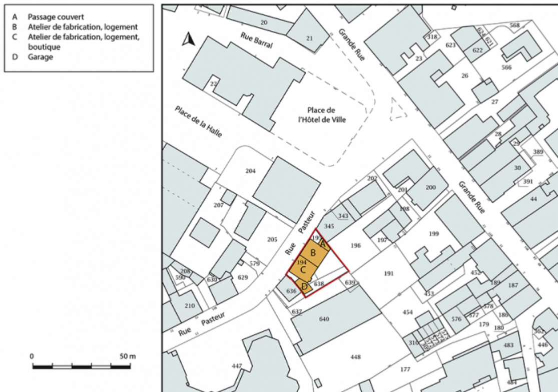
Plan-masse et de situation. Extrait du plan cadastral, 2017, section AA, 1/1 000. 25, Morteau, 1-3 rue Pasteur