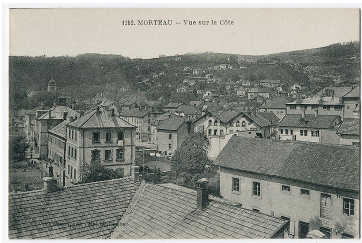
1252. Morteau - Vue sur la Côte, 1er quart 20e siècle. La Grande Fabrique est vue en enfilade à gauche. 25, Morteau