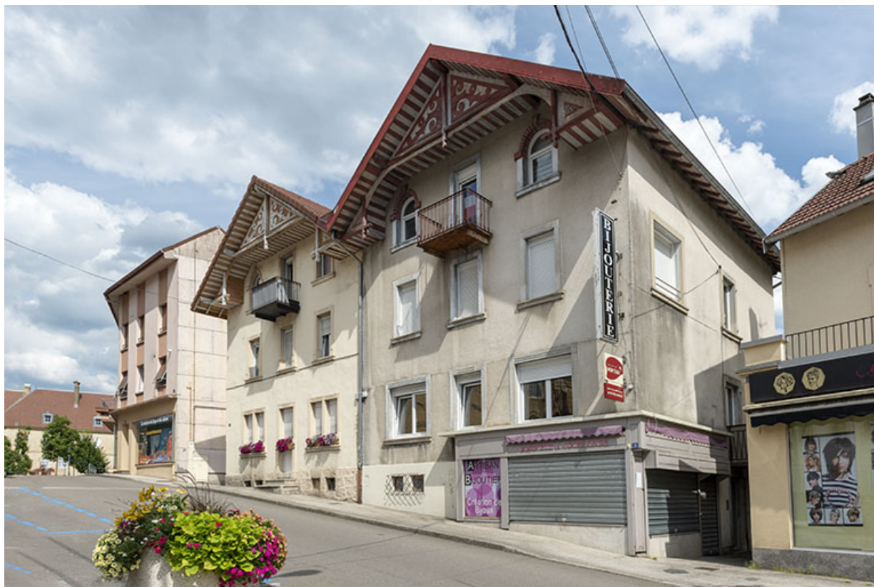
Façades antérieures, de trois quarts droite. 25, Morteau