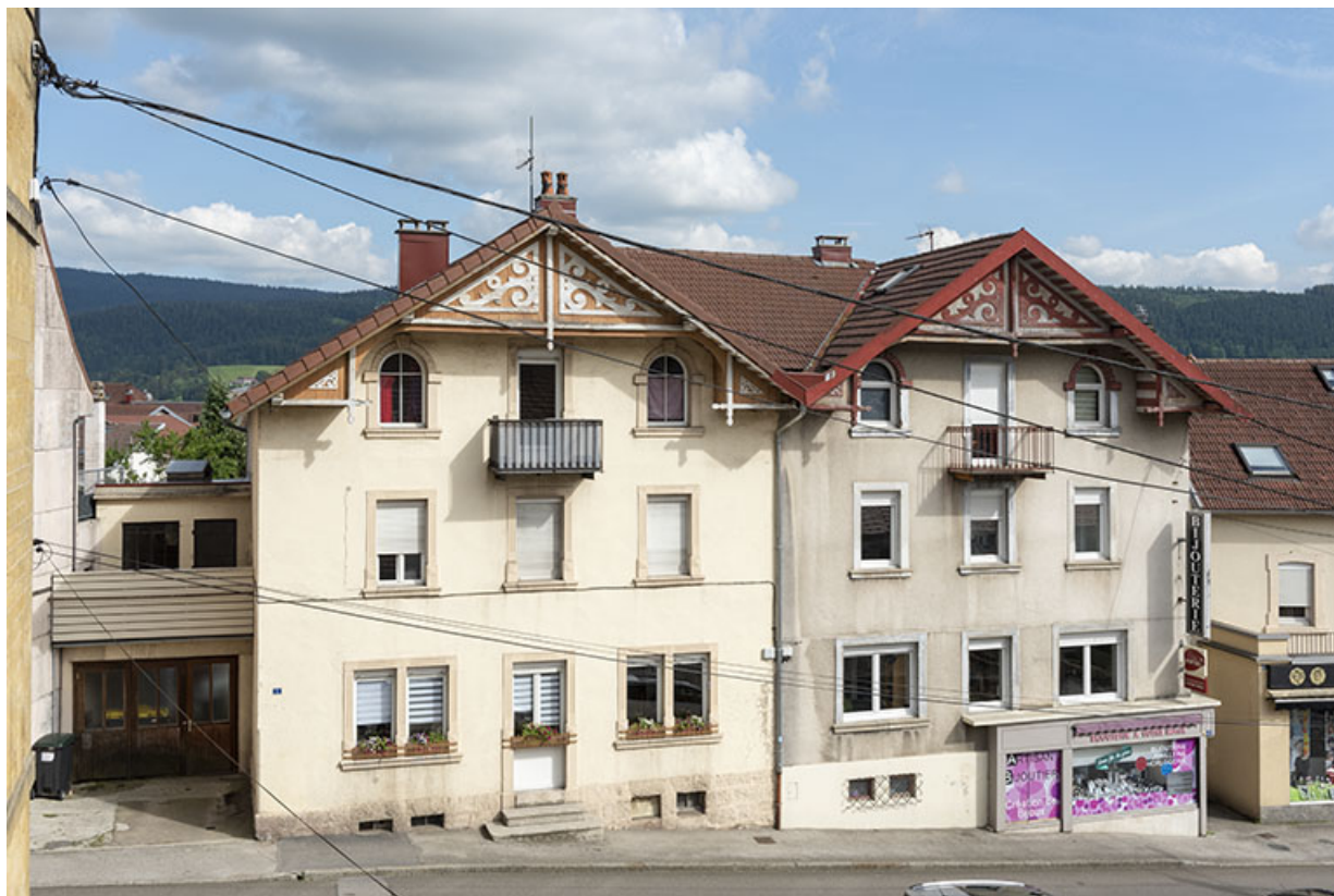
Façades antérieures, de trois quarts gauche. 25, Morteau, 1-3 rue Pasteur