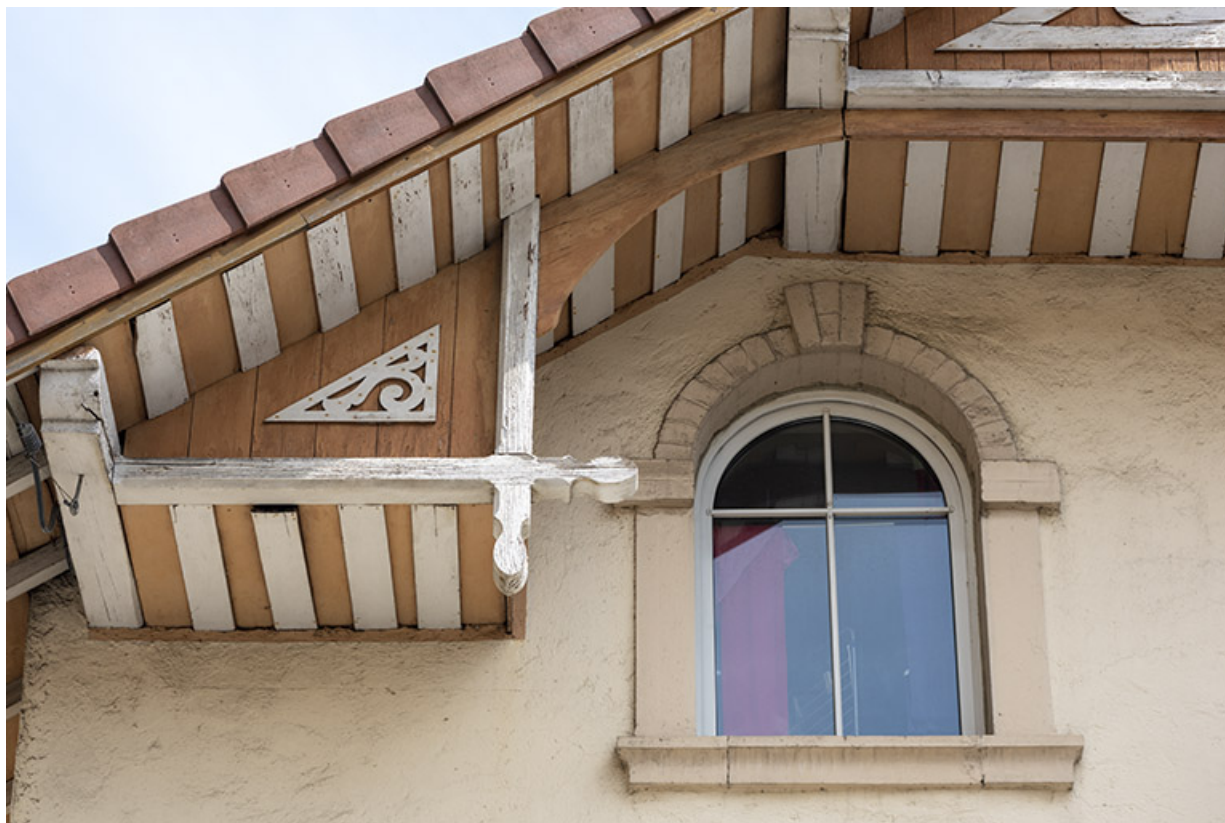
Maison au n° 1 rue Pasteur, façade antérieure : fenêtre et décor en partie haute. 25, Morteau, 1-3 rue Pasteur