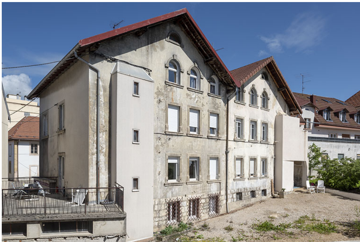
Façades postérieures, de trois quarts gauche. 25, Morteau, 1-3 rue Pasteur