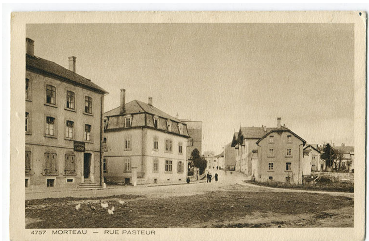
4757 Morteau - Rue Pasteur, 1ère moitié 20e siècle. Les maisons sont visibles au deuxième plan à droite. 25, Morteau