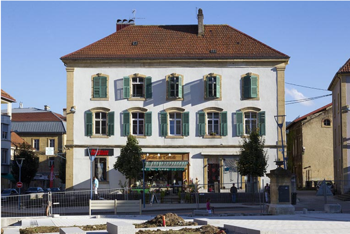
Façade antérieure (2013).

25, Morteau, 1 place de l' Hôtel de Ville