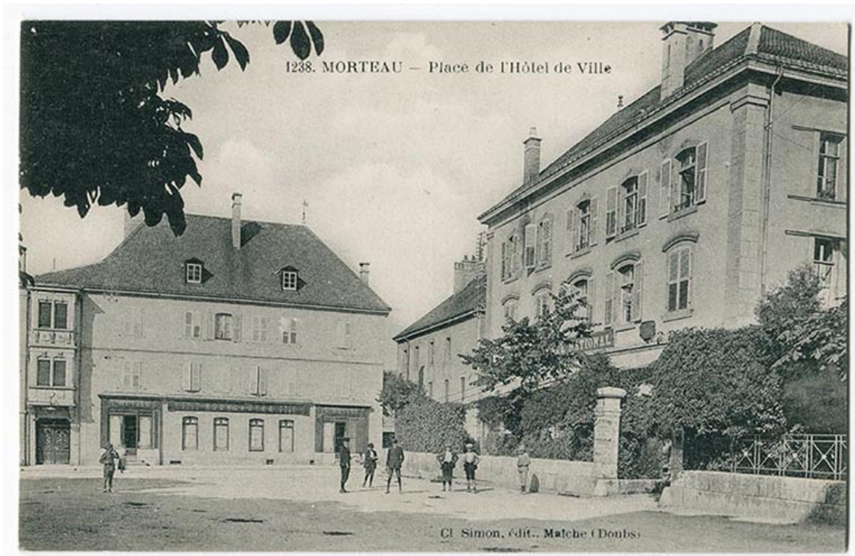
1238. Morteau - Place de l'Hôtel de Ville [le Café national et le magasin de confection de Laurent Wetzel], 1ère moitié 20e siècle. 25, Morteau, 1 place de l' Hôtel de Ville

1238. Morteau - Place de l'Hôtel de Ville [le Café national et le magasin de confection de Laurent Wetzel], carte postale, par Simon, s.d. [1ère moitié 20e siècle], Simon éd. à Maiche Lieu de conservation : Collection particulière : Henri Ethalon, Les Ecorces