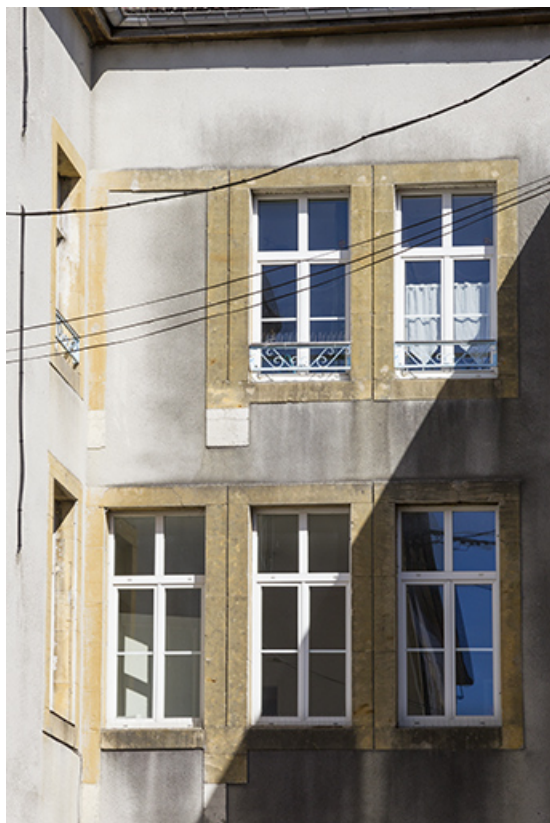
Façade postérieure du 21 Grande Rue : fenêtres multiples aux étages. 25, Morteau, 1 place de l' Hôtel de Ville