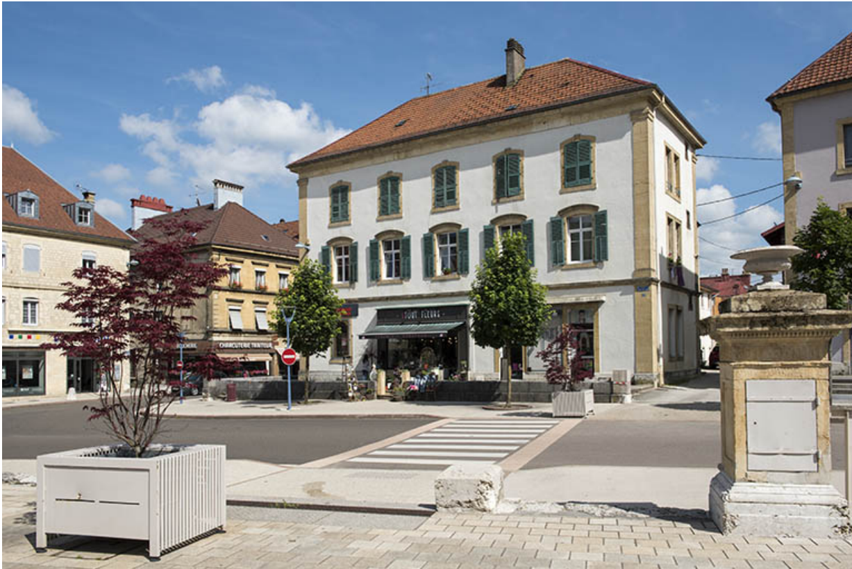
Vue d'ensemble, de trois quarts droite.

25, Morteau, 1 place de l' Hôtel de Ville