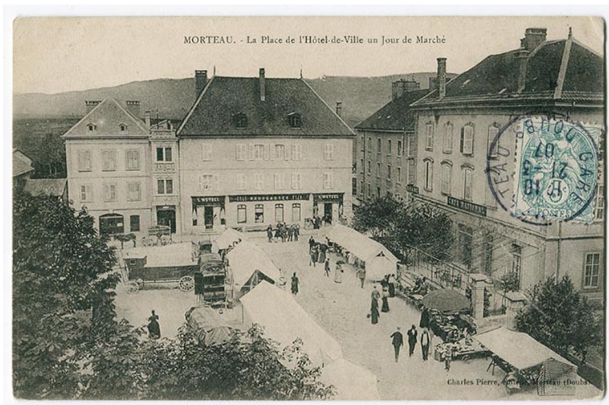
Morteau. - La place de l'Hôtel-de-Ville un jour de marché, limite 19e siècle 20e siècle [avant 1907]. 25, Morteau