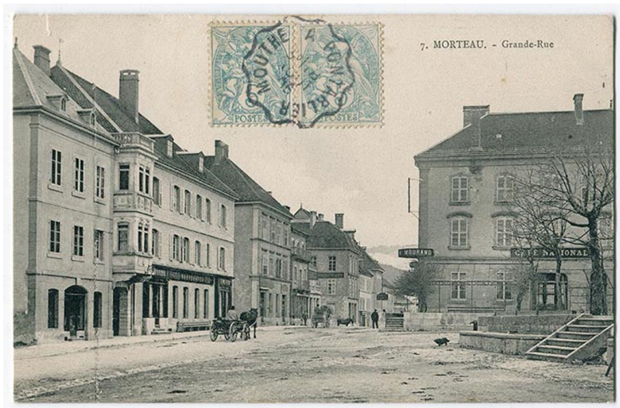
7. Morteau. - Grande Rue [au niveau de la place de l'Hôtel de Ville], limite 19e siècle 20e siècle [avant 1905]. 25, Morteau, 14 et 14 bis Grande Rue