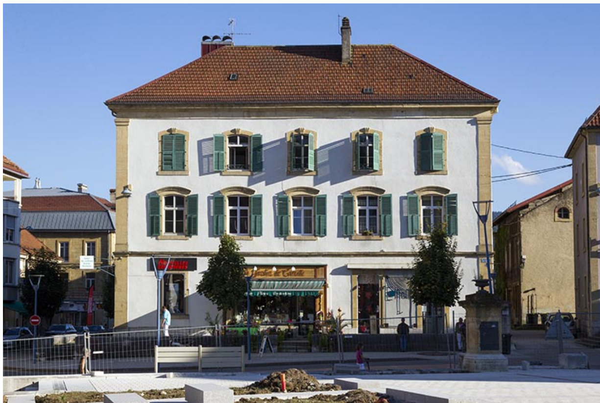
Façade antérieure (2013).

25, Morteau, 1 place de l' Hôtel de Ville