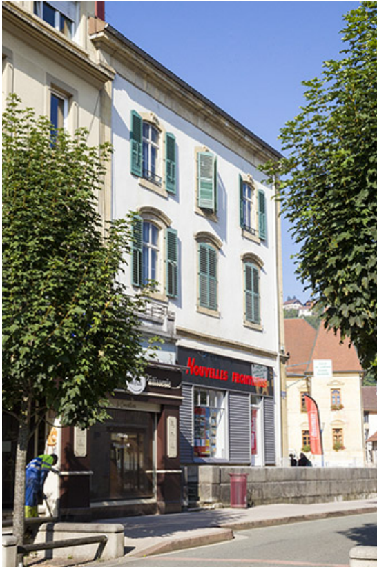
Façade latérale gauche, de trois quarts gauche. 25, Morteau, 1 place de l' Hôtel de Ville