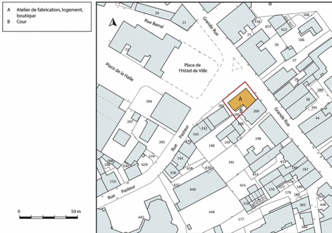
Plan-masse et de situation. Extrait du plan cadastral, 2017, section AA, 1/1 000. 25, Morteau, 1 place de l' Hôtel de Ville