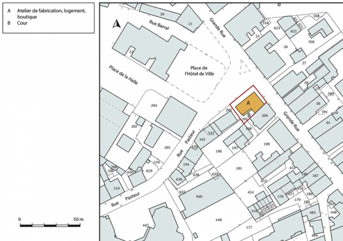
Plan-masse et de situation. Extrait du plan cadastral, 2017, section AA, 1/1 000. 25, Morteau, 1 place de l' Hôtel de Ville