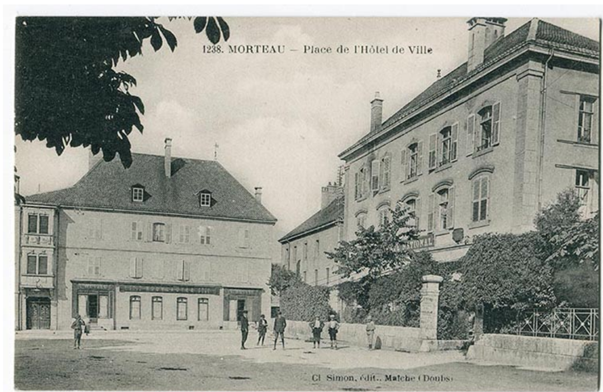
1238. Morteau - Place de l'Hôtel de Ville [le Café national et le magasin de confection de Laurent Wetzel], 1ère moitié 20e siècle. 25, Morteau, 1 place de l' Hôtel de Ville