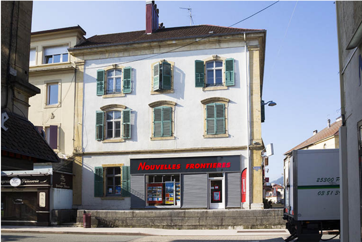
Façade latérale gauche.

25, Morteau, 1 place de l' Hôtel de Ville