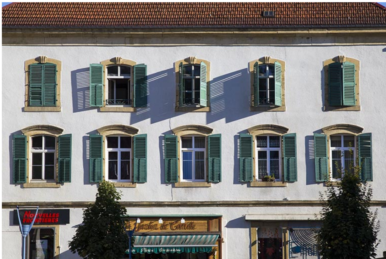
Façade antérieure : fenêtres des deux étages carrés.

25, Morteau, 1 place de l' Hôtel de Ville