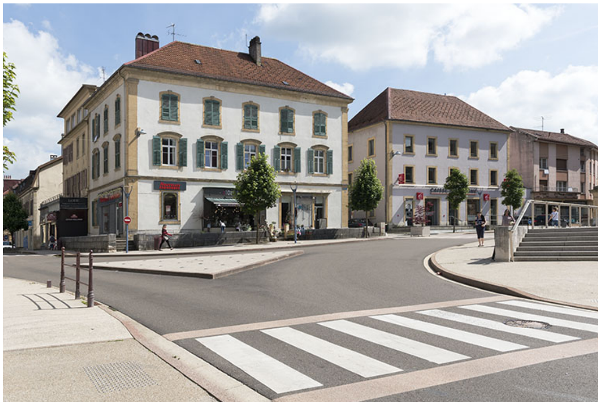
Vue d'ensemble, depuis le nord. 25, Morteau