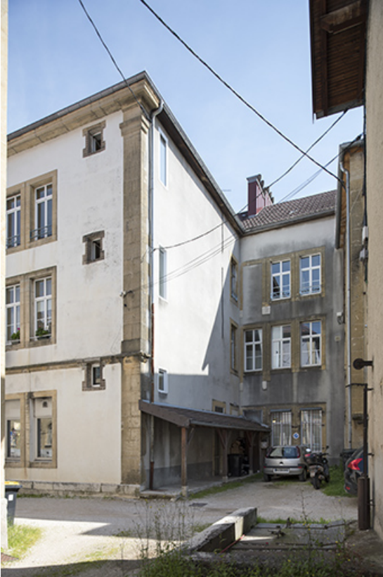
Façades postérieure et latérale droite.

25, Morteau, 1 place de l' Hôtel de Ville