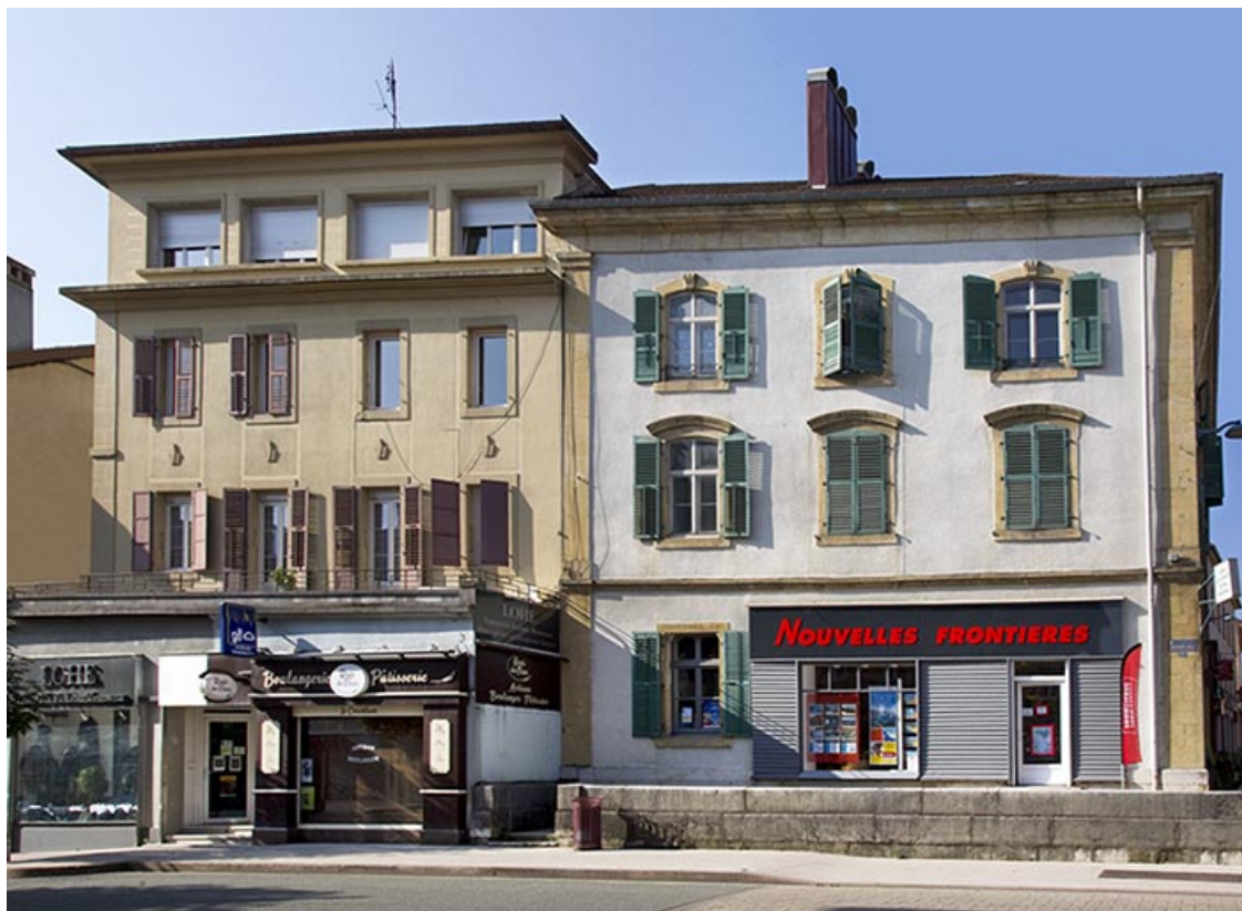
Vue d'ensemble de la façade latérale gauche (21 Grande Rue), avec le bâtiment au 19 Grande Rue. 25, Morteau