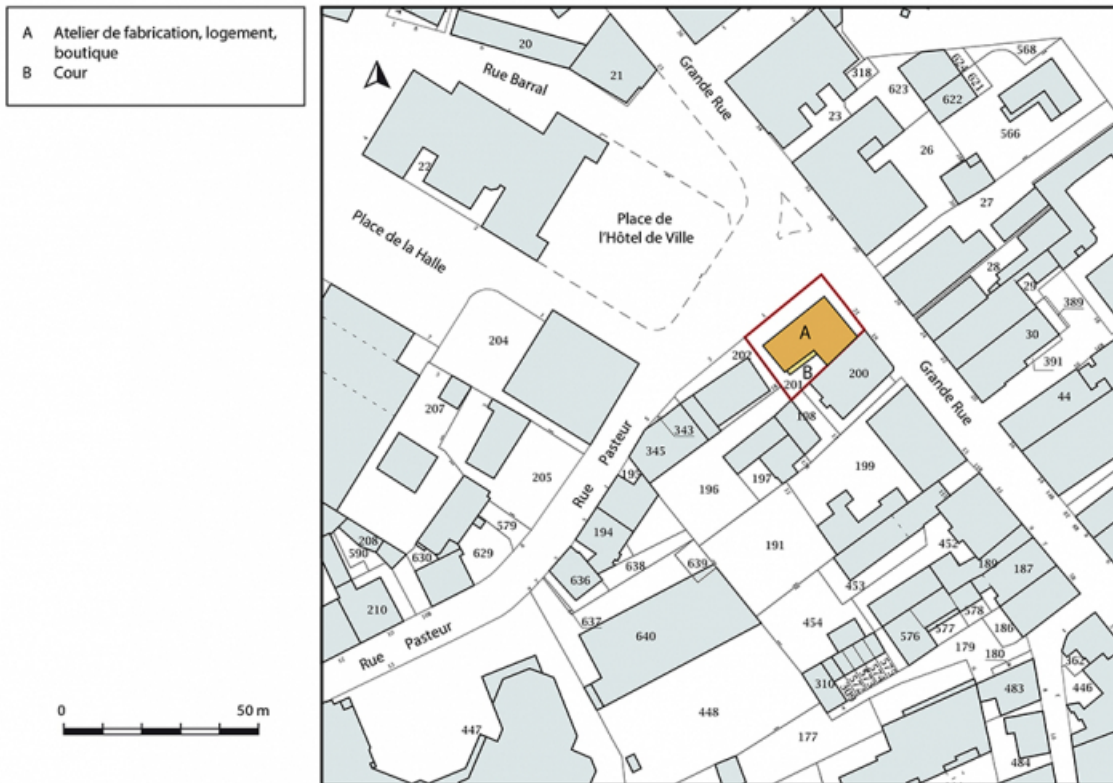
Plan-masse et de situation. Extrait du plan cadastral, 2017, section AA, 1/1 000. 25, Morteau, 1 place de l' Hôtel de Ville