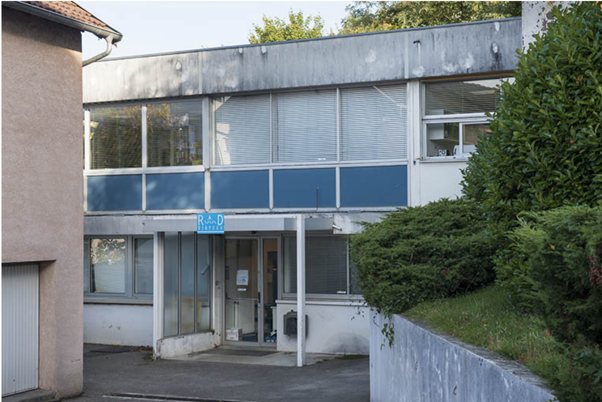
Façade sud de l'extension.