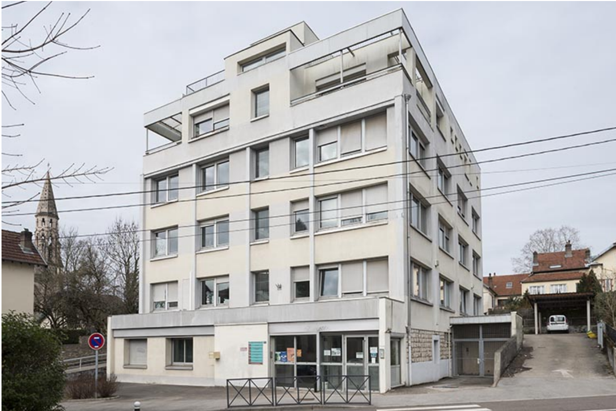
Vue de trois quarts droite.