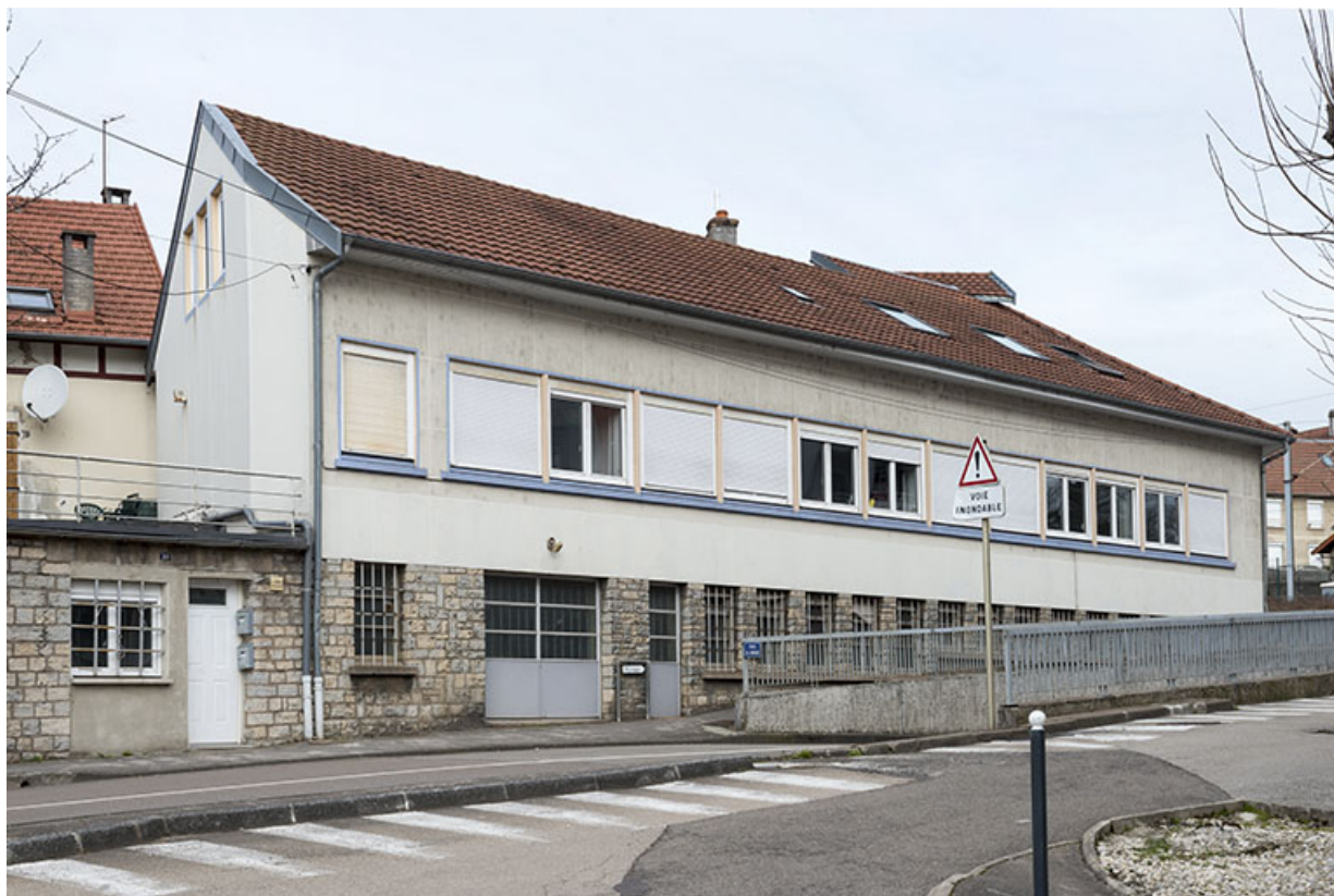
Vue d'ensemble depuis le sud. 25, Besançon, 26 rue de l' Église