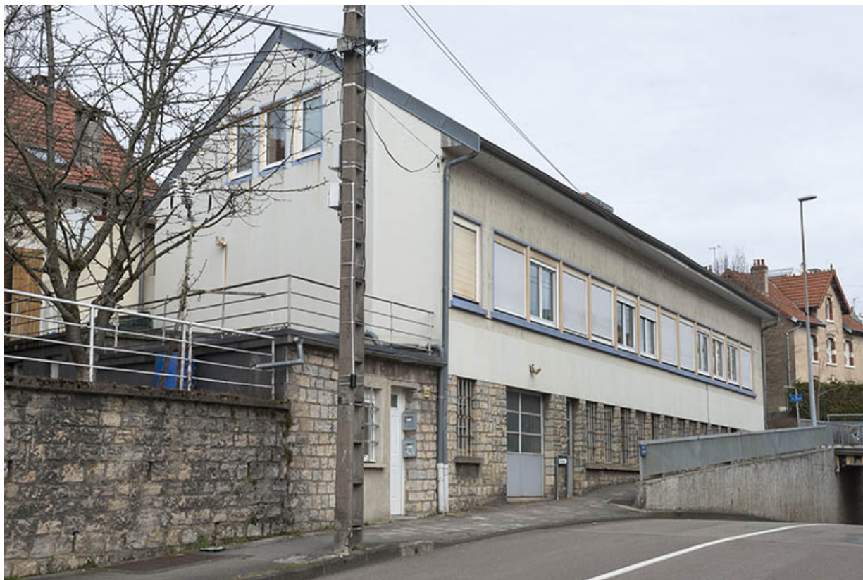
Façade est vue de trois quarts gauche.