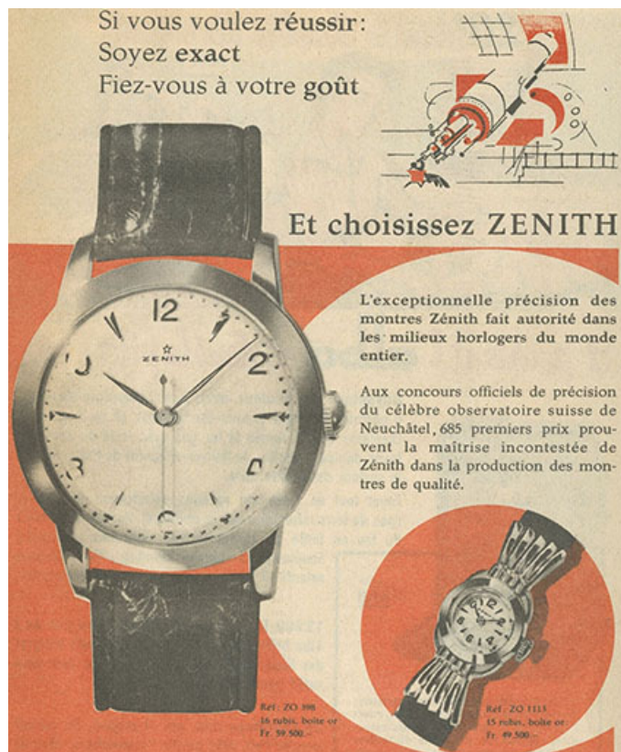
Encart publicitaire, 1957.