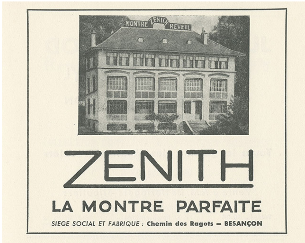
Zenith. La montre parfaite, publicité, 1951.