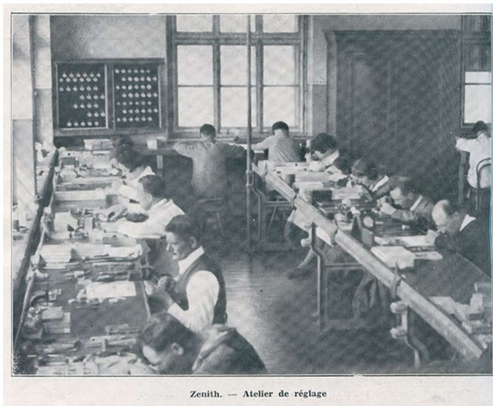
Zenith. - Atelier de réglage, 1933. Bâtiment détruit et remplacé par celui de Frances Ebauches ? 25, Besançon chemin des Ragots