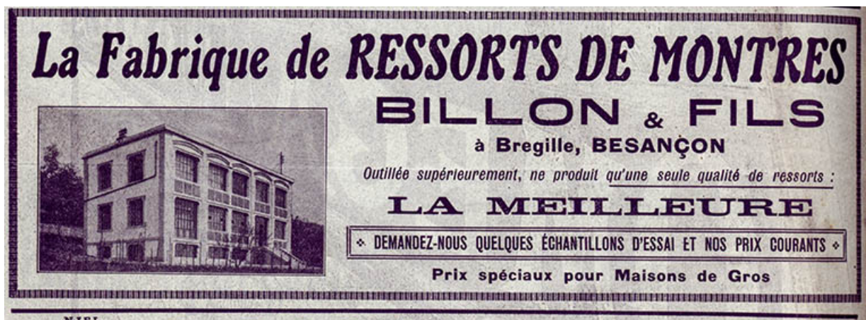
Fabrique de ressorts de montres Billon, publicité, 1913. 25, Besançon chemin des Ragots