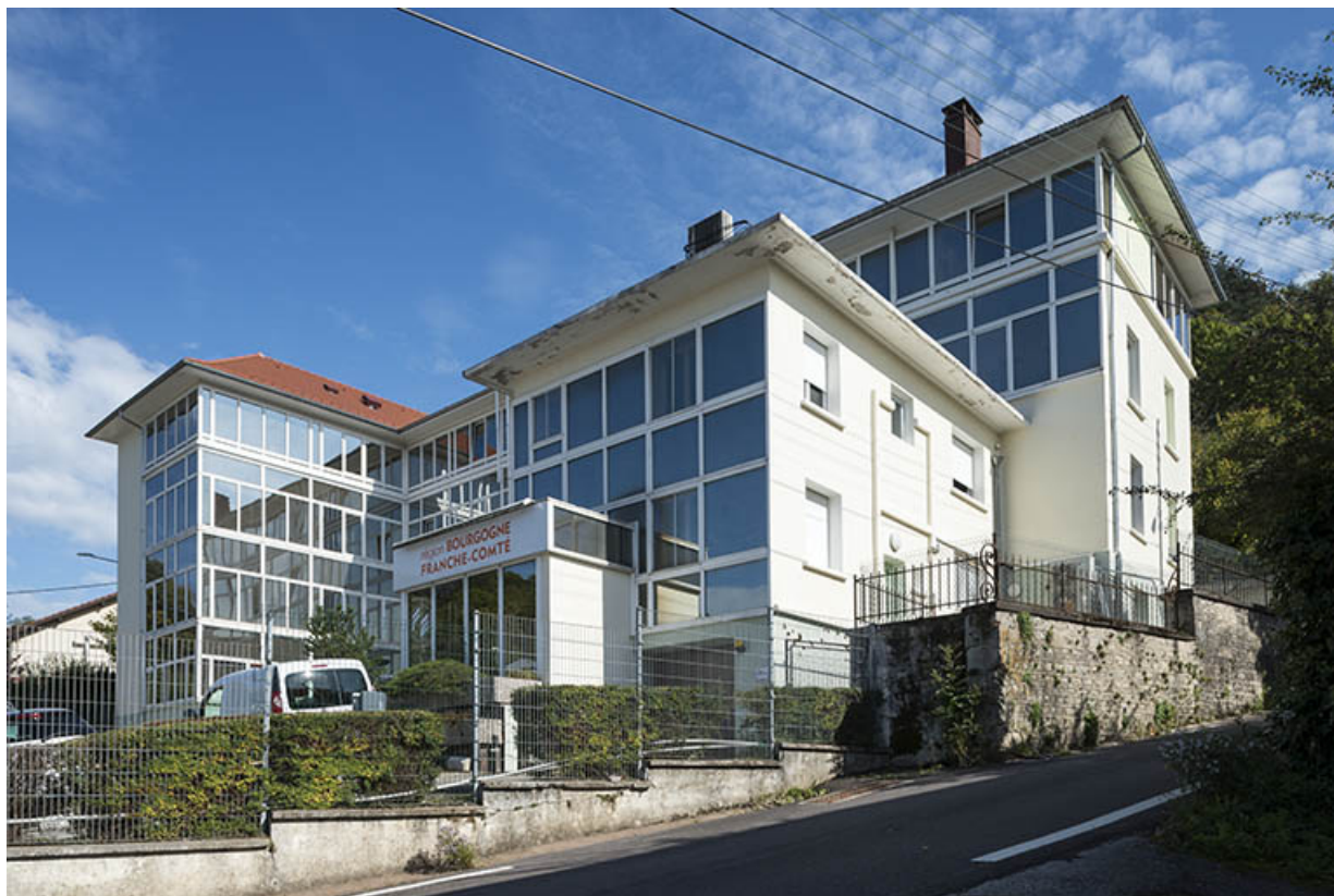
Siège et services centraux de France Ebauches, de 1987 à 1994 (ancienne fabrique de ressorts de montres Billon et Fils puis d'ébauches Zenith), chemins des Ragots à Besançon.