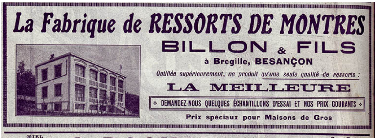
Fabrique de ressorts de montres Billon, publicité, 1913. 25, Besançon chemin des Ragots