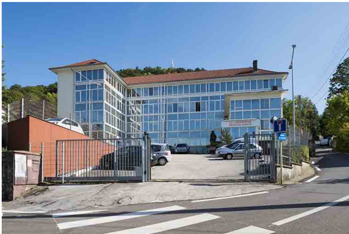
Vu d'ensemble depuis le nord-ouest.