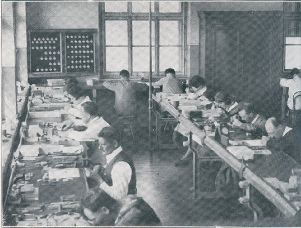
Zenith. — Atelier de réglage

Zenith. - Atelier de réglage, 1933. Bâtiment détruit et remplacé par celui de Frances Ebauches ? 25, Besançon chemin des Ragots