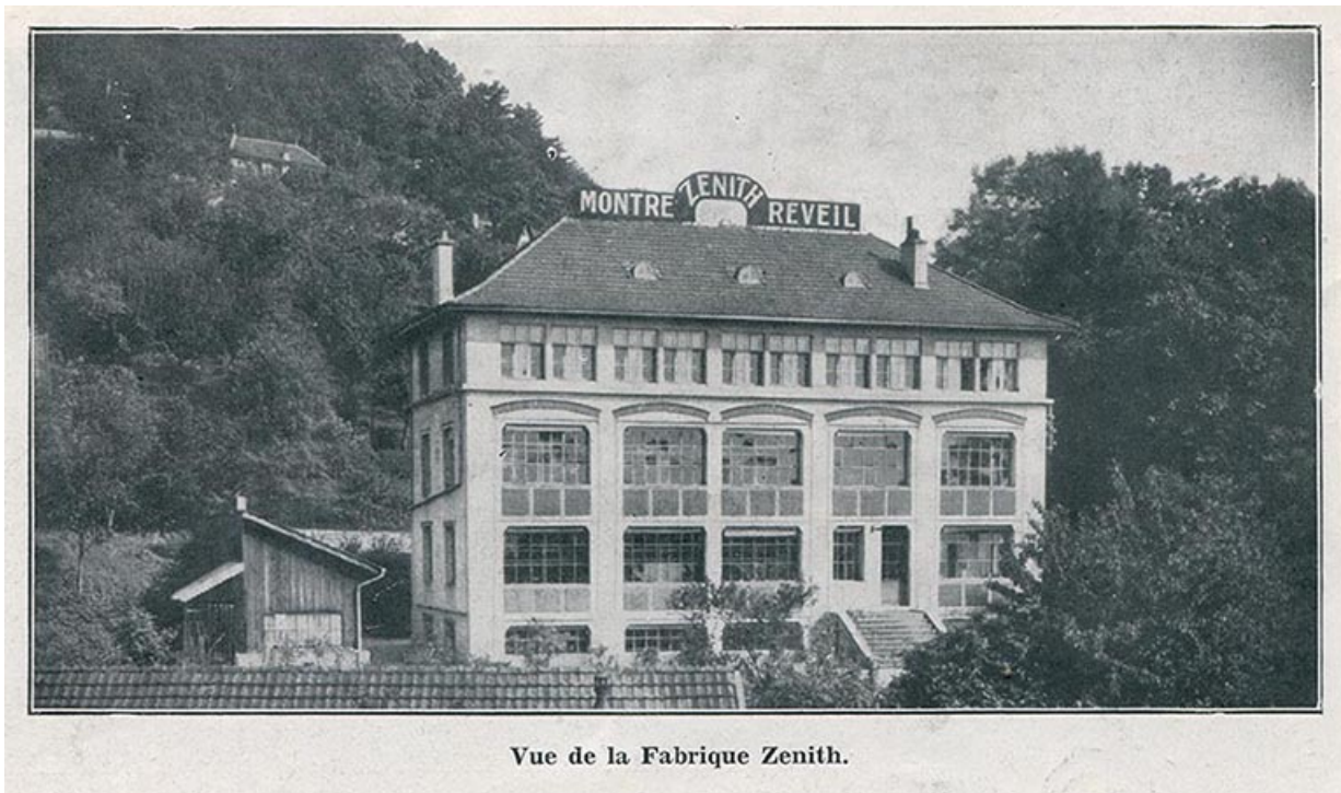
Vue de la fabrique Zenith, 1933. Bâtiment détruit et remplacé par celui de Frances Ebauches ? 25, Besançon