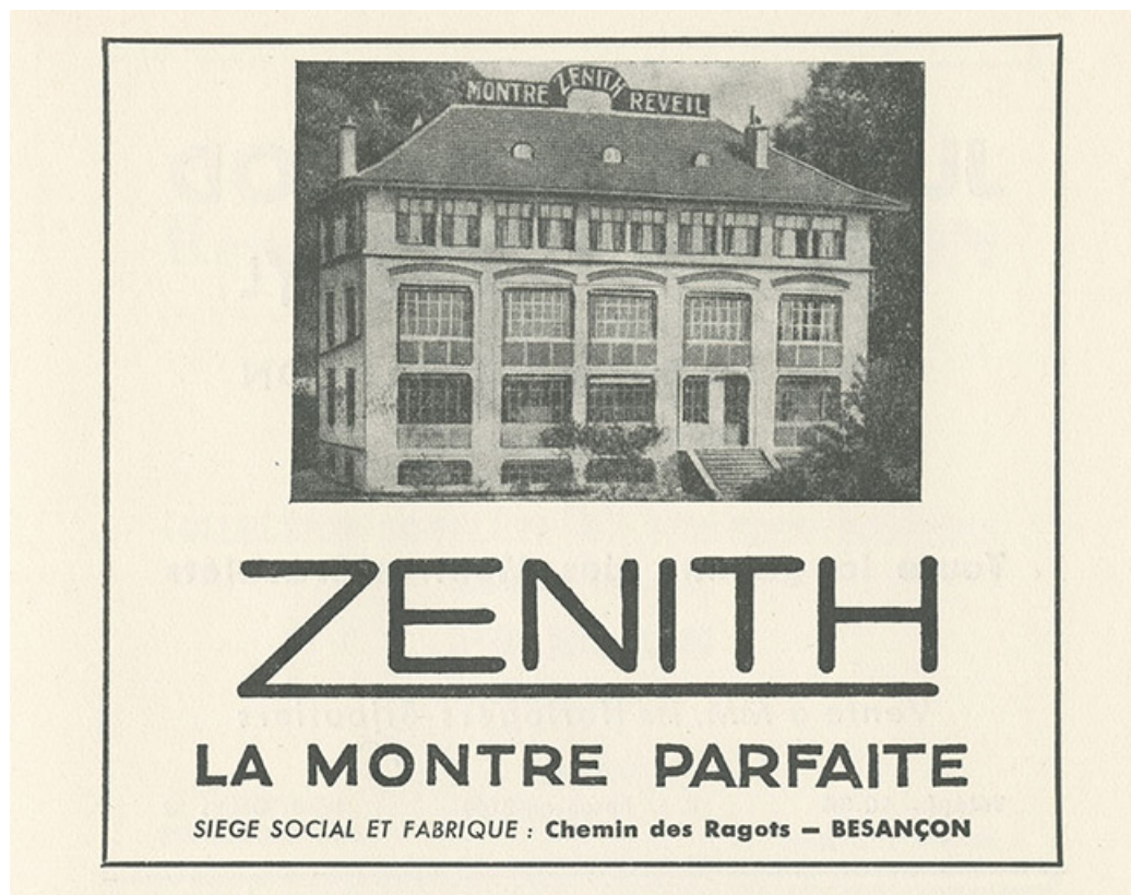
Zenith. La montre parfaite, publicité, 1951.