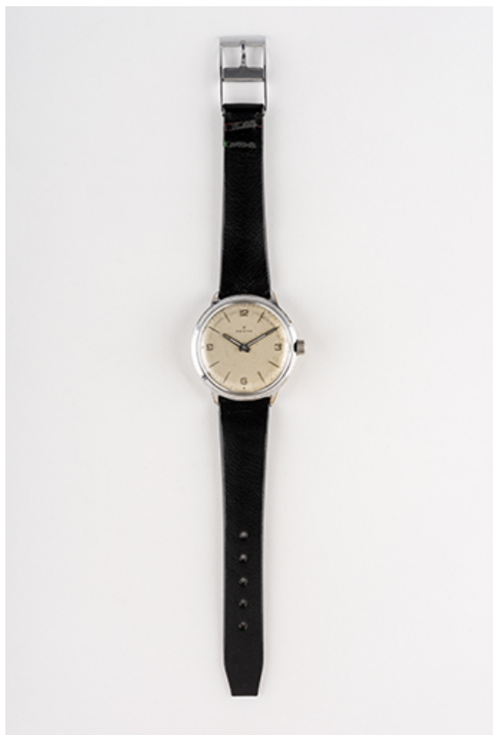
Montre Zénith, 2e quart 20e siècle. (Fonds Horloger de Battant). 25, Besançon chemin des Ragots