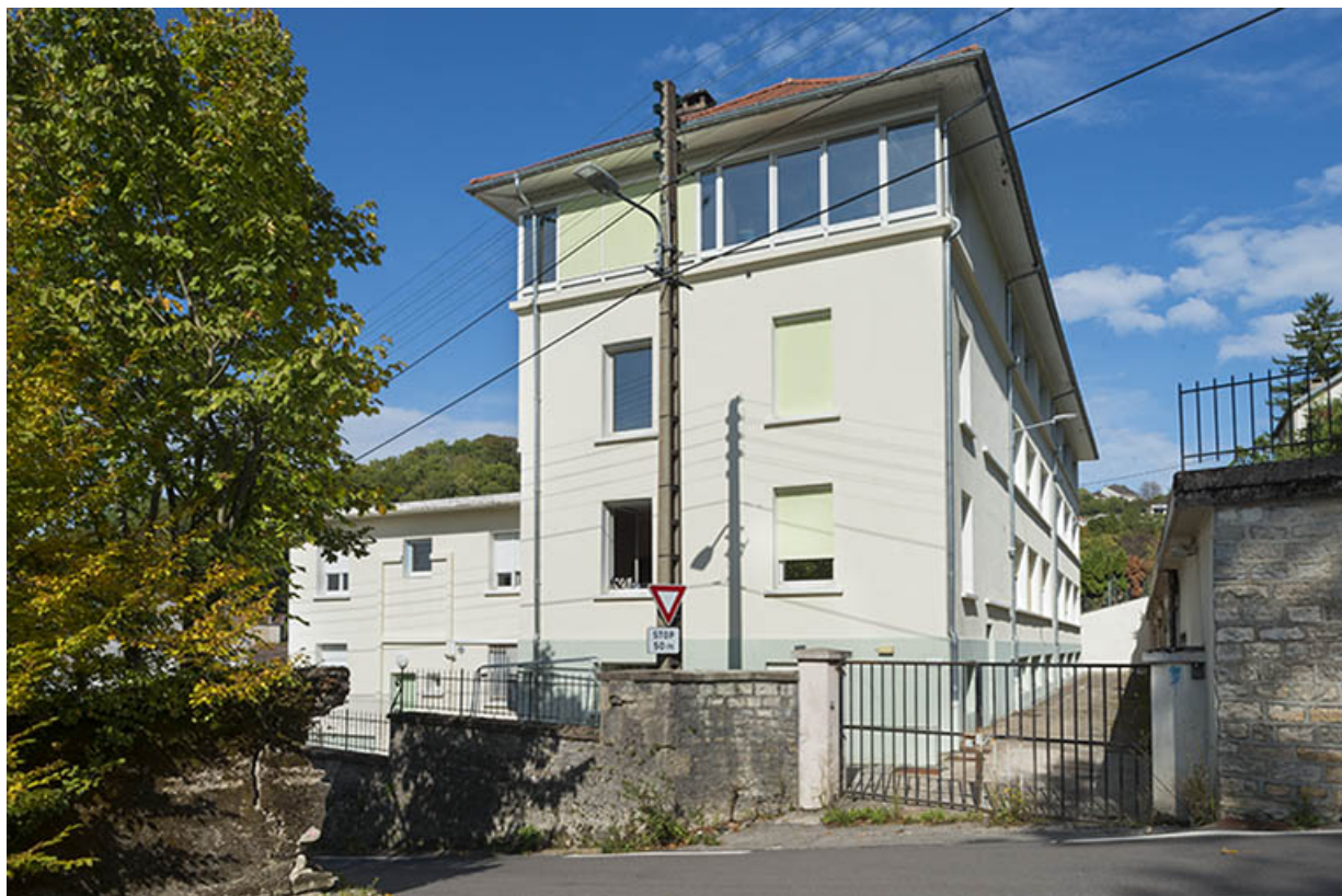
Pignon ouest et façade postérieure. 25, Besançon chemin des Ragots