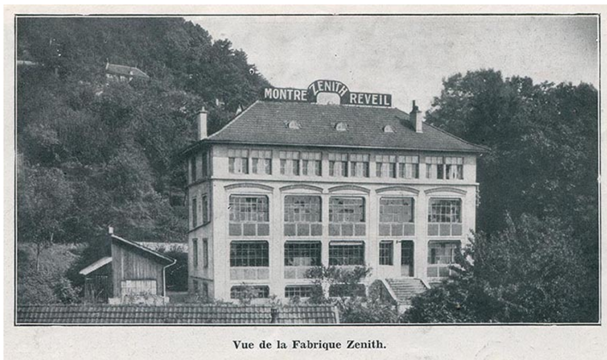
Vue de la fabrique Zenith, 1933. Bâtiment détruit et remplacé par celui de Frances Ebauches ? 25, Besançon