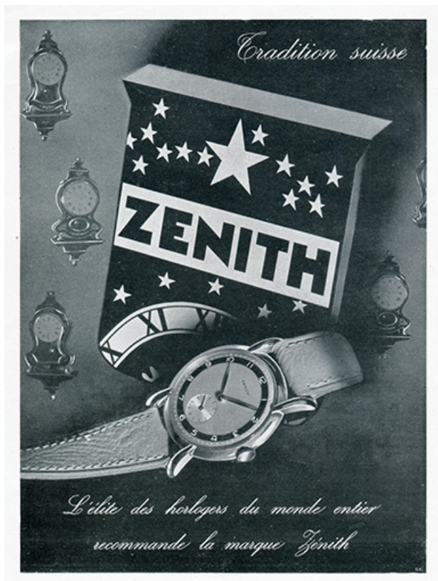
Montres Zénith, publicité, 1947. 25, Besançon chemin des Ragots