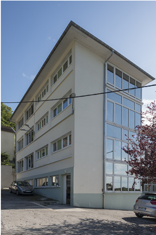
Extension de l'atelier depuis le nord.