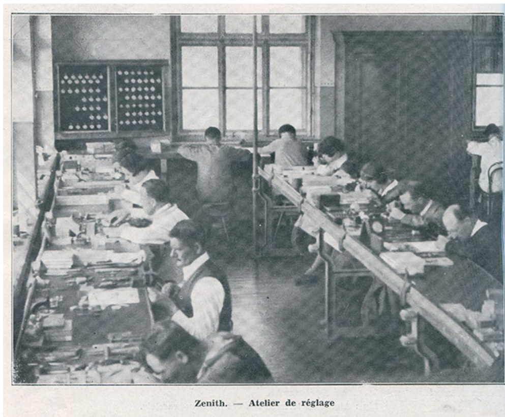
Zenith. - Atelier de réglage, 1933. Bâtiment détruit et remplacé par celui de Frances Ebauches ? 25, Besançon chemin des Ragots