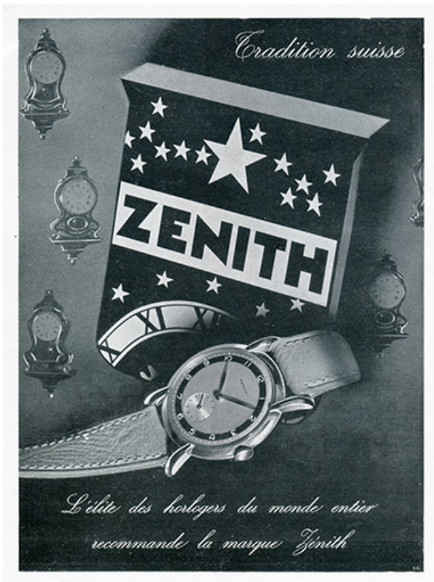
Montres Zénith, publicité, 1947. 25, Besançon chemin des Ragots