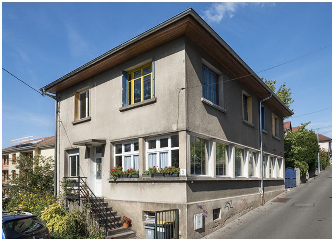
Vue de trois quarts gauche.