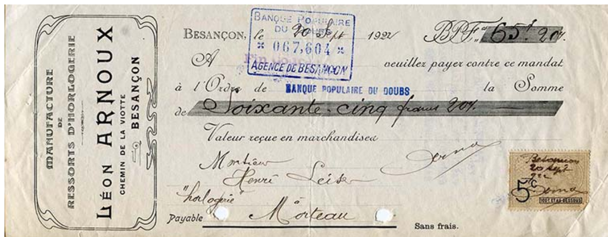
Mandat de la Manufacture de ressorts d'horlogerie Léon Arnoux, à Besançon, 20 septembre 1922.