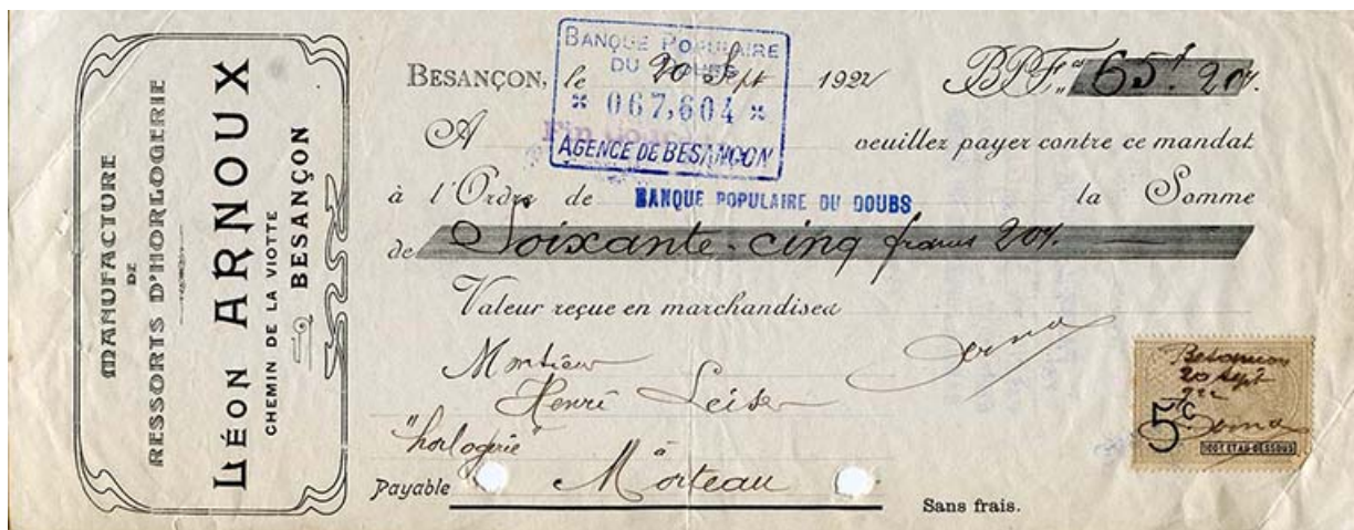
Mandat de la Manufacture de ressorts d'horlogerie Léon Arnoux, à Besançon, 20 septembre 1922.