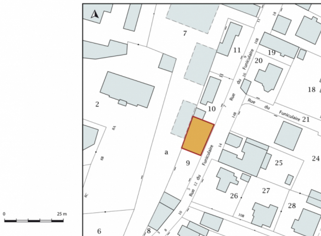
Plan-masse et de situation. Extrait du plan cadastral, 2019.