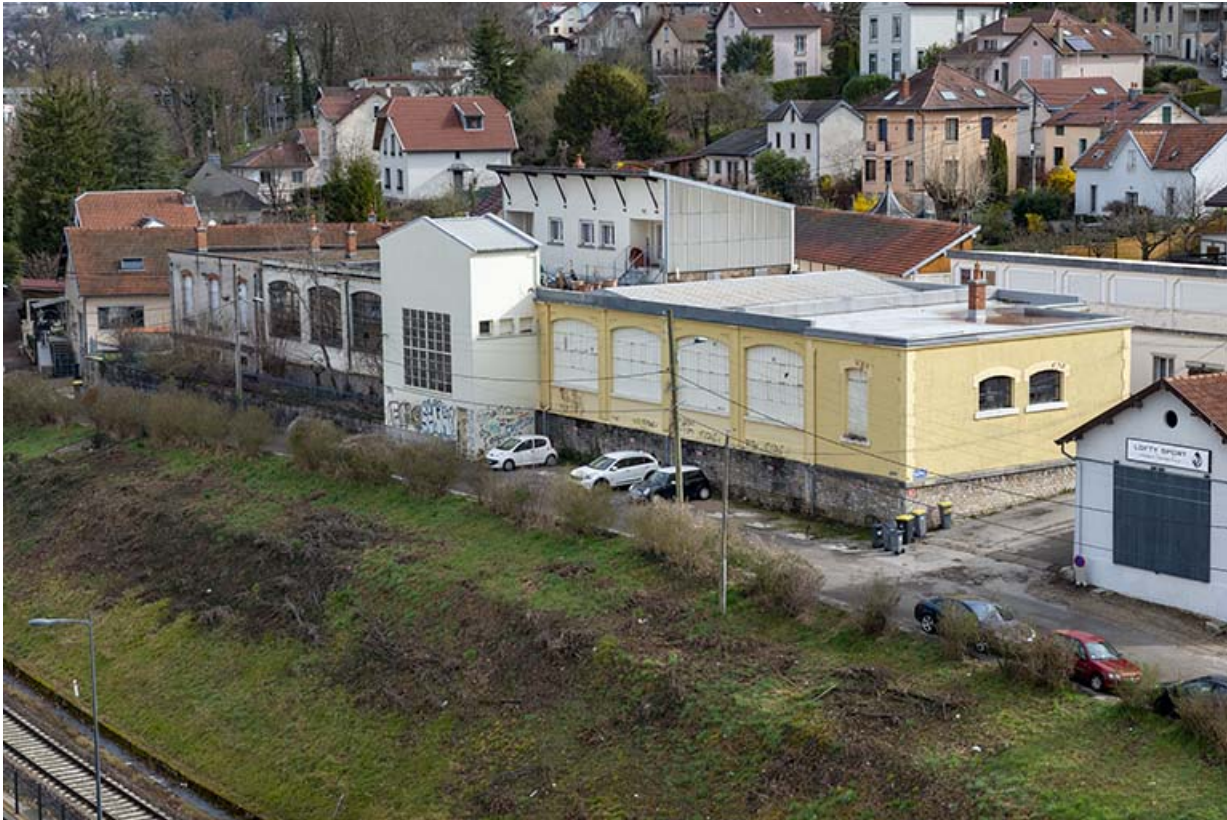
Vue plongeante depuis le sud -ouest.