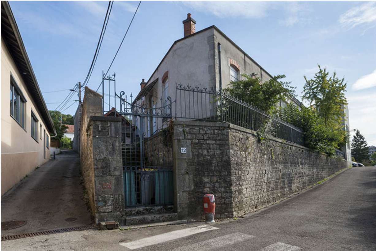
Bâtiment situé à l'angle des rues de l'Avenir et du baron Daclin.