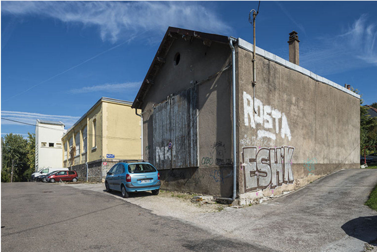
Façade ouest des ateliers.