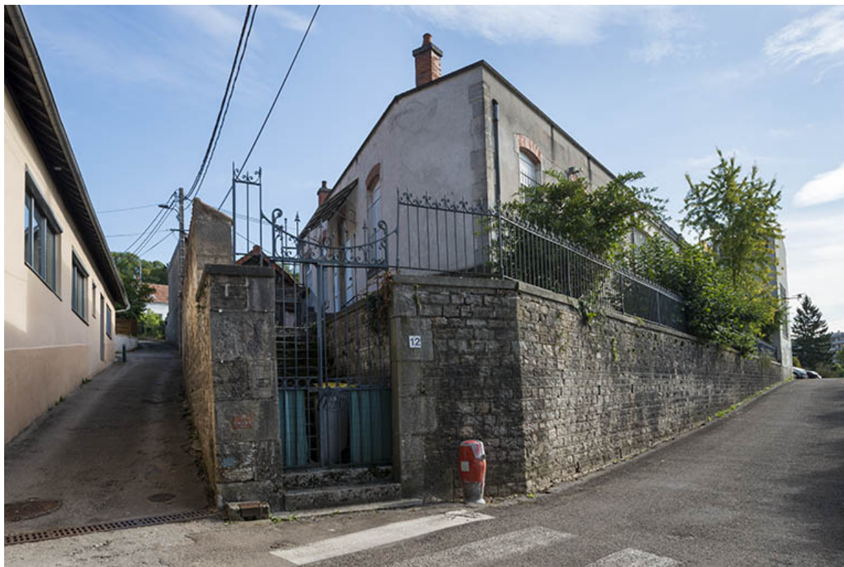
Bâtiment situé à l'angle des rues de l'Avenir et du baron Daclin.