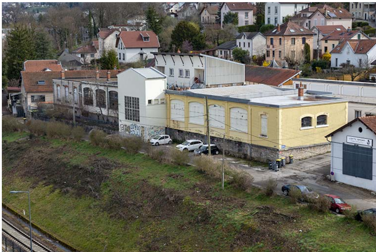
Vue plongeante depuis le sud -ouest.