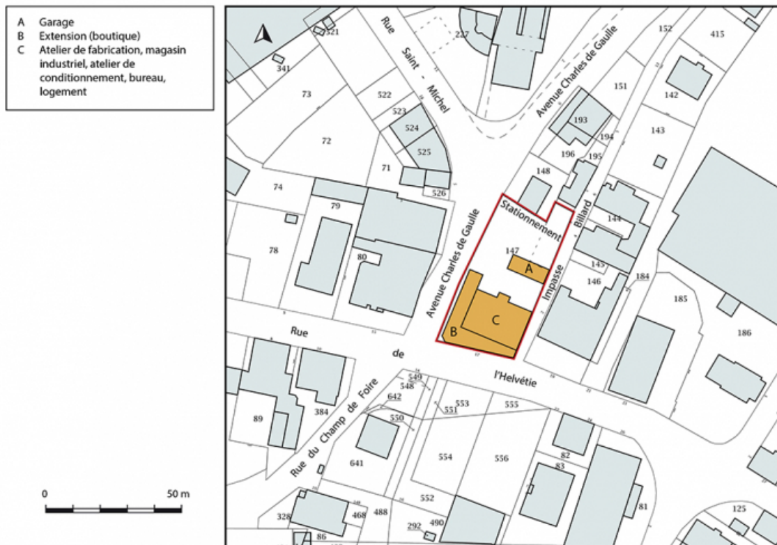
Plan-masse et de situation. Extrait du plan cadastral, 2017, section AF, 1/1 000. 25, Morteau, 17 rue de l' Helvétie