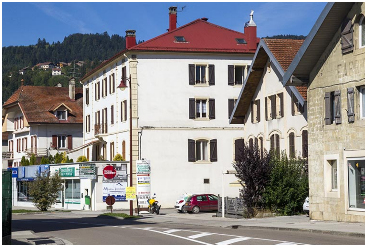
Vue d'ensemble, depuis l'est (façades antérieure et latérale droite). 25, Morteau, 17 rue de l' Helvétie