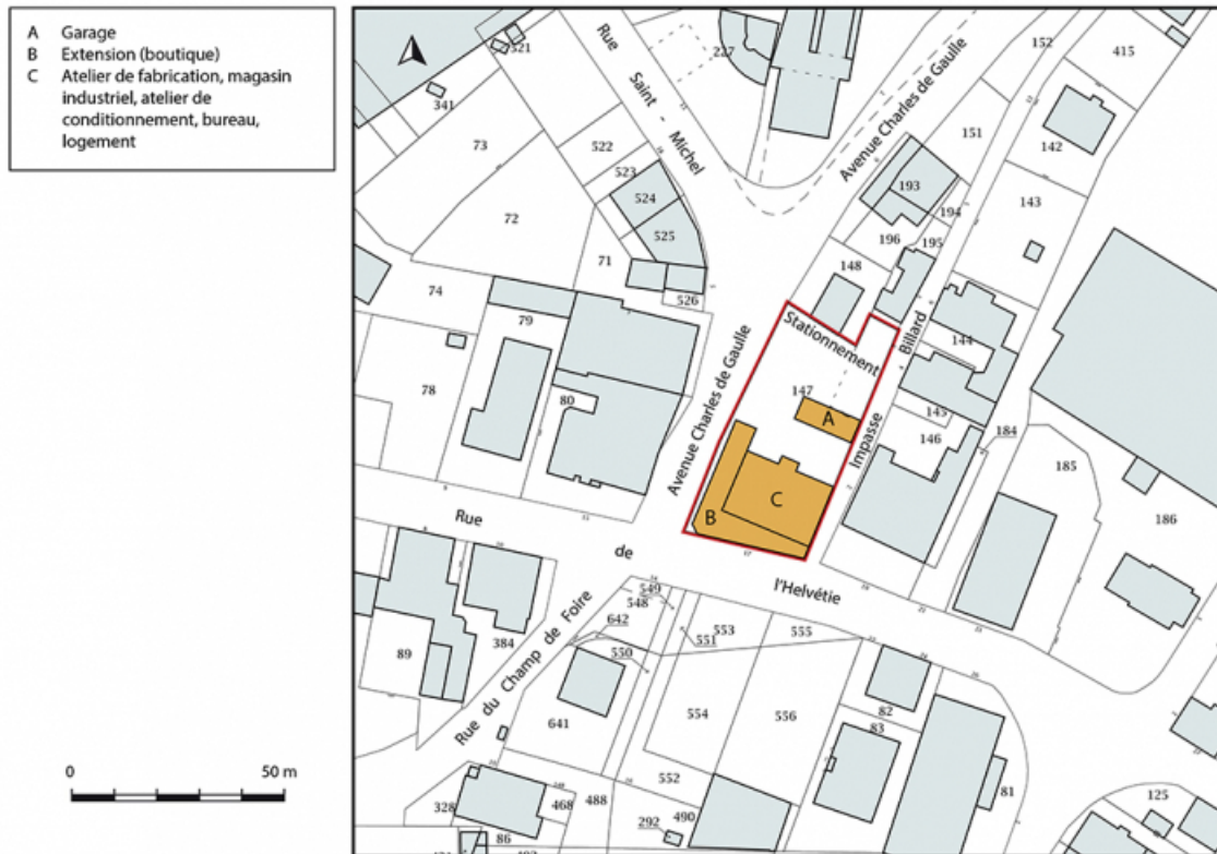
Plan-masse et de situation. Extrait du plan cadastral, 2017, section AF, 1/1 000. 25, Morteau, 17 rue de l' Helvétie