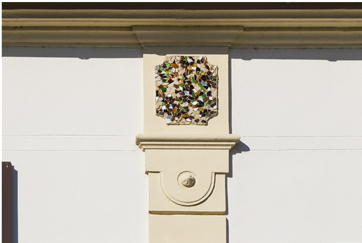
Décor de mosaïque au dernier étage de la façade antérieure.