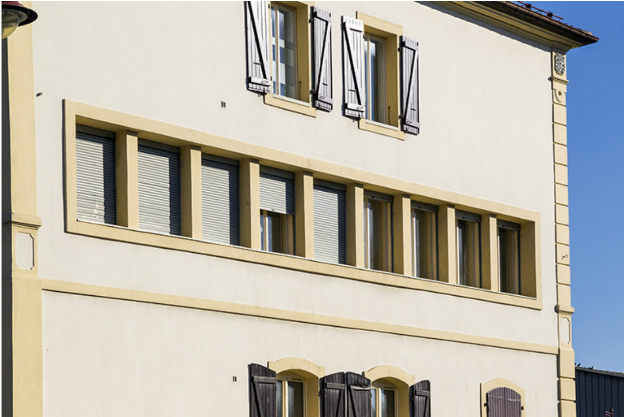
Fenêtres multiples sur la façade latérale gauche.