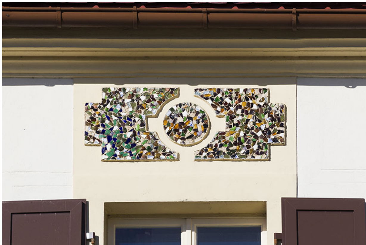
Dessus-de-fenêtre en mosaïque au dernier étage de la façade antérieure. 25, Morteau, 17 rue de l' Helvétie