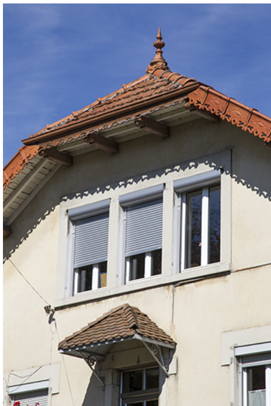
Façade latérale gauche : fenêtre multiple signalant l'atelier. 25, Morteau, 29 rue de la Louhière