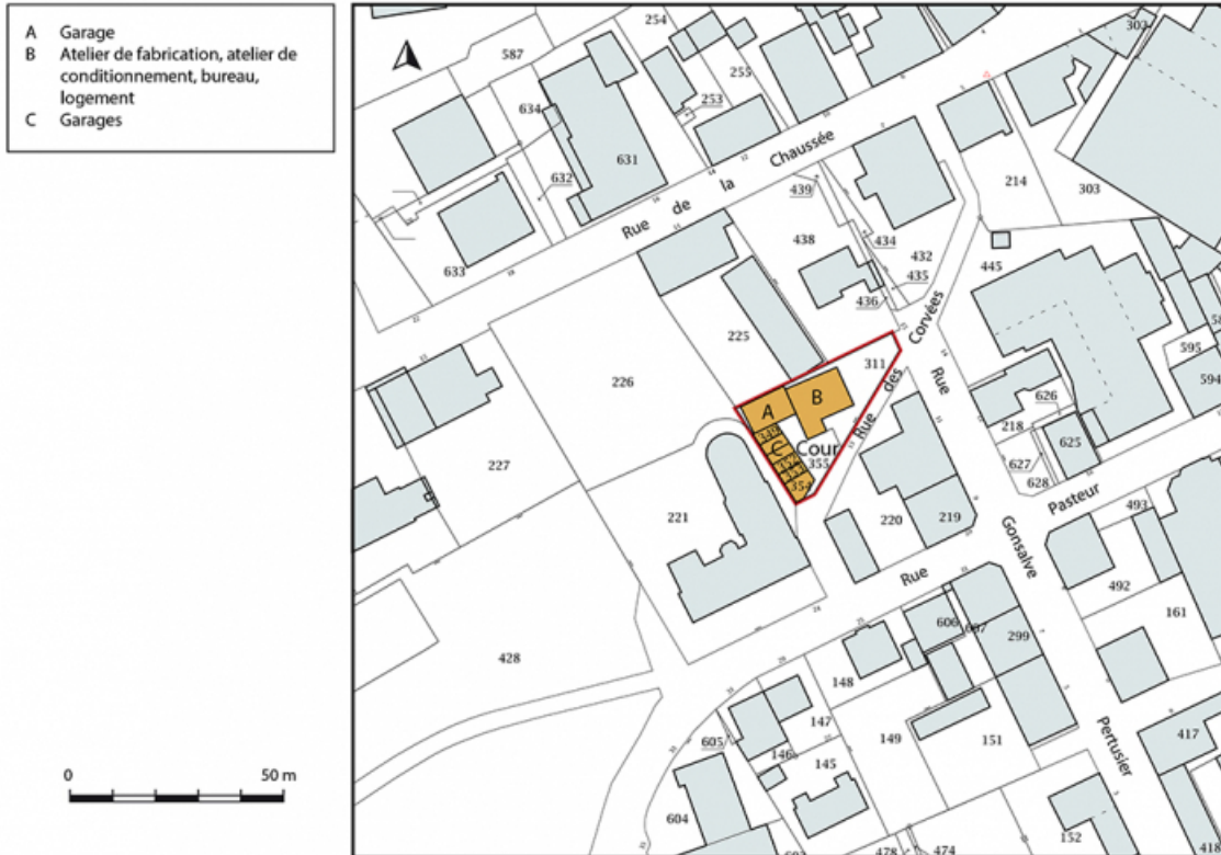
Plan-masse et de situation. Extrait du plan cadastral, 2017, section AA, 1/1 000. 25, Morteau, 13 rue des Corvées