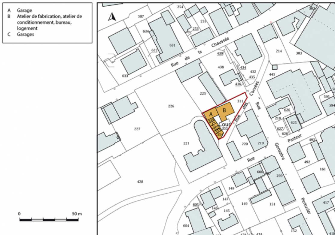
Plan-masse et de situation. Extrait du plan cadastral, 2017, section AA, 1/1 000.