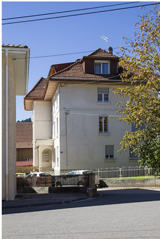
Vue d'ensemble, depuis l'est.