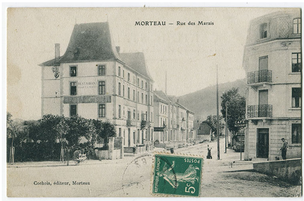
Morteau - Rue des Marais [la rue René Payot vue de l'est], limite 19e siècle 20e siècle [avant 1905]. 25, Morteau, 11-13 rue René Payot