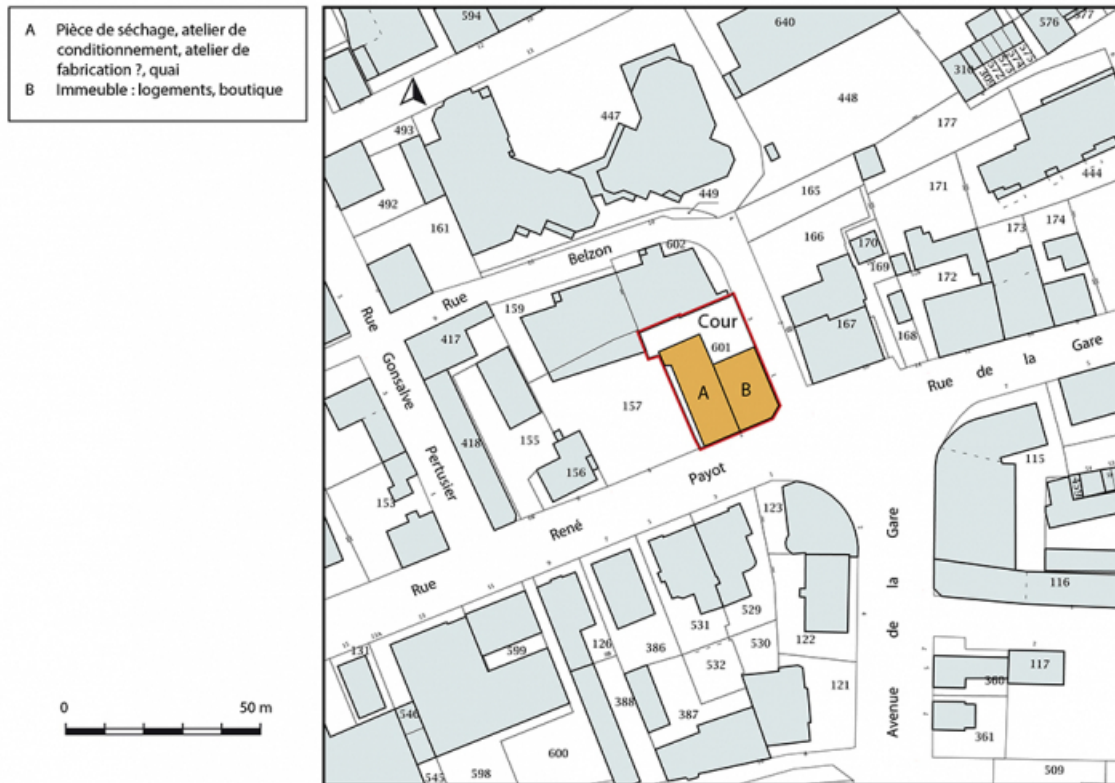
Plan-masse et de situation. Extrait du plan cadastral, 2017, section AA, 1/1 000. 25, Morteau, 2 rue René Payot