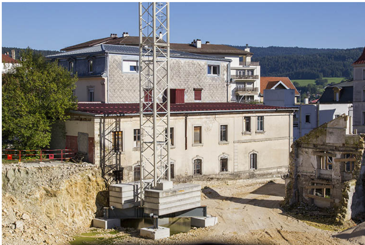
Façades latérale gauche et postérieure.