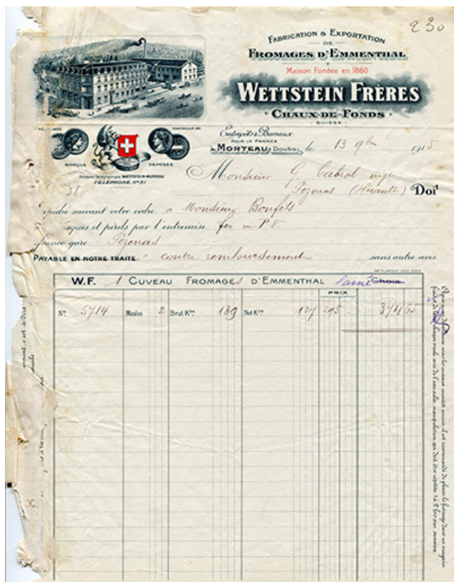
Papier à en-tête de la société Wettstein Frères, 13 novembre 1915. 25, Morteau, 2 rue René Payot