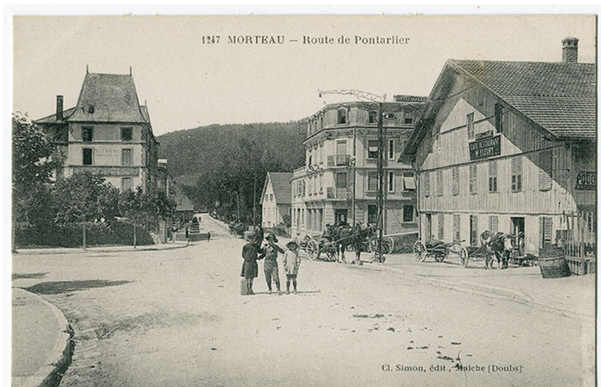
1247 Morteau - Route de Pontarlier [la rue René Payot et le carrefour de l'avenue de la Gare, vus de l'est], 1er quart 20e siècle. 25, Morteau, 2 rue René Payot