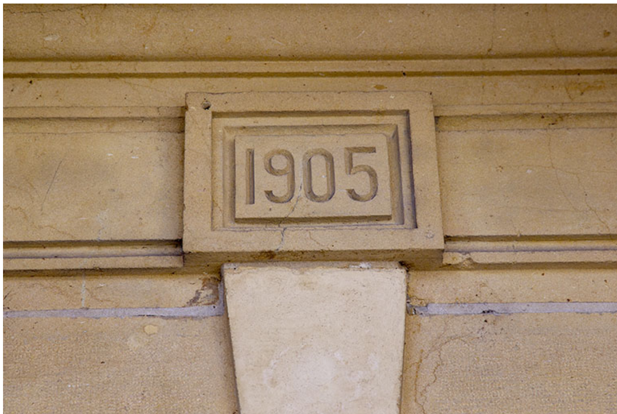
Façade antérieure : date 1905 portée sur le pan coupé.