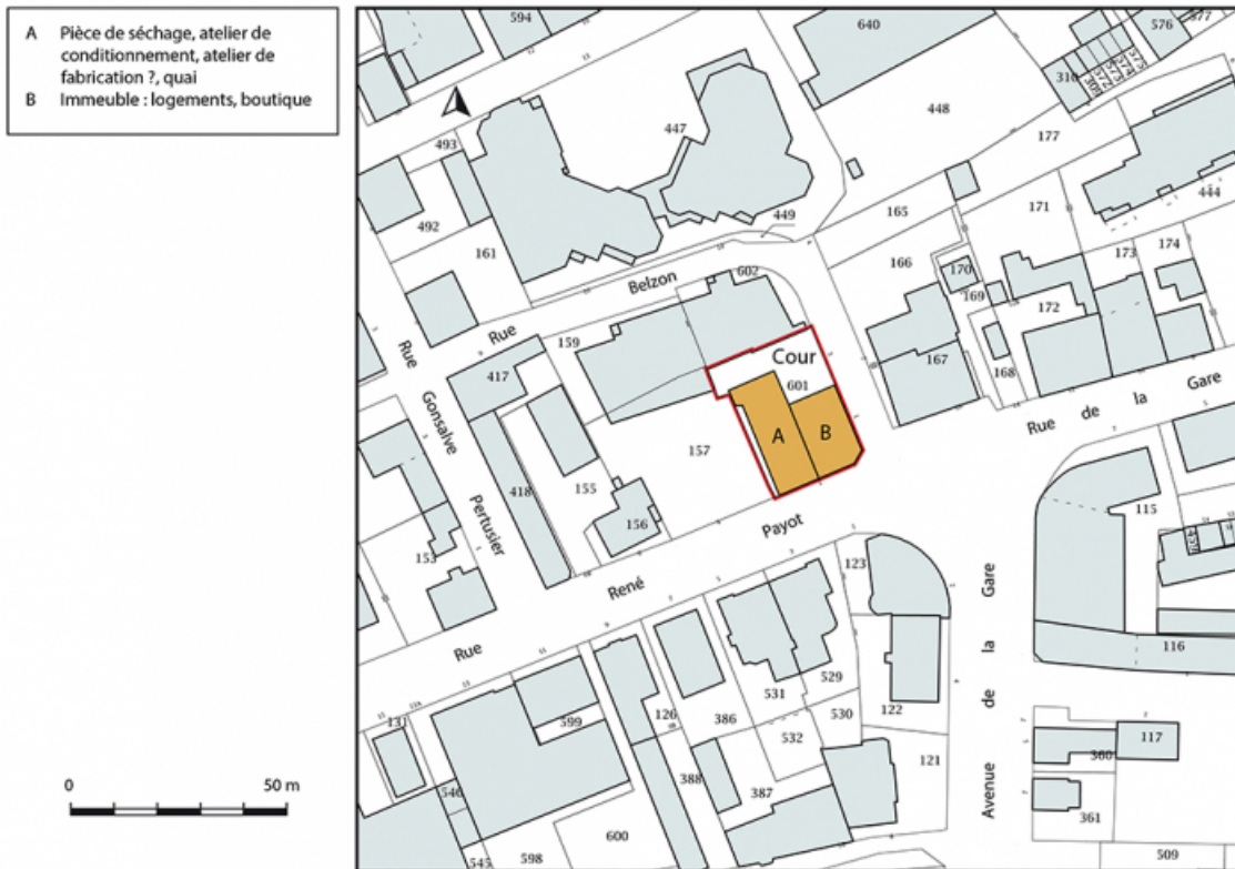
Plan-masse et de situation. Extrait du plan cadastral, 2017, section AA, 1/1 000. 25, Morteau, 2 rue René Payot