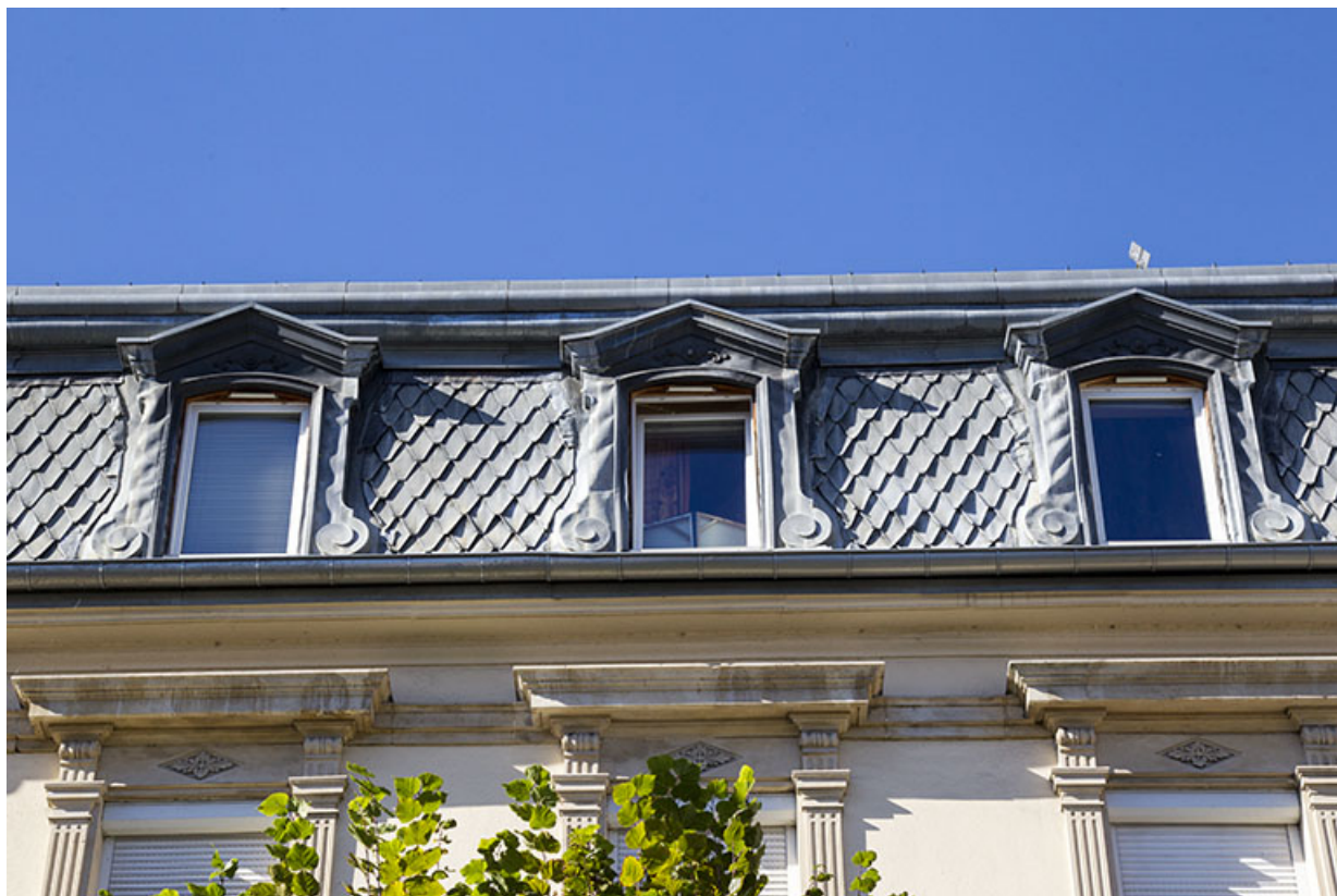
Façade antérieure : baies du brisis.