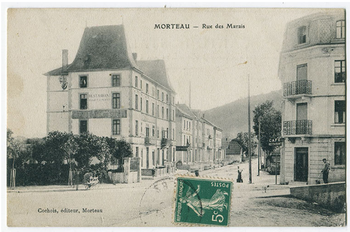
Morteau - Rue des Marais [la rue René Payot vue de l'est], limite 19e siècle 20e siècle [avant 1905]. 25, Morteau, 11-13 rue René Payot