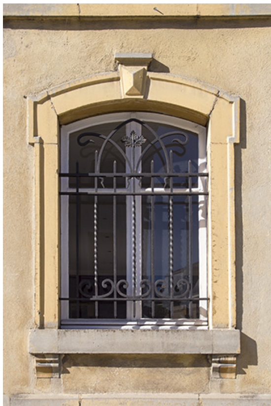
Fenêtre du corps de bâtiment occidental.