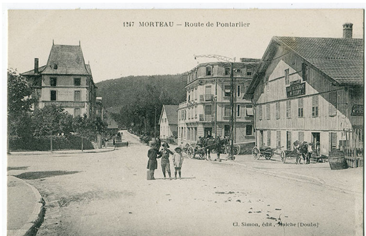
1247 Morteau - Route de Pontarlier [la rue René Payot et le carrefour de l'avenue de la Gare, vus de l'est], 1er quart 20e siècle. 25, Morteau, 2 rue René Payot