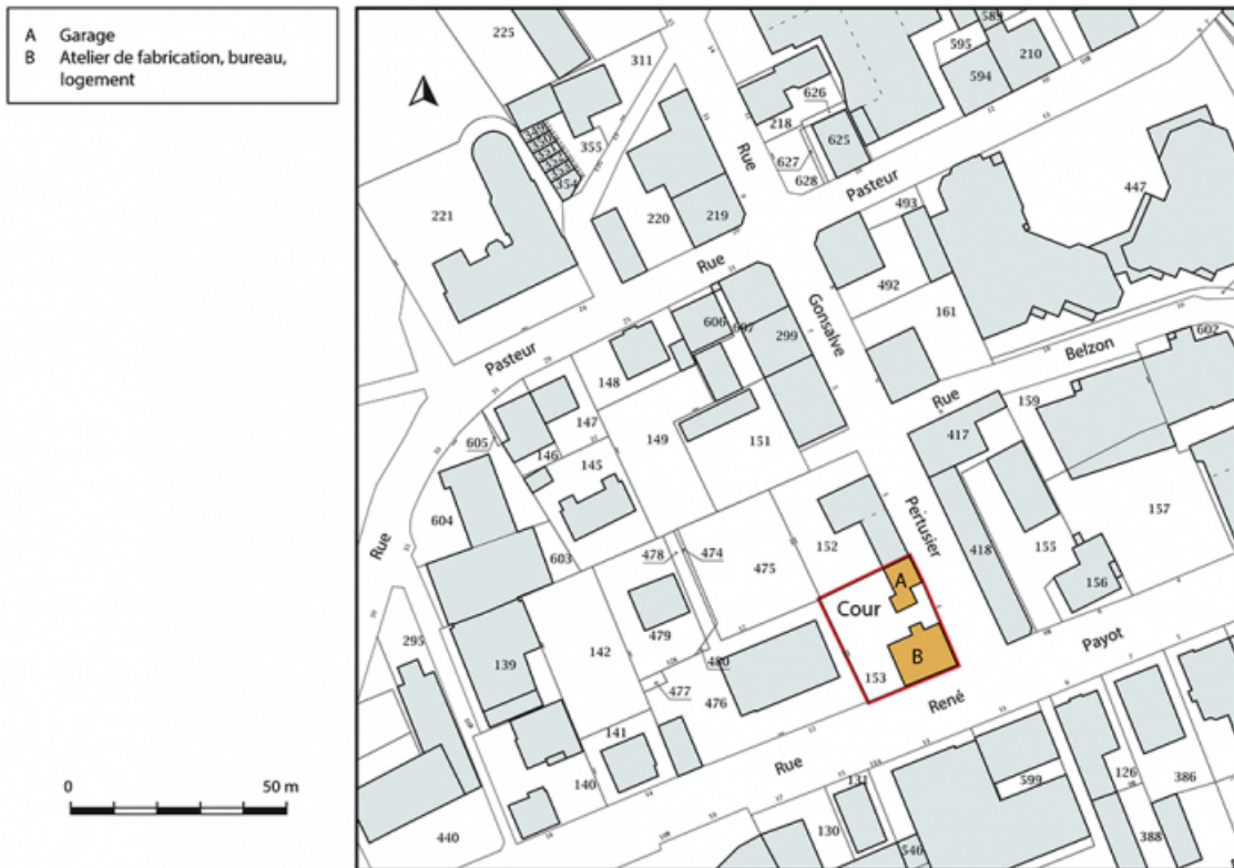
Plan-masse et de situation. Extrait du plan cadastral, 2017, section AA, 1/1 000. 25, Morteau, 1 rue Gonsalve Pertusier