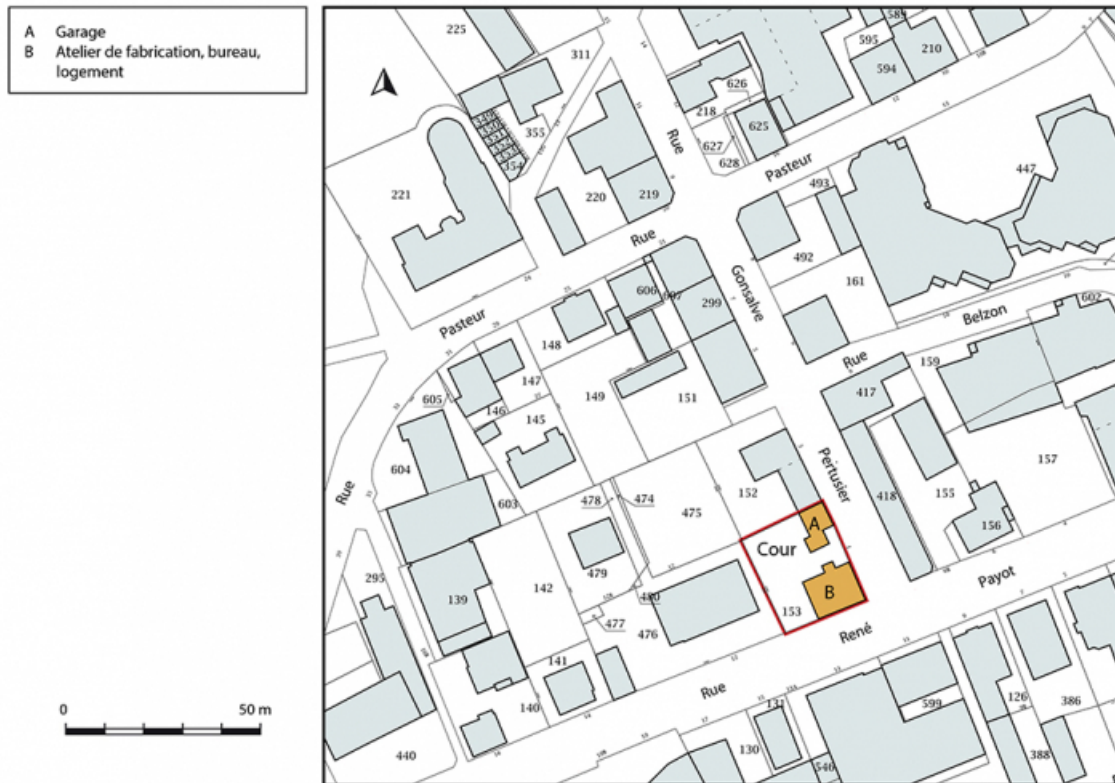
Plan-masse et de situation. Extrait du plan cadastral, 2017, section AA, 1/1 000. 25, Morteau, 1 rue Gonsalve Pertusier