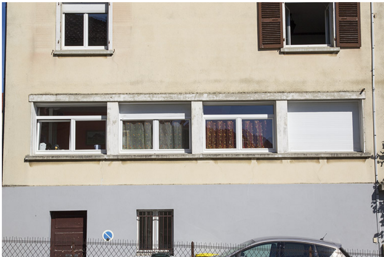
Façade latérale gauche : fenêtres d'atelier. 25, Morteau, 1 rue Gonsalve Pertusier