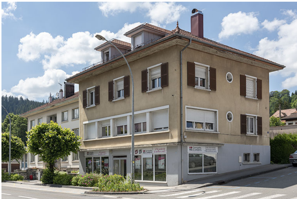
Façades antérieure et latérale droite. 25, Morteau