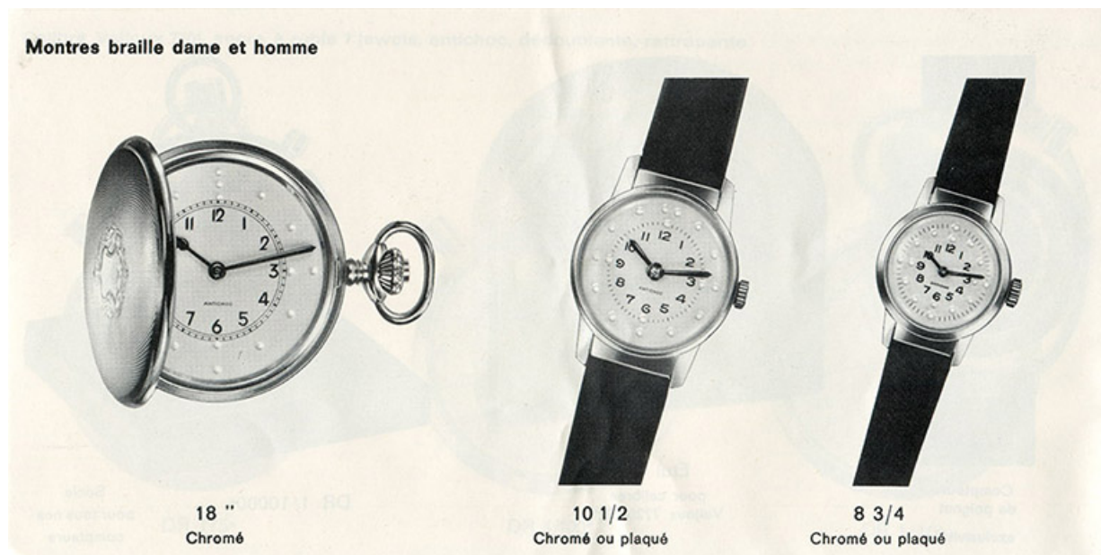
Fabrique d'horlogerie soignée Emile Bonnet et ses Fils S.A. [catalogue : montres braille], années 1950 ? 25, Morteau, 1 rue Gonsalve Pertusier