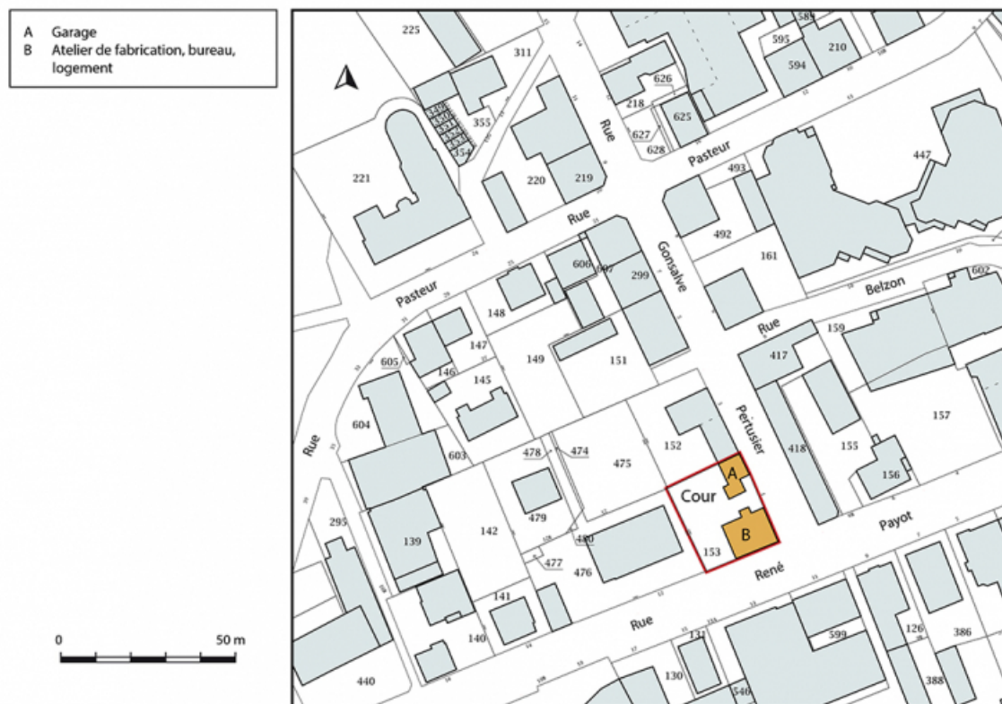
Plan-masse et de situation. Extrait du plan cadastral, 2017, section AA, 1/1 000. 25, Morteau, 1 rue Gonsalve Pertusier