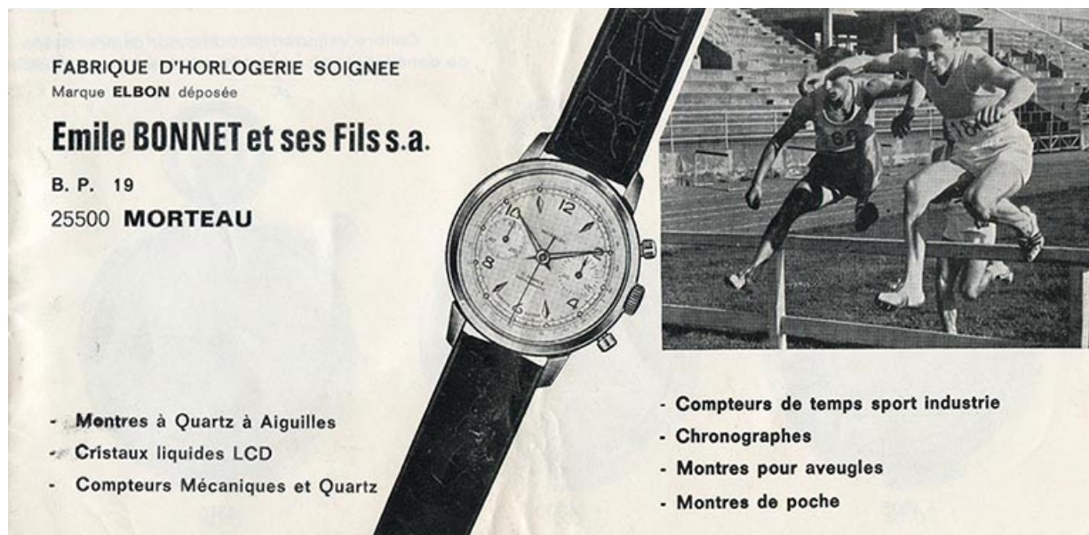
Fabrique d'horlogerie soignée Emile Bonnet et ses Fils S.A. [catalogue : 1ère de couverture], années 1950 ? 25, Morteau, 1 rue Gonsalve Pertusier