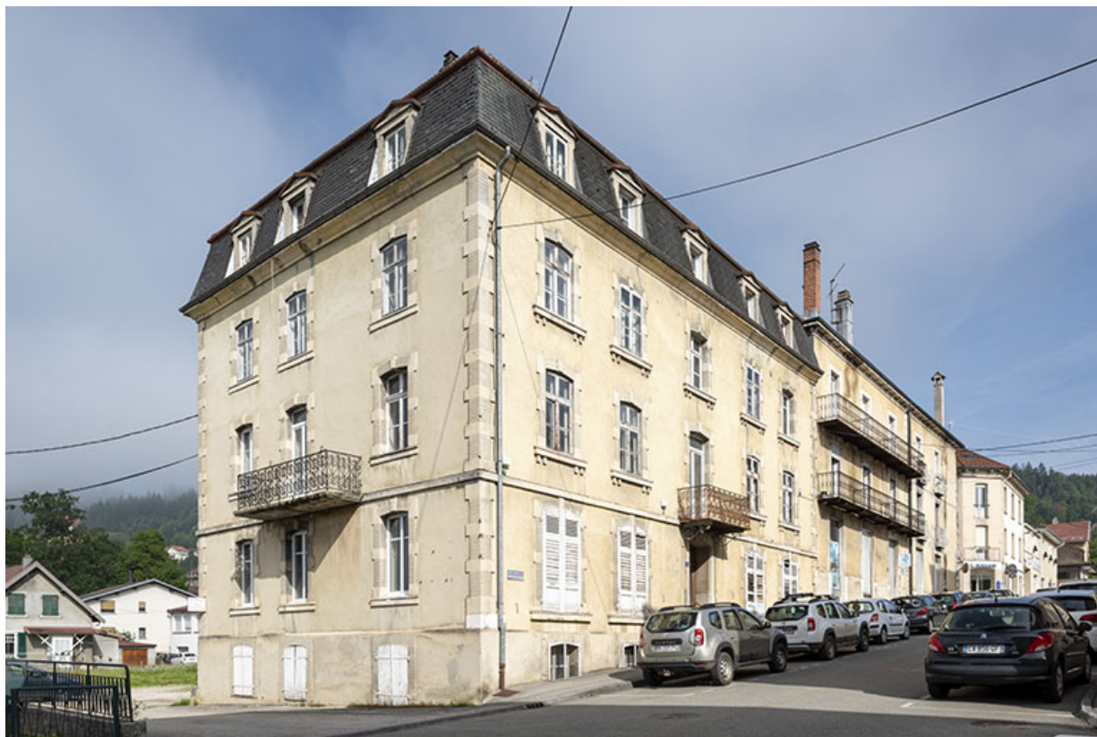
Façades antérieure et latérale gauche. 25, Morteau