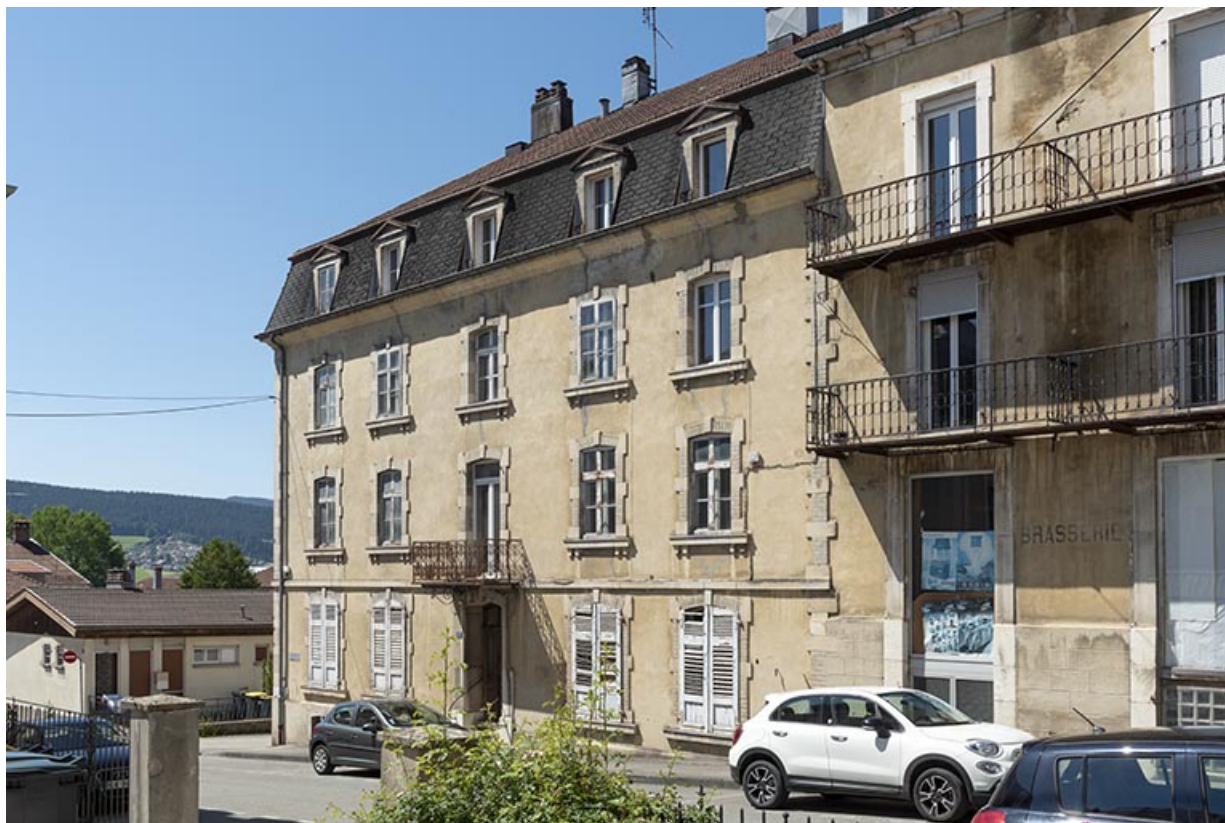
Façade antérieure, de trois quarts droite.