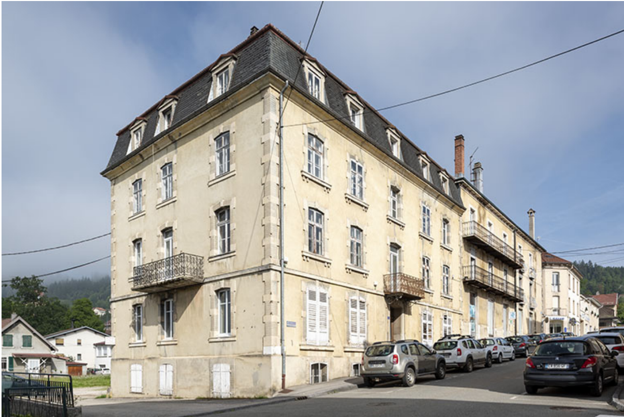
Façades antérieure et latérale gauche. 25, Morteau