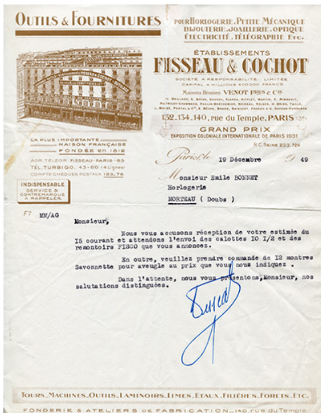
Papier à en-tête des Ets Fisseau & Cochot, 19 décembre 1949. 25, Morteau, 12 rue René Payot