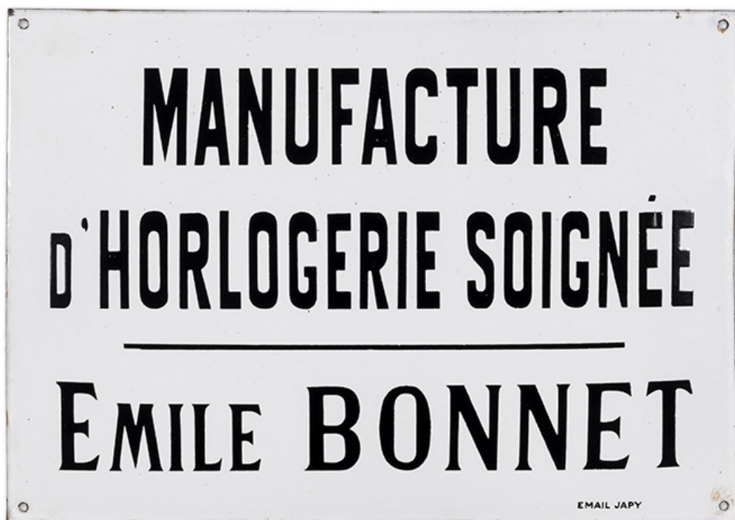
Plaque de l'atelier (collection particulière : Henri Bonnet, Fournet-Luisans). 25, Morteau, 5 rue Gonsalve Pertusier