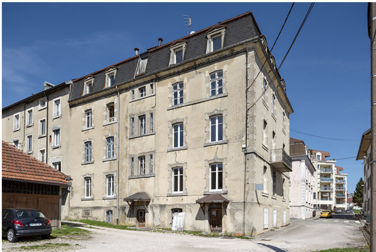
Façade postérieure, de trois quarts droite.