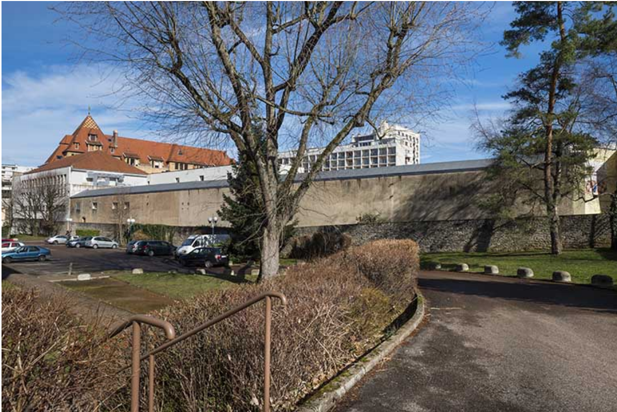
Vue d'ensemble depuis le sud.