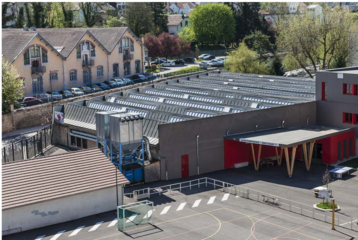
Vue plongeante sur les sheds de l'usine automobile.