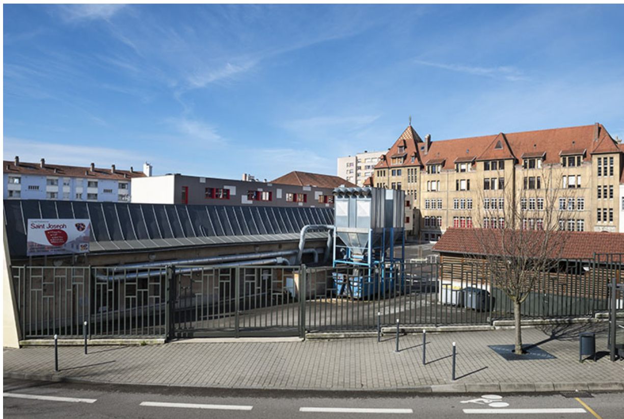
Vue d'ensemble depuis l'est.