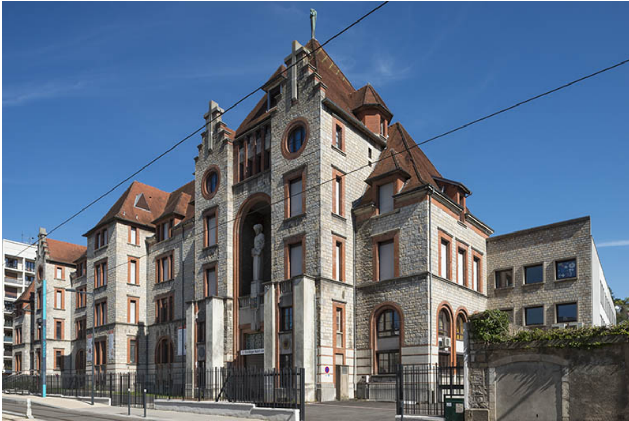
Façade antérieure du lycée. Vue de trois quarts droite.