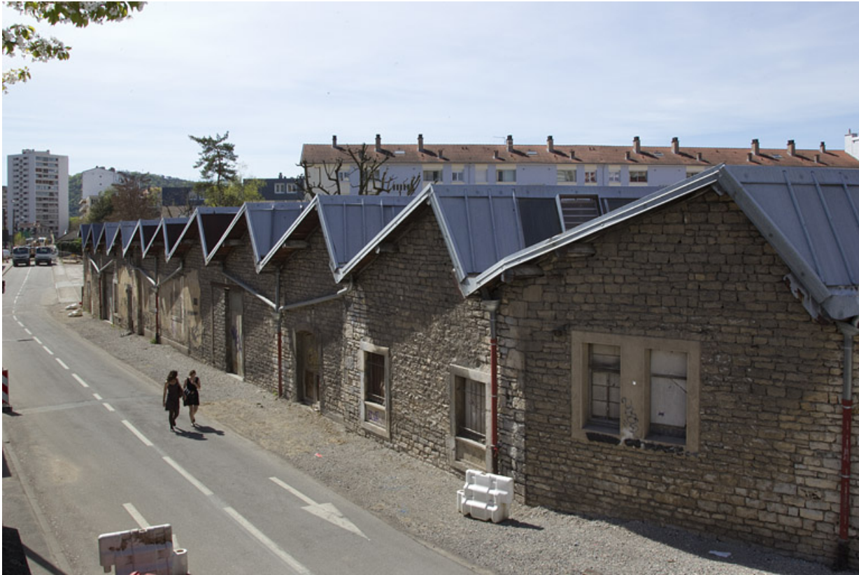
Atelier de fabrication boulevard Diderot : façade sur le boulevard, depuis le nord.