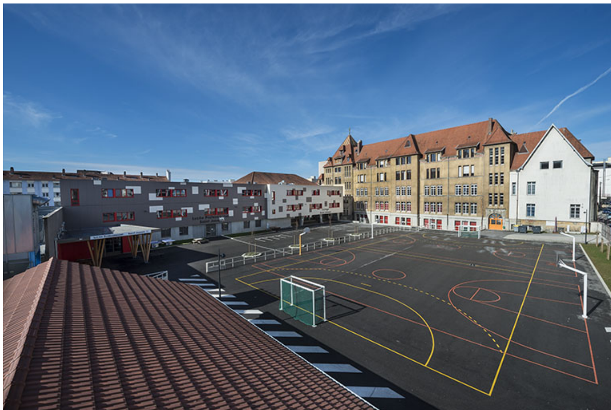
Vue d'ensemble des bâtiments du lycée depuis l'est.