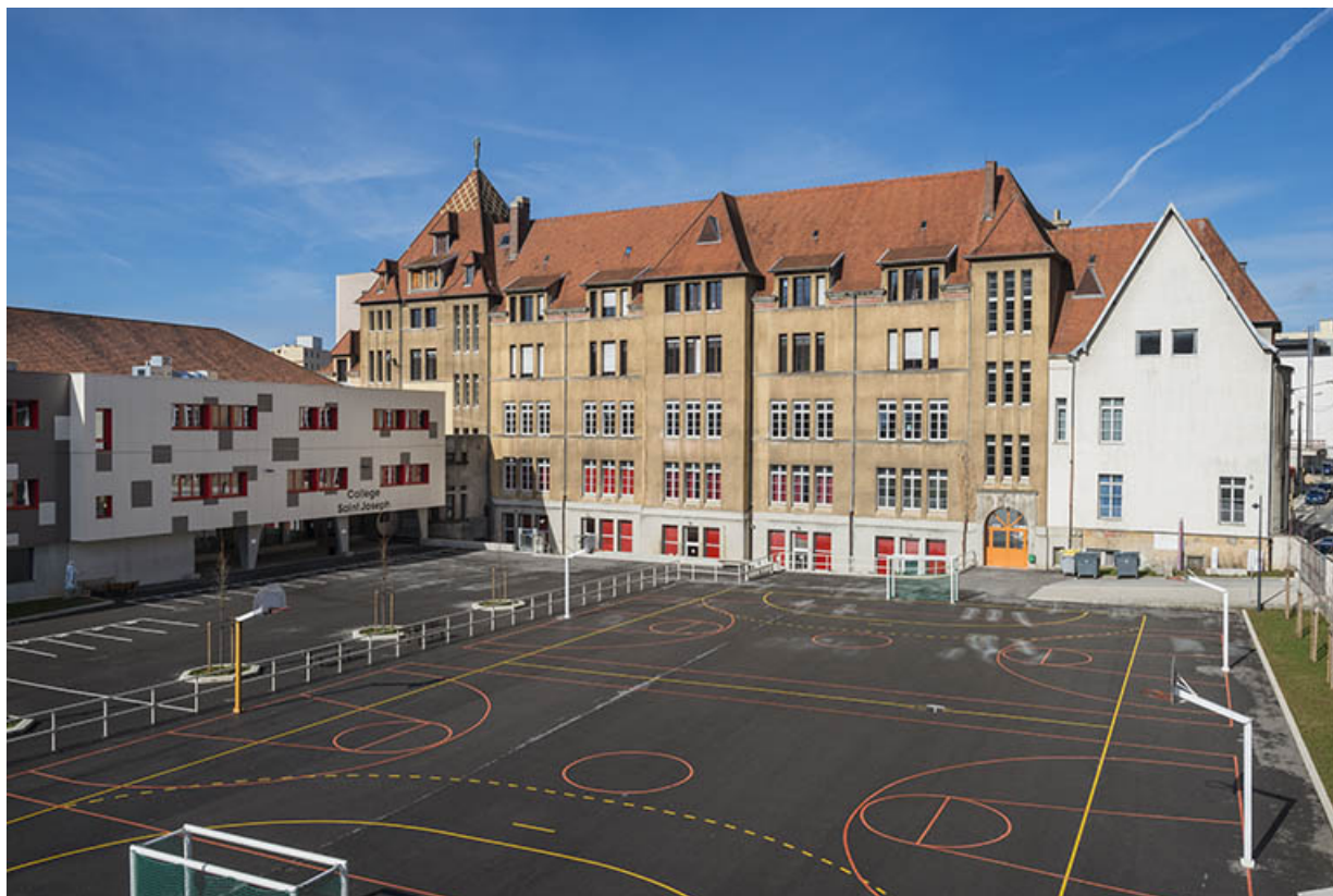
Façade postérieure du lycée.