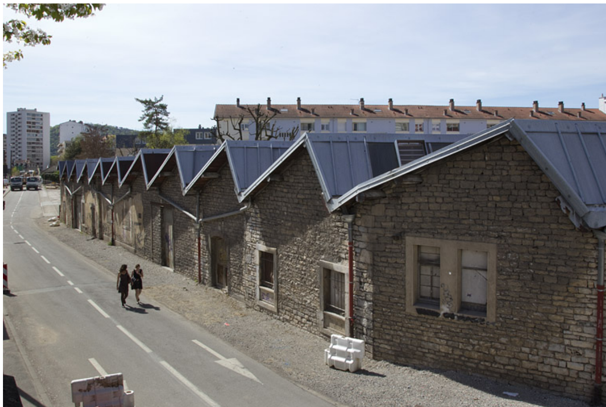
Atelier de fabrication boulevard Diderot : façade sur le boulevard, depuis le nord.