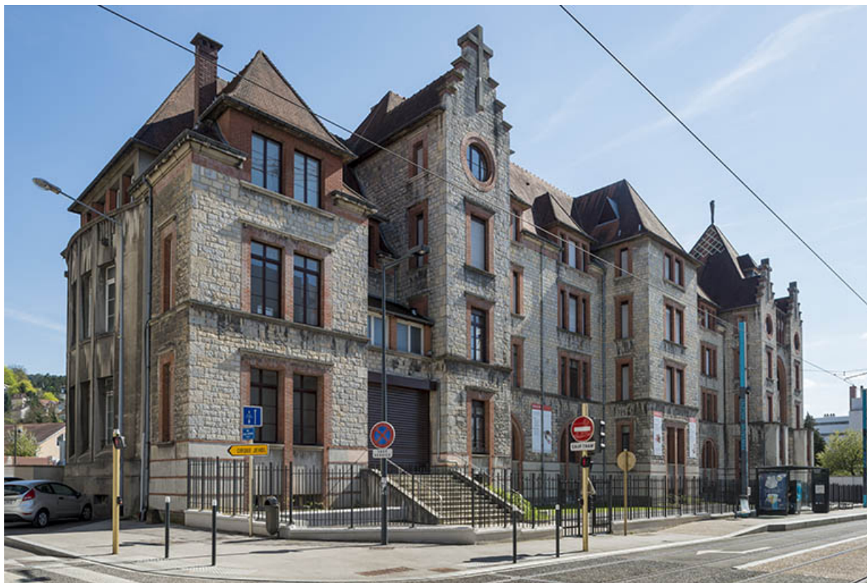
Façade antérieure du lycée. Vue de trois quarts gauche.