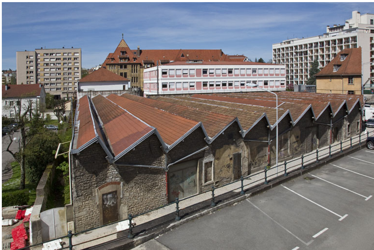
Atelier de fabrication boulevard Diderot : vue d'ensemble plongeante, depuis l'est.