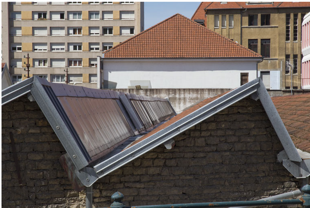
Atelier de fabrication boulevard Diderot : détail des sheds.