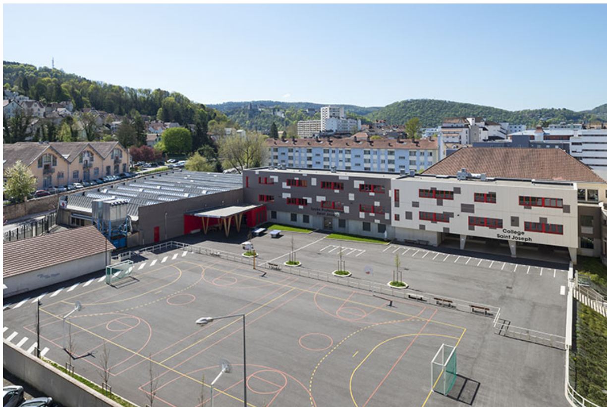
Cour et bâtiments est du lycée. A gauche, sheds de l'usine automobile.