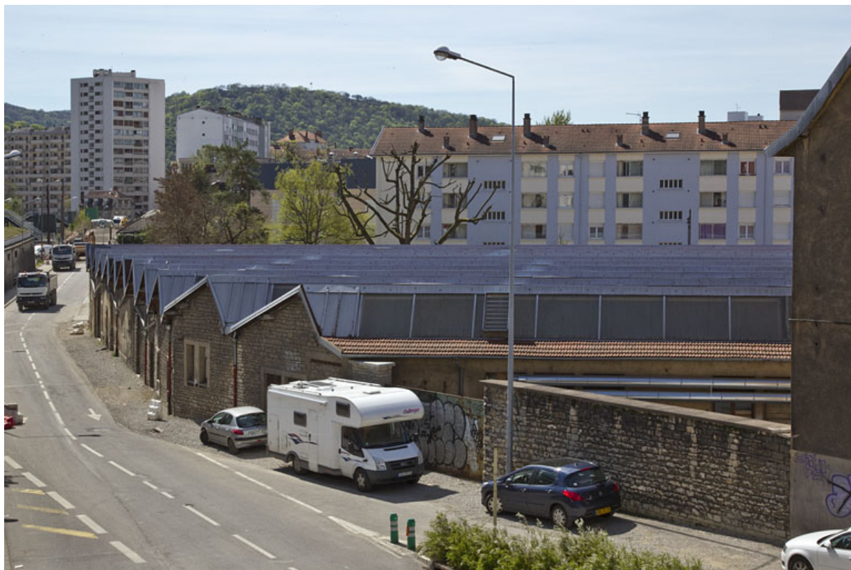
Atelier de fabrication boulevard Diderot : vue d'ensemble depuis le nord.