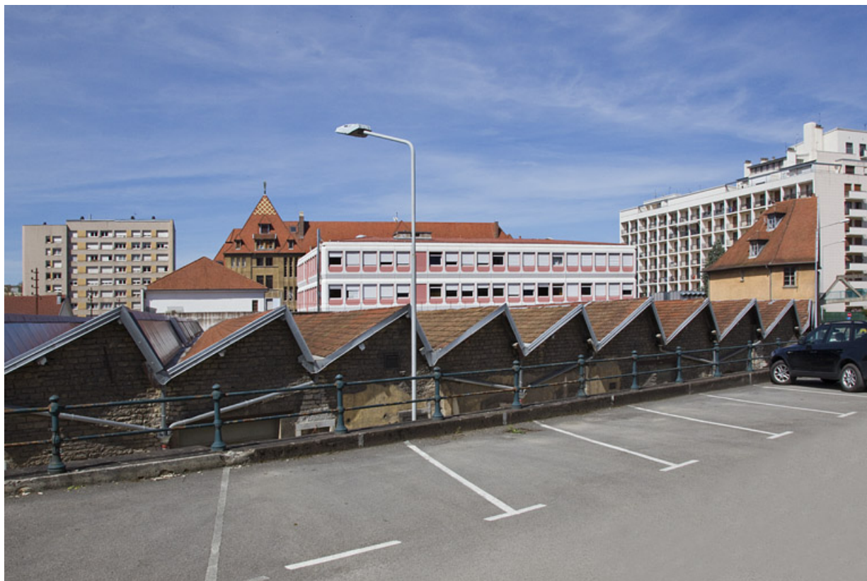
Atelier de fabrication boulevard Diderot : sheds, vus depuis l'est.