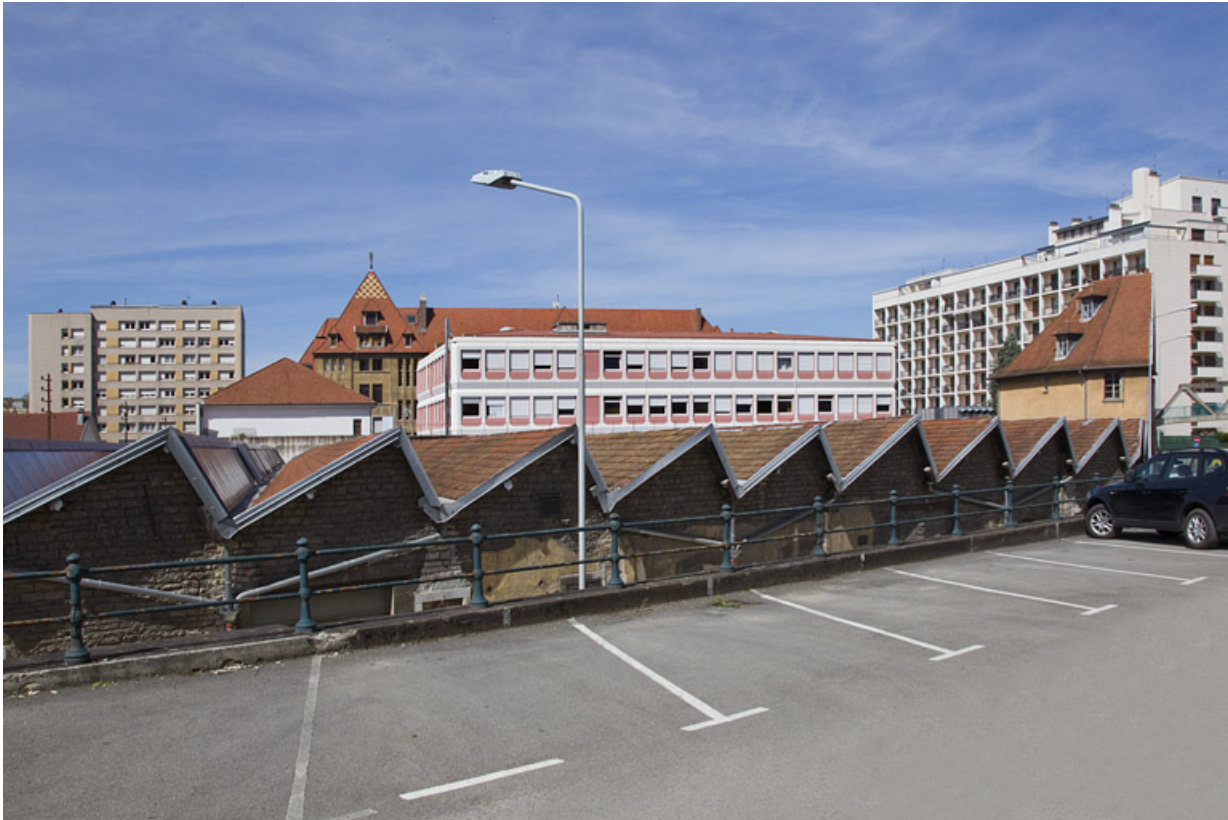
Atelier de fabrication boulevard Diderot : sheds, vus depuis l'est.