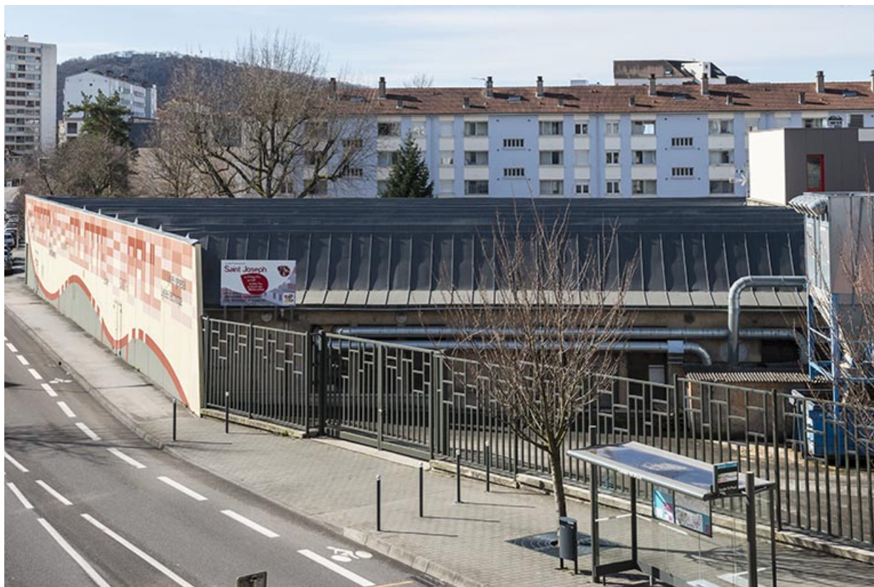
Atelier de l'usine automobile, depuis le nord.