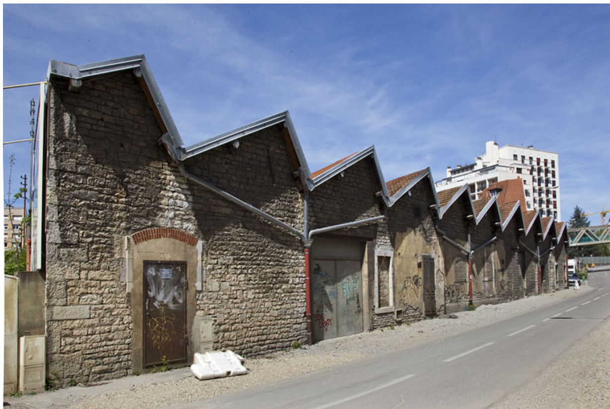
Atelier de fabrication boulevard Diderot : façade sur le boulevard, depuis le sud. 25, Besançon, 28 avenue Fontaine-Argent