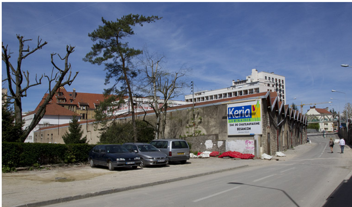
Atelier de fabrication boulevard Diderot : vue d'ensemble depuis le sud.