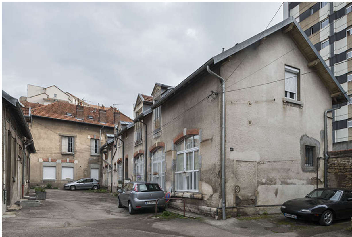
Atelier de fabrication. Vue de trois quarts, depuis la cour.