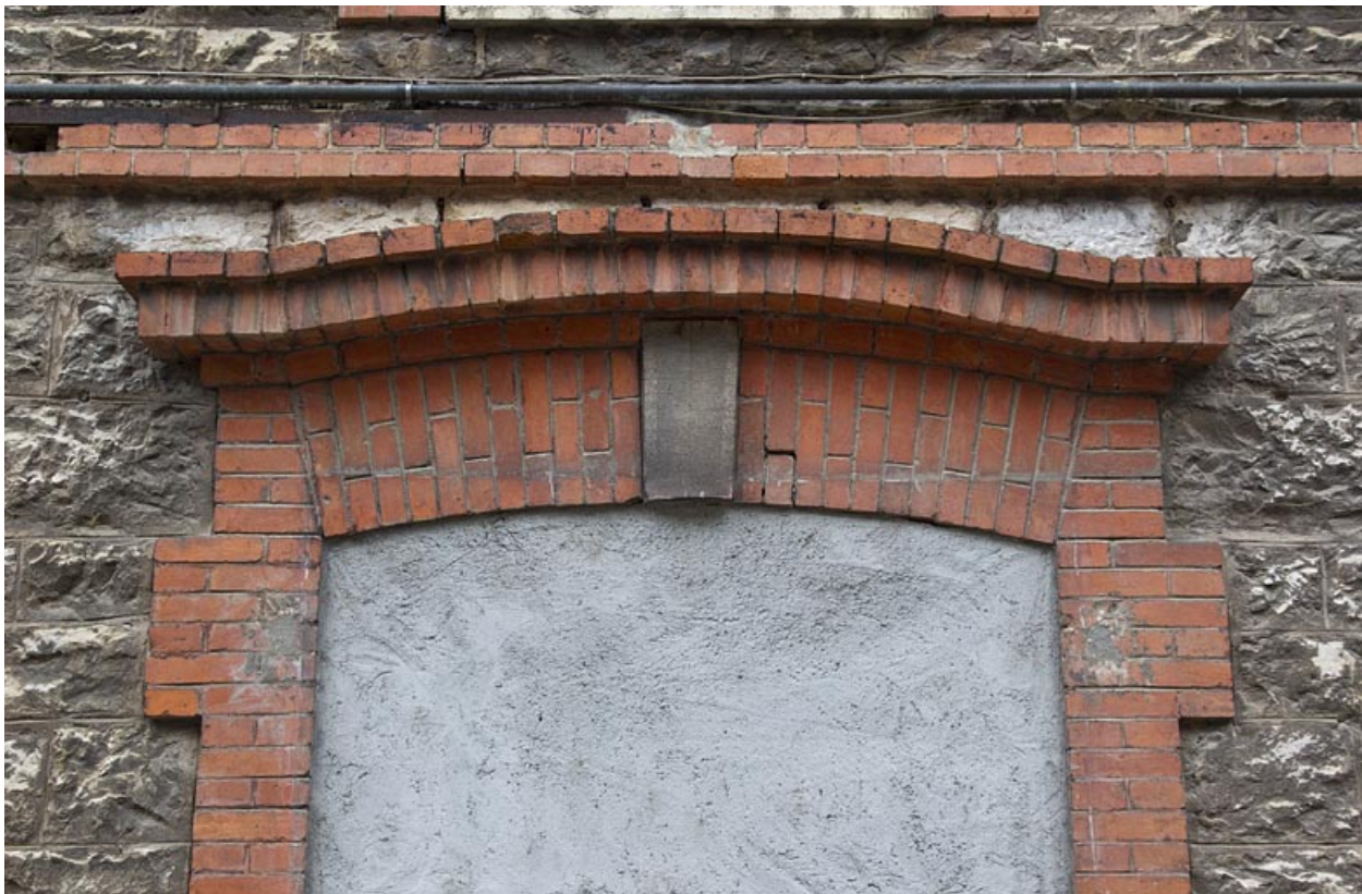
Atelier en pierre au n° 14B : arc en briques couvrant une porte murée de la façade latérale droite. 25, Besançon, 14 avenue Fontaine-Argent