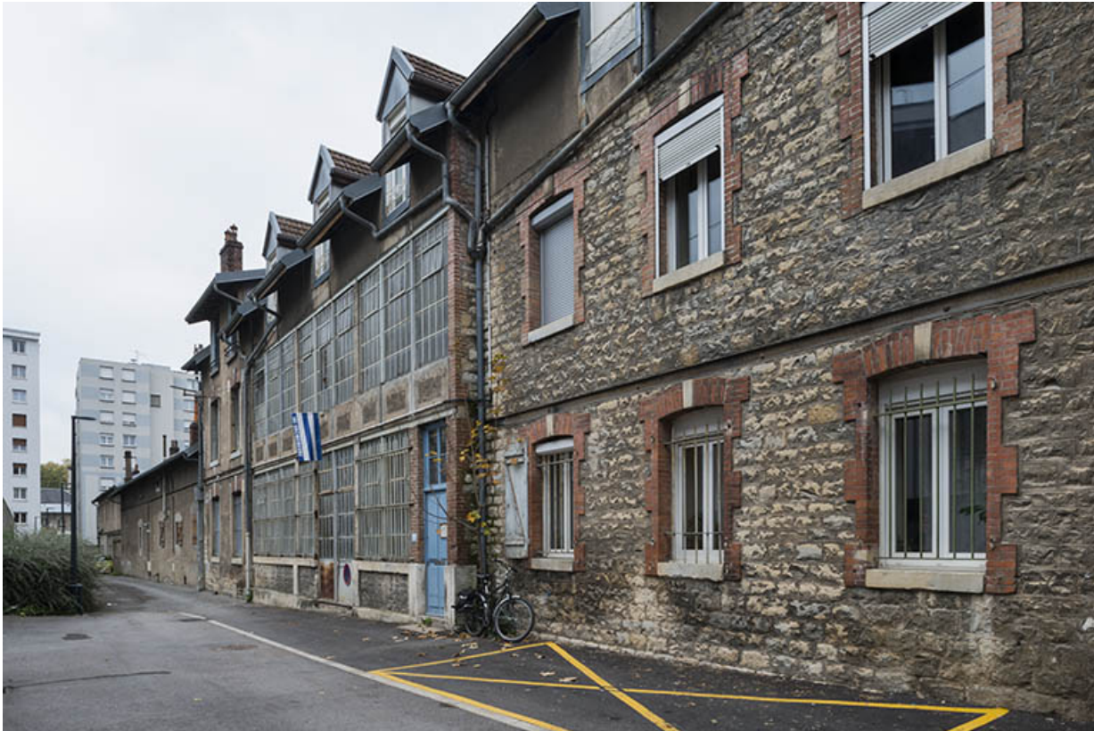
Ruelle de la Mouillère. Façade sud des ateliers vue de trois quarts.