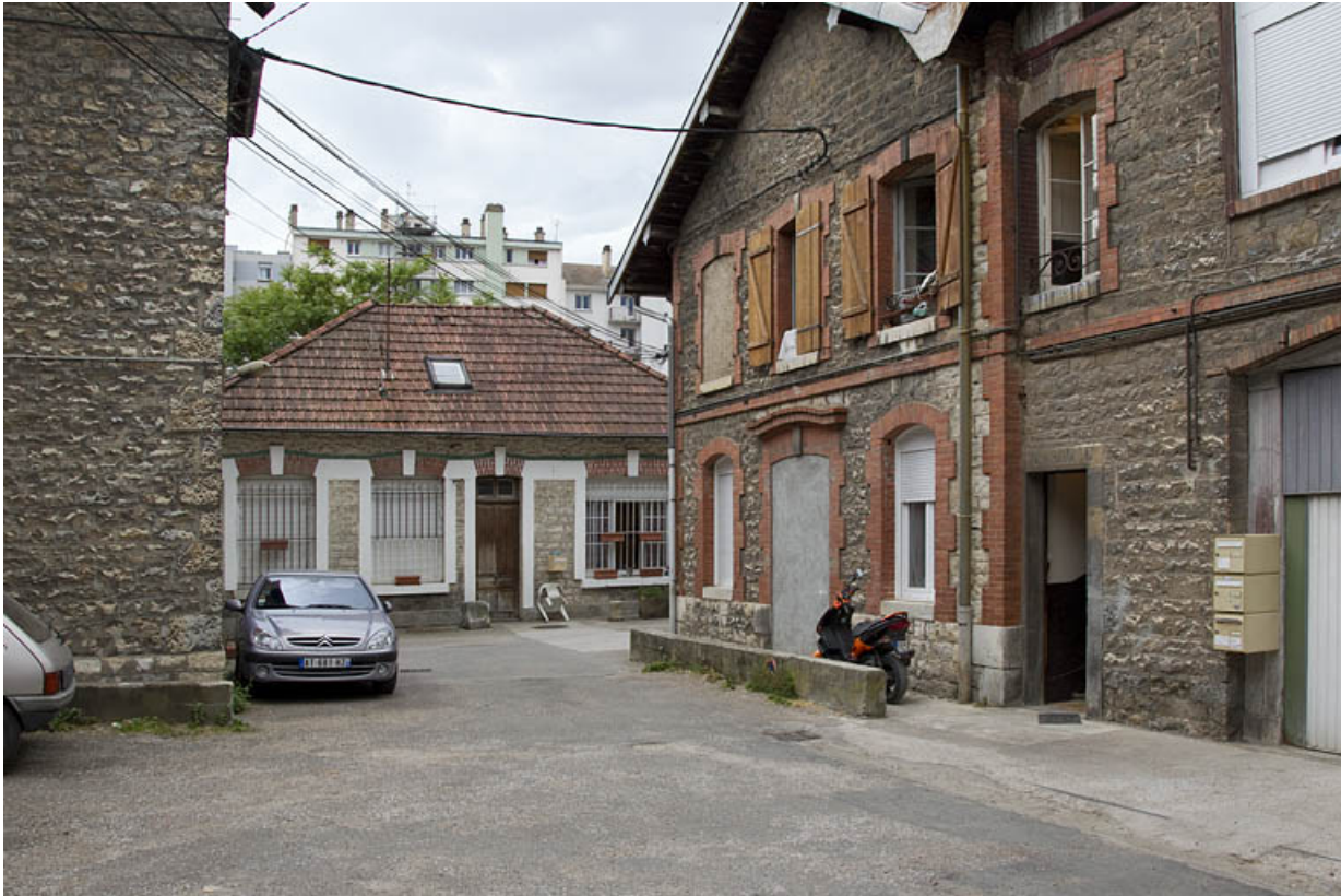
Atelier face à celui du n° 14B : façade antérieure.