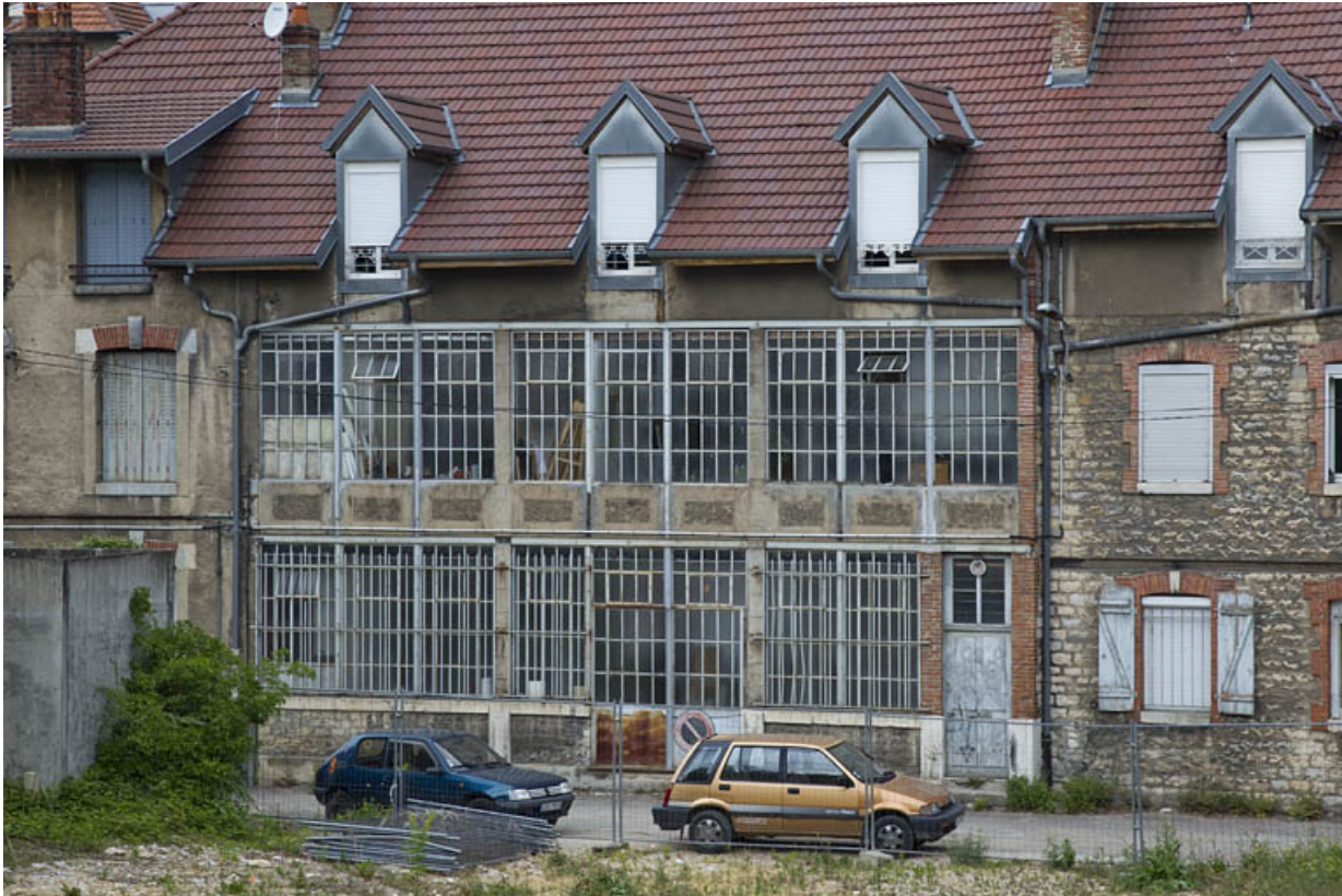
Atelier en béton au n° 14B : partie centrale de la façade postérieure.