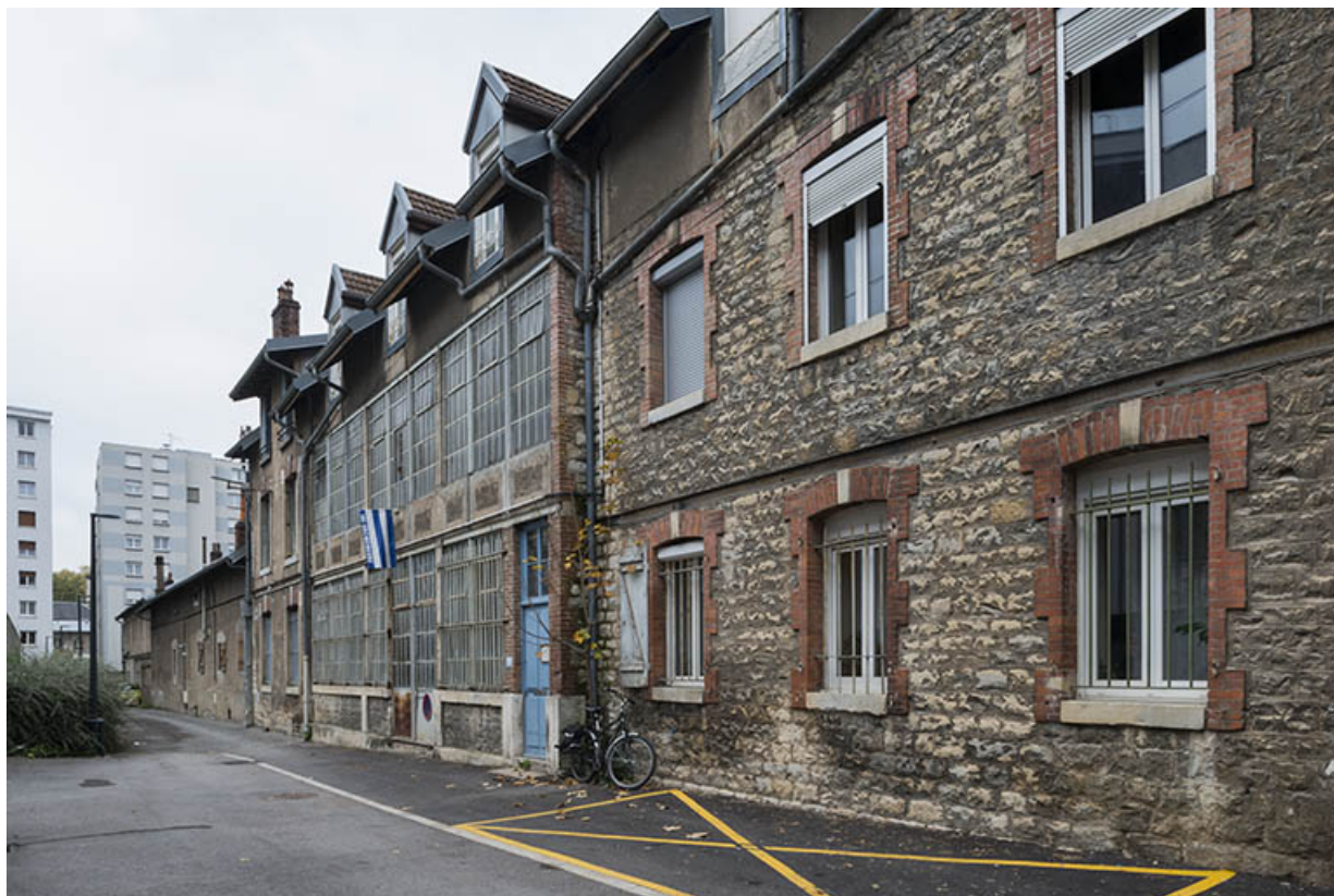
Ruelle de la Mouillère. Façade sud des ateliers vue de trois quarts.