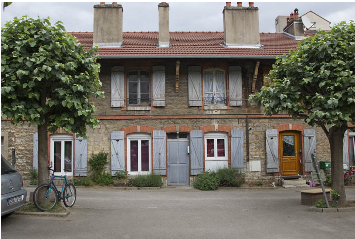
Atelier en pierre au n° 14B : travées centrales de la façade antérieure.