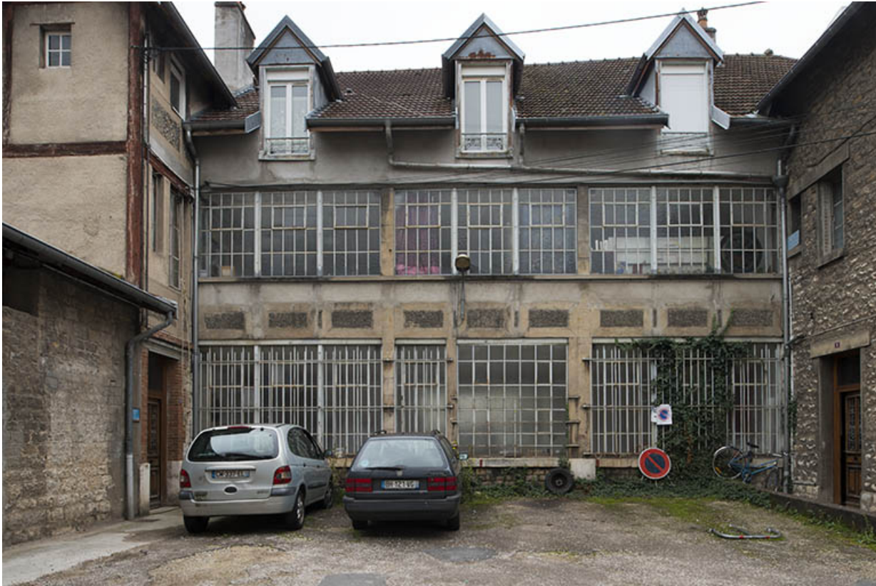
Façade nord d'un atelier de fabrication.