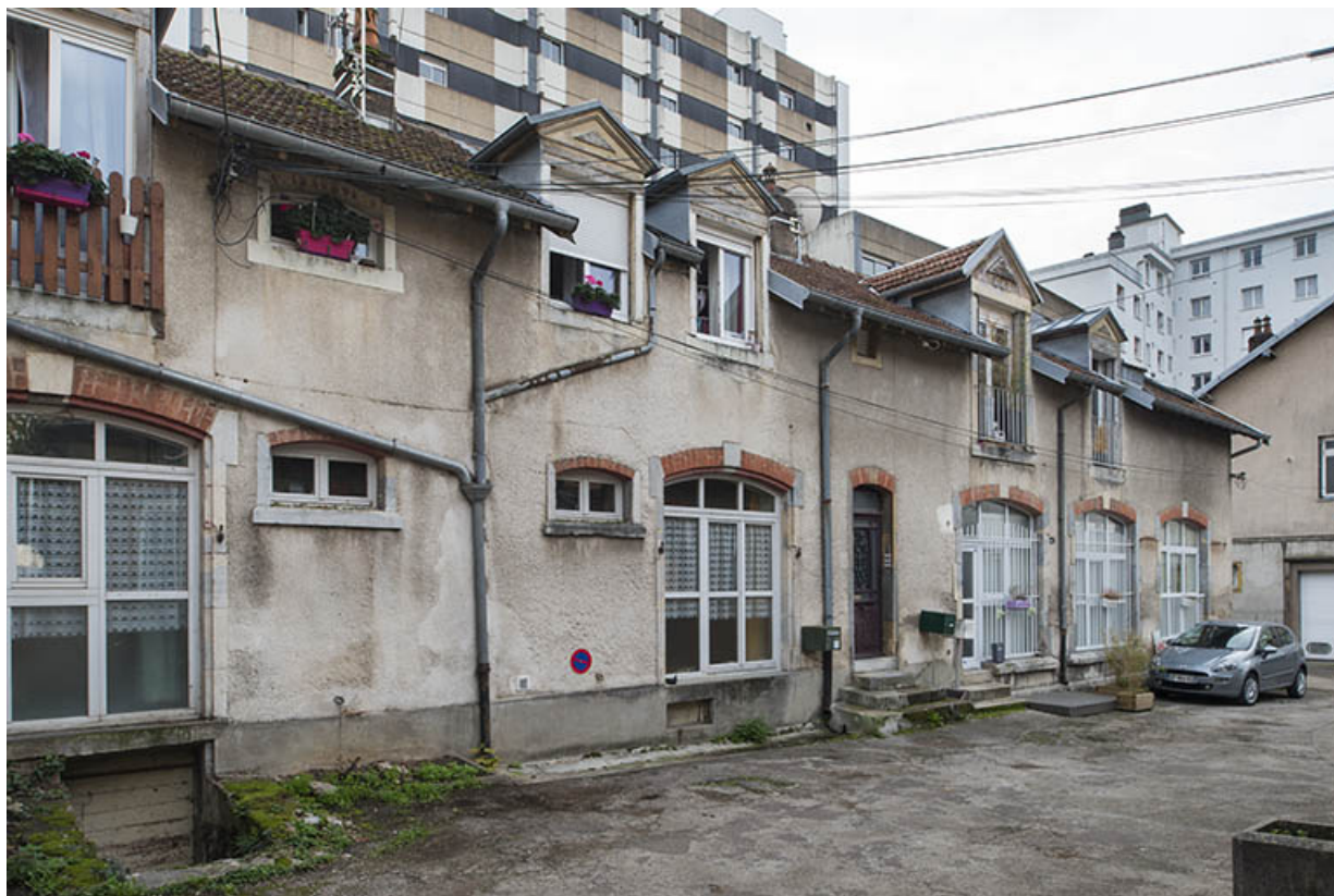
Atelier de fabrication. Façade sur cour.