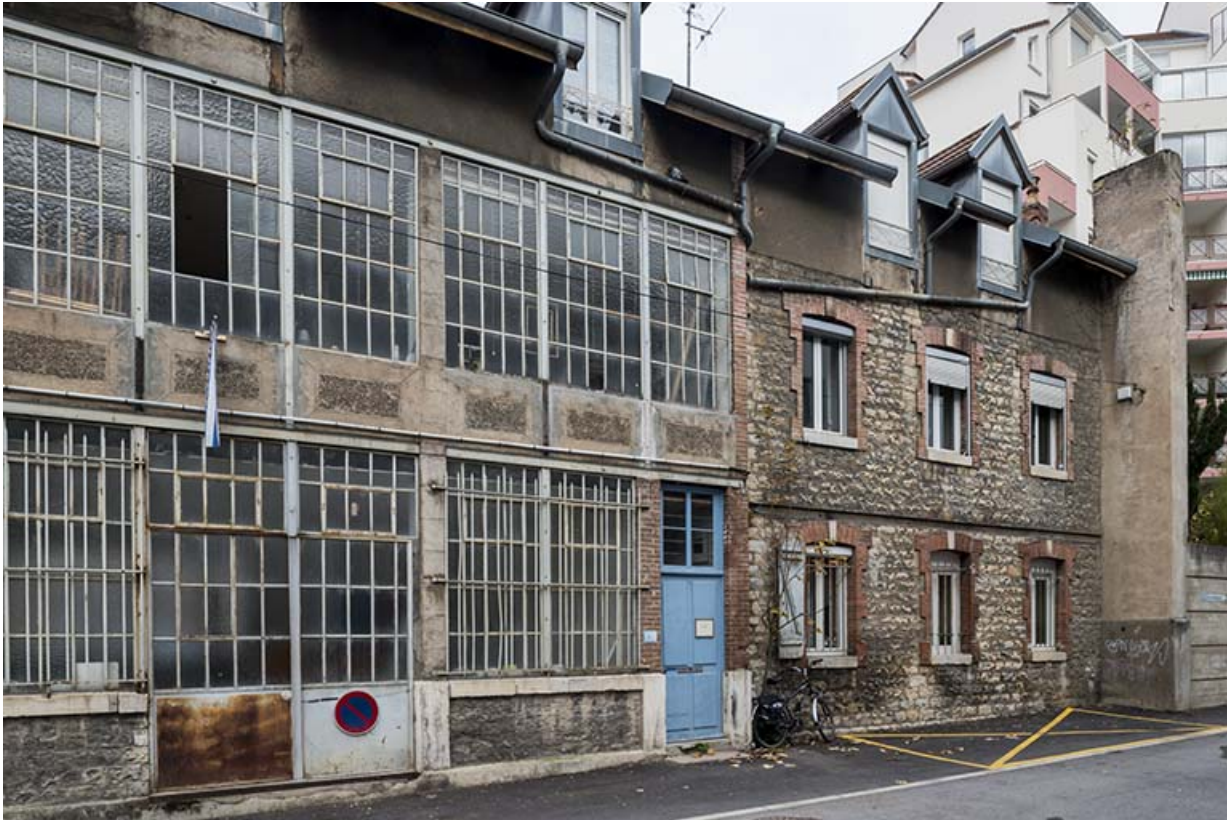
Façades (atelier et logement) au nord de la ruelle de la Mouillère.