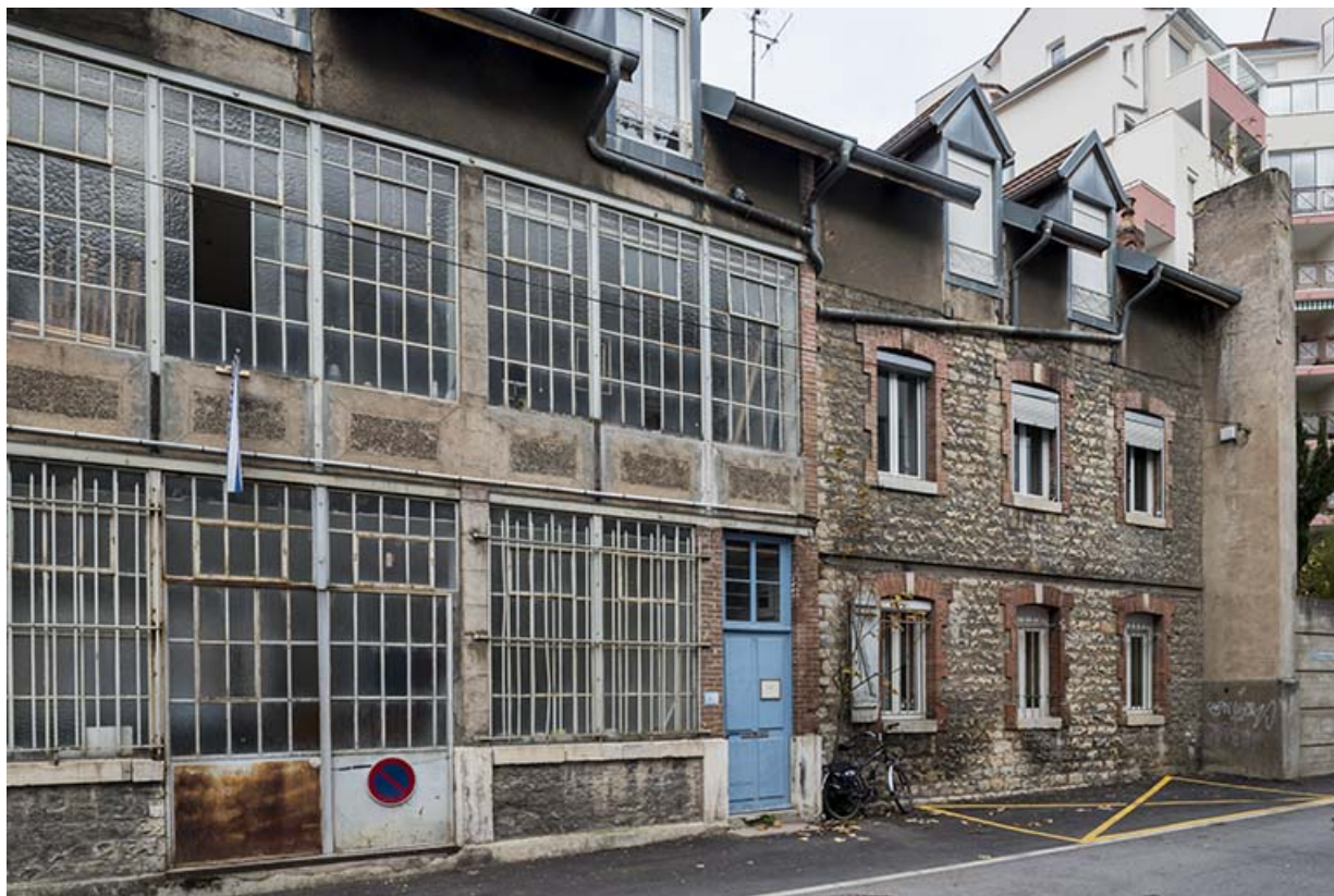
Façades (atelier et logement) au nord de la ruelle de la Mouillère.