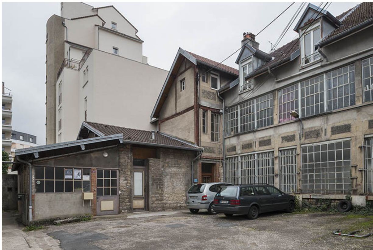
Bâtiments industriels vus depuis la cour.