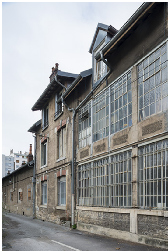
Façades d'ateliers ruelle de la Mouillère (cadrage vertical). 25, Besançon, 14 avenue Fontaine-Argent