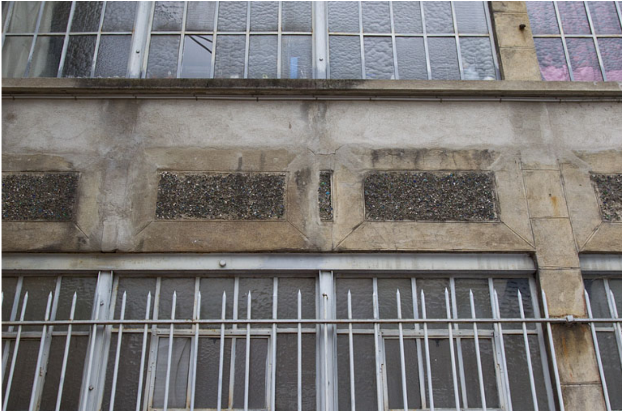
Atelier en béton au n° 14B : décor des allèges de la façade antérieure.