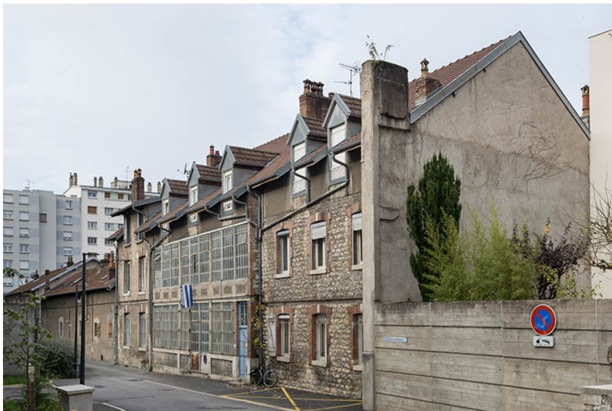
Vue d'ensemble depuis l'extrémité de la ruelle de la Mouillère.