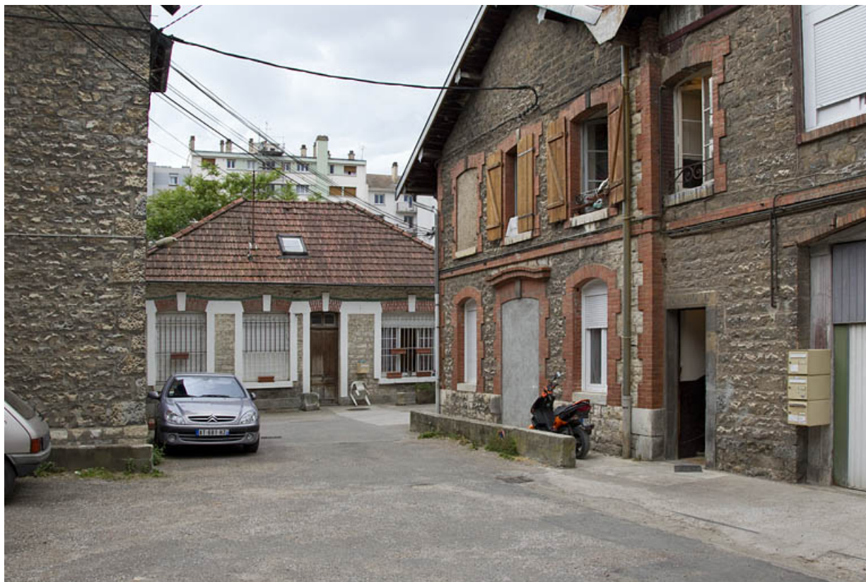
Atelier face à celui du n° 14B : façade antérieure.