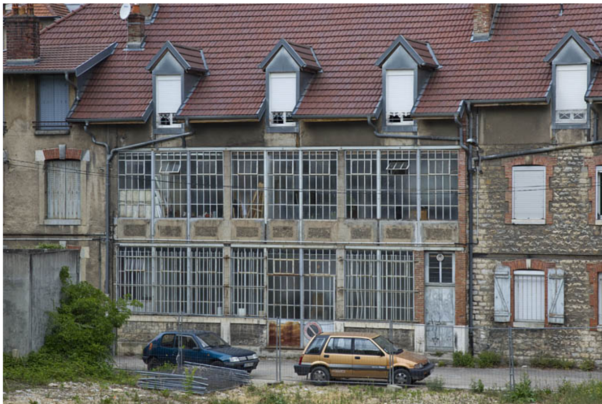
Atelier en béton au n° 14B : partie centrale de la façade postérieure. 25, Besançon, 14 avenue Fontaine-Argent