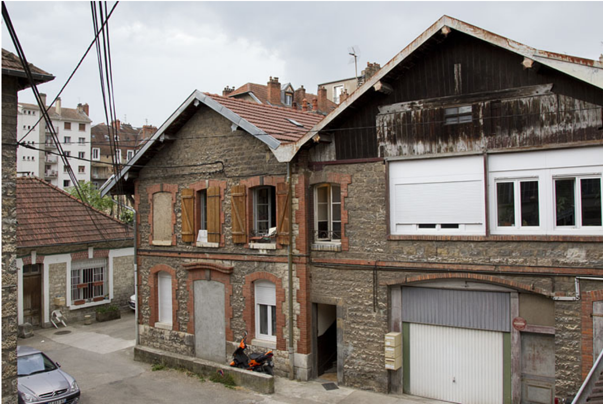
Atelier en pierre au n° 14B : façade latérale droite.