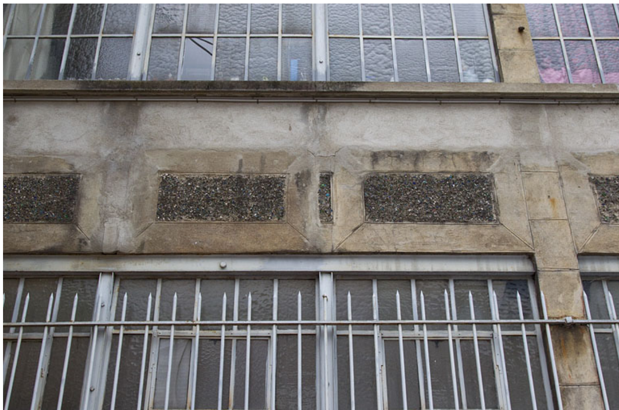
Atelier en béton au n° 14B : décor des allèges de la façade antérieure.