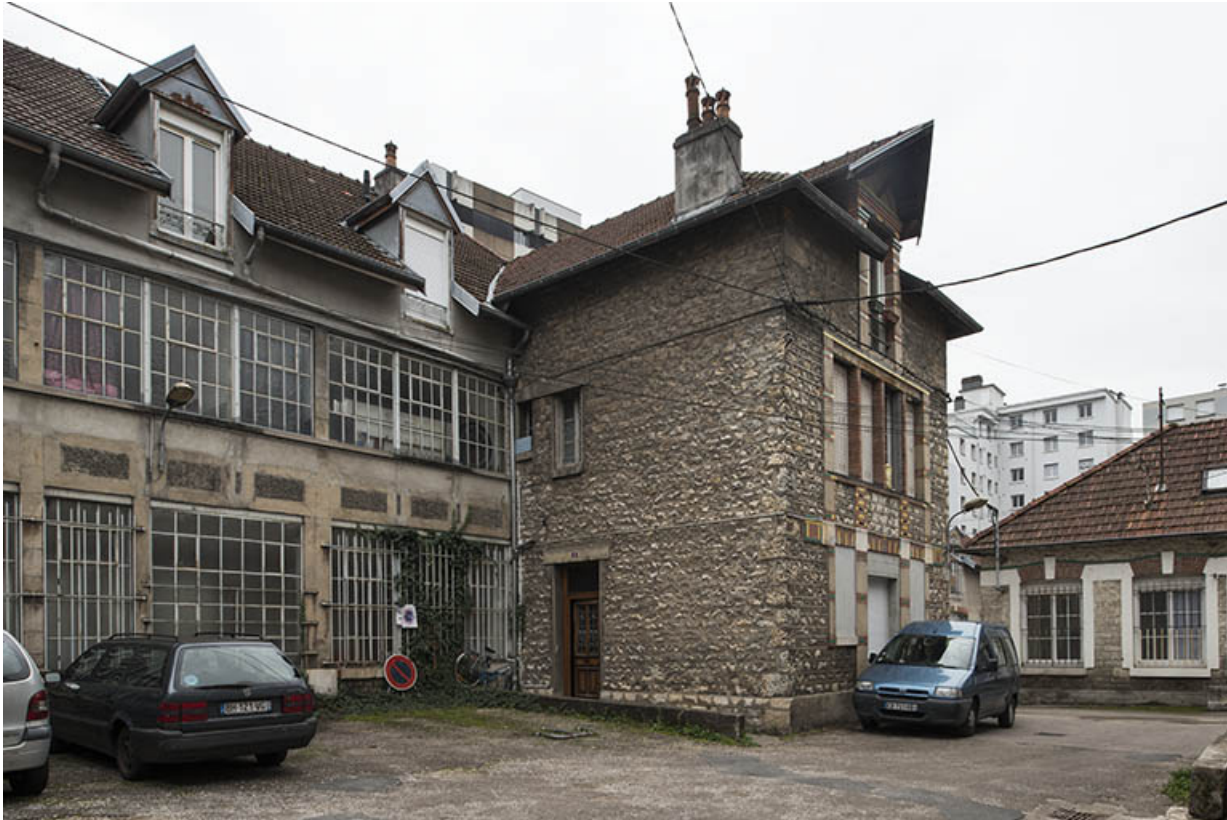
Bâtiments industriels vus depuis la cour.