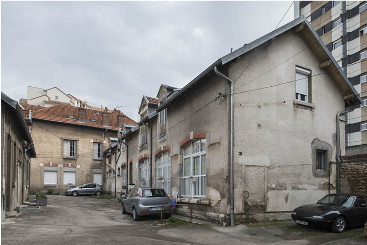
Atelier de fabrication. Vue de trois quarts, depuis la cour.