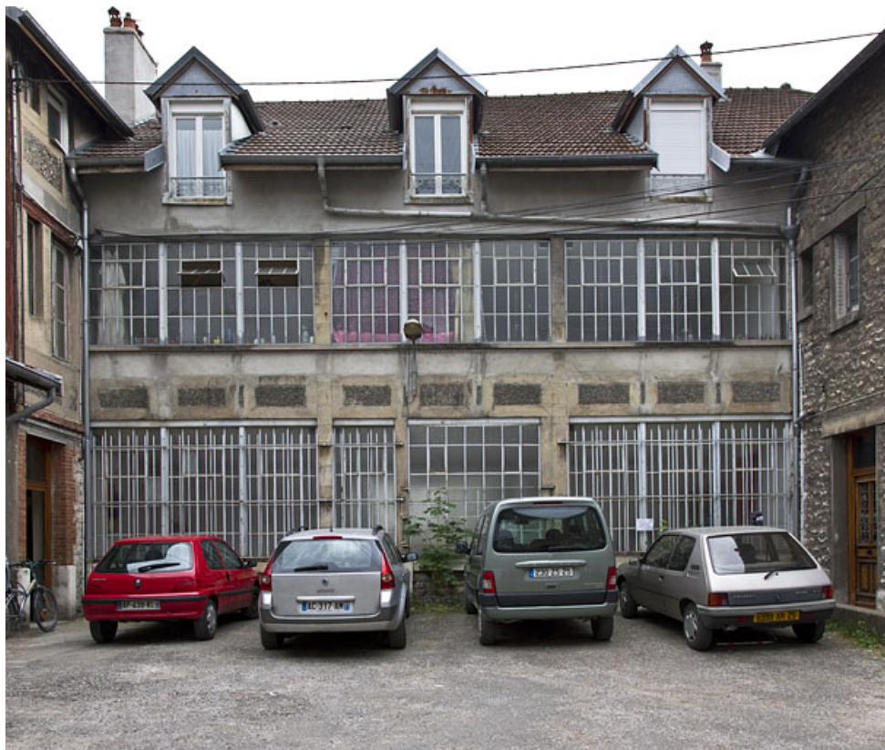
Atelier en béton au n° 14B : façade antérieure. 25, Besançon, 14 avenue Fontaine-Argent