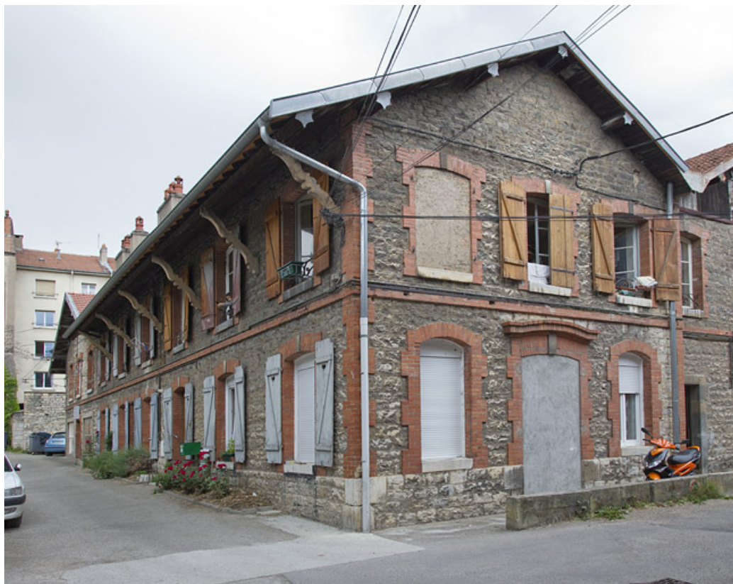
Atelier en pierre au n° 14B : façades antérieure et latérale droite.