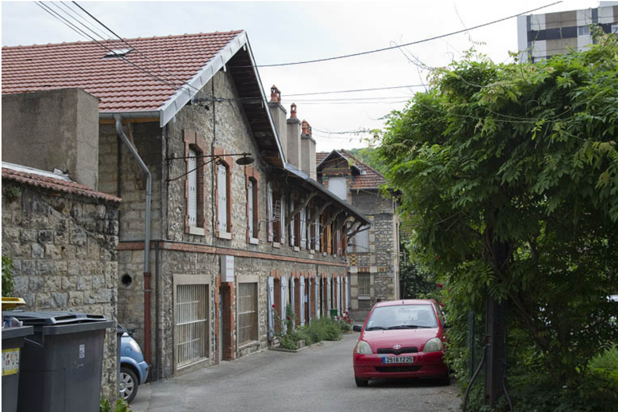
Atelier en pierre au n° 14B : façade antérieure, de trois quarts gauche.