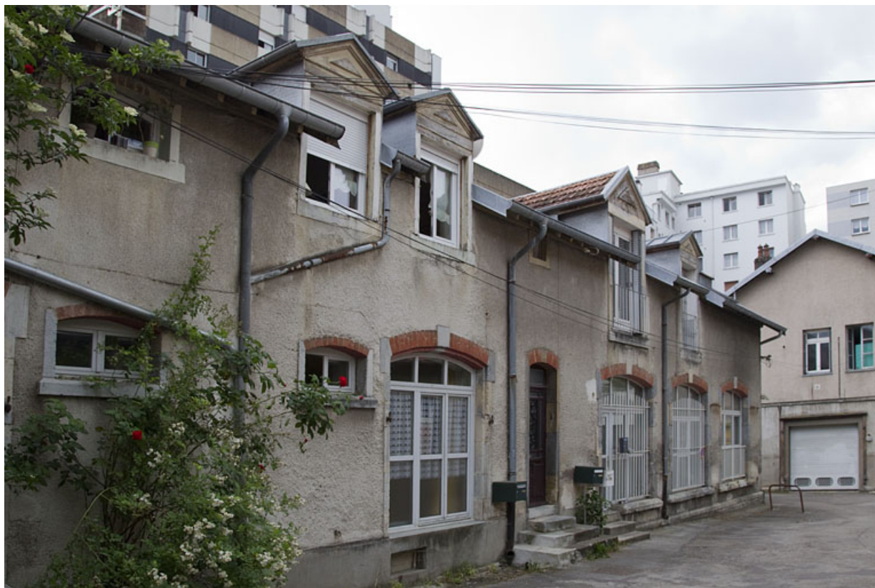
Atelier dans le prolongement au sud de celui en béton (13B rue de la Mouillère) : façade antérieure, de trois quarts gauche. 25, Besançon, 14 avenue Fontaine-Argent