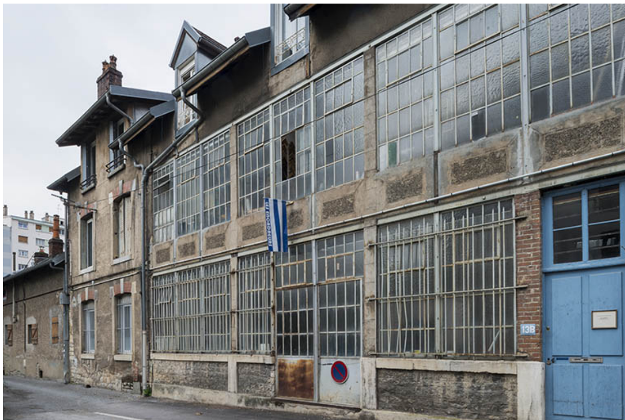
Façades d'ateliers ruelle de la Mouillère. 25, Besançon, 14 avenue Fontaine-Argent