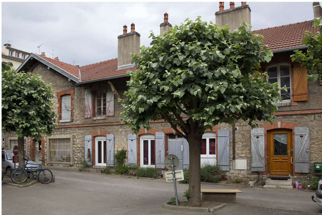
Atelier en pierre au n° 14B : façade antérieure, de trois quarts droite. 25, Besançon, 14 avenue Fontaine-Argent