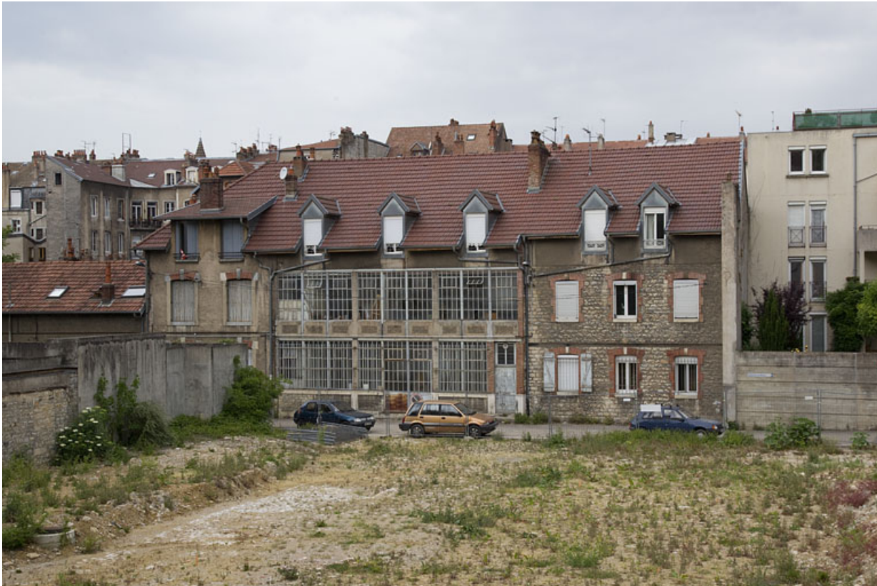
Atelier en béton au n° 14B : façade postérieure.