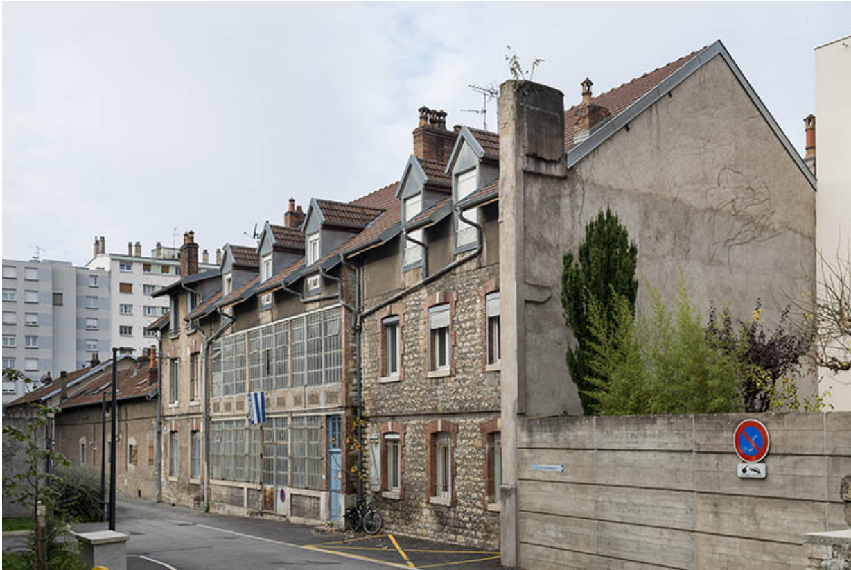
Vue d'ensemble depuis l'extrémité de la ruelle de la Mouillère.