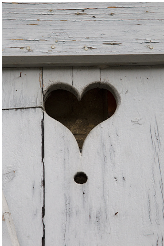
Atelier en pierre au n° 14B : motif en coeur sur un volet. 25, Besançon, 14 avenue Fontaine-Argent