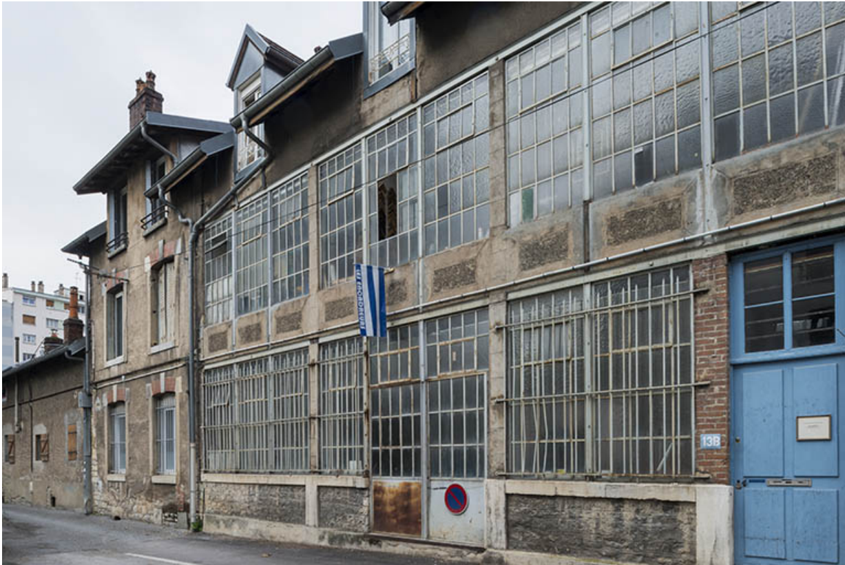
Façades d'ateliers ruelle de la Mouillère. 25, Besançon, 14 avenue Fontaine-Argent