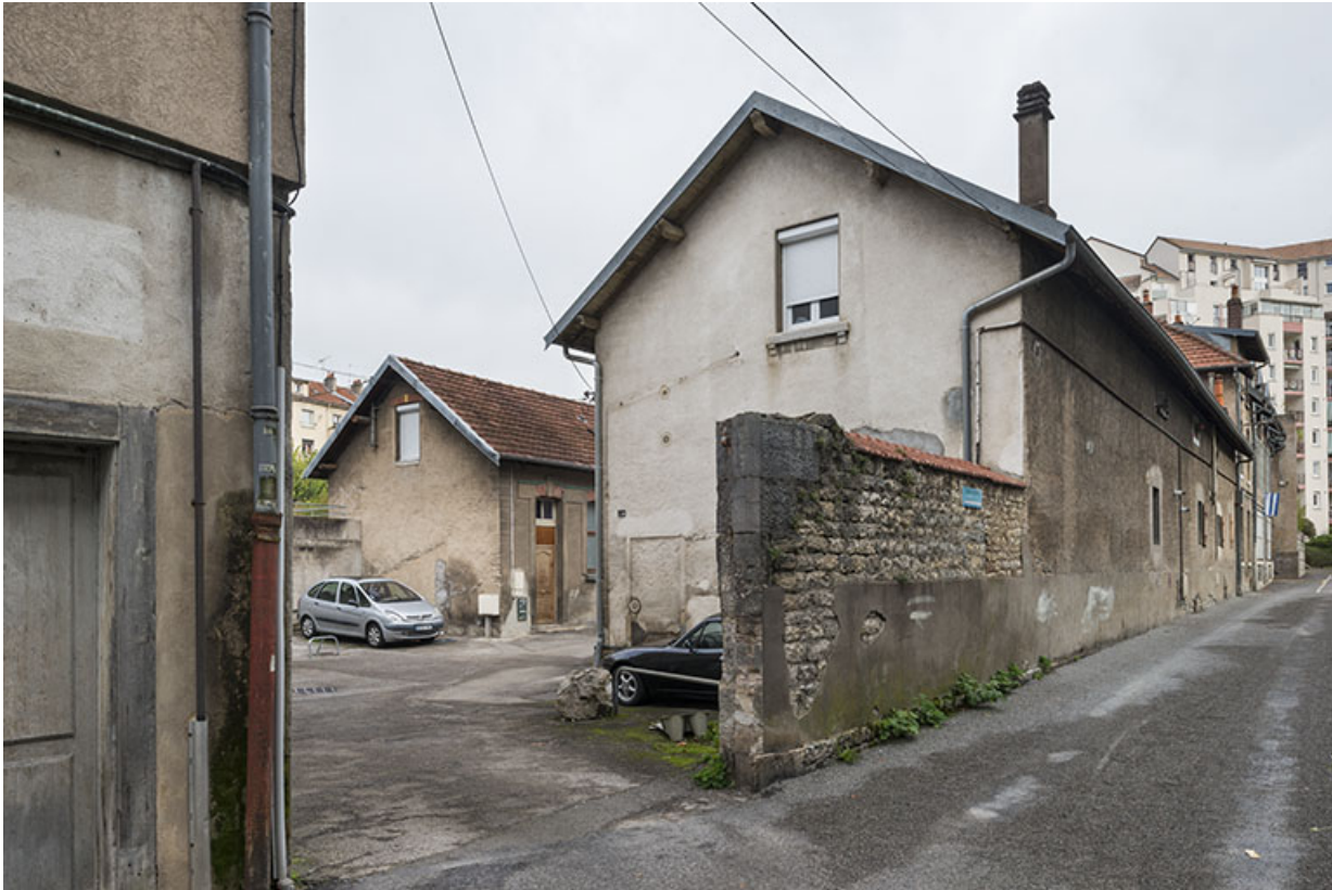
Entrée depuis la ruelle de la Mouillère.