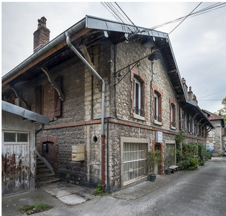
Pignon et façade sud de la distillerie.