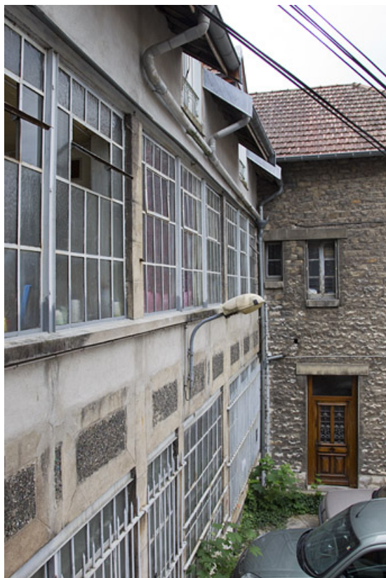
Atelier en béton au n° 14B : façade antérieure vue en enfilade (vers le sud). 25, Besançon, 14 avenue Fontaine-Argent