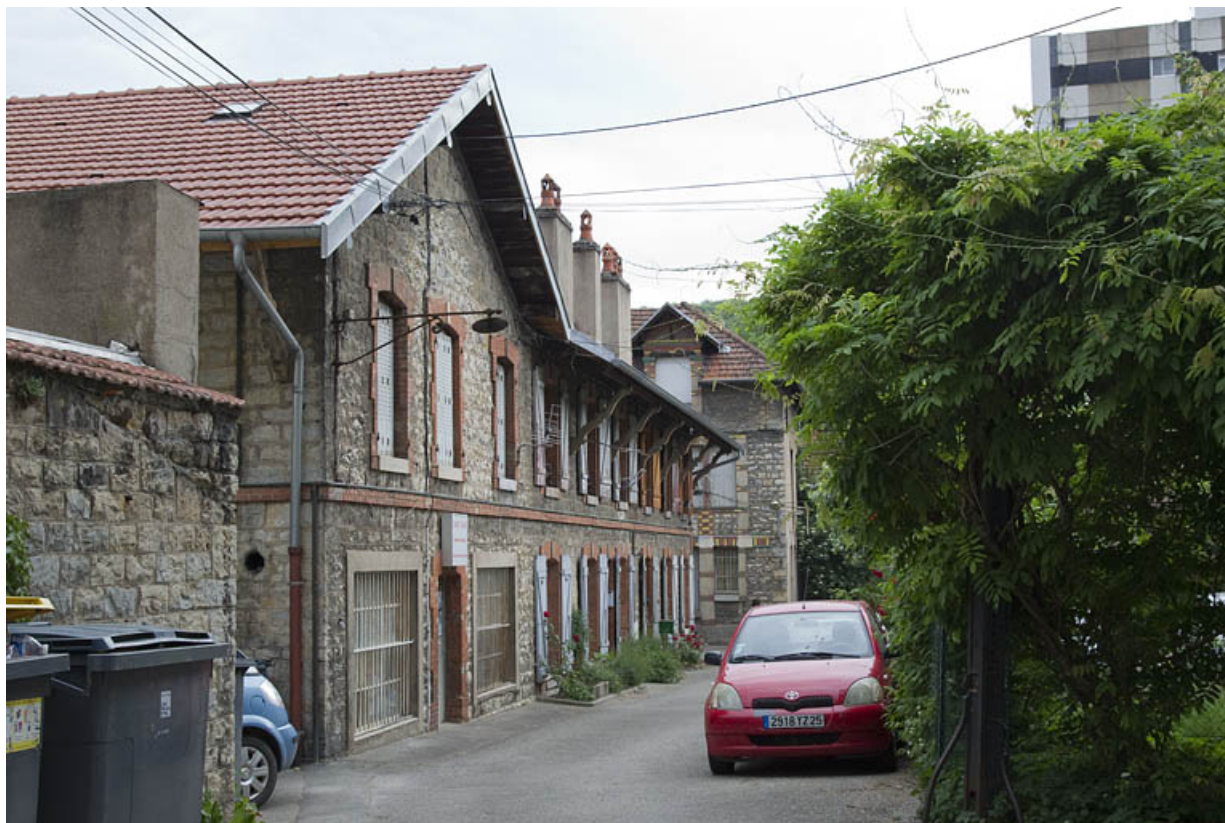
Atelier en pierre au n° 14B : façade antérieure, de trois quarts gauche.