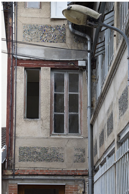
Atelier en béton au n° 14B : façade antérieure, baies du retour au nord-est. 25, Besançon, 14 avenue Fontaine-Argent