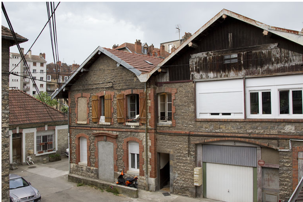
Atelier en pierre au n° 14B : façade latérale droite.