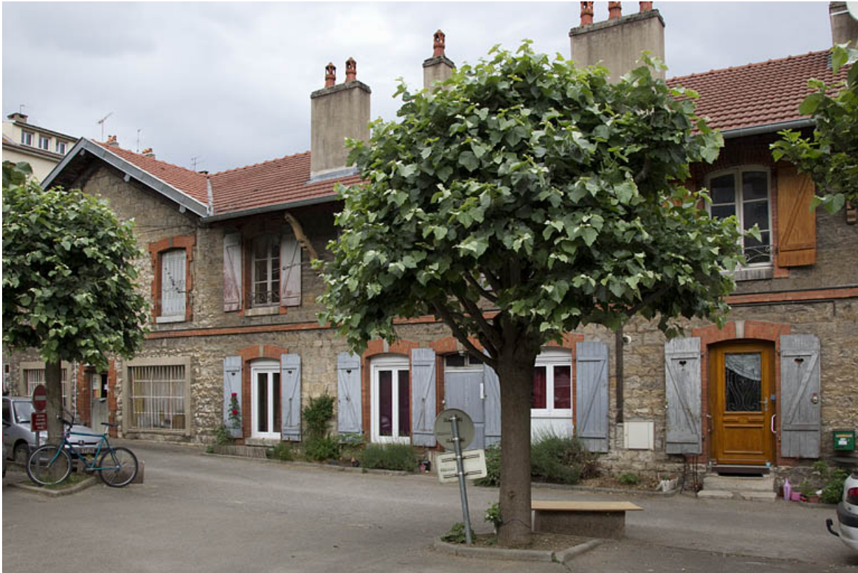
Atelier en pierre au n° 14B : façade antérieure, de trois quarts droite.