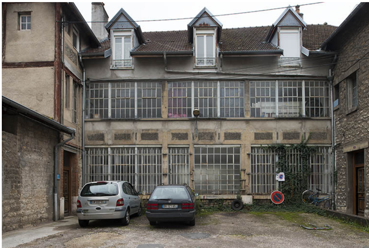
Façade nord d'un atelier de fabrication. 25, Besançon, 14 avenue Fontaine-Argent