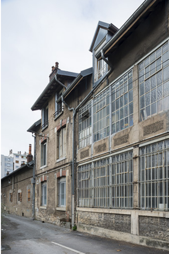
Façades d'ateliers ruelle de la Mouillère (cadrage vertical). 25, Besançon, 14 avenue Fontaine-Argent