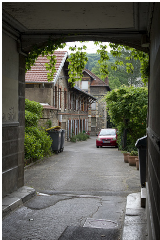
Vue d'ensemble depuis le porche du n° 14 avenue Fontaine-Argent.