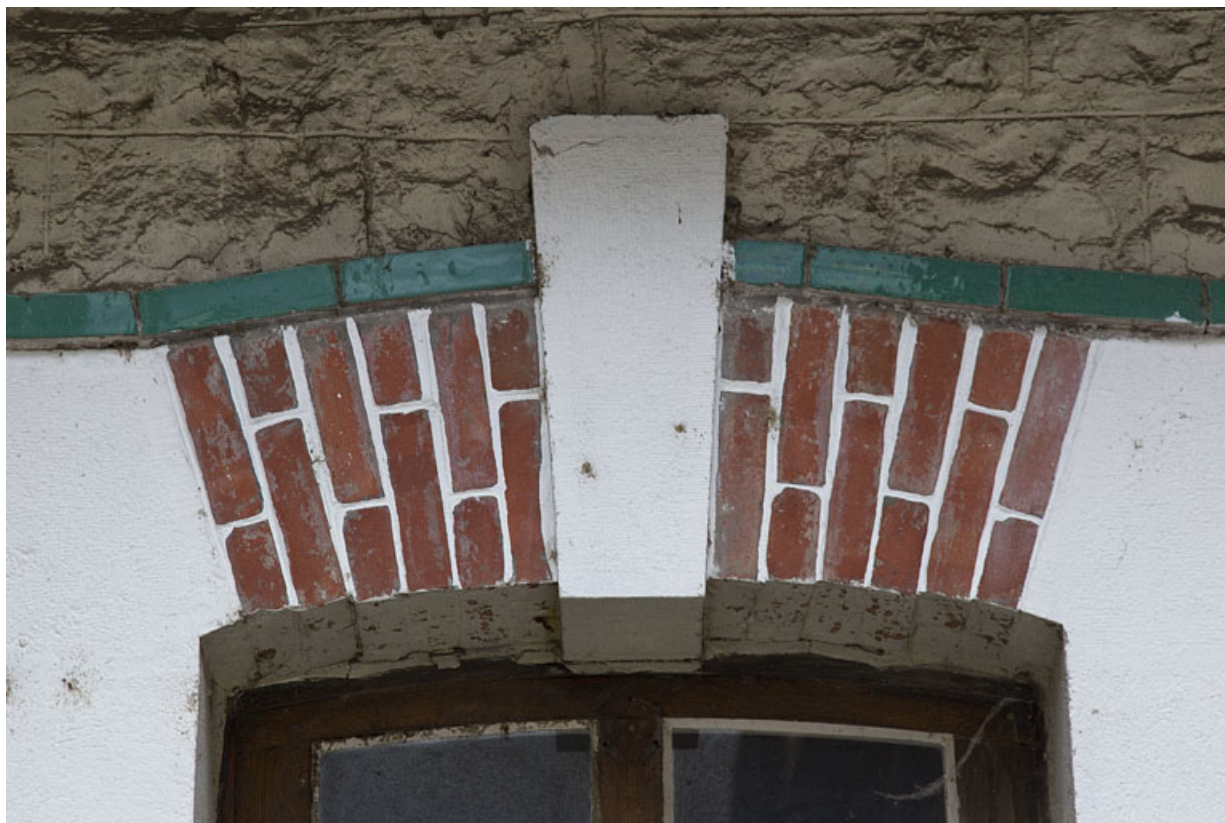
Atelier face à celui du n° 14B : arc en briques couvrant une baie de la façade antérieure.