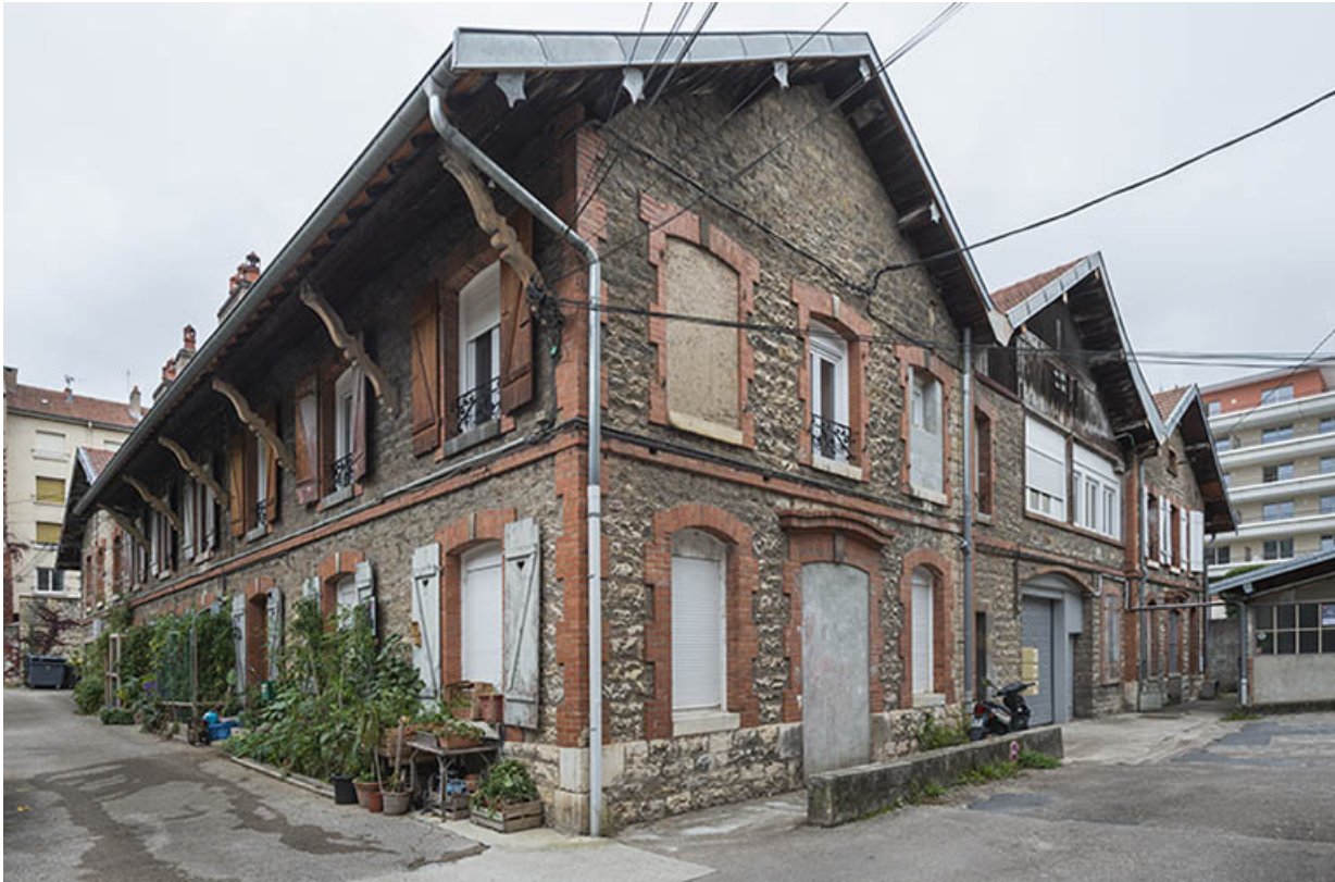
Bâtiment de la distillerie, depuis le sud.