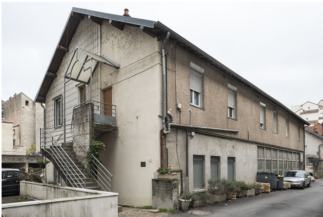
Bâtiment industriel à l'entrée de la ruelle de la Mouillère.