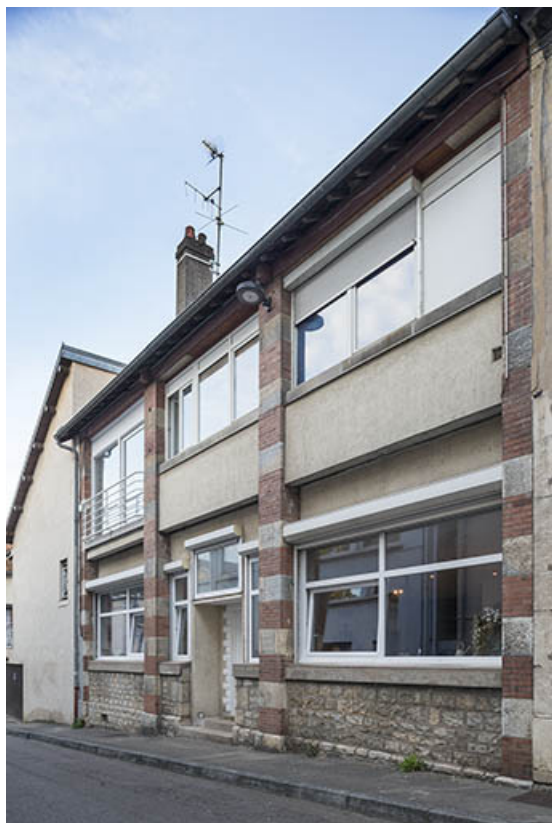
Façade antérieure vue de trois quarts droite. 25, Besançon, 19 rue des Villas