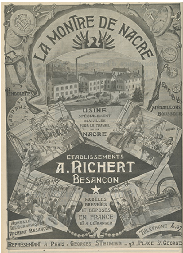
Publicité Ets A. Richert, 1908. 25, Besançon, 19 rue des Villas