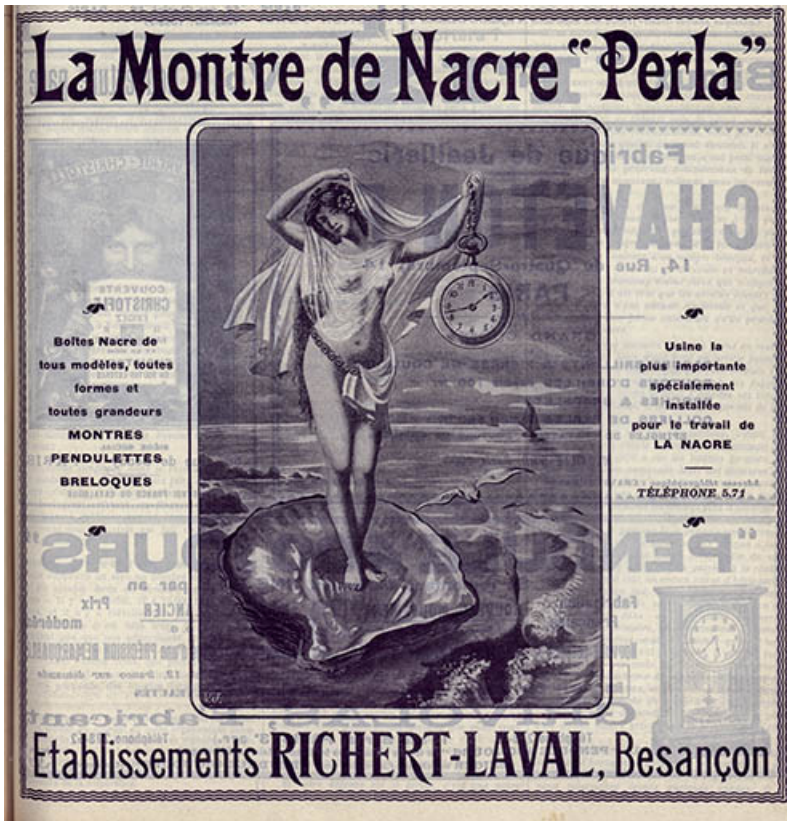
Montre de nacre Perla, publicité, 1910. 25, Besançon, 19 rue des Villas