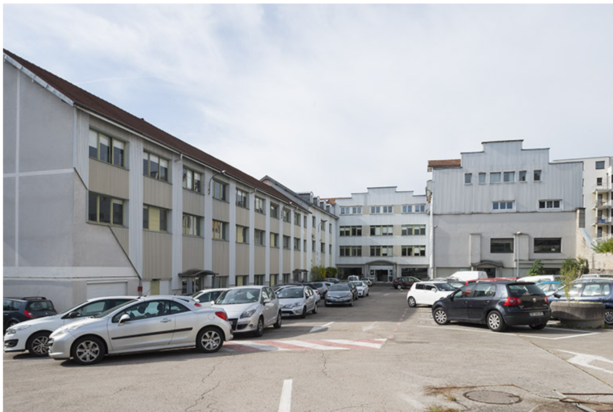
Vue d'ensemble depuis l'avenue Carnot.