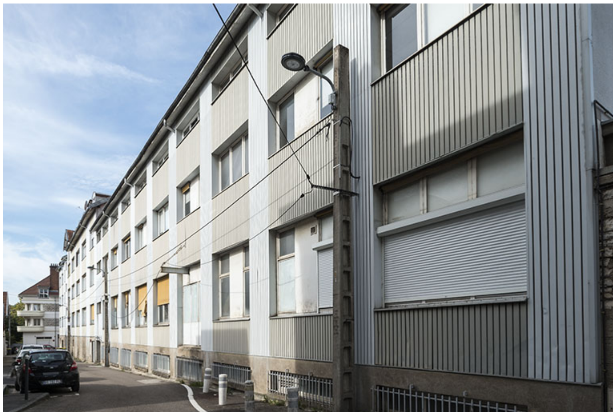
Façade du bâtiment sud.