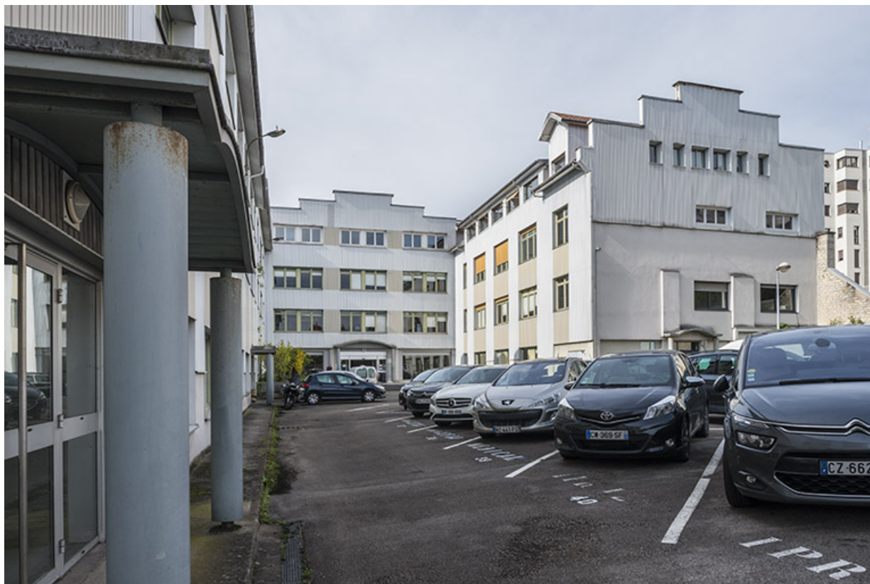
Bâtiment nord depuis la cour.