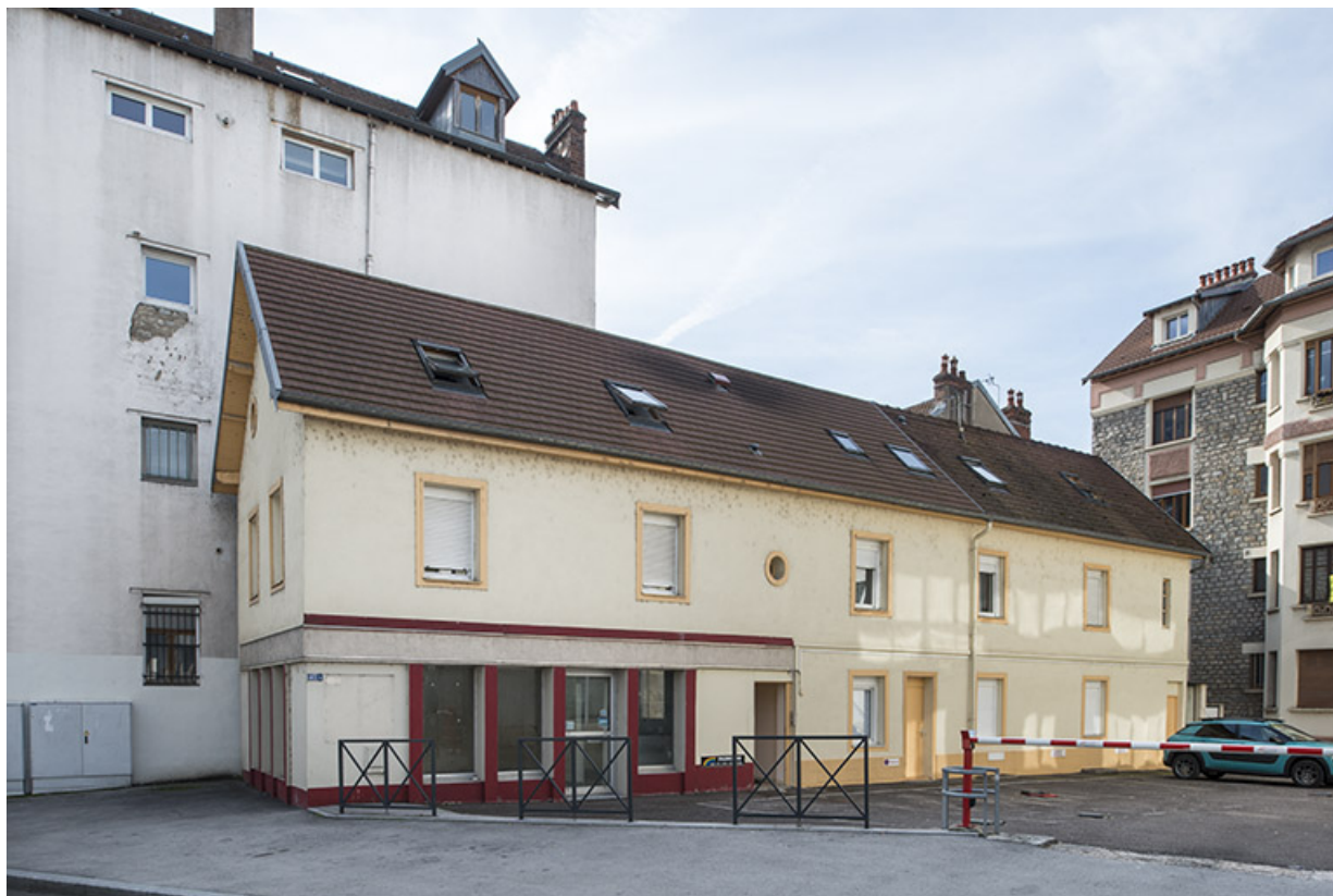
Façade nord de l'atelier.