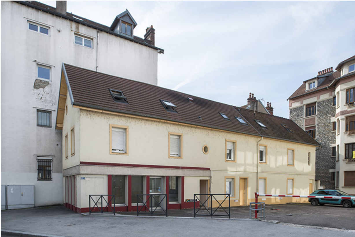
Façade nord de l'atelier.