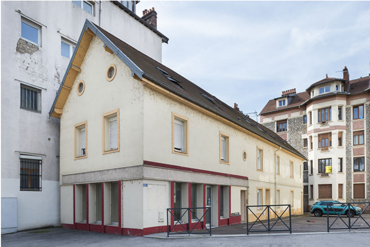
Vue de trois quarts droite.