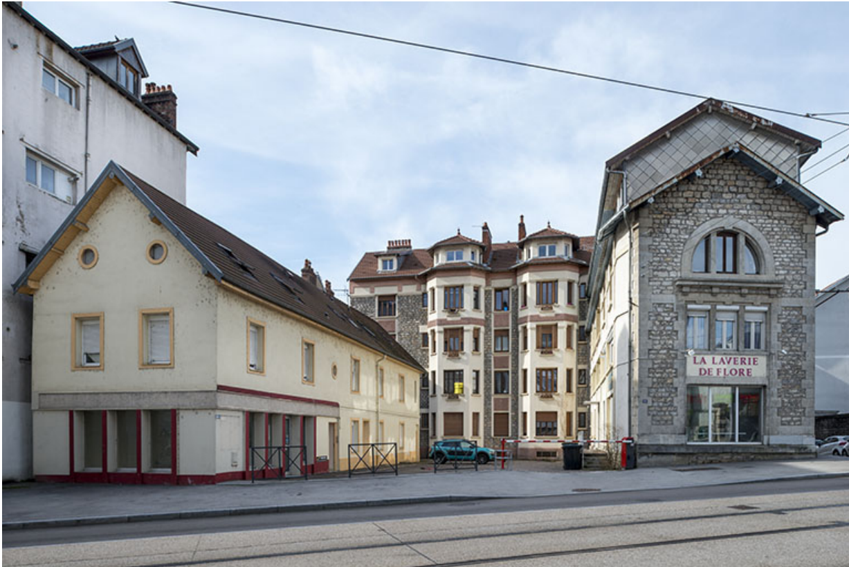
Vue d'ensemble depuis l'est.