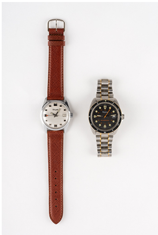
Montres de marque Blazon, 3e quart 20e siècle. (Fonds Horloger de Battant). 25, Besançon, 36 bis avenue Carnot