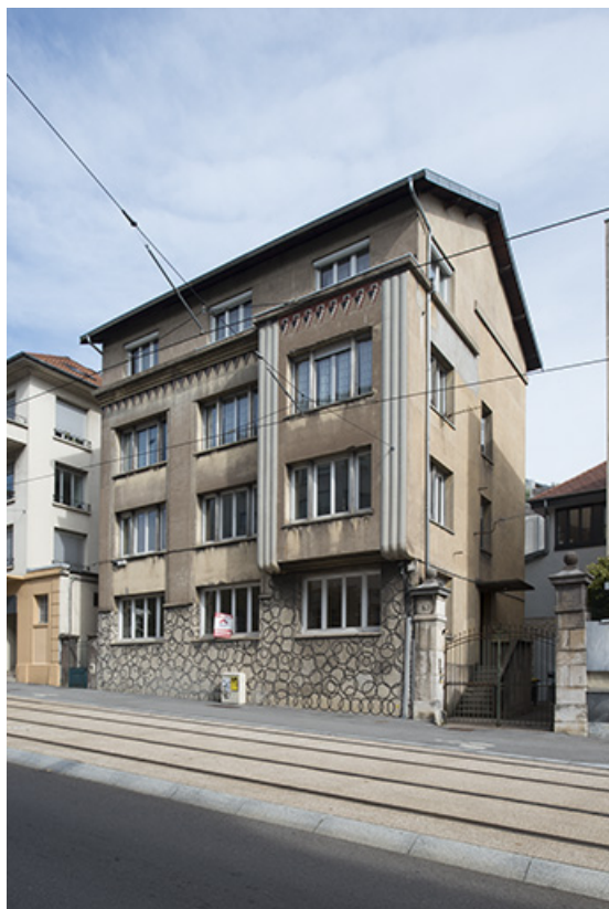
Vue de trois quarts droite.