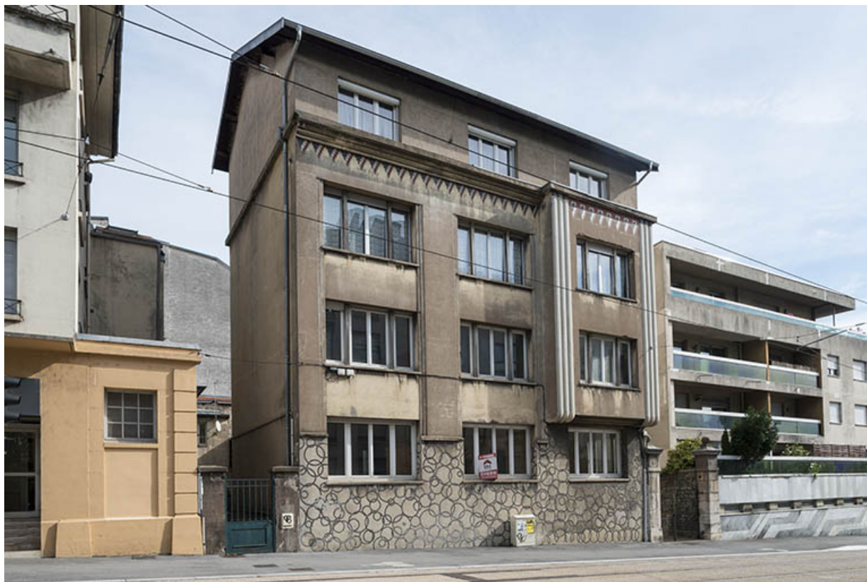
Vue de trois quarts depuis l'avenue.