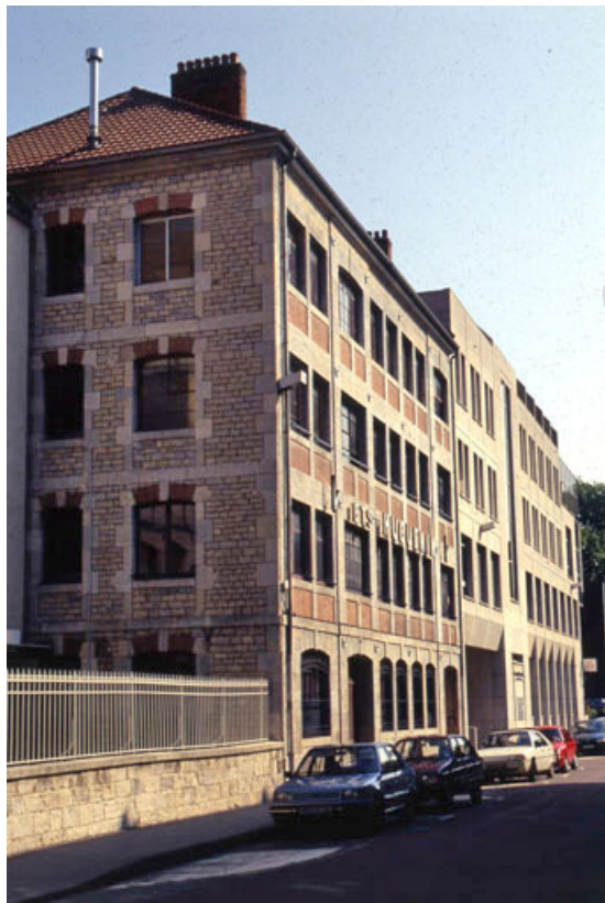
Façade antérieure : de trois quarts gauche.