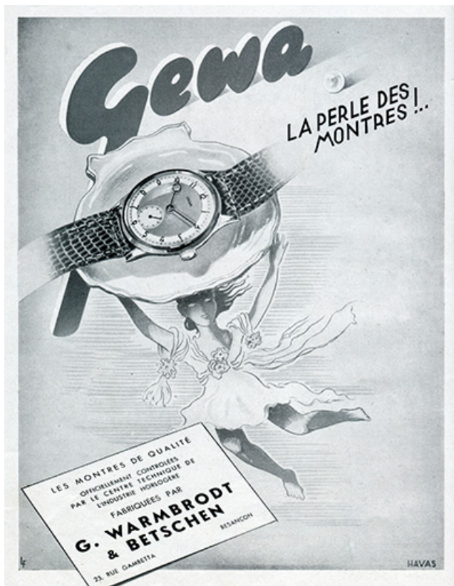
Montres Gewa, publicité, 1947. 25, Besançon, 23 rue Gambetta