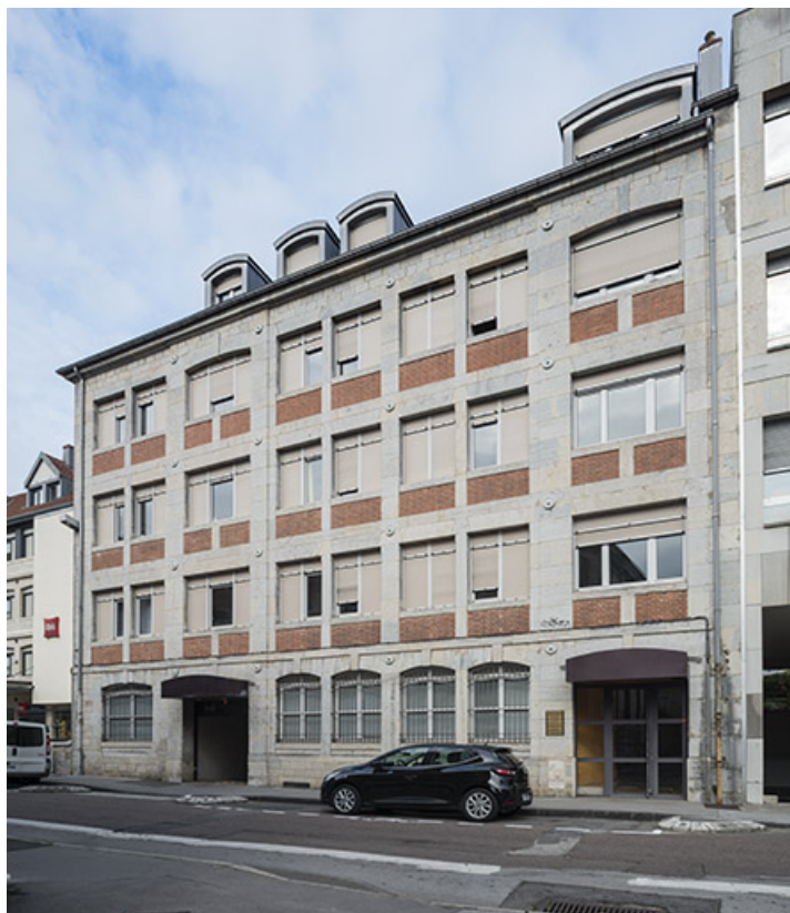
Façade antérieure vue de trois quarts droite. 25, Besançon