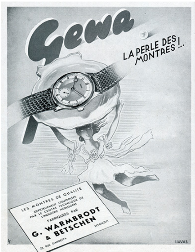
Montres Gewa, publicité, 1947. 25, Besançon, 23 rue Gambetta