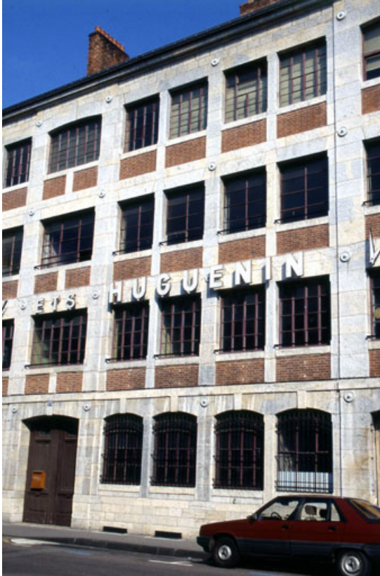
Façade antérieure : détail de la partie centrale.