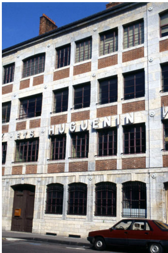
Façade antérieure : détail de la partie centrale.