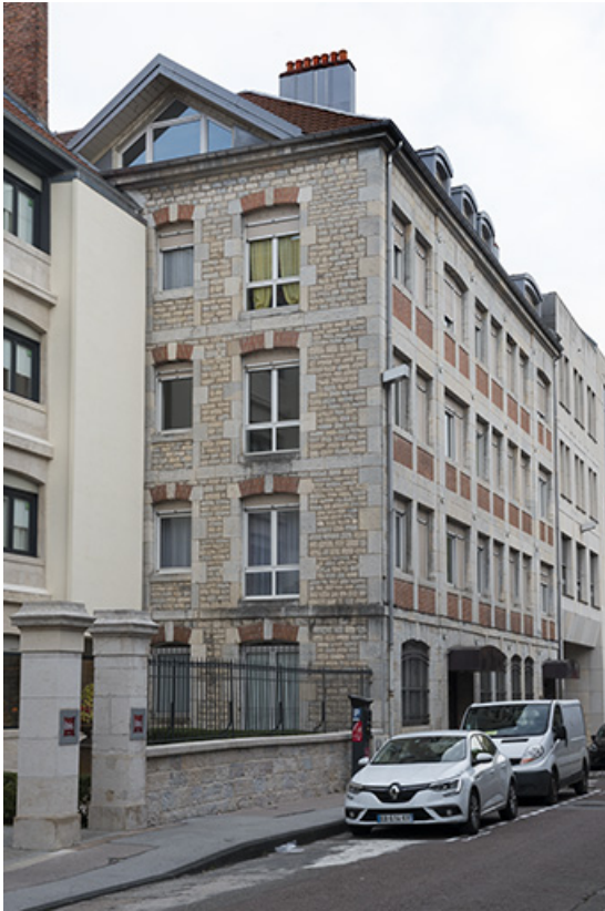
Vue depuis le sud.