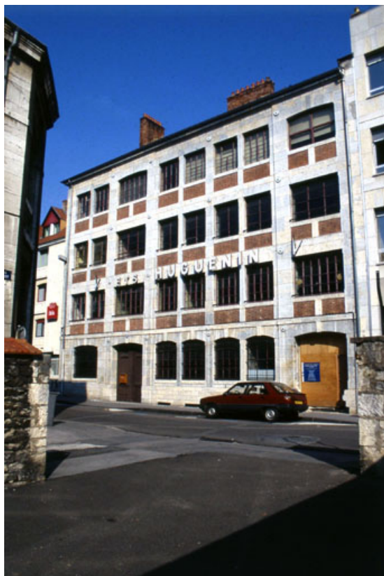
Façade antérieure : de trois quarts droit. 25, Besançon, 23 rue Gambetta