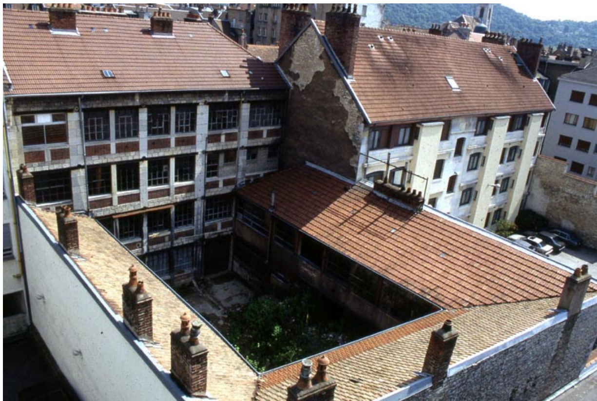
Façade postérieure et ateliers autour de la cour : vue plongeante.