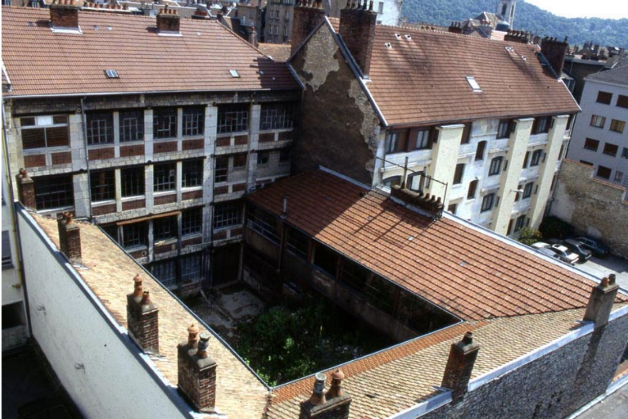
Façade postérieure et ateliers autour de la cour : vue plongeante.