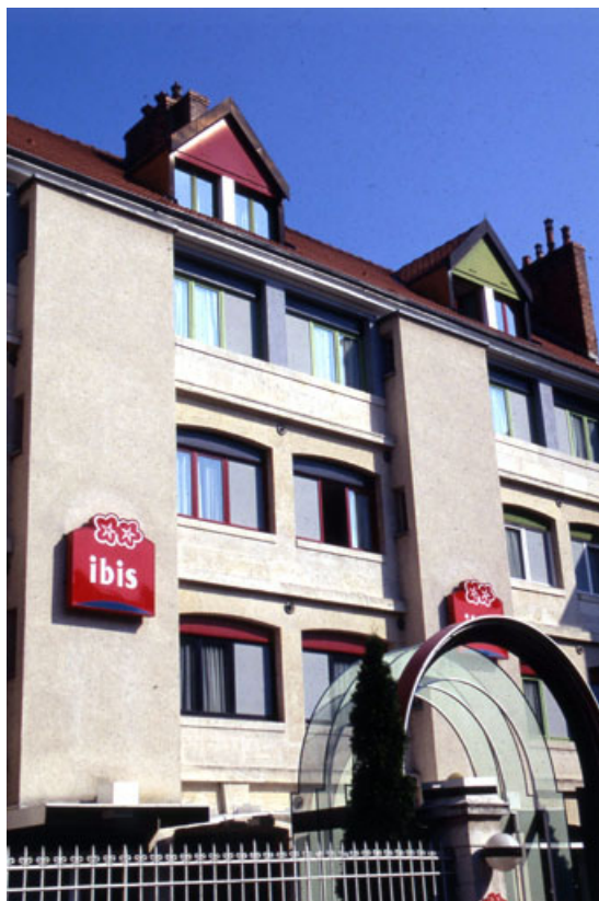
Façade antérieure : détail de la partie centrale.