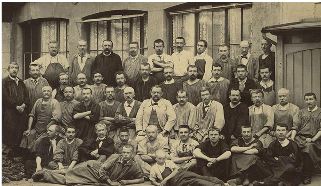
Ouvriers de la Société Générale des monteurs de boîtes d'or (?), 1899. 25, Besançon, 21 rue Gambetta