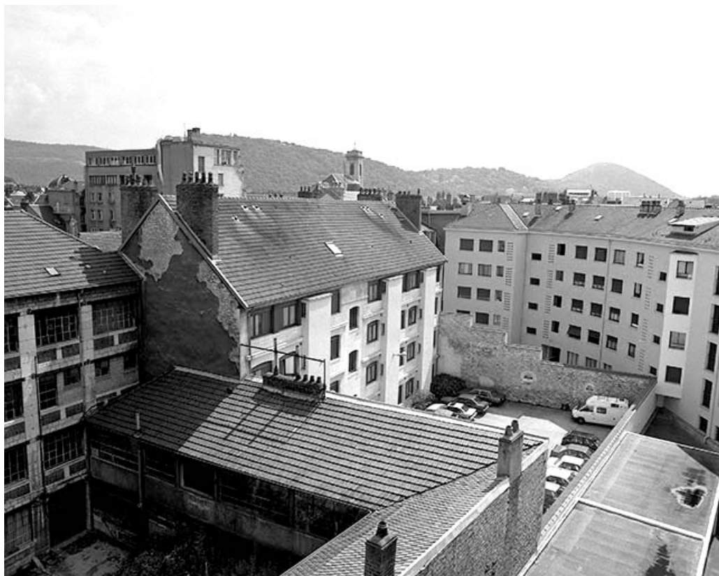
Façade postérieure et cour : de trois quarts gauche.