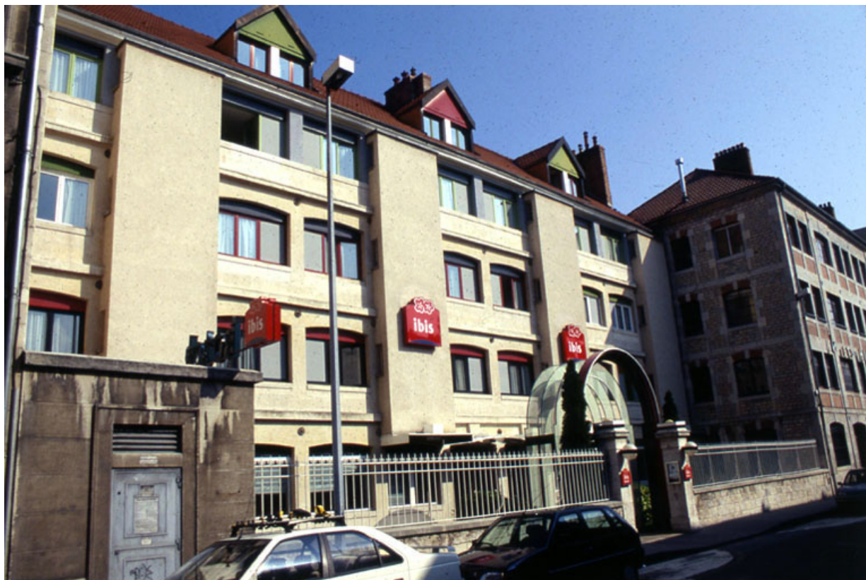
Façade antérieure : de trois quarts gauche. 25, Besançon, 21 rue Gambetta