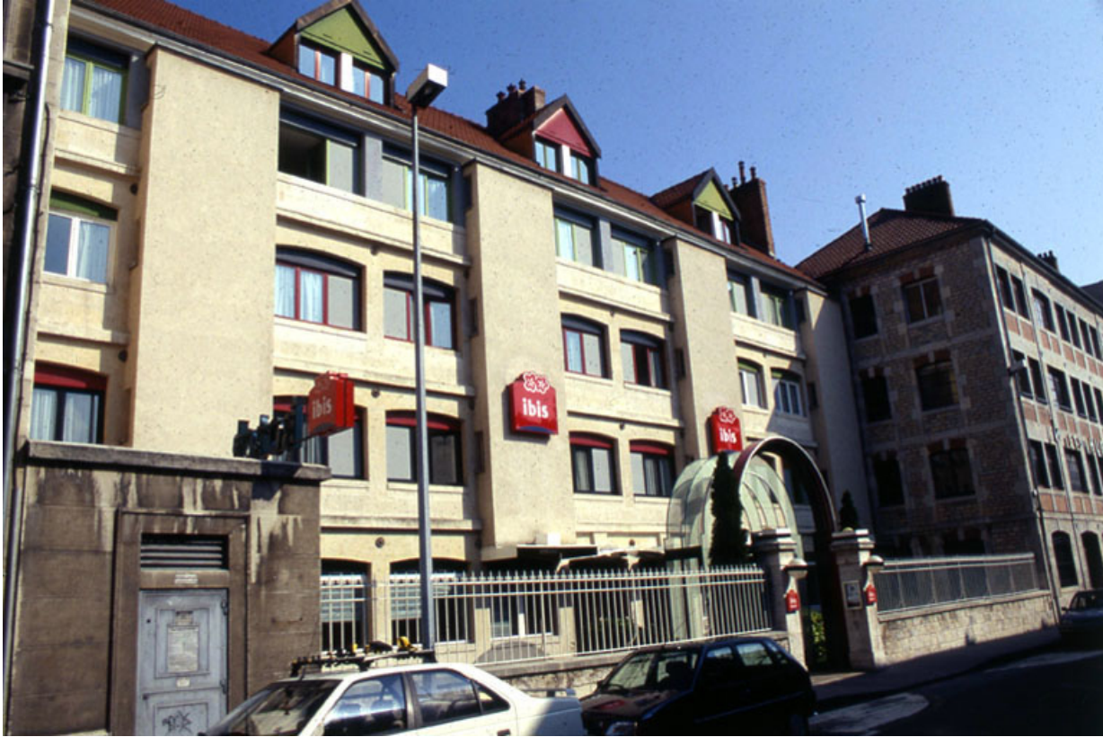
Façade antérieure : de trois quarts gauche.