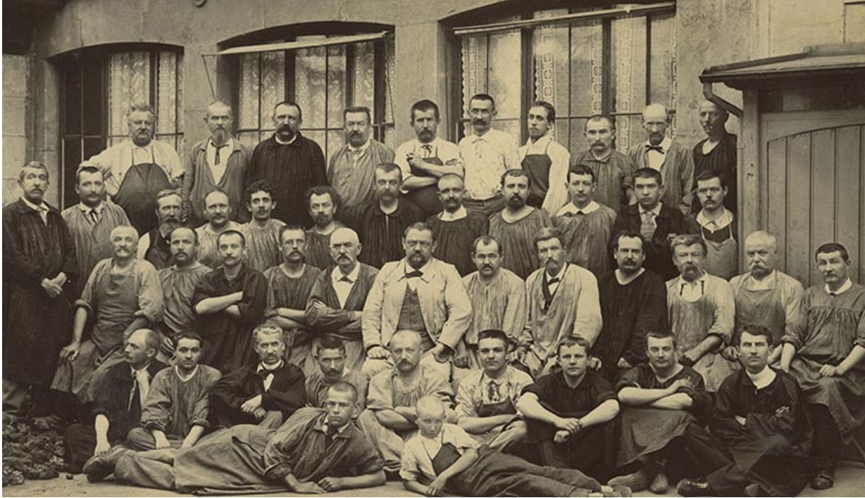
Ouvriers de la Société Générale des monteurs de boîtes d'or (?), 1899. 25, Besançon, 21 rue Gambetta