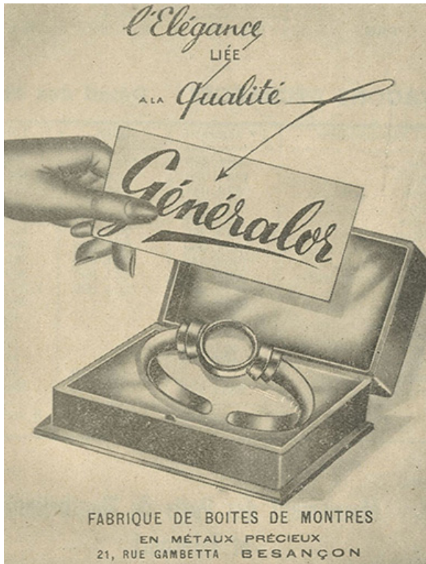
Fabrique de boîtes de montres Généralor, 1952. 25, Besançon, 21 rue Gambetta