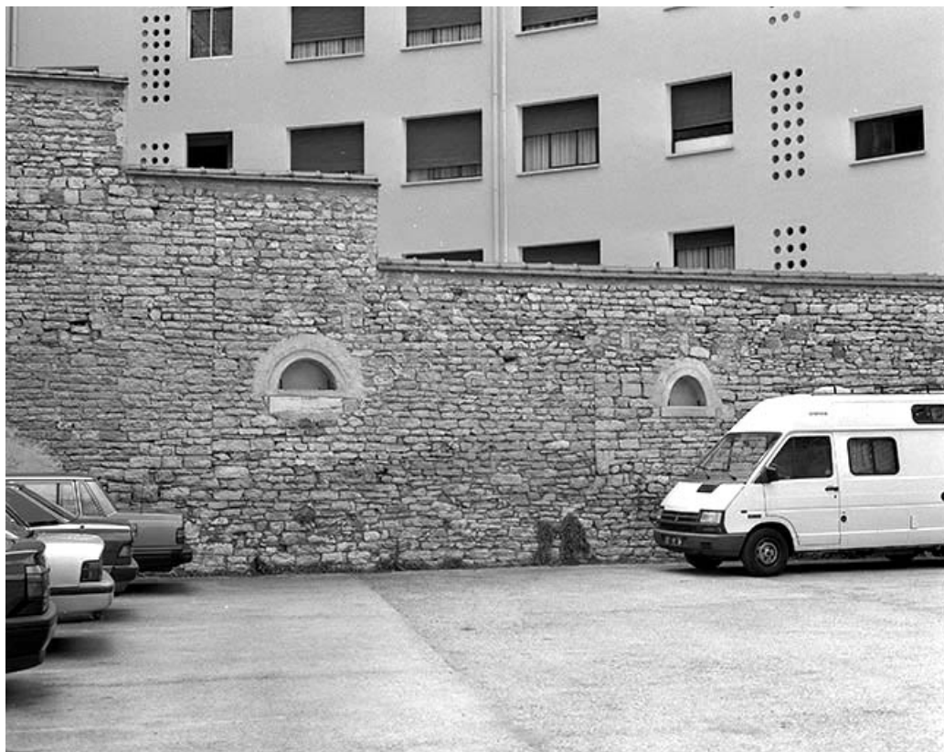
Cour : détail du mur de clôture droit.