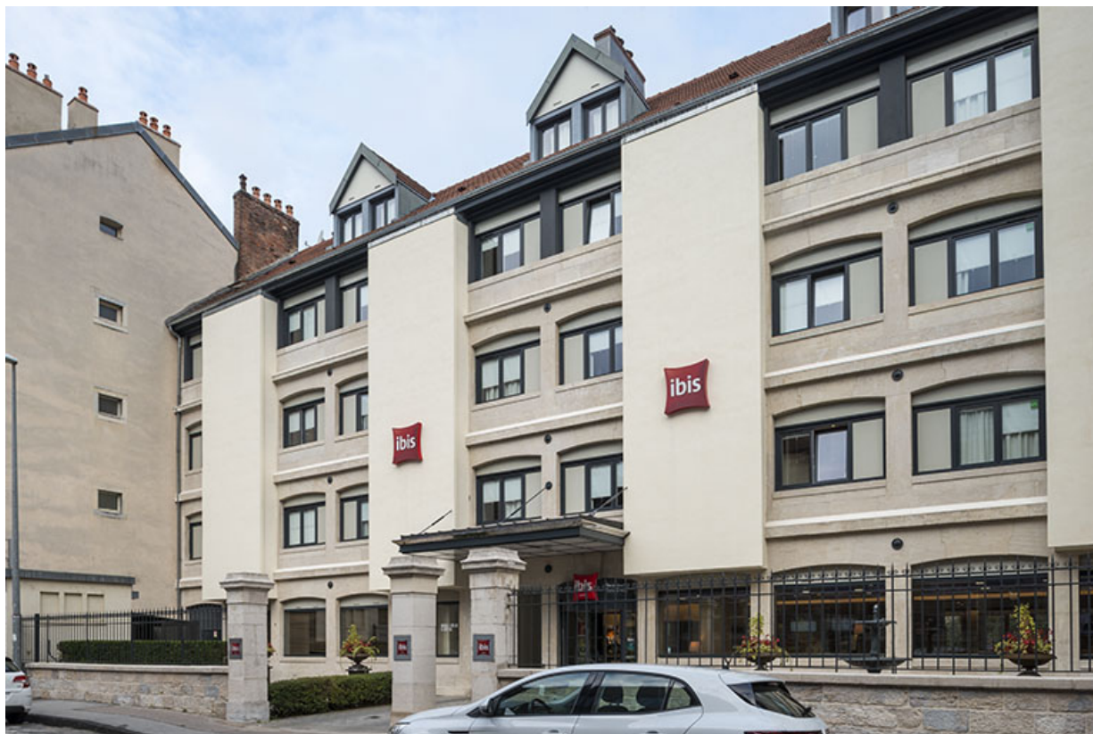
Façade antérieure vue de trois quarts droite. 25, Besançon, 21 rue Gambetta