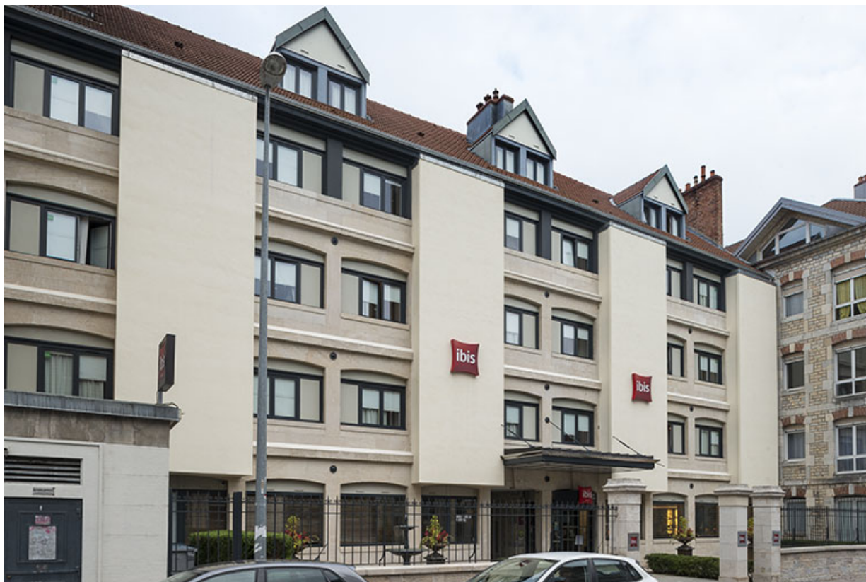
Façade antérieure vue de trois quarts gauche. 25, Besançon, 21 rue Gambetta