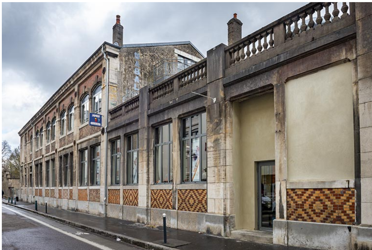
Vue rapprochée depuis le sud-ouest (après travaux).