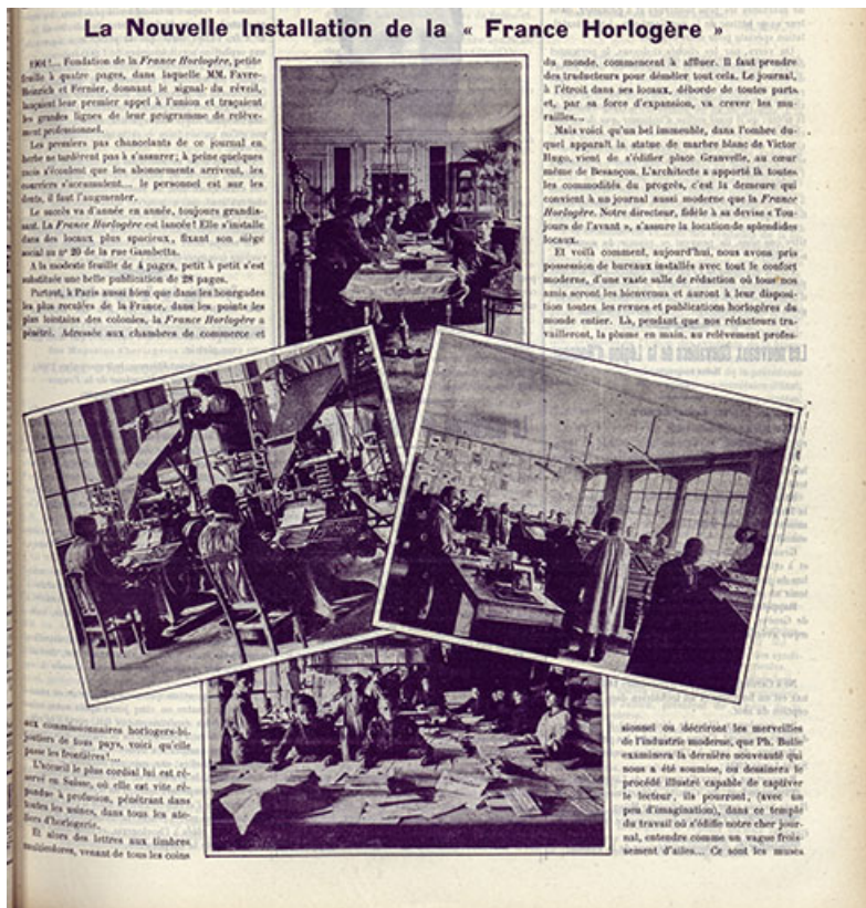
La nouvelle installation de la "France Horlogère", 1906. 25, Besançon, 20 rue Gambetta