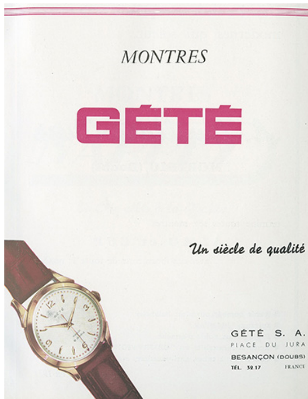
Montres Gété, 1954.

25, Besançon, 4 place De Lattre de Tassigny