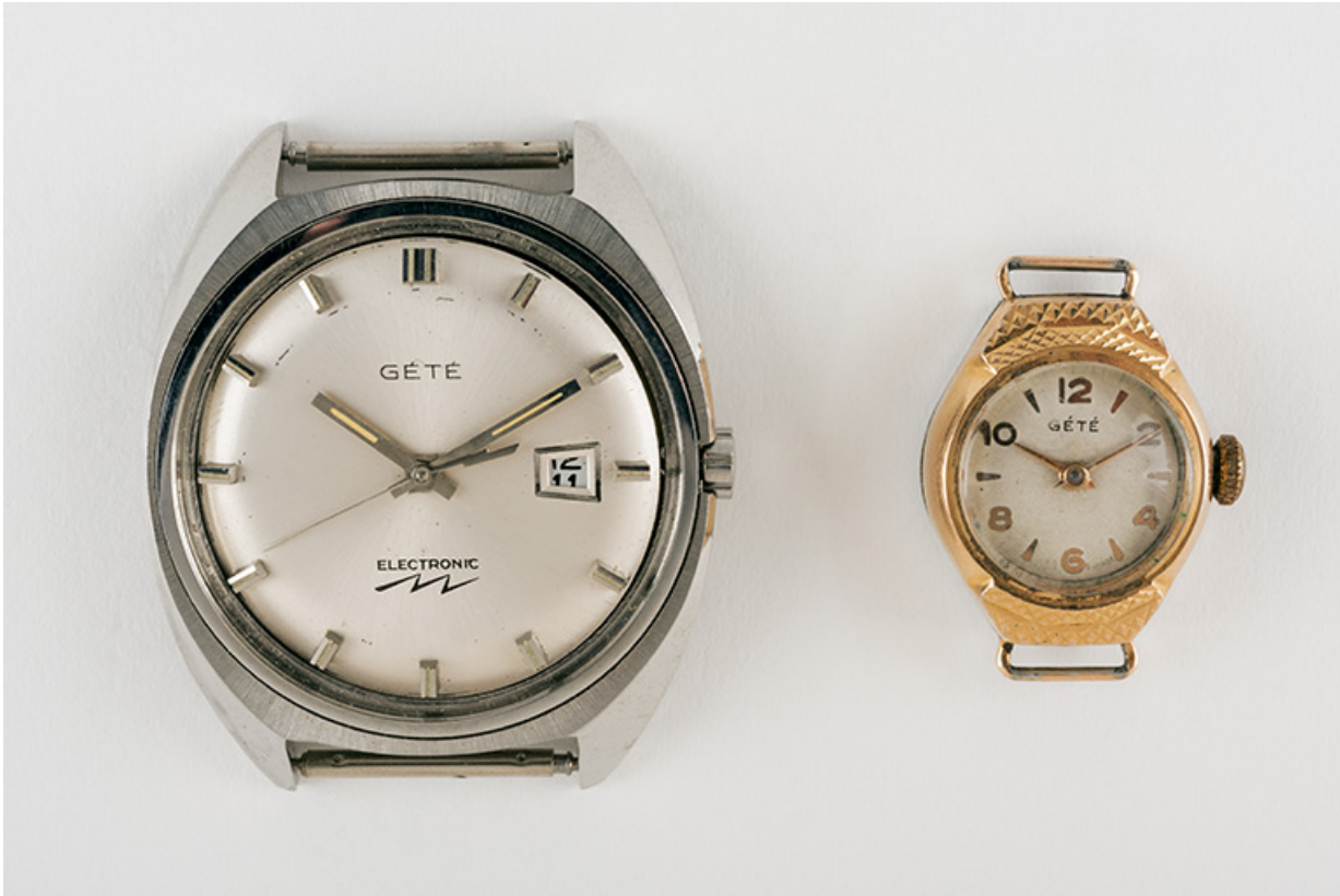
Montres Gété. (Fonds Horloger de Battant). 25, Besançon