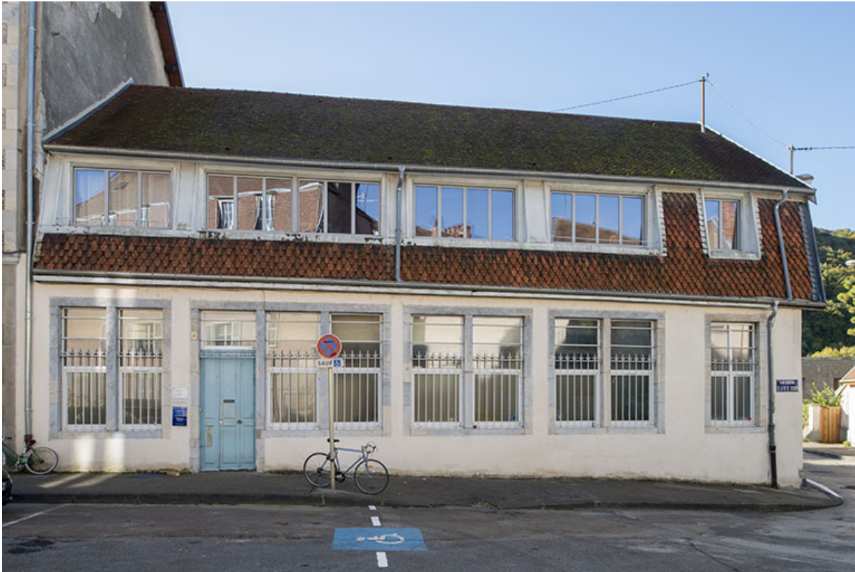
Façade nord de l'atelier.

25, Besançon, 4 place De Lattre de Tassigny