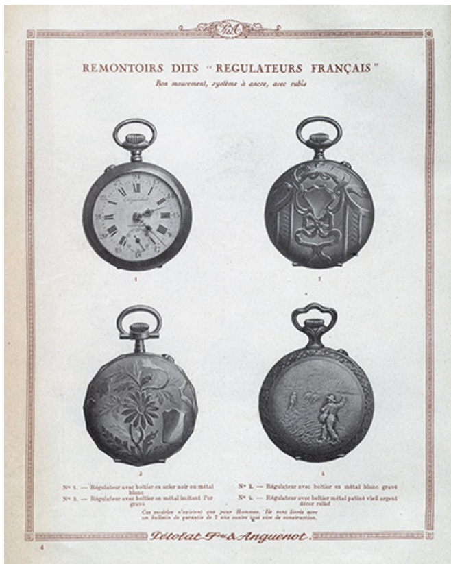
Catalogue Pétolat Frères et Anguenot, s.d. [vers 1930]. 25, Besançon, 19 rue Nicolas Bruand