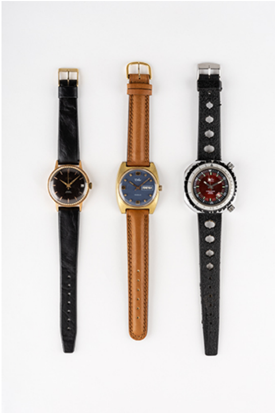
Montres Difor, 2e moitié 20e siècle. (Collection musée du Temps, Besançon). 25, Besançon