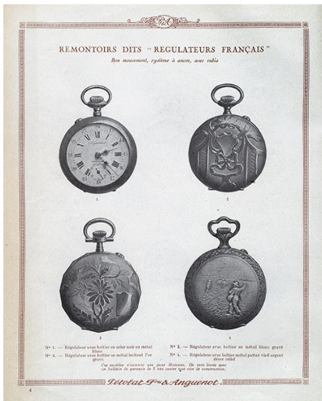
Catalogue Pétolat Frères et Anguenot, s.d. [vers 1930]. 25, Besançon, 19 rue Nicolas Bruand