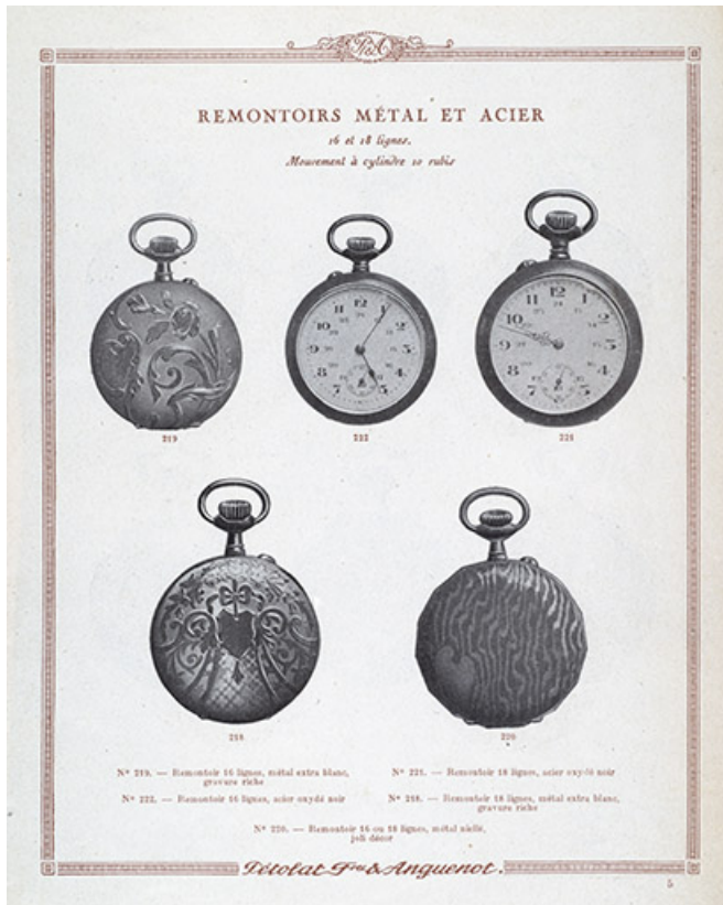
Catalogue Pétolat Frères et Anguenot, s.d. [vers 1930]. 25, Besançon, 19 rue Nicolas Bruand