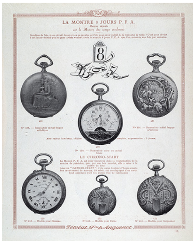
Catalogue Pétolat Frères et Anguenot, s.d. [vers 1930]. 25, Besançon, 19 rue Nicolas Bruand