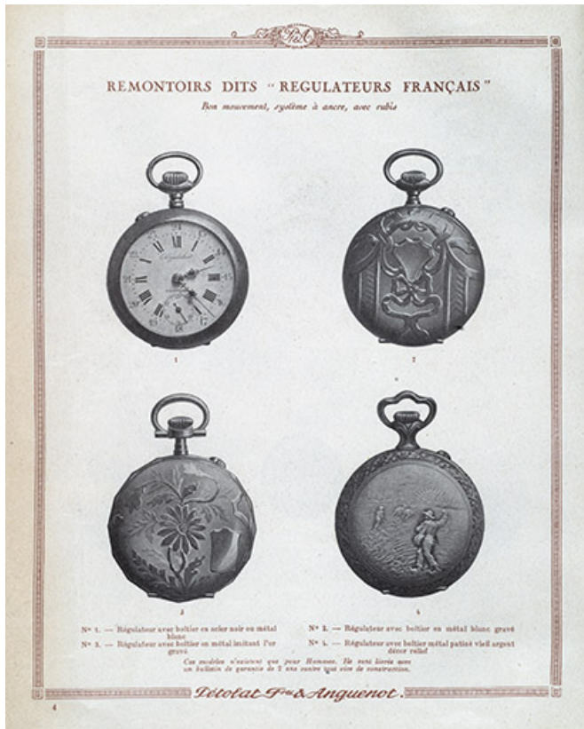
Catalogue Pétolat Frères et Anguenot, s.d. [vers 1930]. 25, Besançon, 19 rue Nicolas Bruand