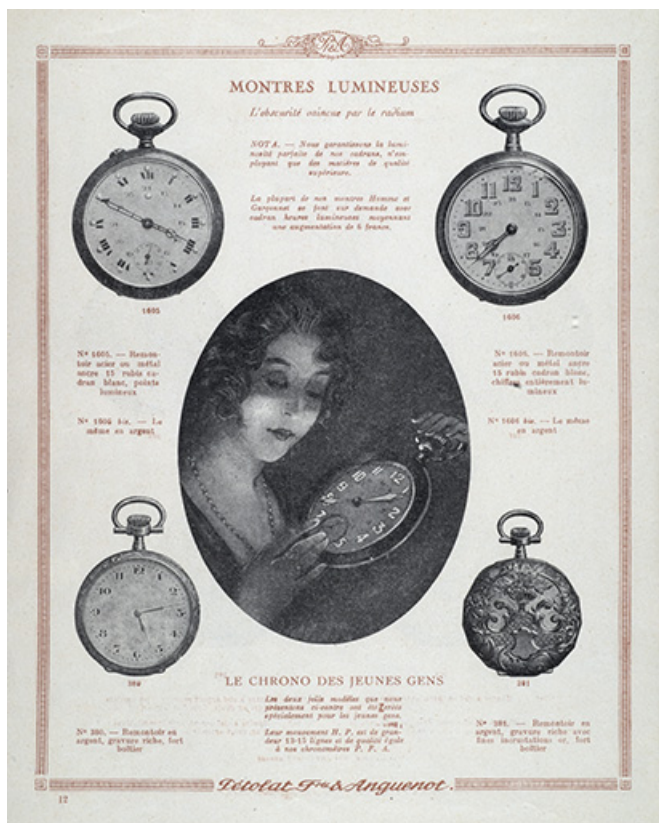
Catalogue Pétolat Frères et Anguenot, s.d. [vers 1930]. 25, Besançon