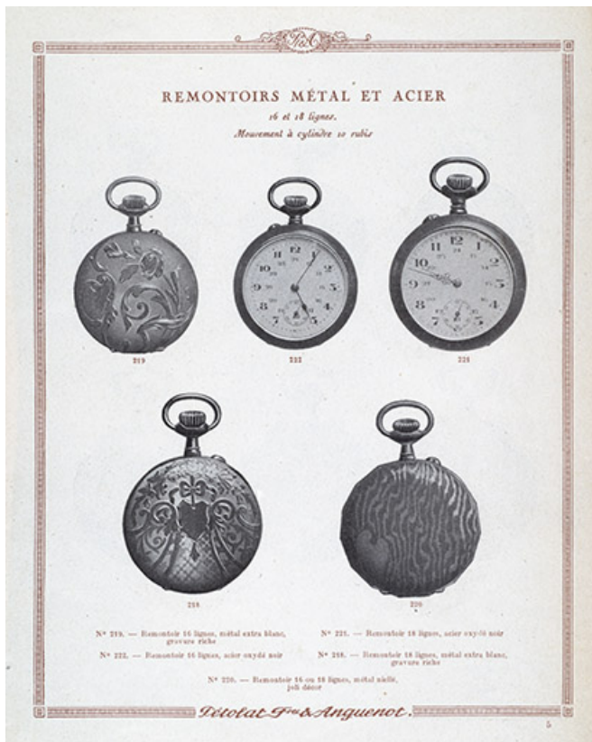
Catalogue Pétolat Frères et Anguenot, s.d. [vers 1930]. 25, Besançon, 19 rue Nicolas Bruand