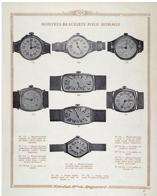
Catalogue Pétolat Frères et Anguenot, s.d. [vers 1930].