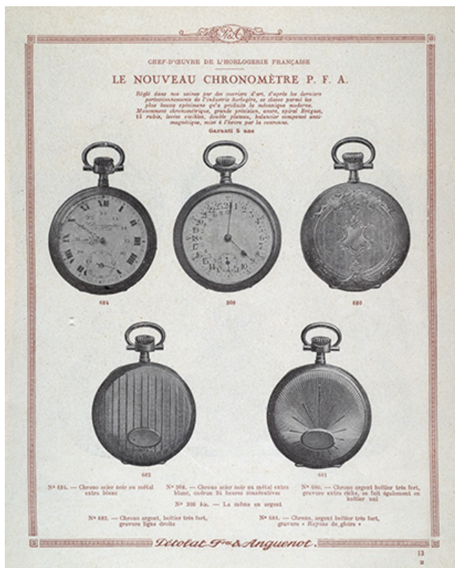
Catalogue Pétolat Frères et Anguenot, s.d. [vers 1930]. 25, Besançon, 19 rue Nicolas Bruand