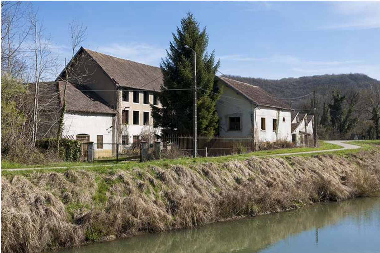
Vue de trois quarts depuis l'Eurovéloroute 6.