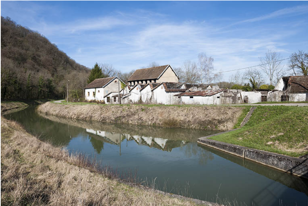
Vue d'ensemble depuis le pont franchissant le canal.