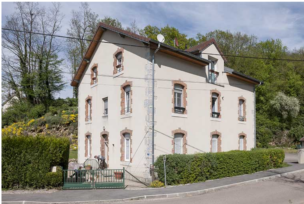
Logement (ou bureau ?) à l'entrée du site. 25, Montferrand-le-Château rue de Voide