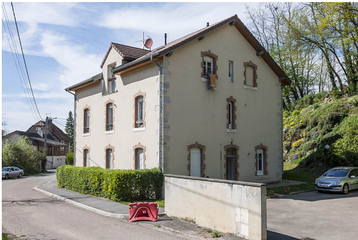
Logement (ou bureau ?) à l'entrée du site. Vue de trois quarts.