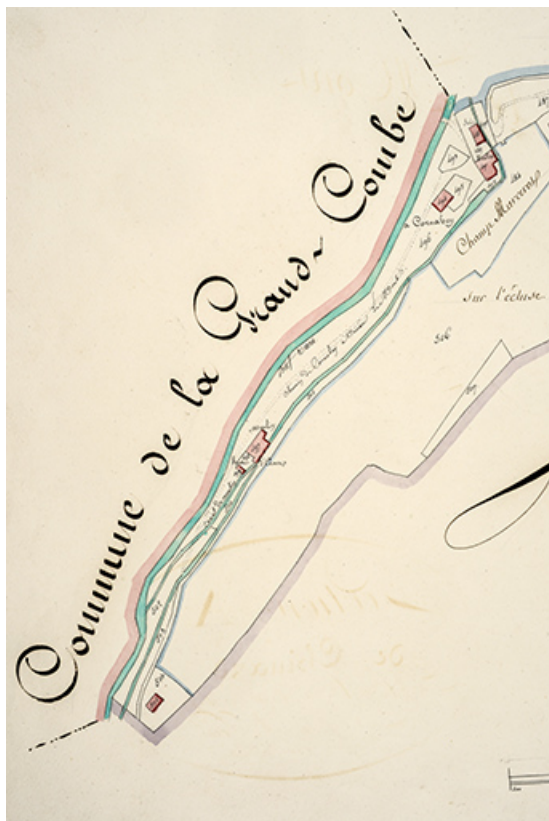
Cadastre de la commune de Montlebon. Atlas parcellaire, 1814, section A 2e feuille [détail : Cornabey], 1/2 500. 25, Montlebon