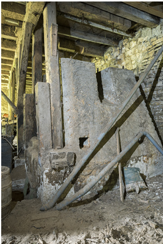
Scierie : socle en maçonnerie d'un châssis de scie. 25, Montlebon, 17 rue du Moulin, lieudit : Cornabey