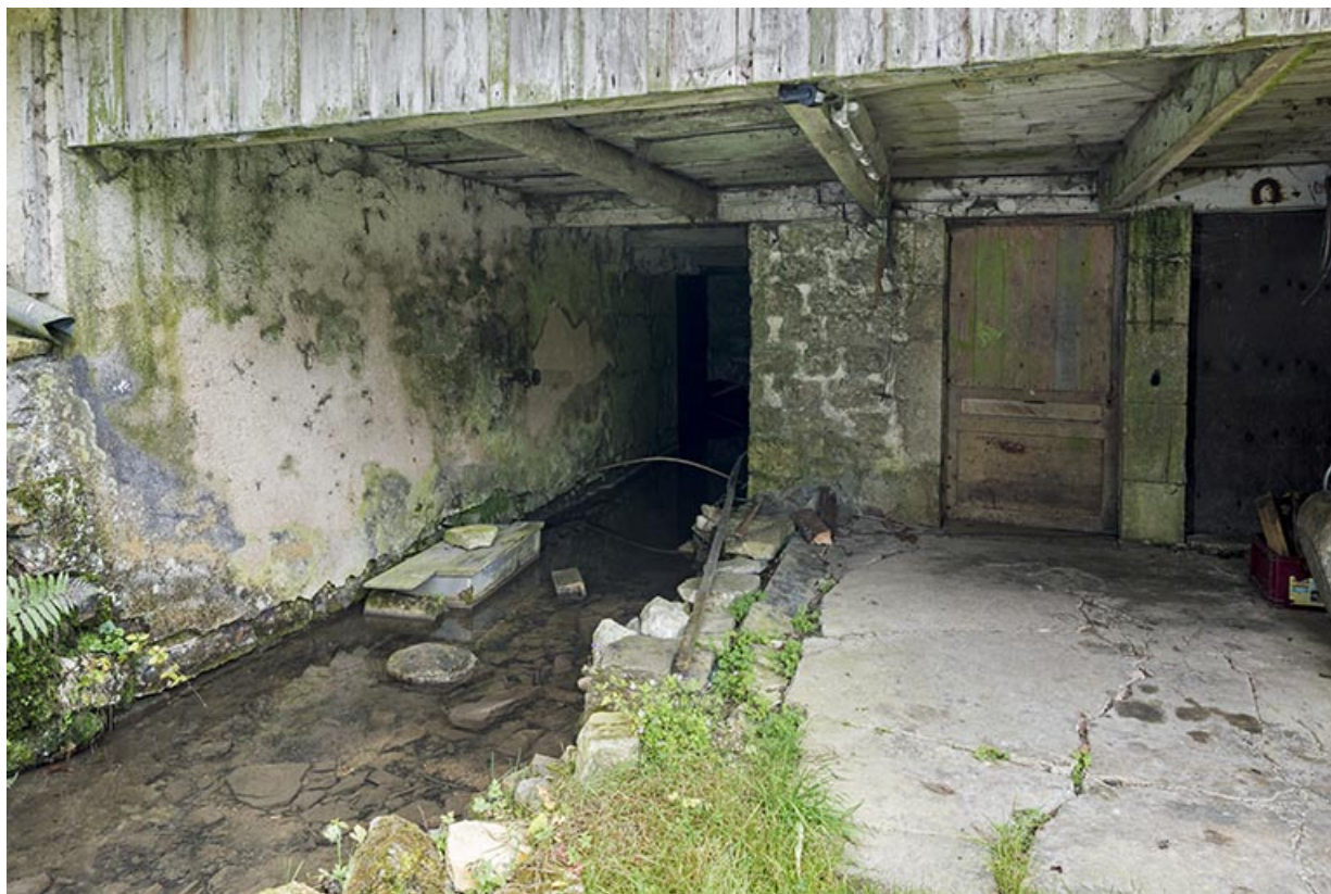
Moulin : canal de fuite sous le bâtiment (façade nord).

25, Montlebon, 17 rue du Moulin, lieudit : Cornabey