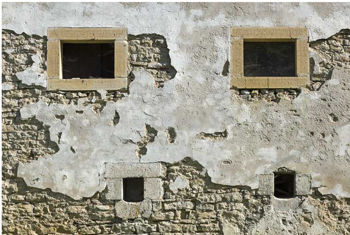
Moulin : fenêtres sur la façade ouest.

25, Montlebon, 17 rue du Moulin, lieudit : Cornabey