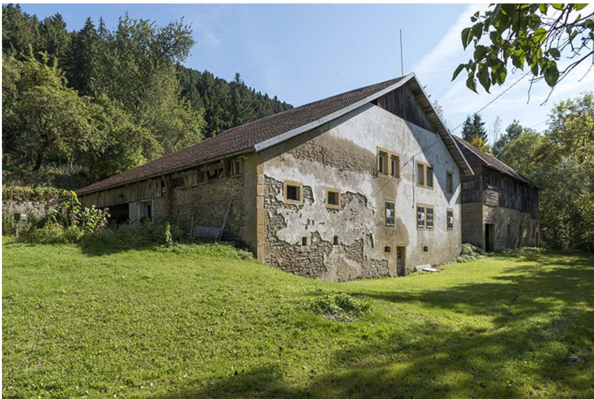
Moulin (à gauche) et scierie (à droite) : façades nord et ouest. 25, Montlebon