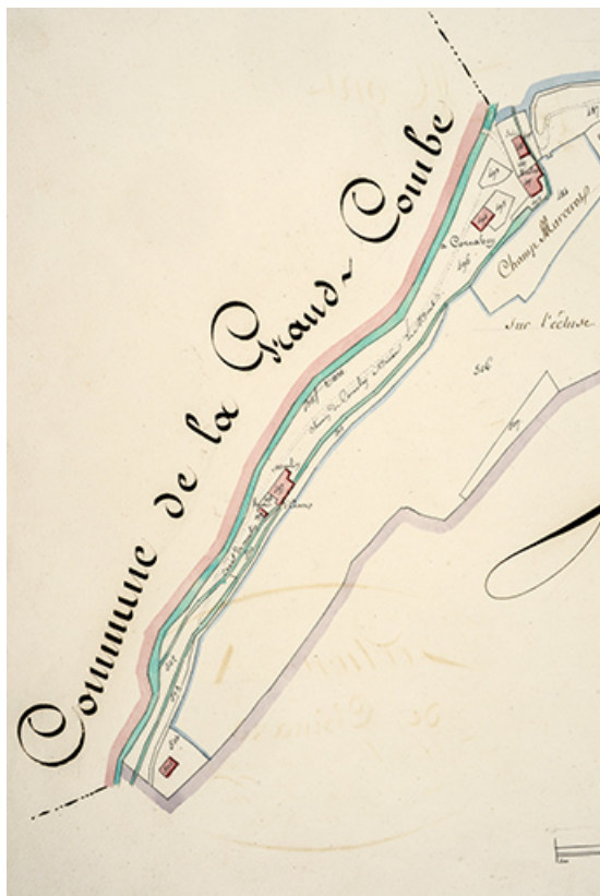
Cadastre de la commune de Montlebon. Atlas parcellaire, 1814, section A 2e feuille [détail : Cornabey], 1/2 500. 25, Montlebon