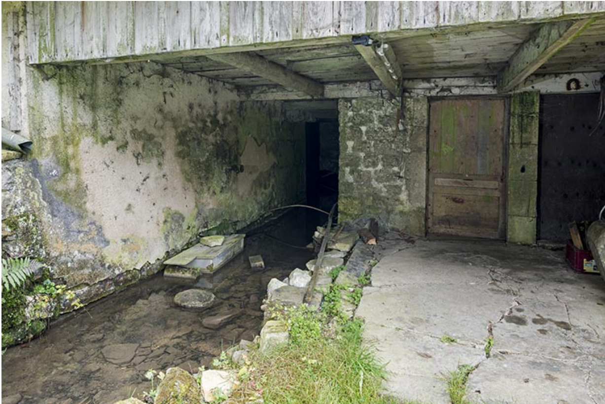
Moulin : canal de fuite sous le bâtiment (façade nord).

25, Montlebon, 17 rue du Moulin, lieudit : Cornabey