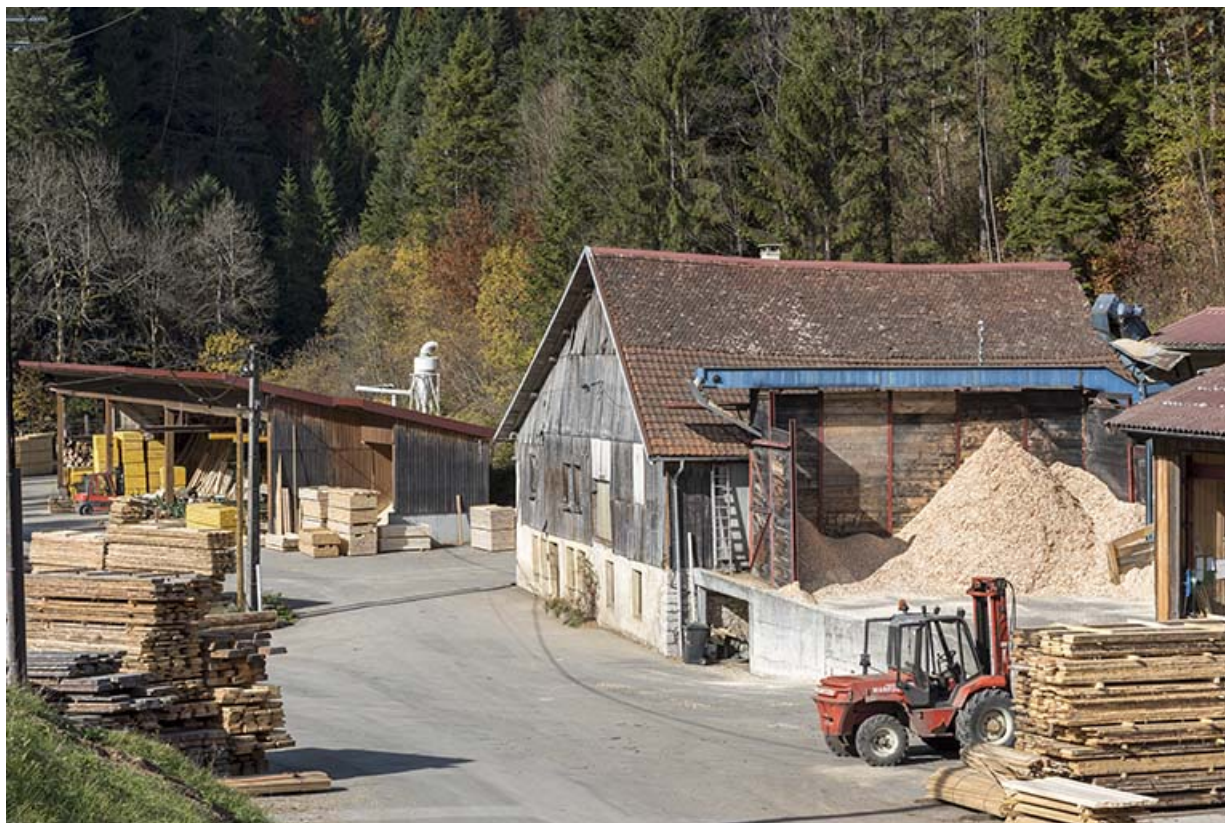
Ancienne scierie et ateliers à l'ouest. 25, Montlebon