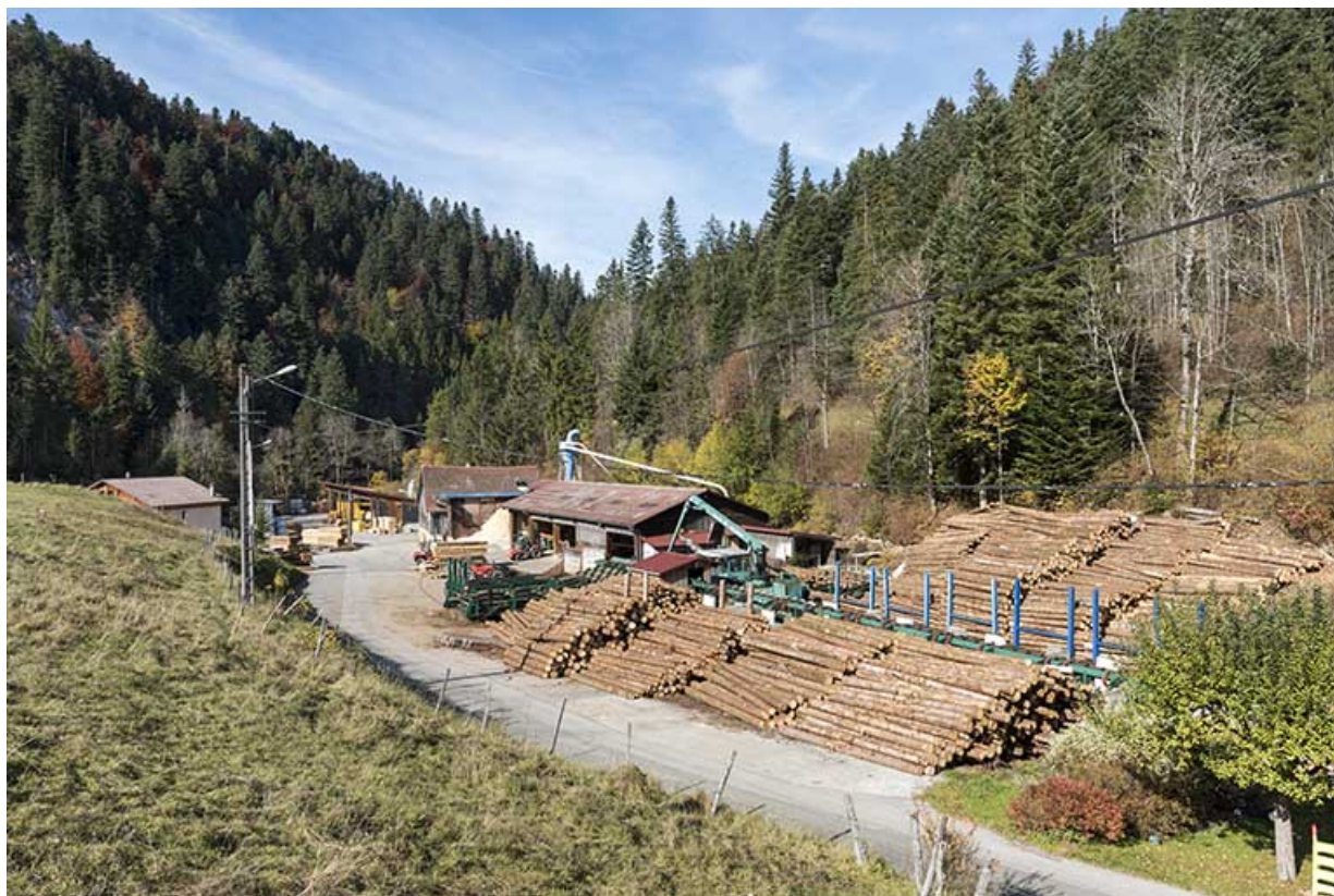
Vue d'ensemble du site, depuis le sud-est.