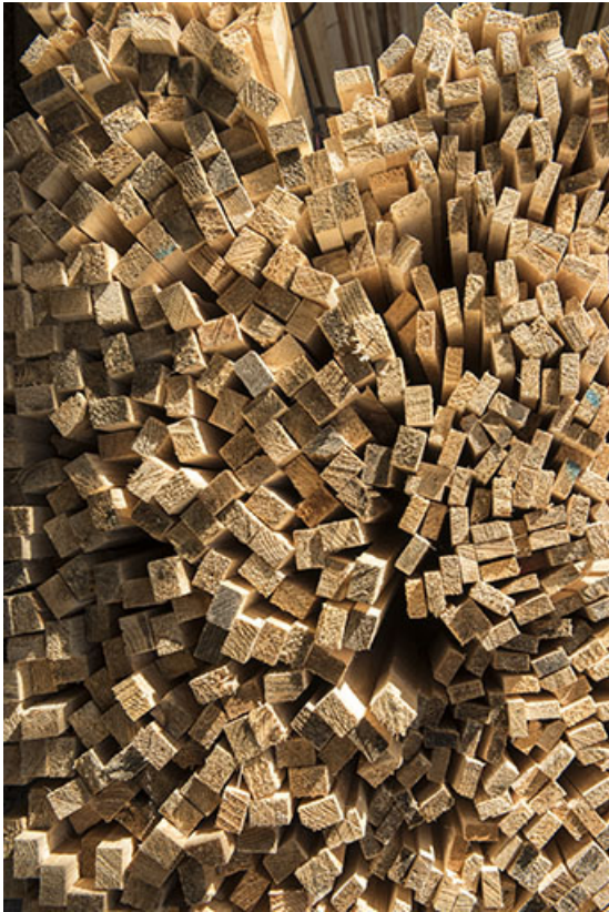
Botte de liteaux (détail).