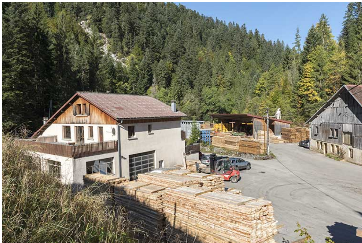
Vue d'ensemble des bureaux, des ateliers à l'ouest et de l'ancienne scierie. 25, Montlebon, lieudit : Louadey