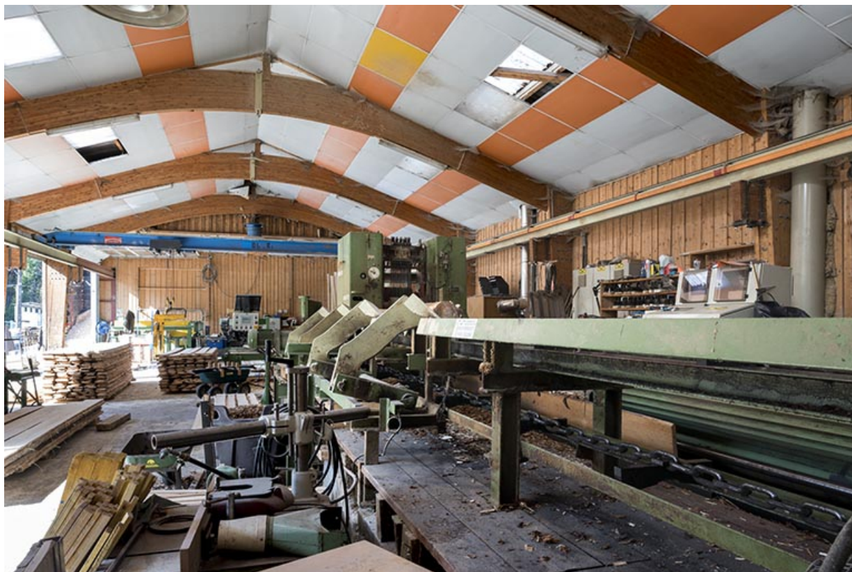
Nouvelle scierie : intérieur avec le châssis de scie Möhringer. 25, Montlebon, lieudit : Louadey