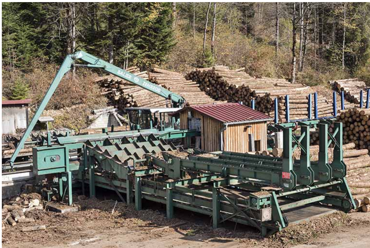
Chariot de tronçonnage Baljer Zembrod et écorceuse.