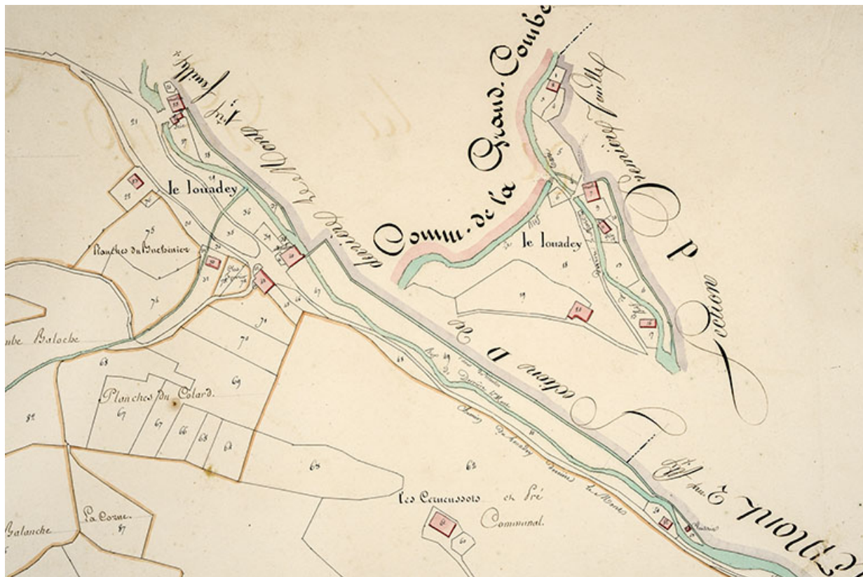
Cadastre de la commune de Montlebon. Atlas parcellaire, 1814, section E [détail : partie nord (le Louadey)], 1/2 500. 25, Montlebon