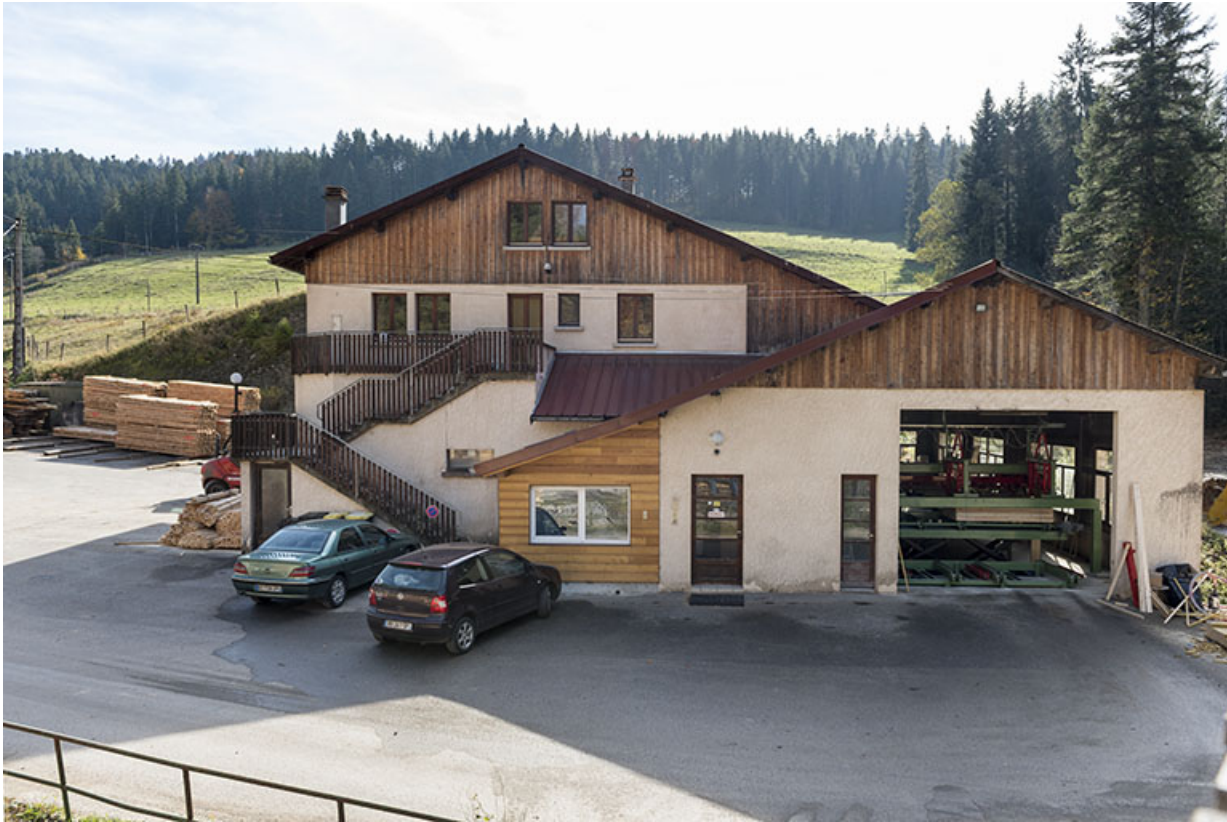
Bureaux et ateliers de conditionnement et de réparation.