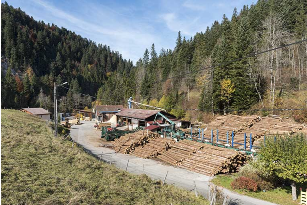
Vue d'ensemble du site, depuis le sud-est.