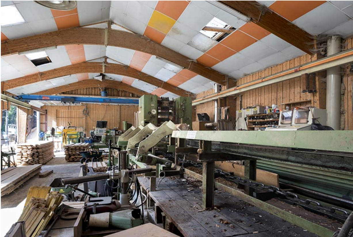
Nouvelle scierie : intérieur avec le châssis de scie Möhringer.