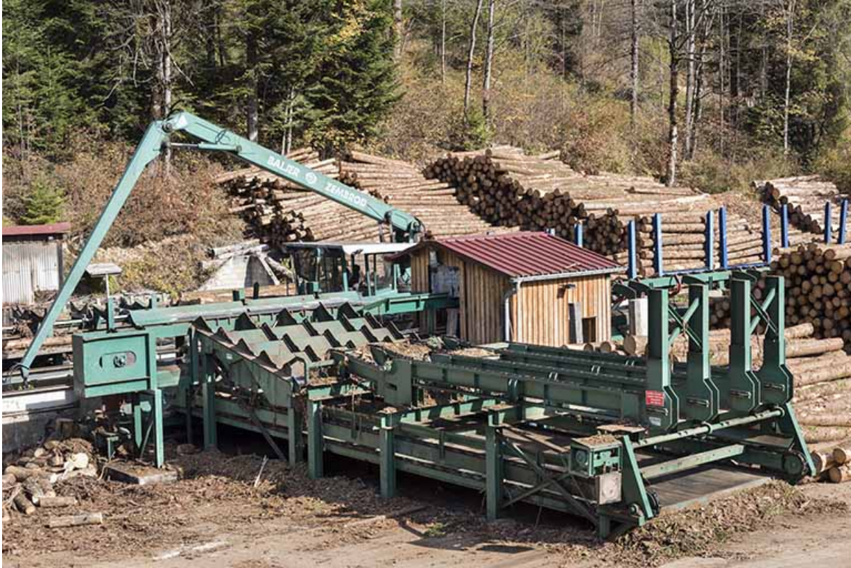
Chariot de tronçonnage Baljer Zembrod et écorceuse.