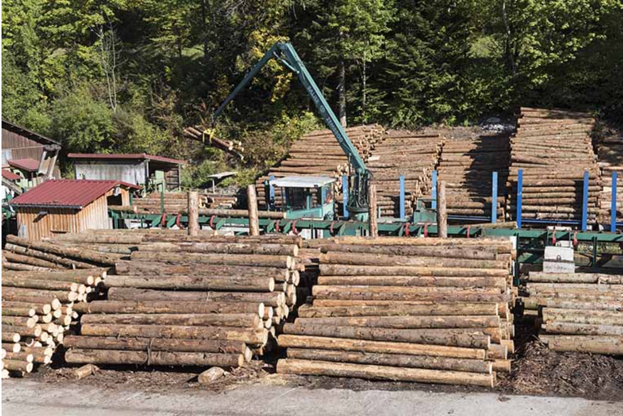
Chariot de tronçonnage Baljer Zembrod.