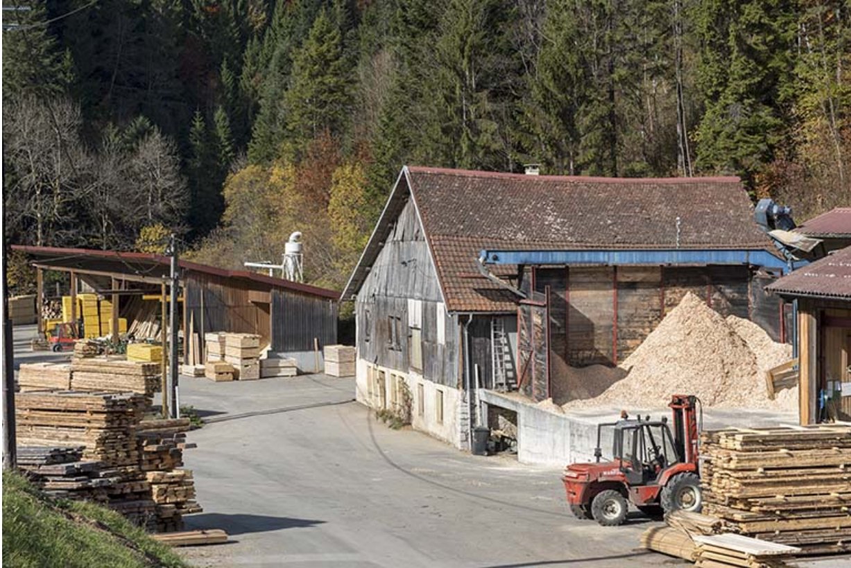
Ancienne scierie et ateliers à l'ouest. 25, Montlebon