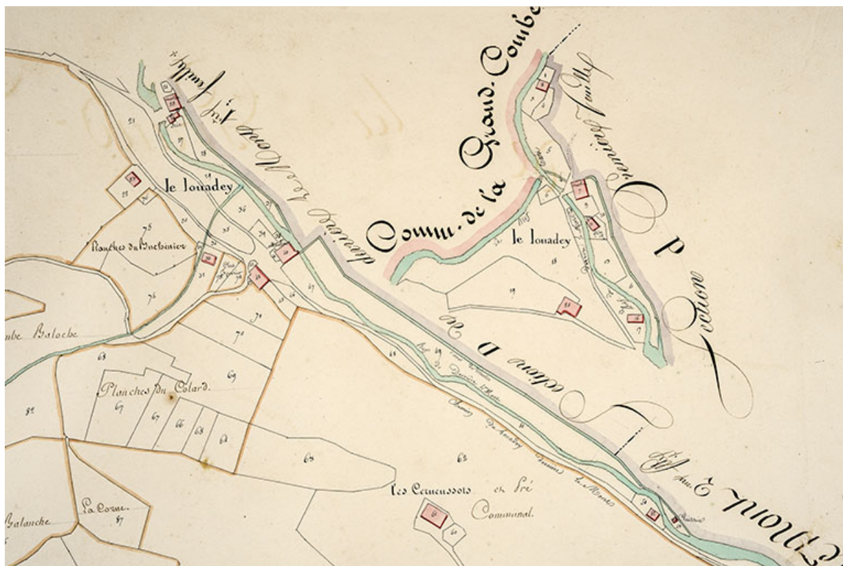
Cadastre de la commune de Montlebon. Atlas parcellaire, 1814, section E [détail : partie nord (le Louadey)], 1/2 500. 25, Montlebon