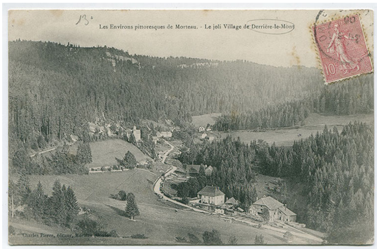
Les environs pittoresques de Morteau. - Le joli village de Derrière-le-Mont, fin 19e siècle ou début 20e siècle [avant 1906 ?]. 25, Montlebon, 16 rue des Coquillards, lieu-dit : Derrière le Mont