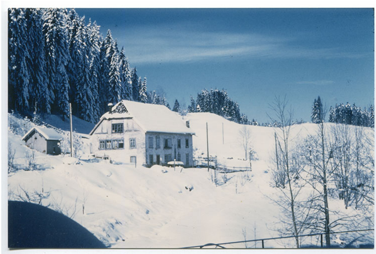
[Vue d'ensemble du bâtiment depuis l'est], 4e quart 20e siècle. 25, Montlebon, 16 rue des Coquillards, lieudit : Derrière le Mont