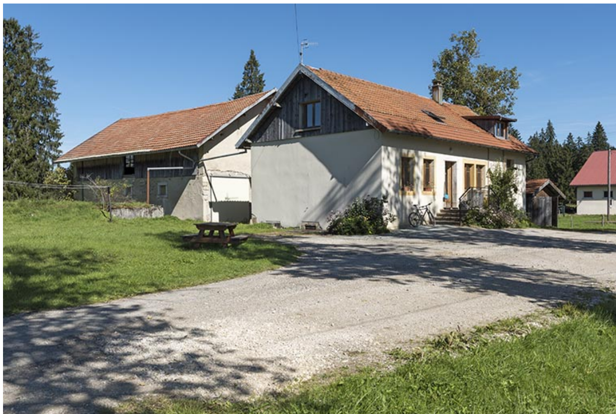
Porcherie et fromagerie, vues du sud.