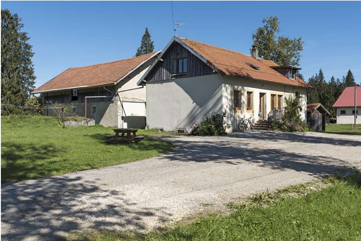
Porcherie et fromagerie, vues du sud.