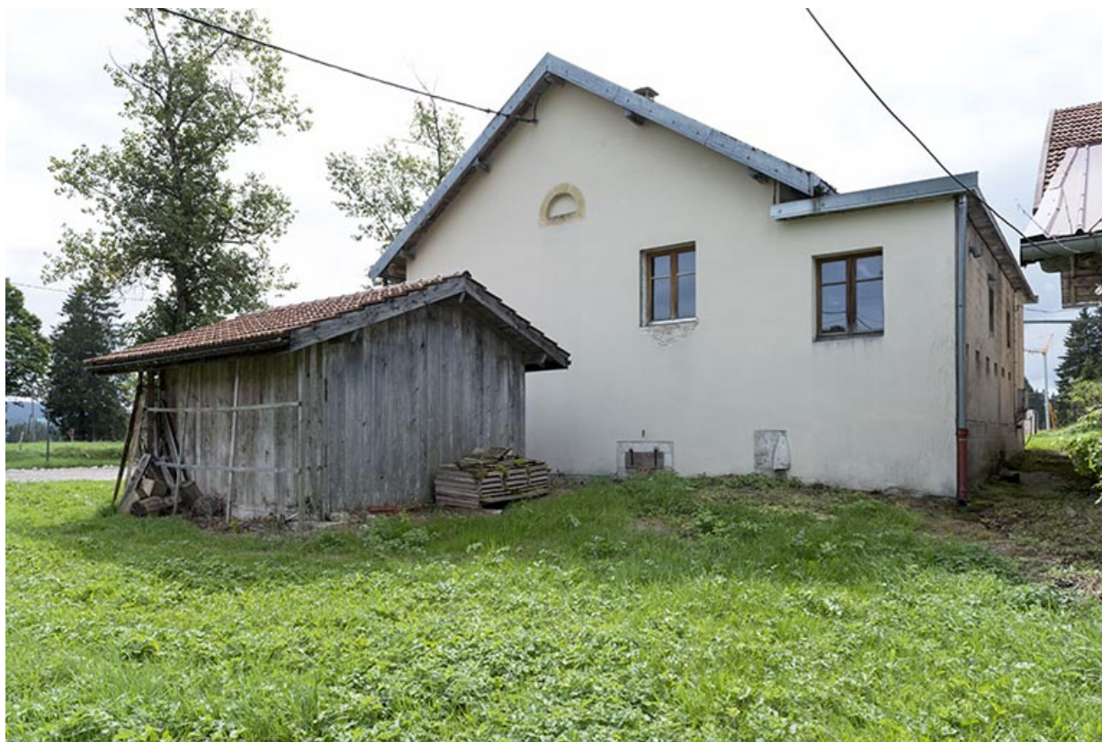
Fromagerie : façade latérale droite.