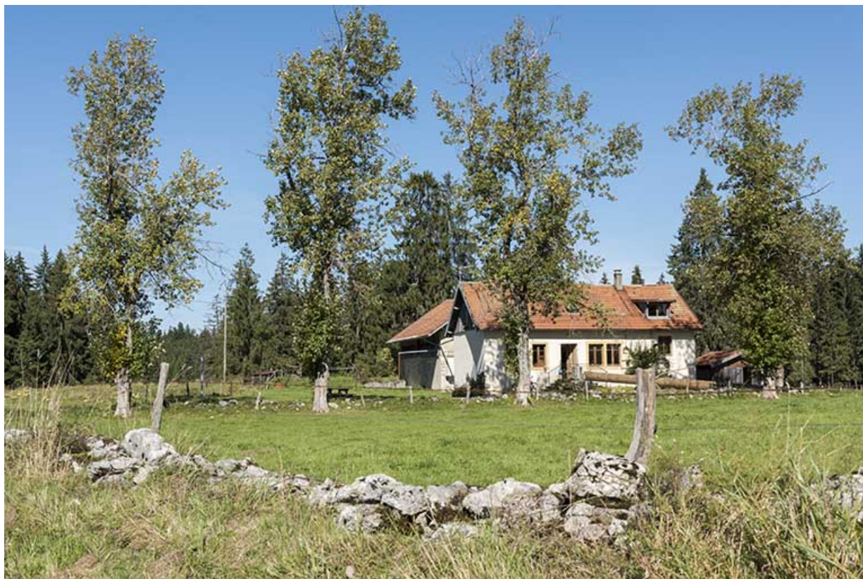
Vue d'ensemble, depuis le sud.