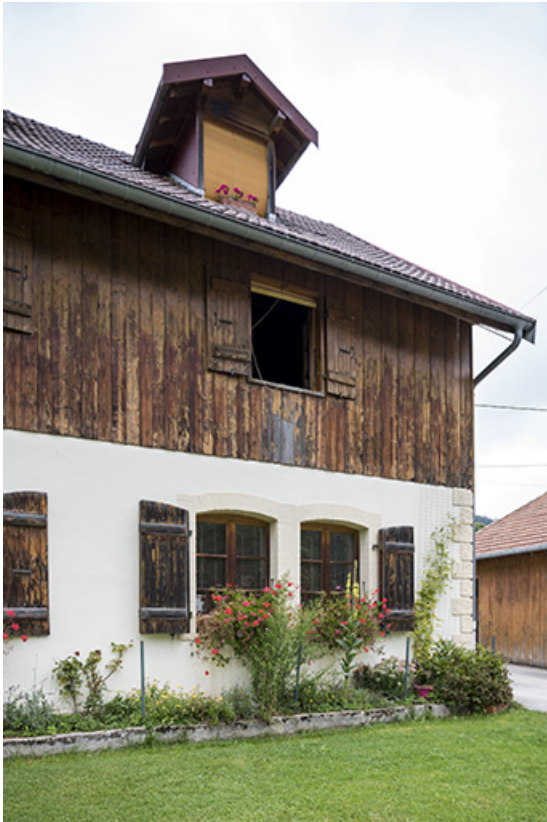
Façade antérieure : fenêtres horlogères.

25, Grand'Combe-Châteleu, lieudit : le Bas de la Fin