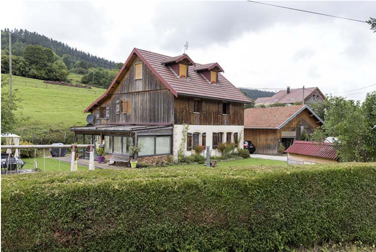
Vue d'ensemble, depuis le sud.

25, Grand'Combe-Châteleu, lieudit : le Bas de la Fin