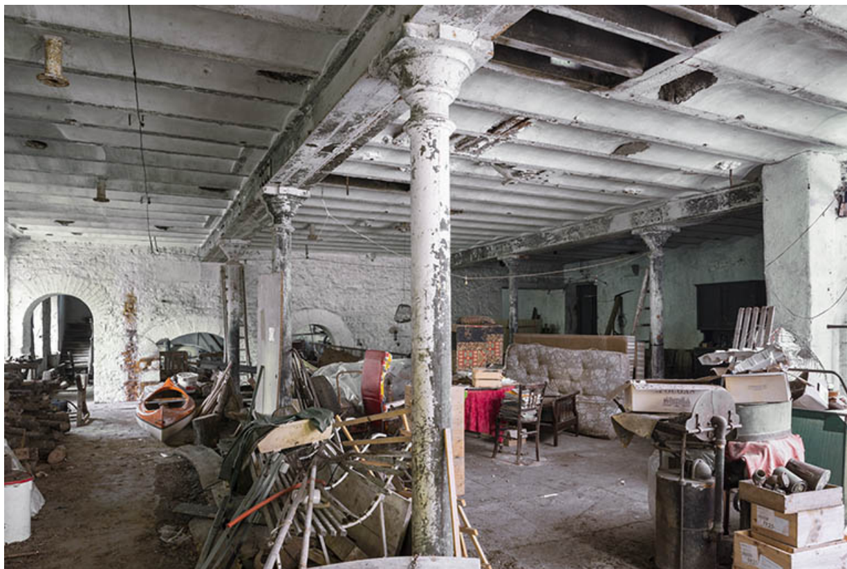
Atelier de fabrication. Vue du rez-de-chaussée. 25, Chevroz chemin de l'Île