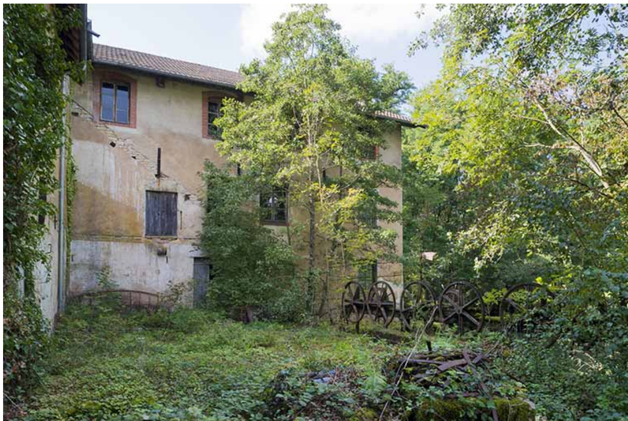
Façade postérieure de l'atelier de fabrication.