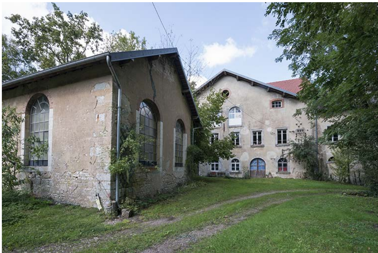
Local de la machine à vapeur (ou chaufferie ?) et atelier de fabrication.