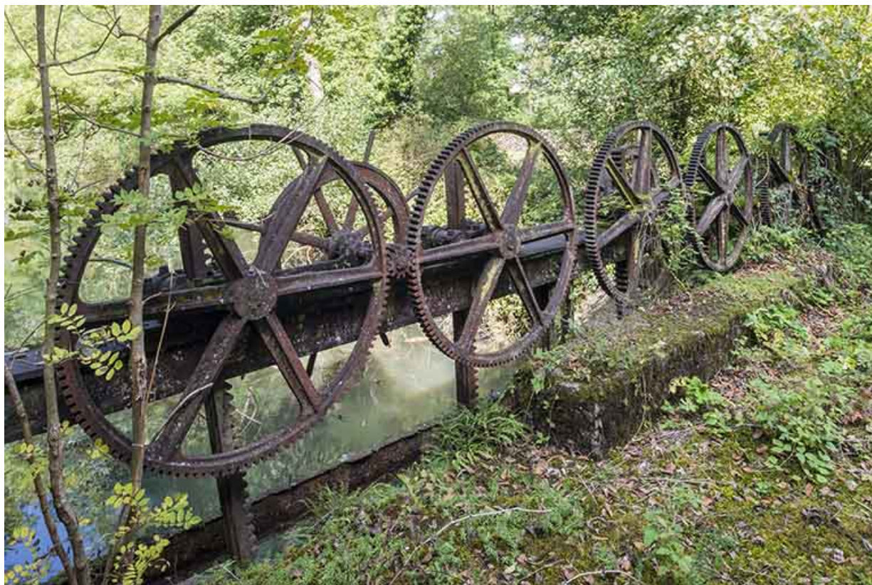
Mécanisme de levage du vannage.