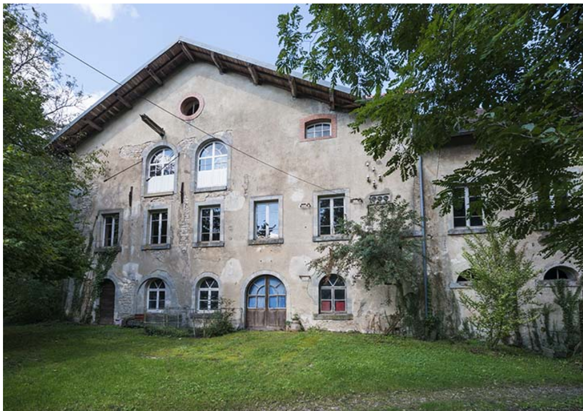
Façade antérieure de l'atelier de fabrication.