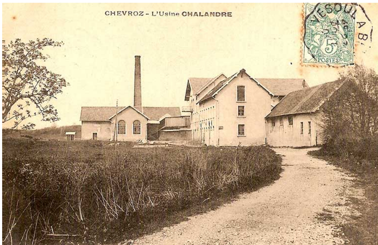
Chevroz - L'Usine Chalandre, carte postale, s.d. [fin 19e ou début 20e siècle].