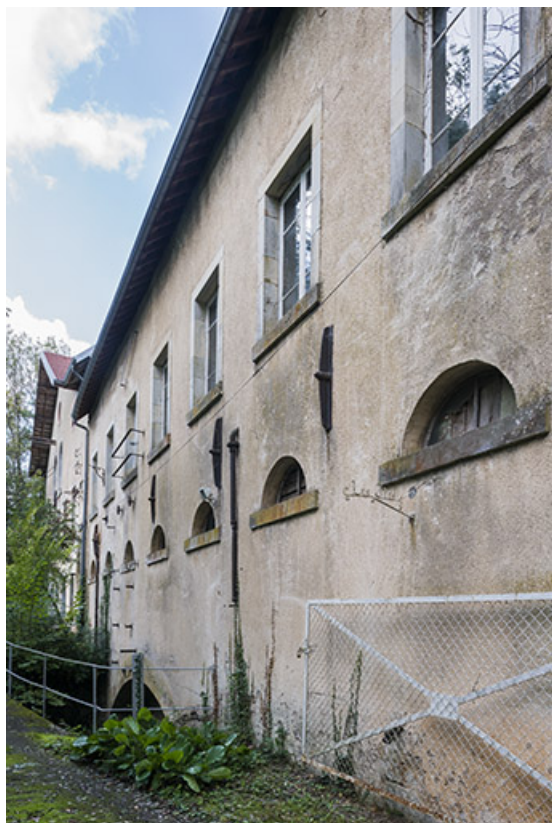
Façade antérieure. Vue depuis l'entrée.