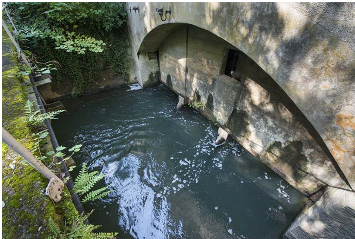
Canal de fuite en sortie de l'atelier.