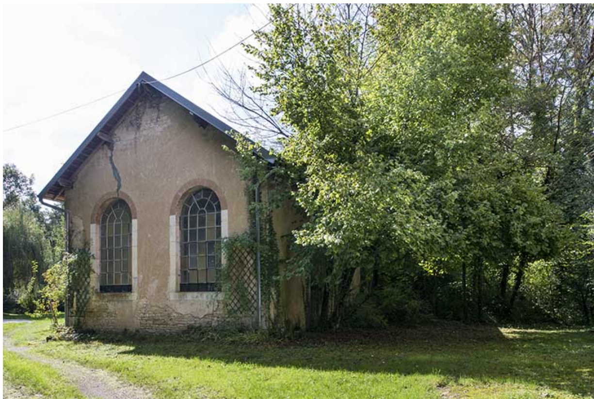
Local de la machine à vapeur (ou chaufferie ?).