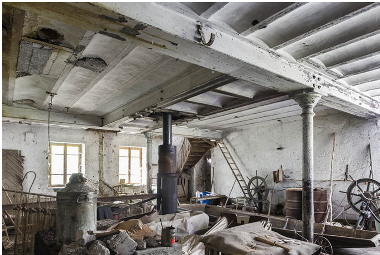
Rez-de-chaussée de l'atelier de fabrication. Au centre, arbre de la turbine.