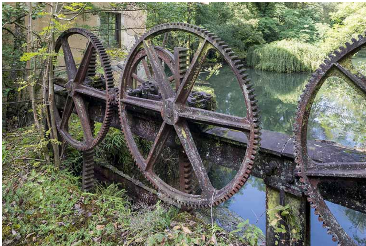
Vannage du canal d'amenée. Détail du mécanisme de levage.