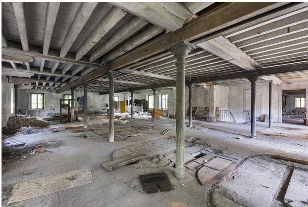
Atelier de fabrication principal (1er étage). Vue d'ensemble.