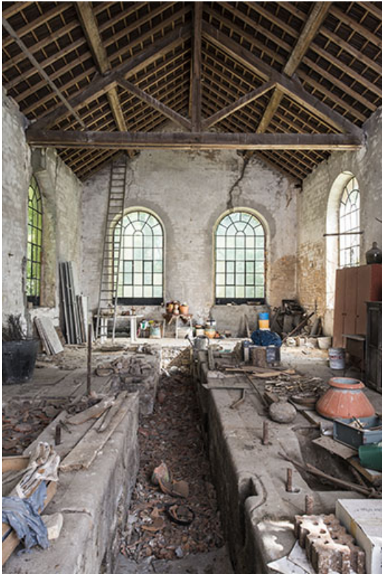
Intérieur de la salle de la machine à vapeur.