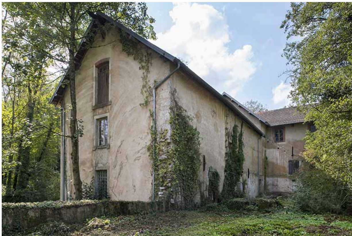
Atelier de fabrication vu de trois quarts arrière.