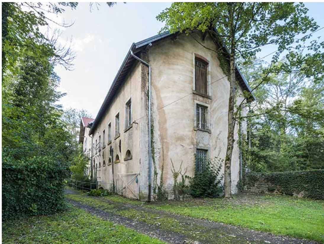
Vue de trois quarts depuis l'entrée.