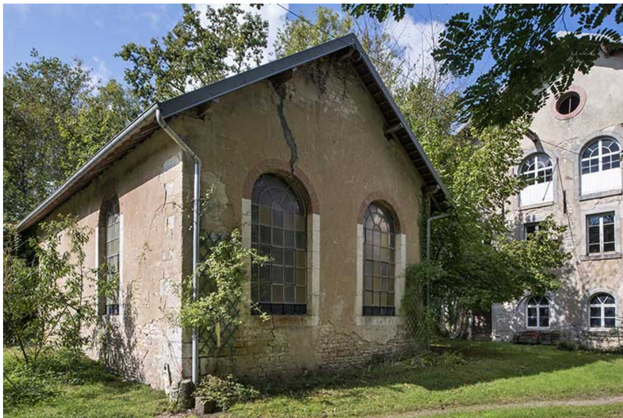
Salle de la machine à vapeur.