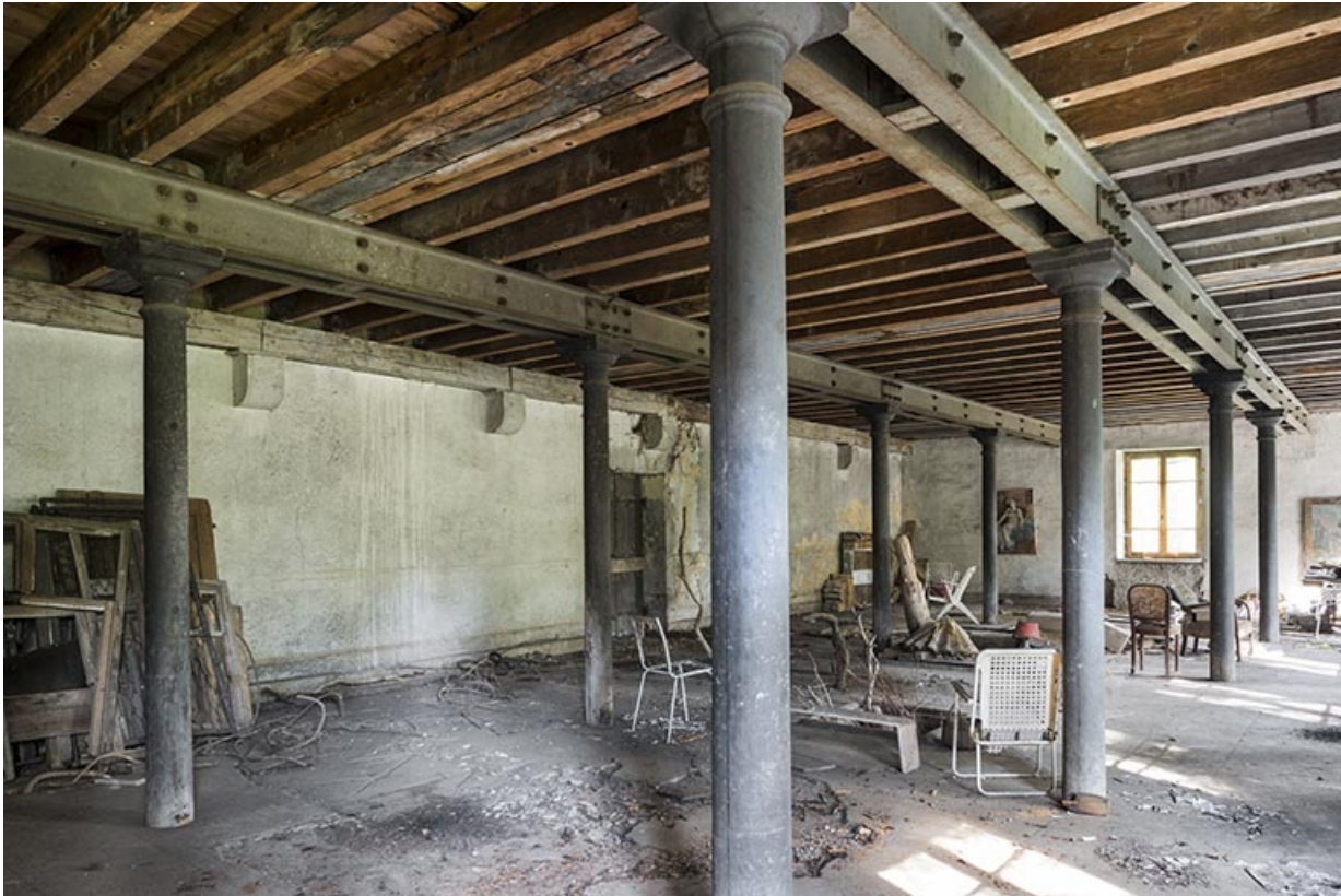
Atelier de fabrication (partie est). Vue de trois quarts.