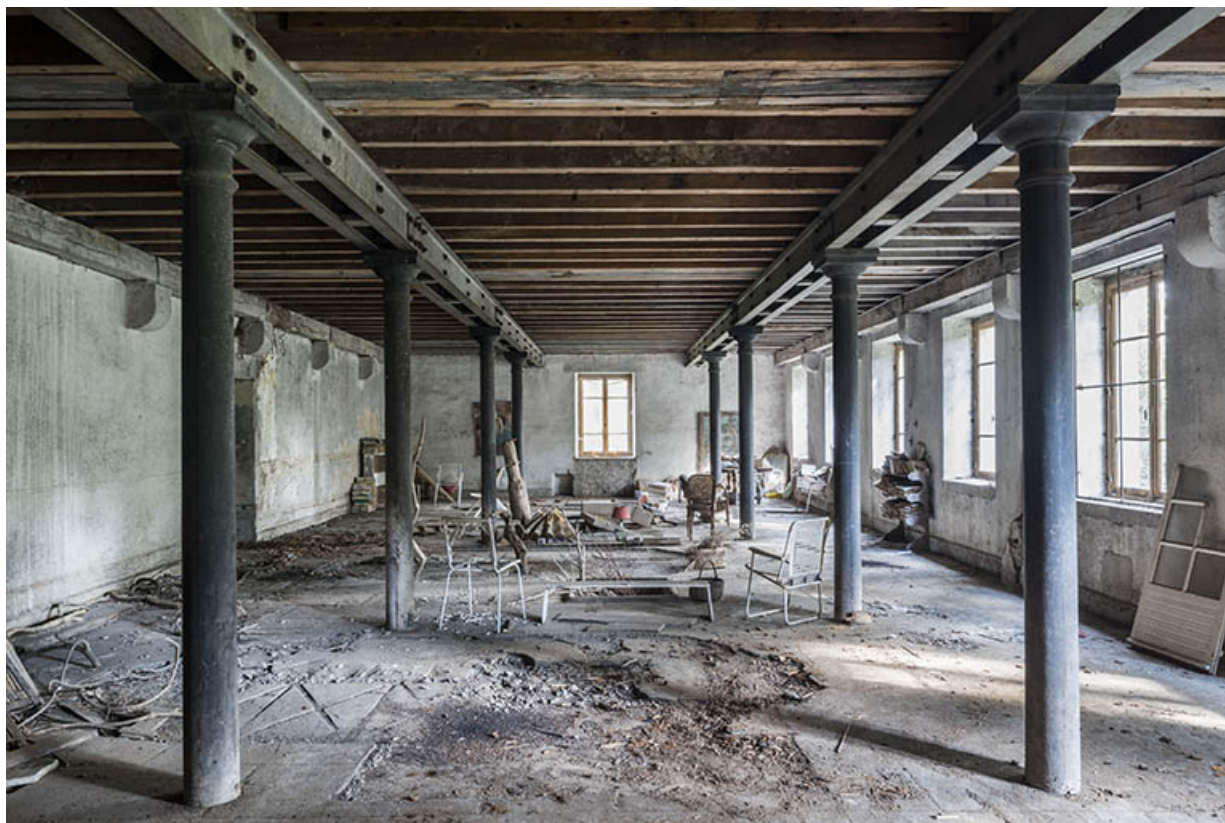
Atelier de fabrication (partie est).