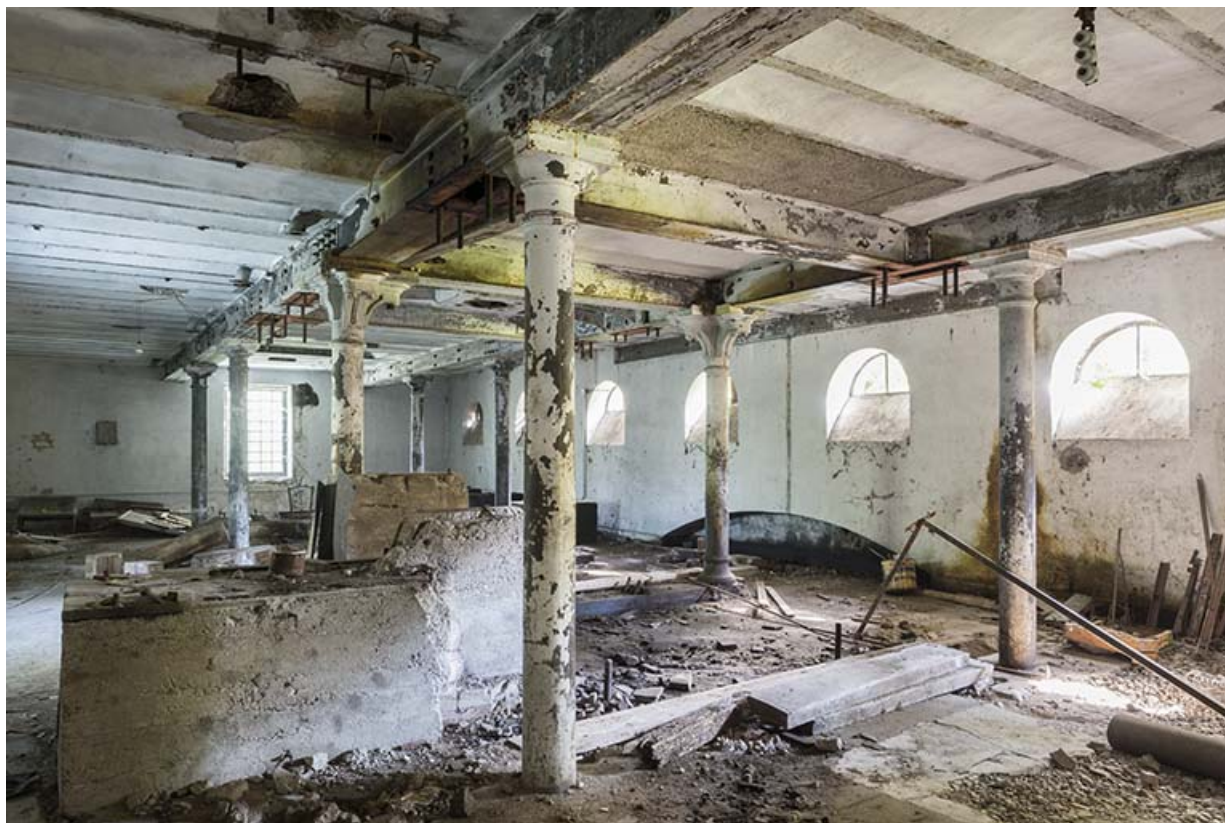
Atelier de fabrication (rez-de-chaussée). Partie est. 25, Chevroz chemin de l' île