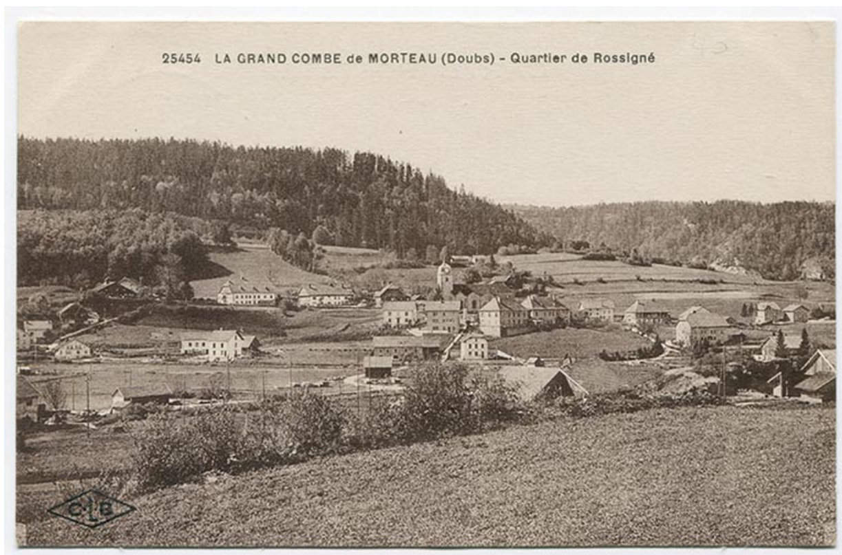
25454. La Grand Combe de Morteau (Doubs) - Quartier de Rossigné, décennie 1920 [avant 1927].

25, Grand'Combe-Châteleu, 9 et 11 place du Souvenir français, lieudit : Rossignier