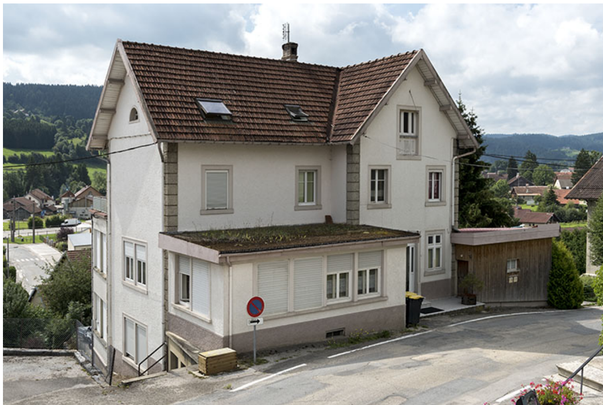
Usine : façade antérieure, de trois quarts gauche.

25, Grand'Combe-Châteleu, 9 et 11 place du Souvenir français, lieudit : Rossignier