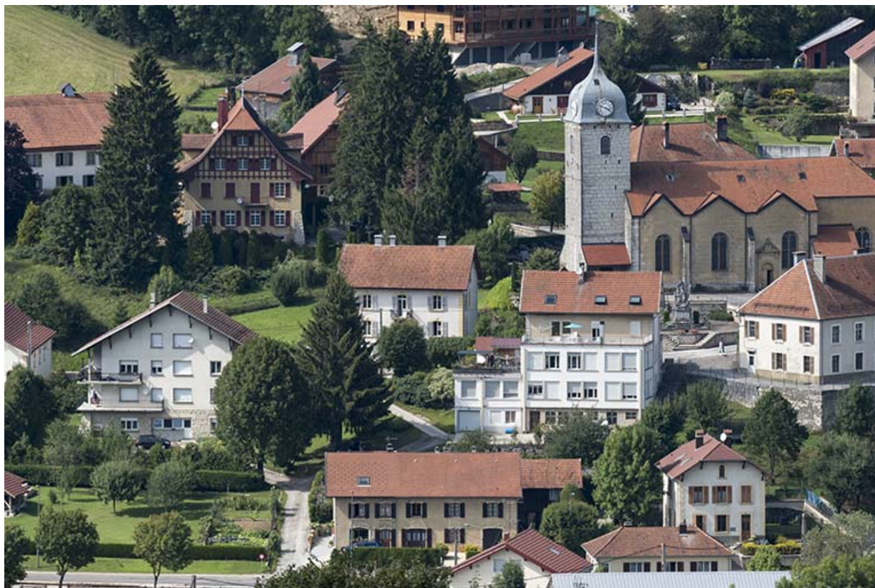
Vue d'ensemble depuis le sud : maison à gauche, usine à droite.

25, Grand'Combe-Châteleu, 9 et 11 place du Souvenir français, lieudit : Rossignier