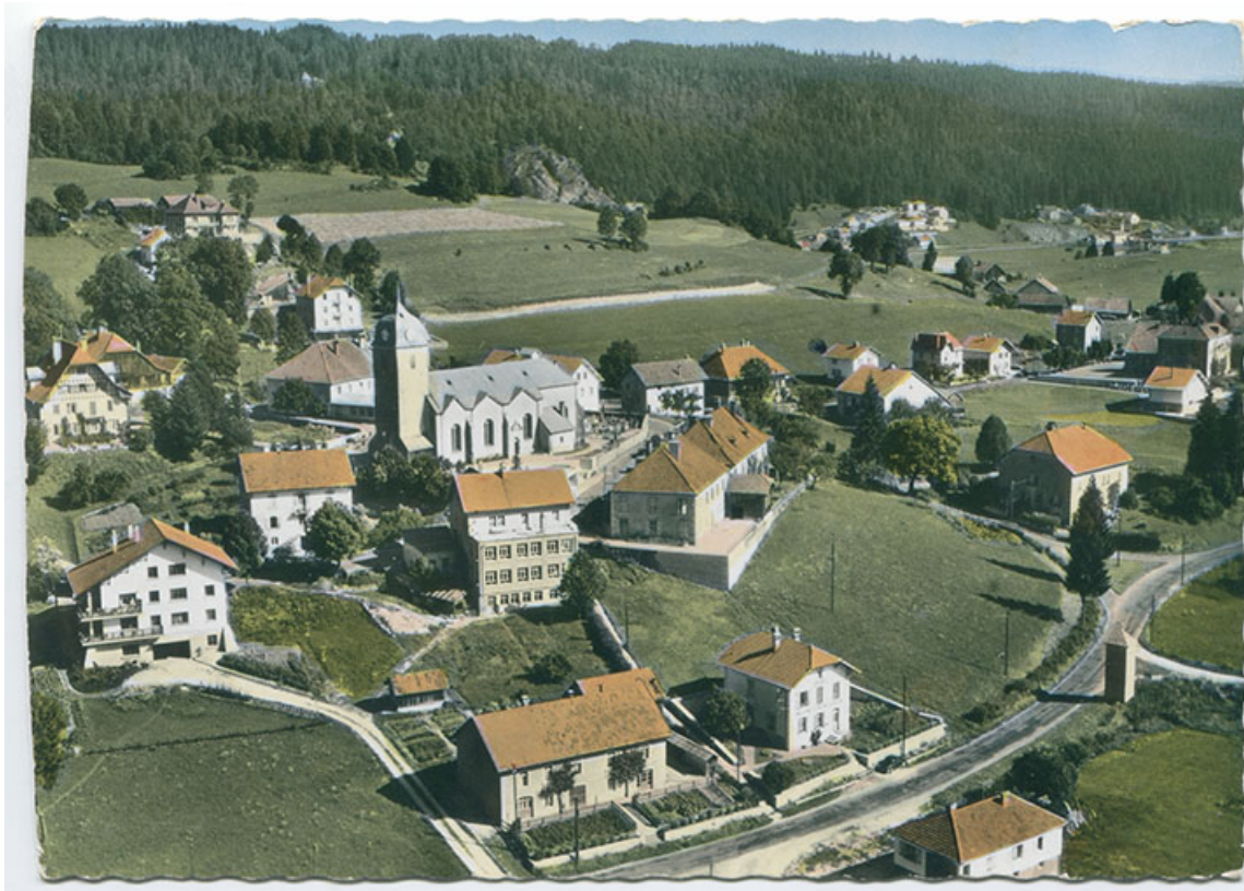
En avion au-dessus de... 12. Grand'Combe-Châteleu (Doubs). Vue générale, 3e quart 20e siècle [décennies 1950-1960]. 25, Grand'Combe-Châteleu, 9 et 11 place du Souvenir français, lieudit : Rossignier