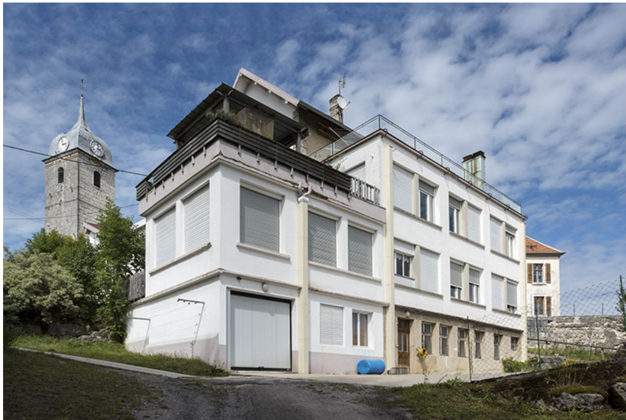
Usine : façade postérieure, de trois quarts gauche.

25, Grand'Combe-Châtelet, 9 et 11 place du Souvenir français, lieudit : Rossignier