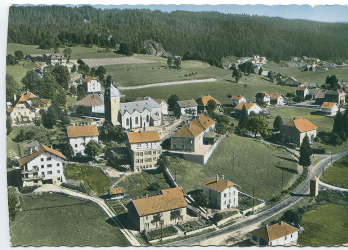
En avion au-dessus de... 12. Grand'Combe-Châteleu (Doubs). Vue générale, 3e quart 20e siècle [décennies 1950-1960]. 25, Grand'Combe-Châteleu, 9 et 11 place du Souvenir français, lieudit : Rossignier