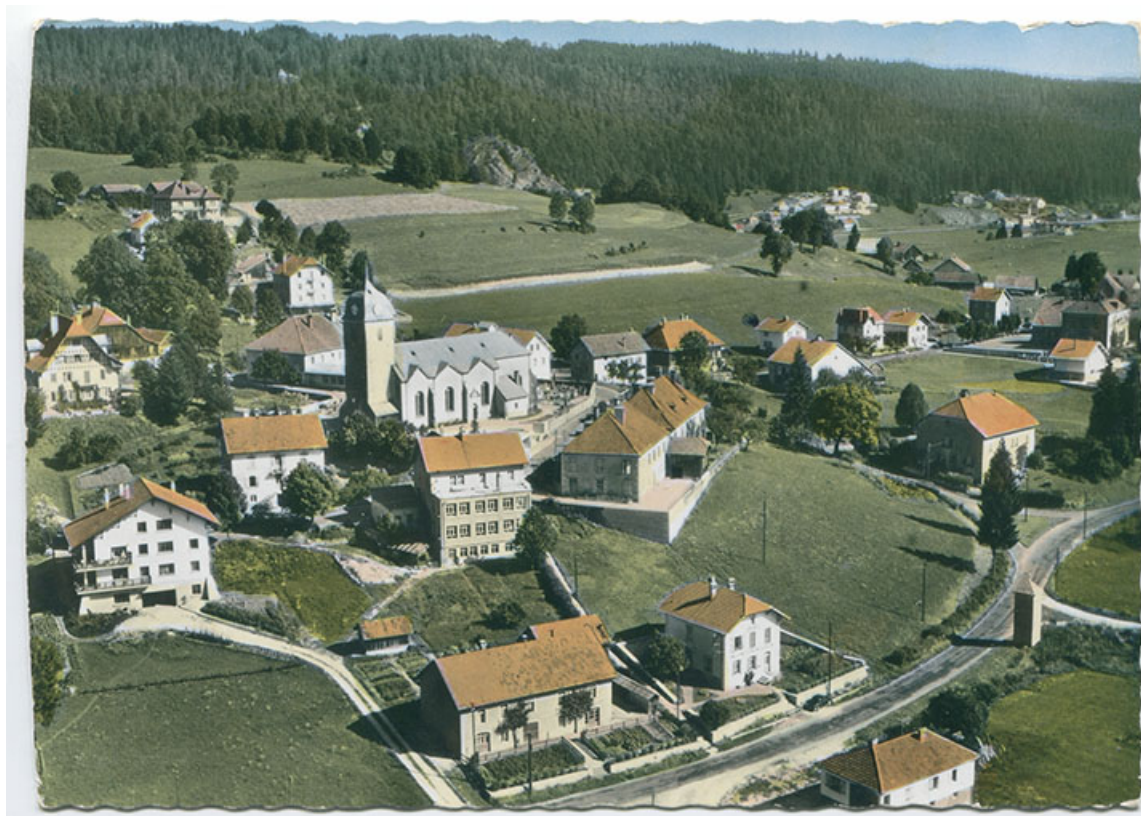
En avion au-dessus de... 12. Grand'Combe-Châteleu (Doubs). Vue générale, 3e quart 20e siècle [décennies 1950-1960]. 25, Grand'Combe-Châteleu, 9 et 11 place du Souvenir français, lieudit : Rossignier