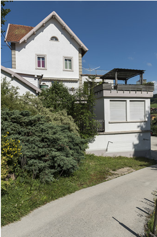
Usine : façade latérale droite.

25, Grand'Combe-Châteleu, 9 et 11 place du Souvenir français, lieudit : Rossignier