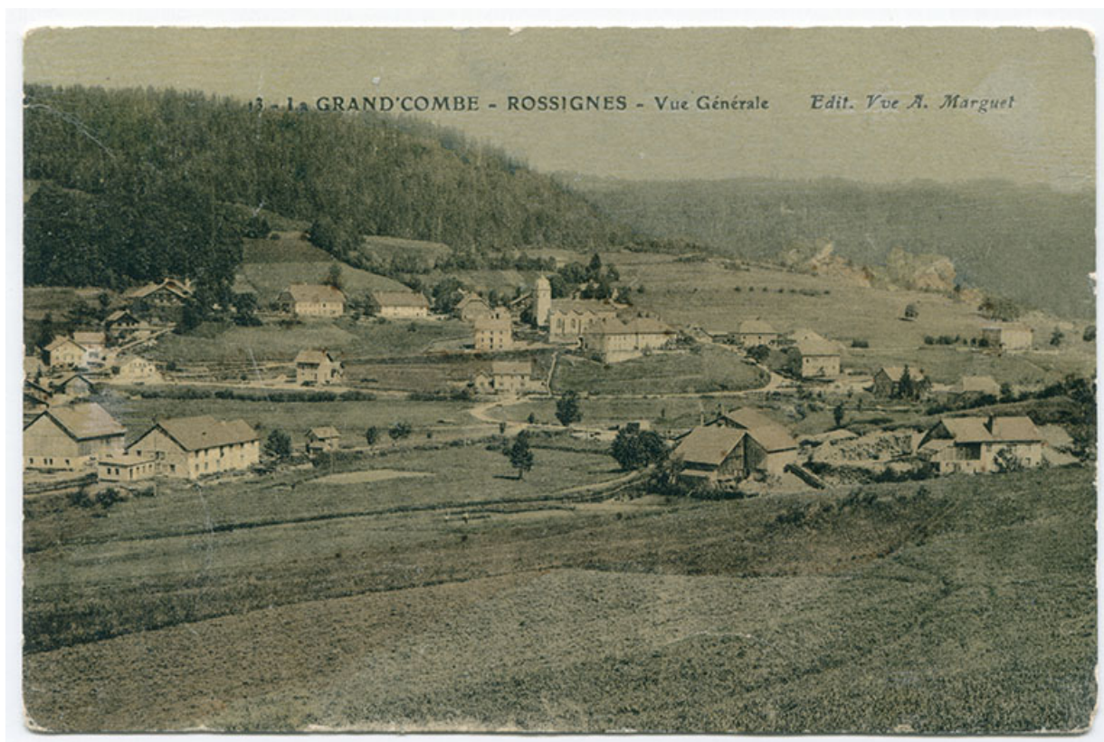
13 - La Grand'Combe - Rossignes [sic] - Vue générale, décennie 1920.

25, Grand'Combe-Châteleu, 9 et 11 place du Souvenir français, lieudit : Rossignier