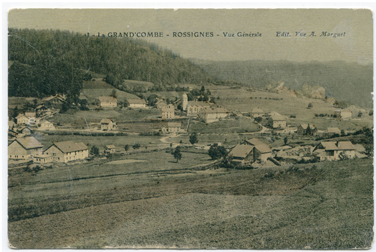
13 - La Grand'Combe - Rossignes [sic] - Vue générale, décennie 1920.

25, Grand'Combe-Châteleu, 9 et 11 place du Souvenir français, lieudit : Rossignier