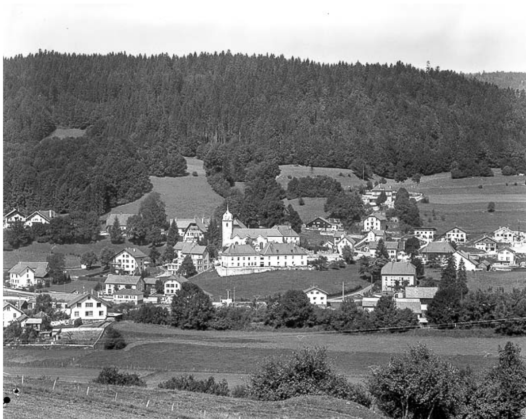
Village vu depuis Morestans.