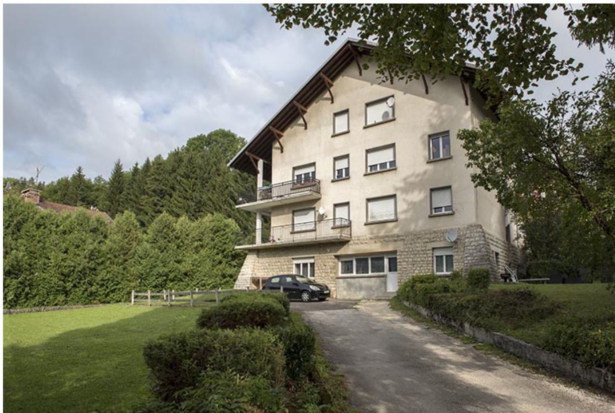
Maison : façade postérieure, de trois quarts droite.

25, Grand'Combe-Châteleu, 9 et 11 place du Souvenir français, lieudit : Rossignier