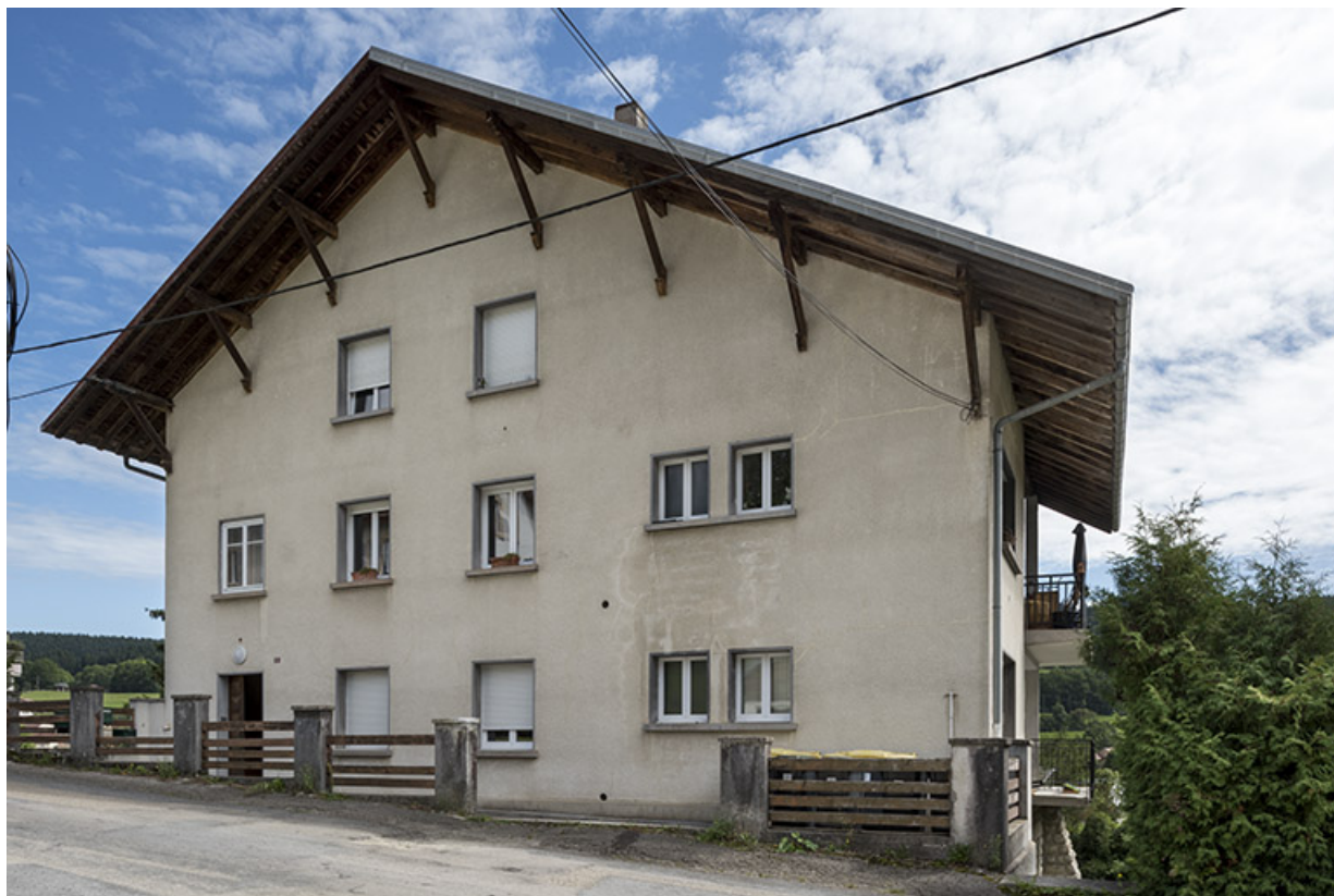
Maison : façade antérieure, de trois quarts droite.

25, Grand'Combe-Châteleu, 9 et 11 place du Souvenir français, lieudit : Rossignier