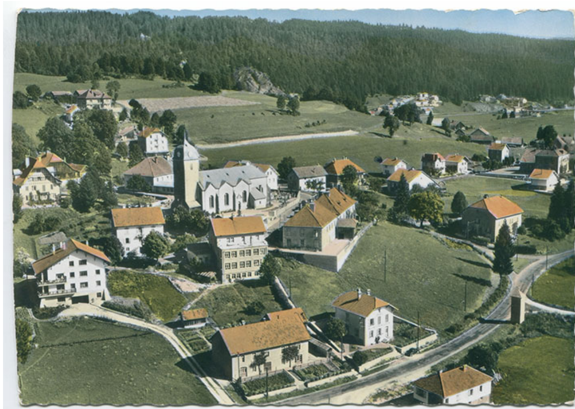
En avion au-dessus de... 12. Grand'Combe-Châteleu (Doubs). Vue générale, 3e quart 20e siècle [décennies 1950-1960]. 25, Grand'Combe-Châteleu, 9 et 11 place du Souvenir français, lieudit : Rossignier