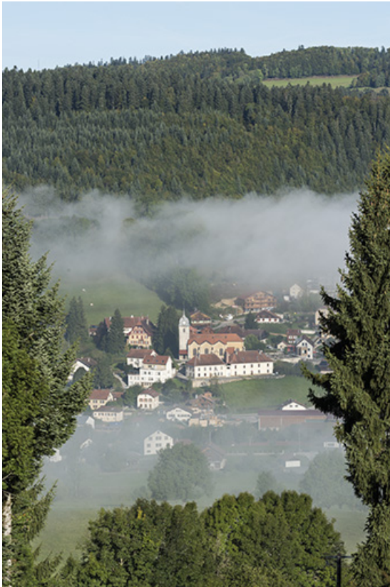
Vue d'ensemble du village depuis l'est.

25, Grand'Combe-Châtelet, 9 et 11 place du Souvenir français, lieudit : Rossignier