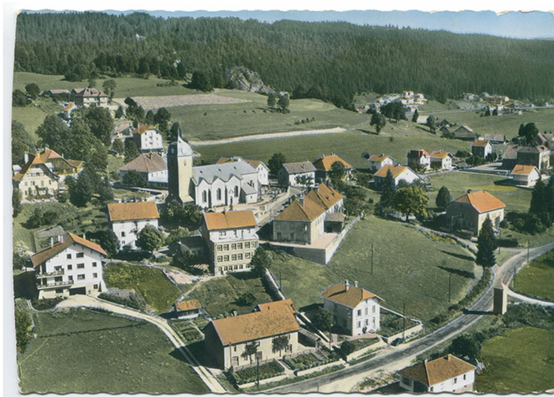
En avion au-dessus de... 12. Grand'Combe-Châteleu (Doubs). Vue générale, 3e quart 20e siècle [décennies 1950-1960]. 25, Grand'Combe-Châteleu, 9 et 11 place du Souvenir français, lieudit : Rossignier