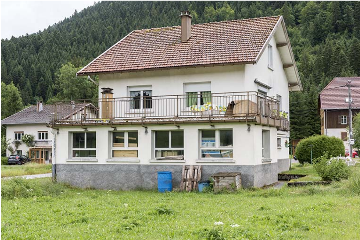
Atelier et façade postérieure, de trois quarts droite.

25, Les Gras, 13 rue les Saules, lieudit : les Saules