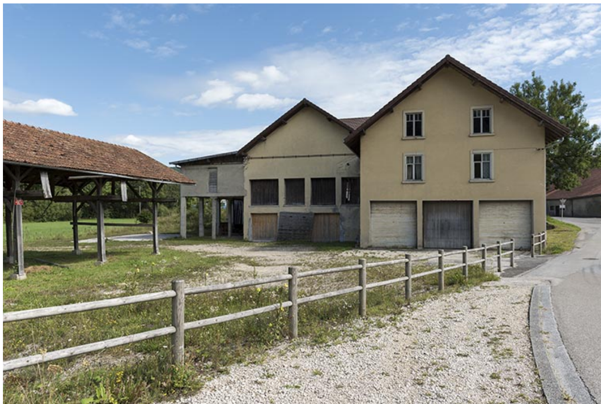
Vue d'ensemble, depuis le nord-ouest.

25, Grand'Combe-Châteleu, lieudit : les Douffrans