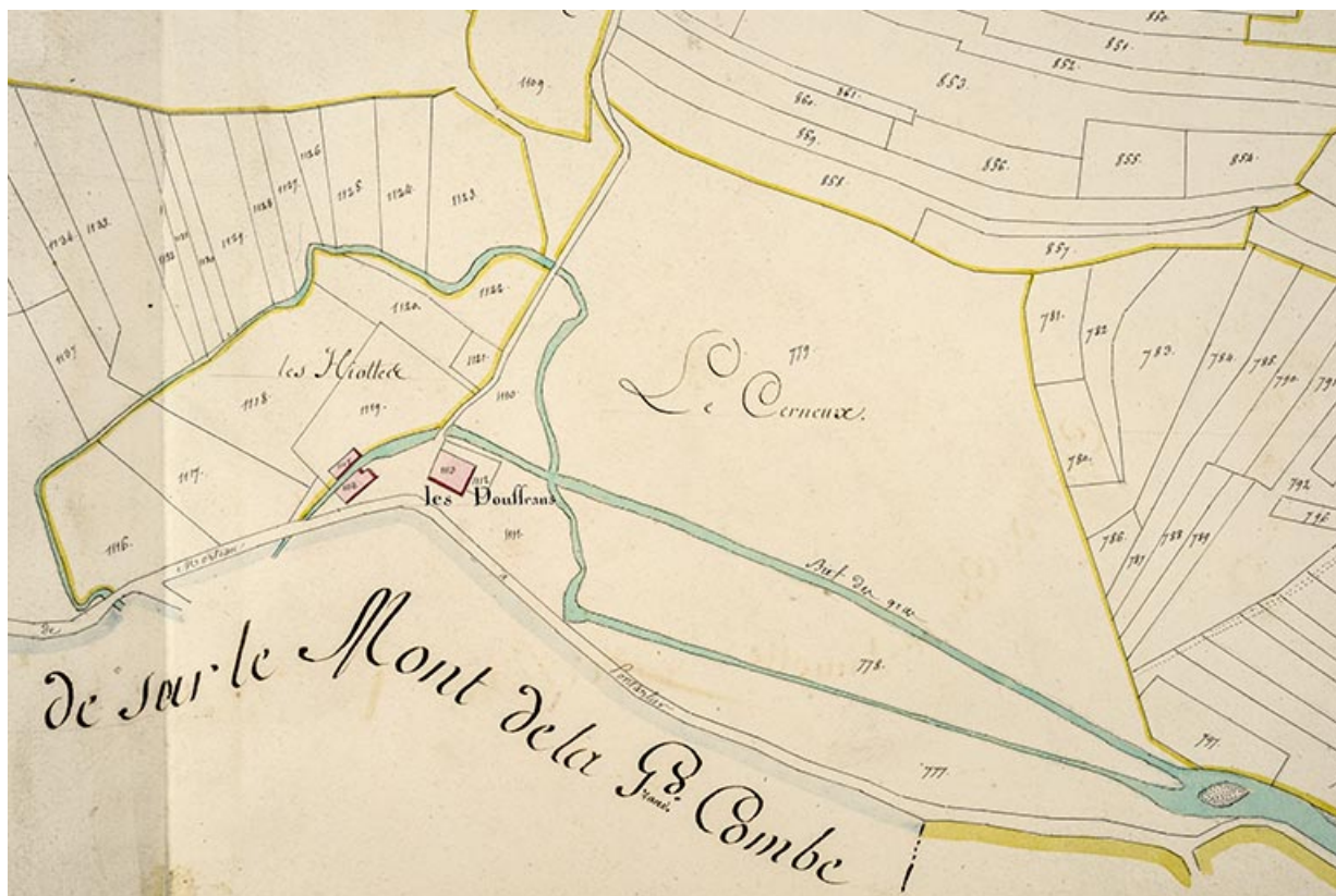
Cadastre de la commune de Grand'Combe-Châteleu. Atlas parcellaire, 1816, section B 5e feuille [détail : les Douffrans], 1/2 500. 25, Grand'Combe-Châteleu, lieudit : les Douffrans