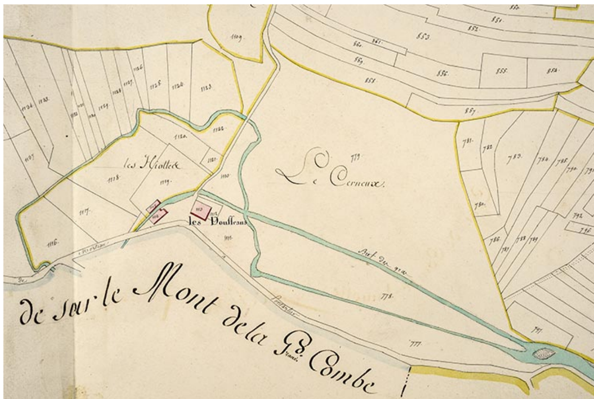
Cadastre de la commune de Grand'Combe-Châteleu. Atlas parcellaire, 1816, section B 5e feuille [détail : les Douffrans], 1/2 500. 25, Grand'Combe-Châteleu, lieu-dit : les Douffrans