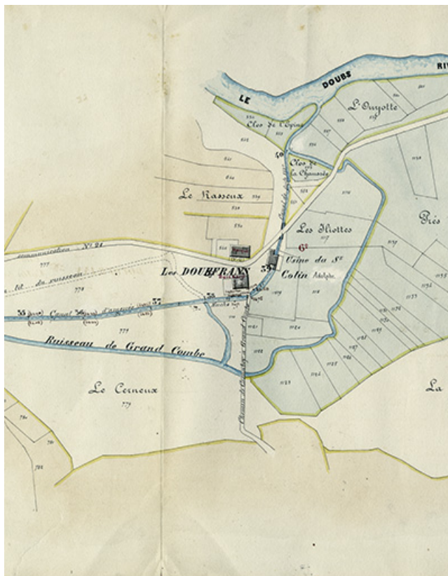
Commune de Grand'Combe. Règlement d'eau des usines [...] Plan parcellaire [détail de la partie droite : Colin], 21 juin 1876. 25, Grand'Combe-Châteleu, lieudit : les Douffrans