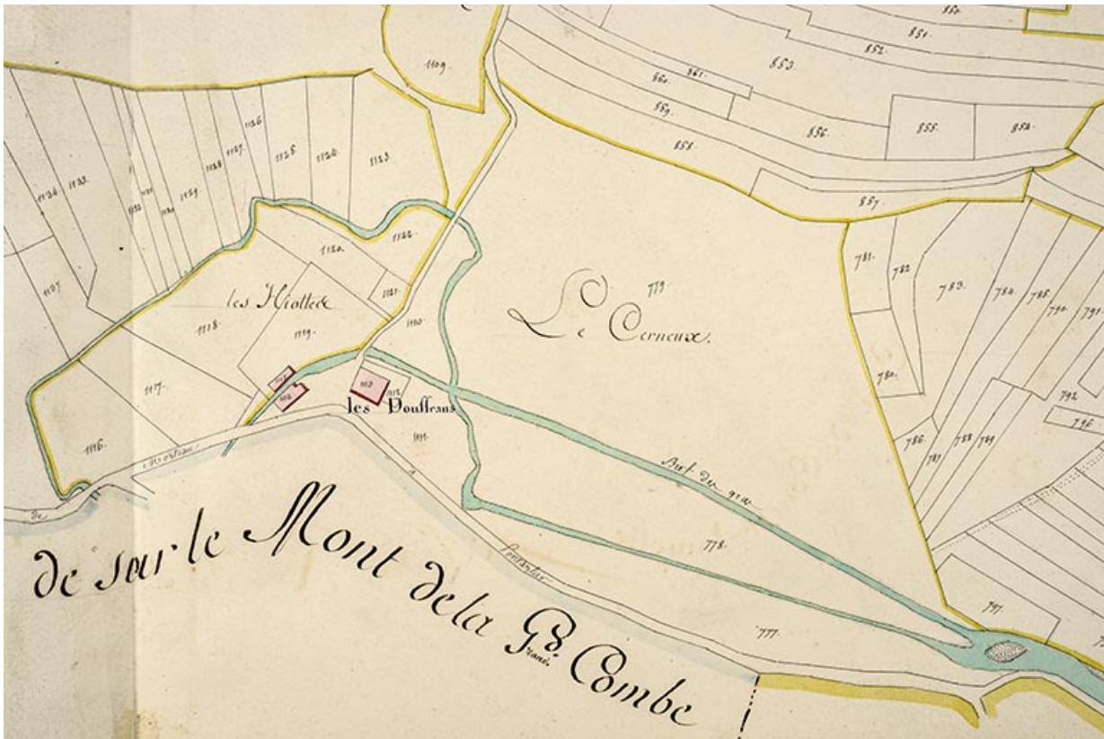
Cadastre de la commune de Grand'Combe-Châteleu. Atlas parcellaire, 1816, section B 5e feuille [détail : les Douffrans], 1/2 500. 25, Grand'Combe-Châteleu