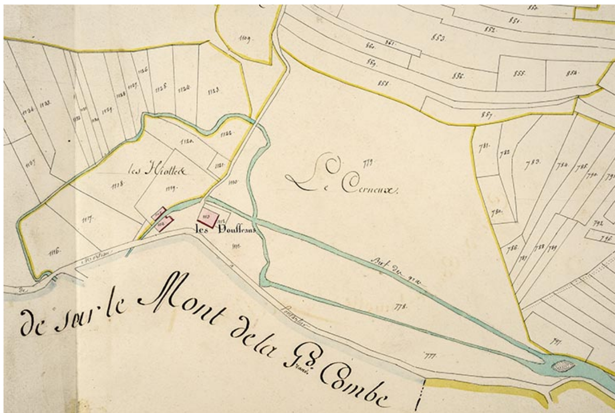
Cadastré de la commune de Grand'Combe-Châteleu. Atlas parcellaire, 1816, section B 5e feuille [détail : les Douffrans], 1/2 500. 25, Grand'Combe-Châteleu, lieu-dit : les Douffrans