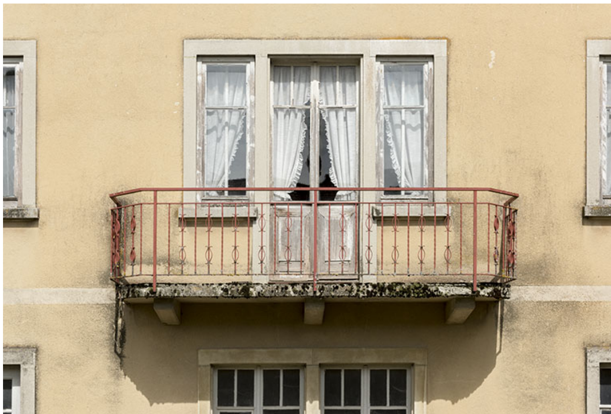
Façade antérieure : balcon et baies de l'étage carré.

25, Grand'Combe-Châteleu, lieudit : les Douffrans