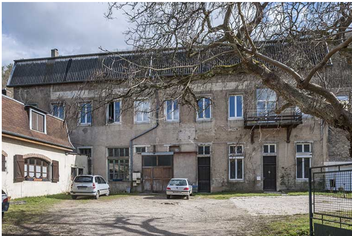
Façade antérieure de l'atelier de fabrication. 25, Montfaucon, 24, 26 rue de l' Aqueduc