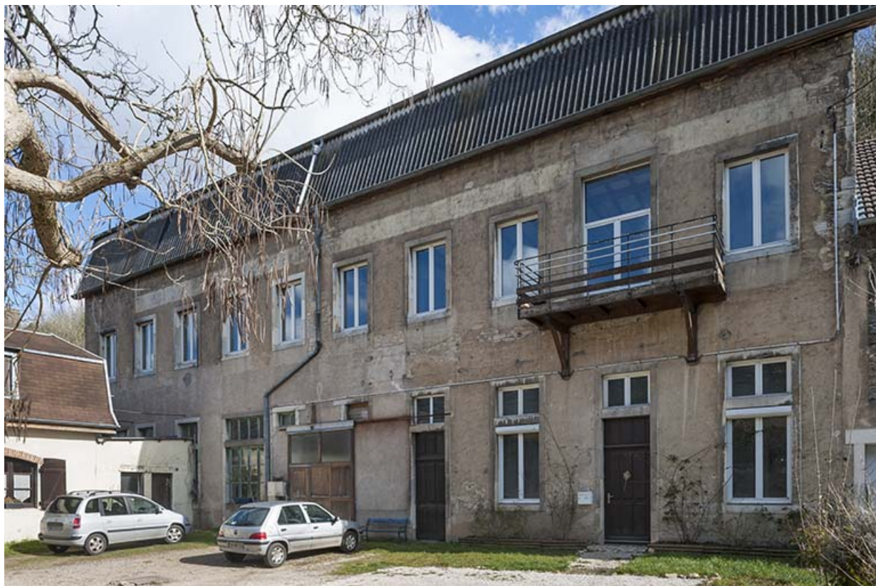
Atelier de fabrication vu de trois quarts. 25, Montfaucon, 24, 26 rue de l' Aqueduc