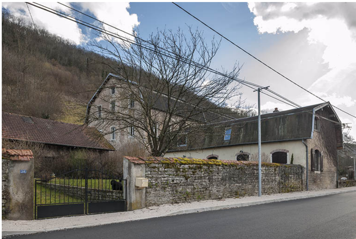
Pignon nord de l'atelier de fabrication et façade postérieure de la conciergerie. 25, Montfaucon, 24, 26 rue de l' Aqueduc