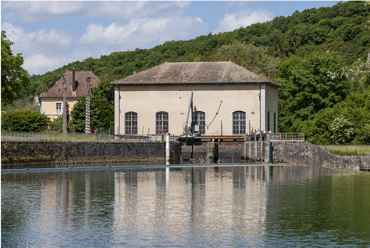
La centrale hydroélectrique vue depuis l'est.

25, Châtillon-sur-Lison chemin des Forges, lieudit : les Forges