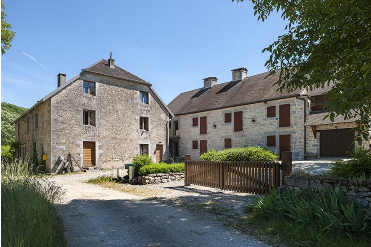
Logements d'ouvriers. Vue d'ensemble depuis le nord-ouest.

25, Châtillon-sur-Lison chemin des Forges, lieudit : les Forges