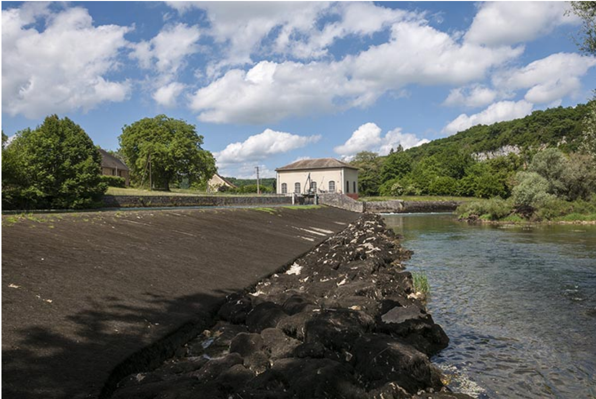
La centrale vue depuis la rive droite du barrage.

25, Châtillon-sur-Lison chemin des Forges, lieudit : les Forges