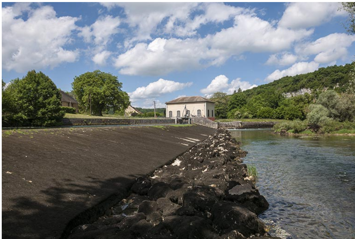
La centrale vue depuis la rive droite du barrage.

25, Châtillon-sur-Lison chemin des Forges, lieudit : les Forges