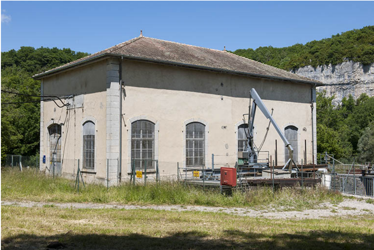
La centrale hydroélectrique vue de trois quarts.

25, Châtillon-sur-Lison chemin des Forges, lieudit : les Forges