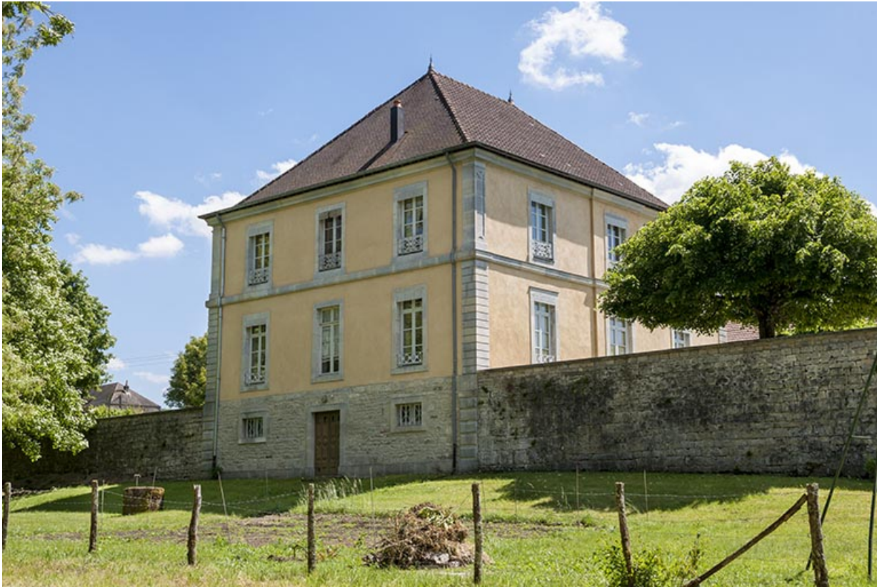
Logement patronal. Vue de trois quarts arrière.

25, Châtillon-sur-Lison chemin des Forges, lieudit : les Forges