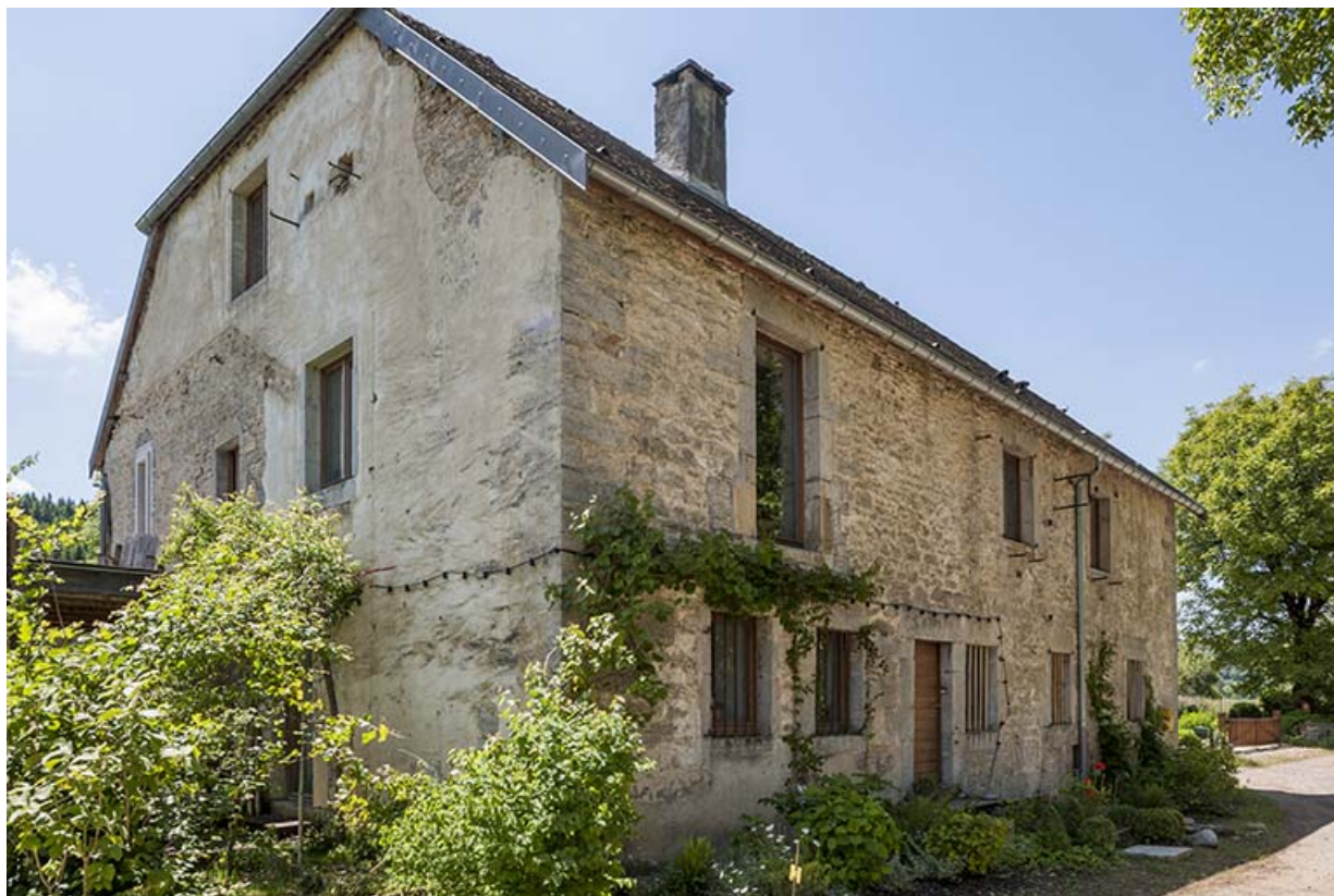
Logement d'ouvriers (puis école). Vue de trois quarts droite. 25, Châtillon-sur-Lison chemin des Forges, lieudit : les Forges