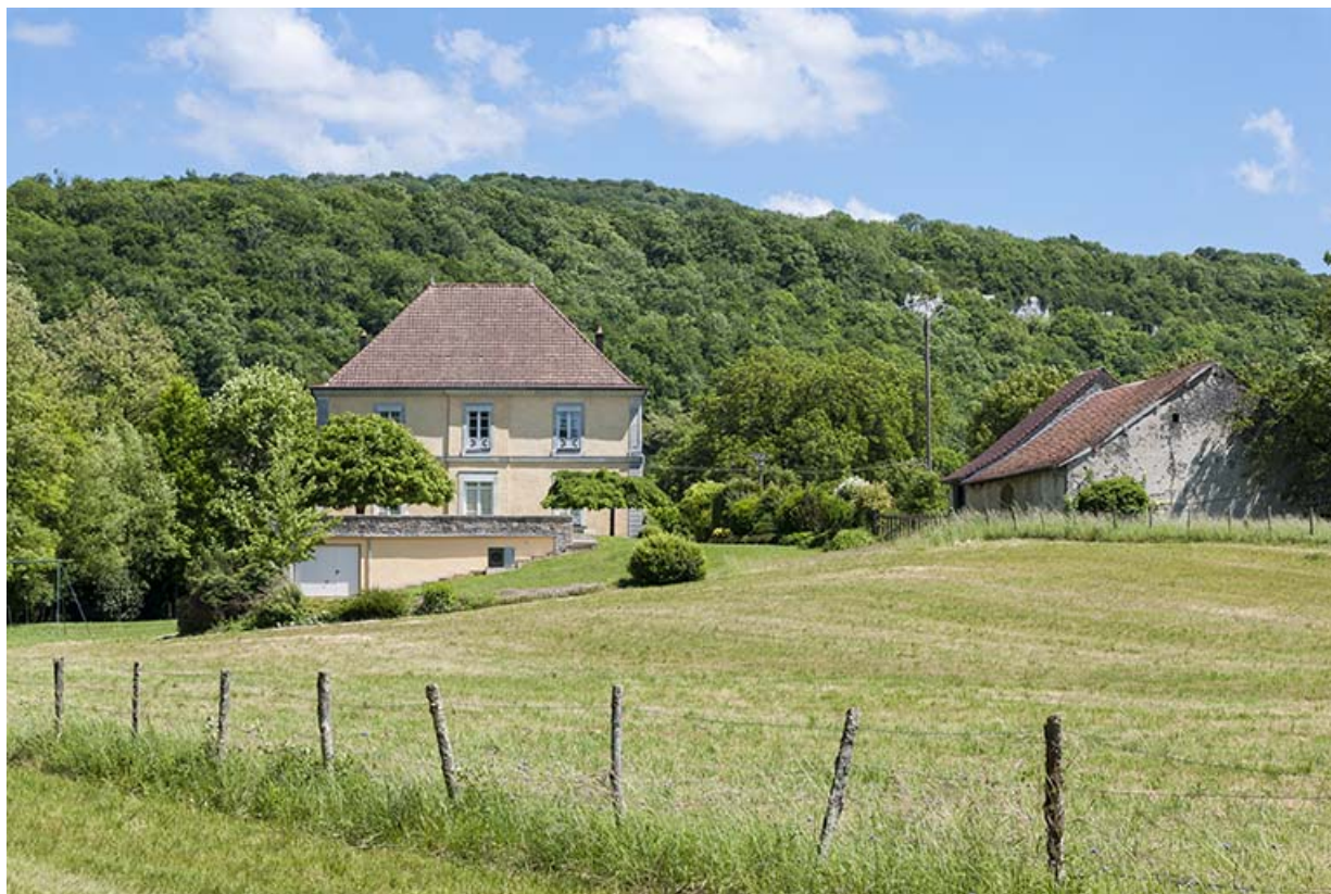
Vue depuis l'ouest : le logement patronal et la ferme.

25, Châtillon-sur-Lison chemin des Forges, lieudit : les Forges