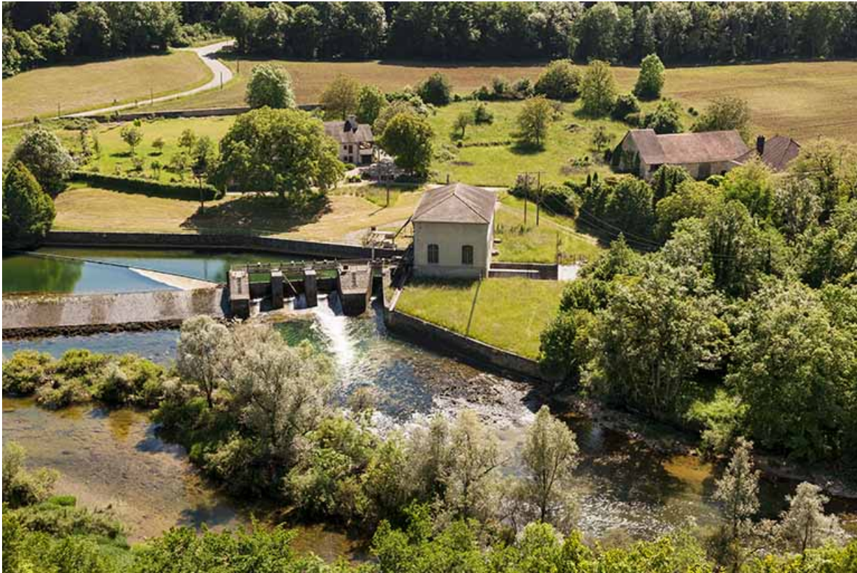
Vue plongeante depuis le nord-est.

25, Châtillon-sur-Lison chemin des Forges, lieudit : les Forges