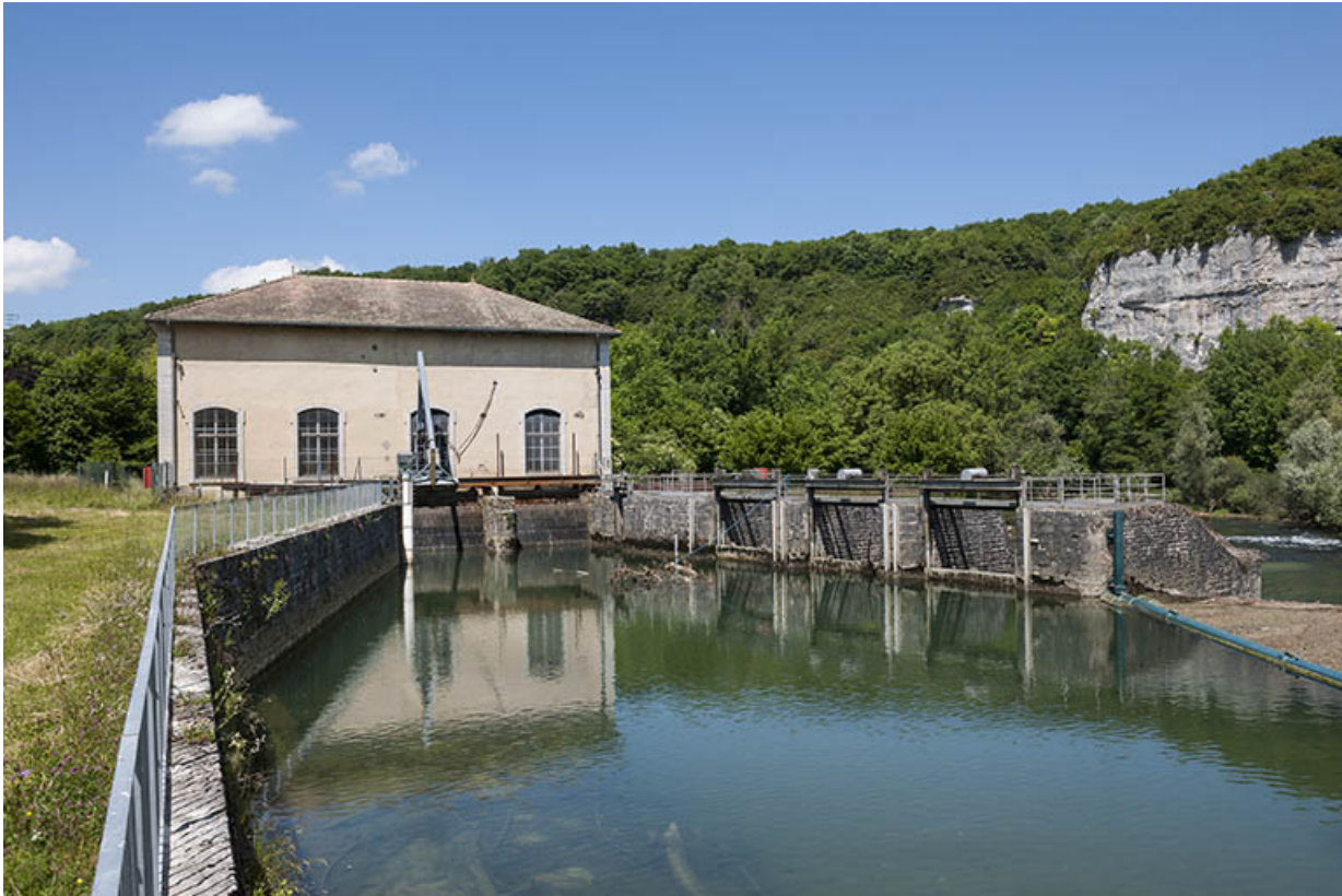
La centrale et son déversoir, depuis l'amont.

25, Châtillon-sur-Lison chemin des Forges, lieudit : les Forges