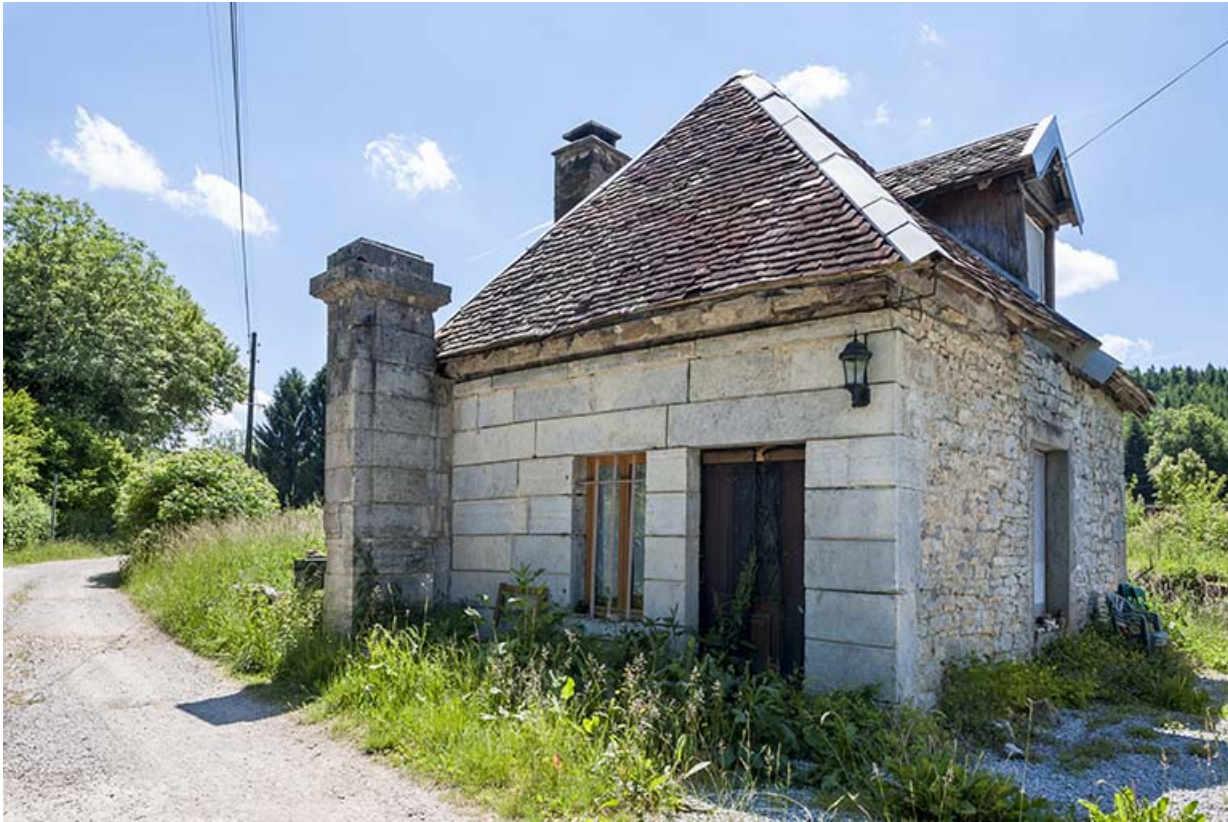
Pavillon d'entrée vu de trois quarts.

25, Châtillon-sur-Lison chemin des Forges, lieudit : les Forges