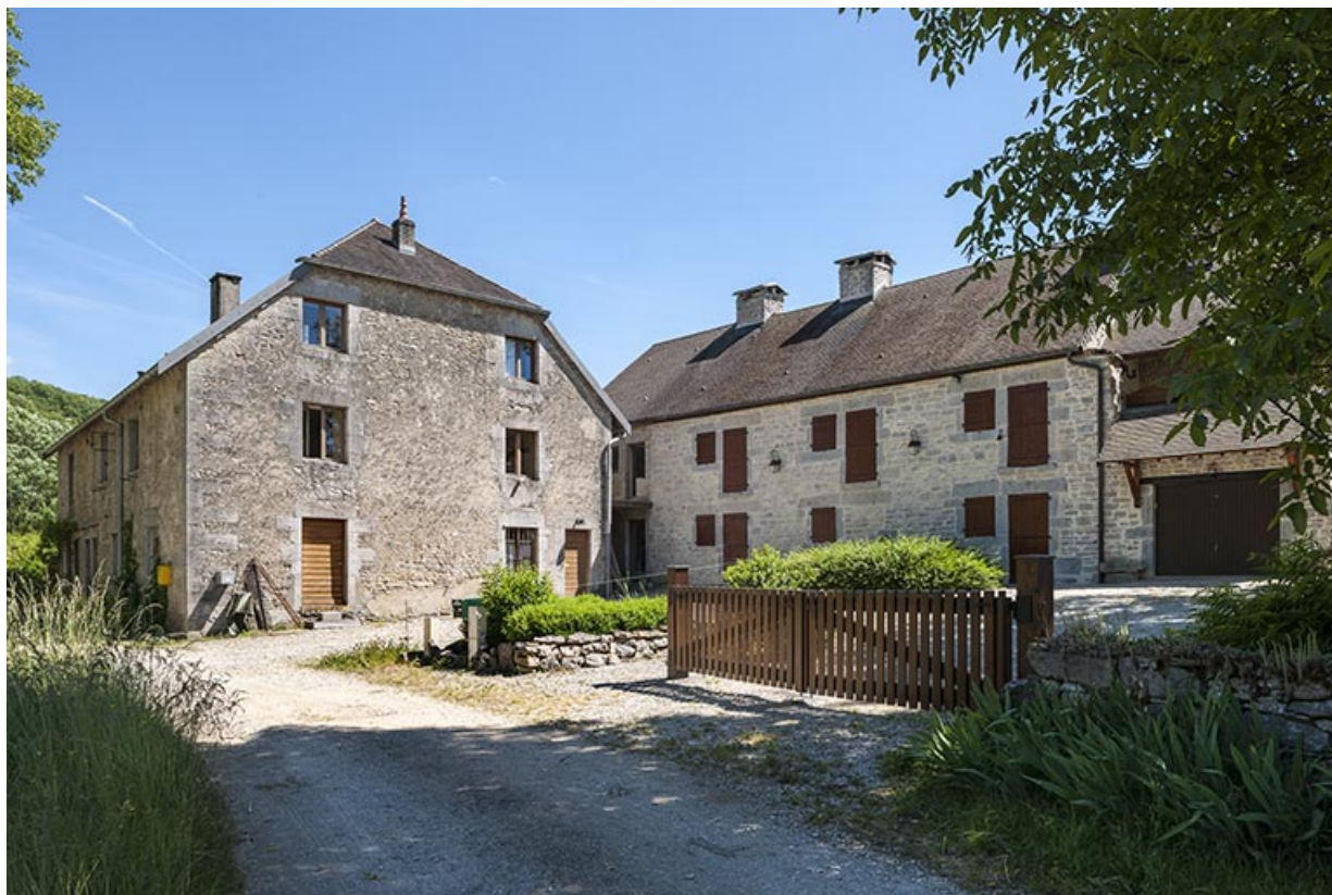
Logements d'ouvriers. Vue d'ensemble depuis le nord-ouest.

25, Châtillon-sur-Lison chemin des Forges, lieudit : les Forges