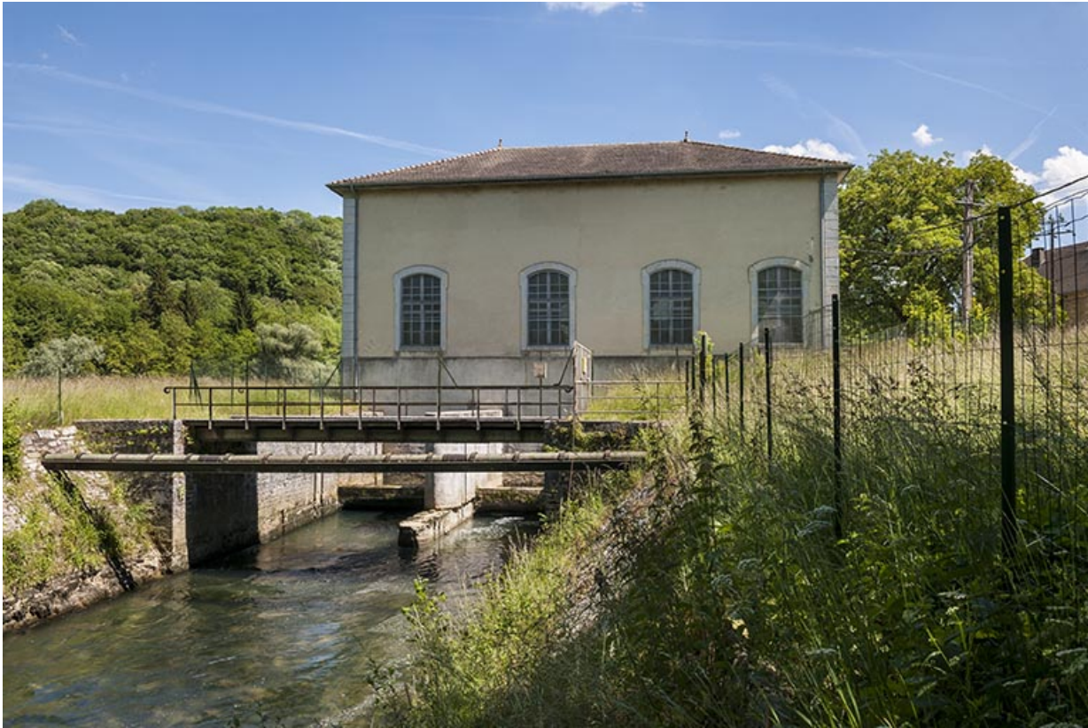
La centrale hydroélectrique et son canal de fuite.

25, Châtillon-sur-Lison chemin des Forges, lieudit : les Forges