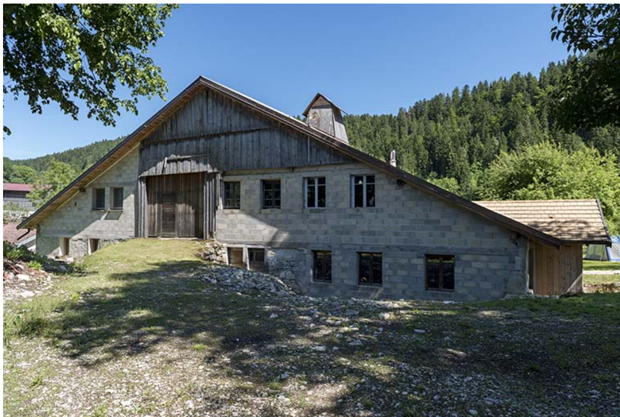
Façade postérieure, de trois quarts droite.