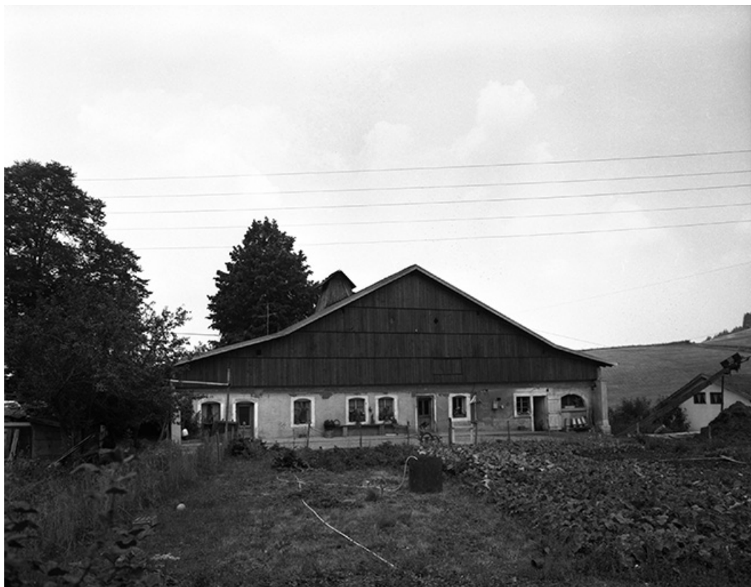
Ferme située au lieudit Le Nid du Fol, cadastrée ZD 68 : façade antérieure et jardin.