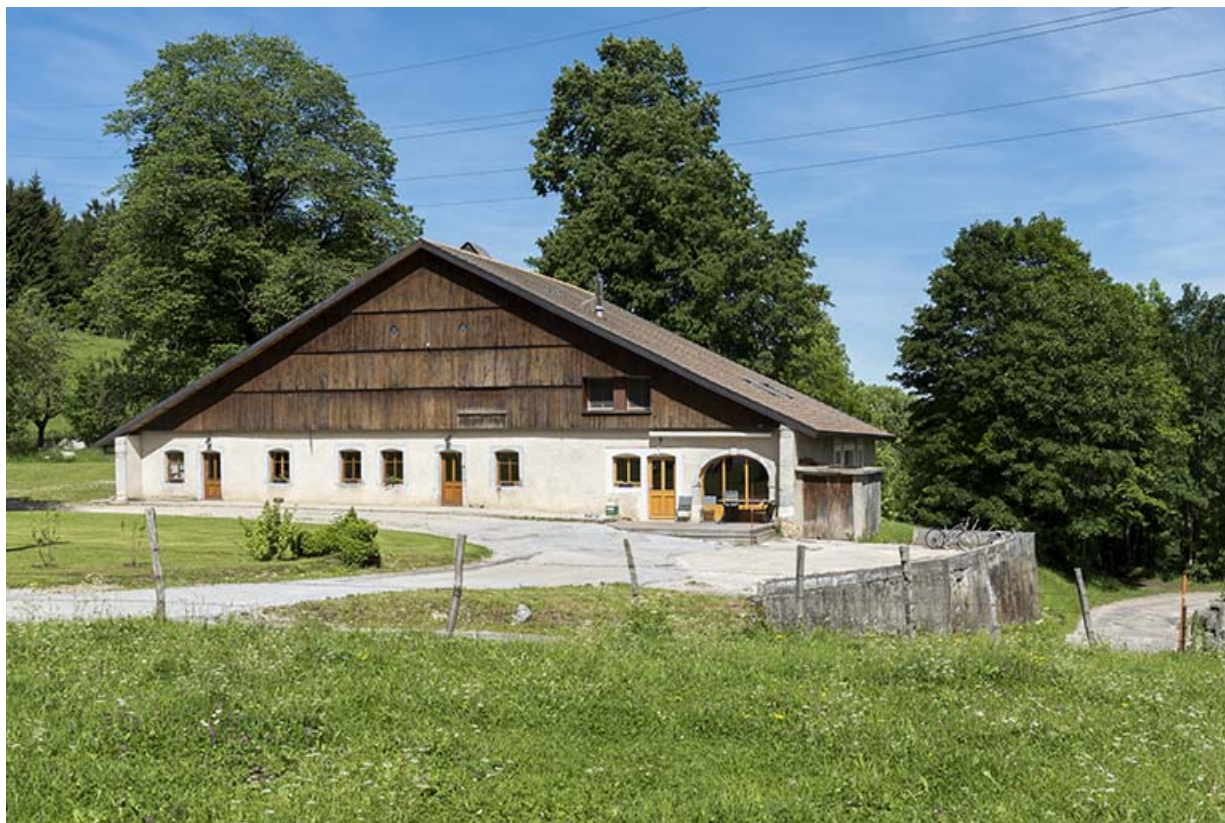
Vue d'ensemble, depuis le sud-est.