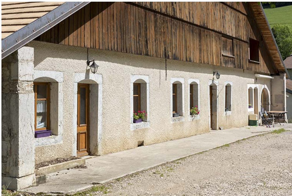
Façade antérieure, vue en enfilade.