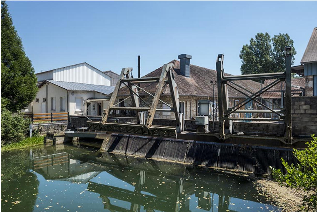
Canal d'amenée et dégrilleur de la centrale hydroélectrique.

25, Arc-et-Senans, lieudit : au Fourneau de Roche