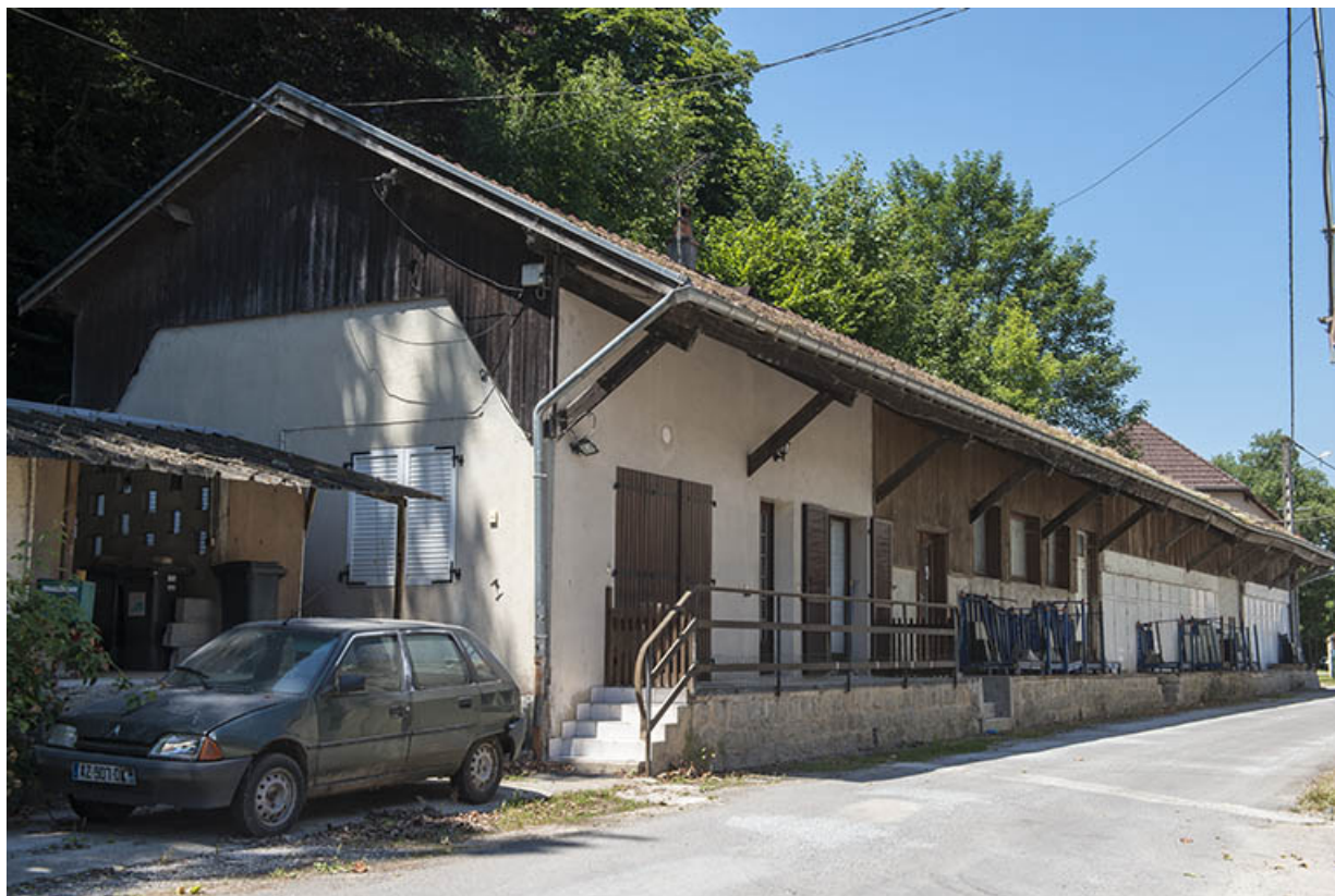
Magasin d'expéditions et (ancien) atelier d'affûtage. 25, Arc-et-Senans, lieudit : au Fourneau de Roche