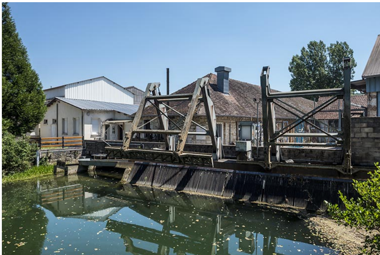
Canal d'aménée et dégrilleur de la centrale hydroélectrique.

25, Arc-et-Senans, lieudit : au Fourneau de Roche