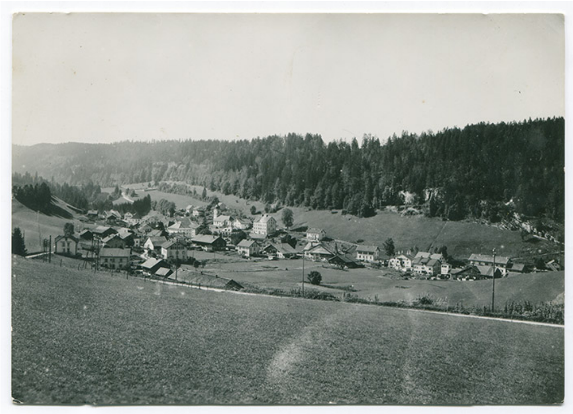
Paysages du Haut-Doubs - Les Gras [vue d'ensemble du village depuis l'est], 2e quart 20e siècle. La maison est visible à gauche. 25, Les Gras