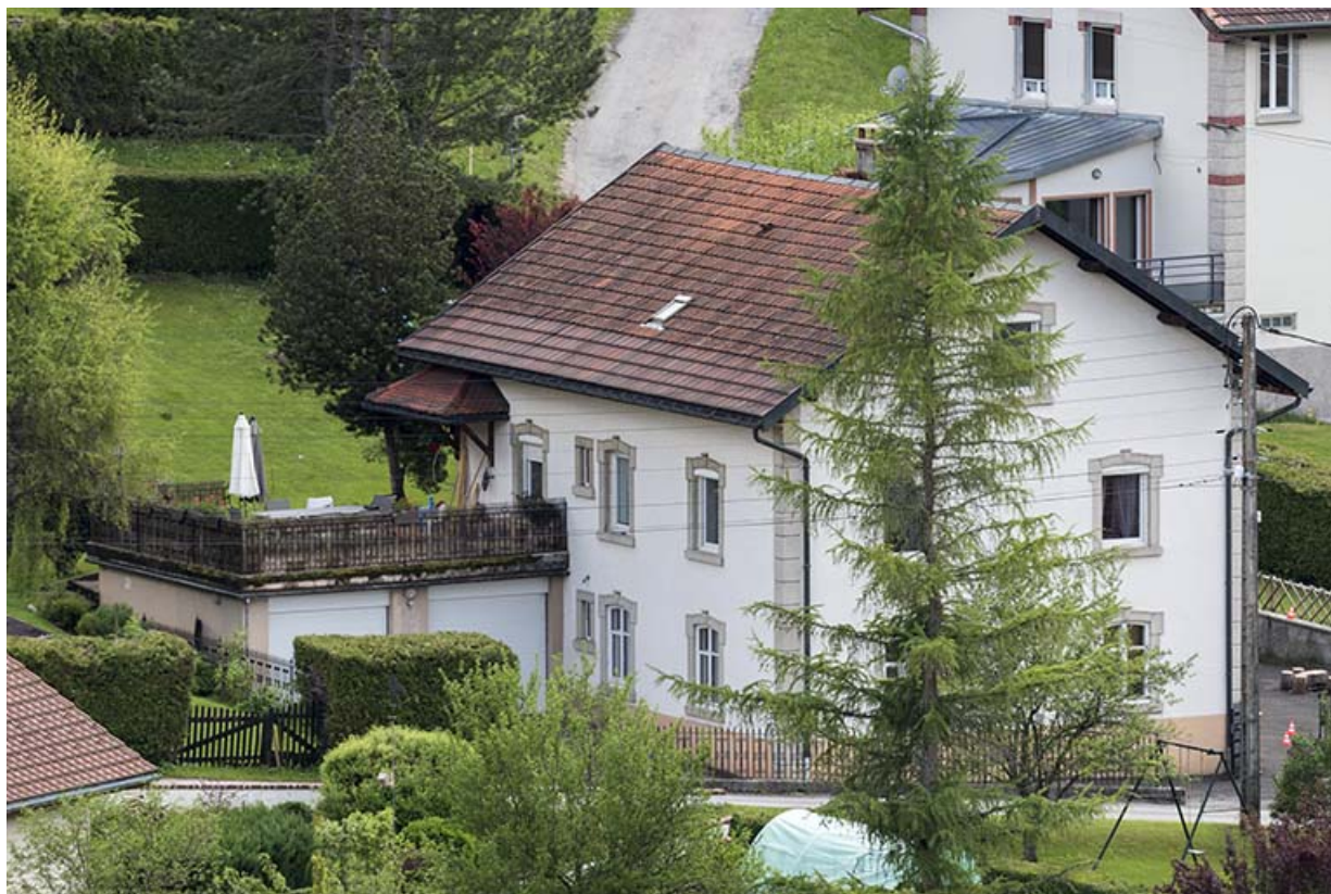
Façades postérieure et latérale gauche (vue plongeante).