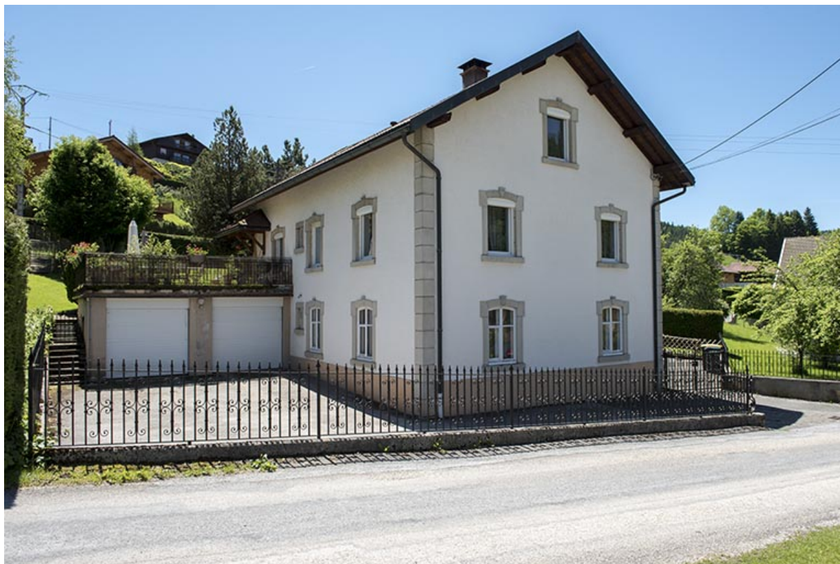
Façades postérieure et latérale gauche.