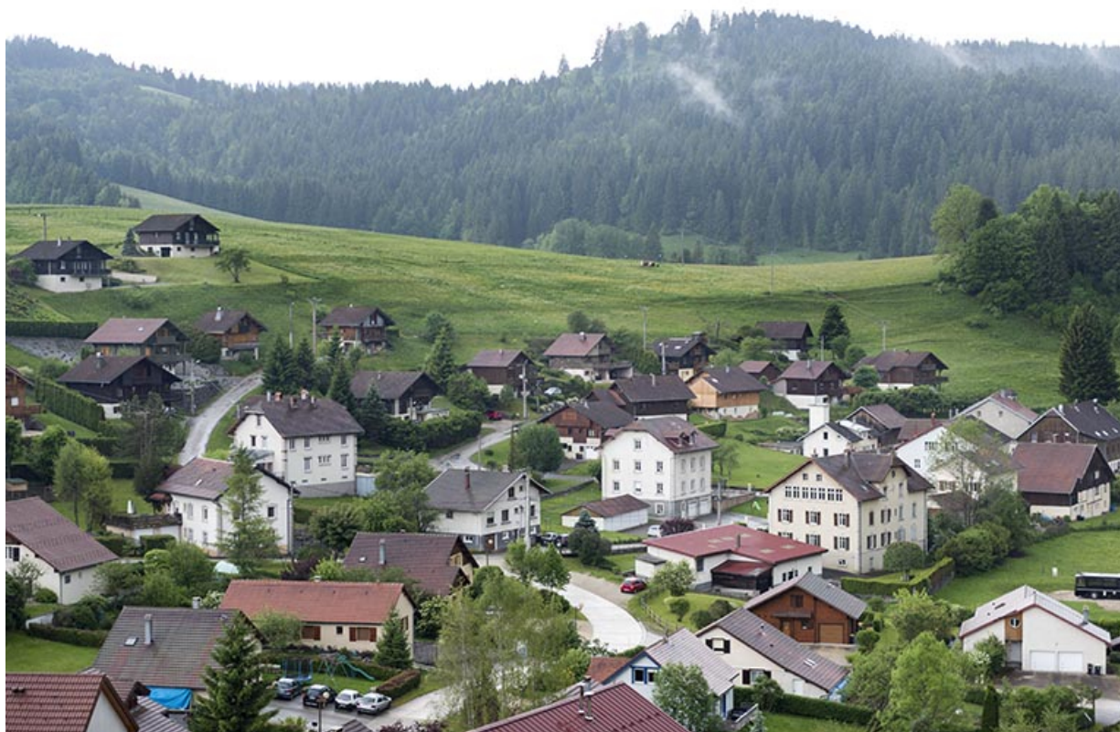
Vue d'ensemble du quartier de la rue des Jardins, depuis le nord-est. 25, Les Gras