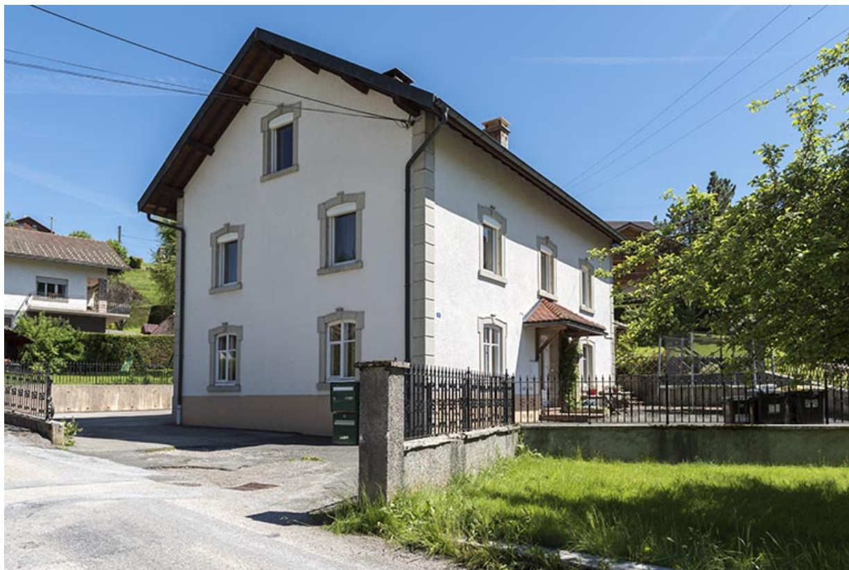
Façades antérieure et latérale gauche.