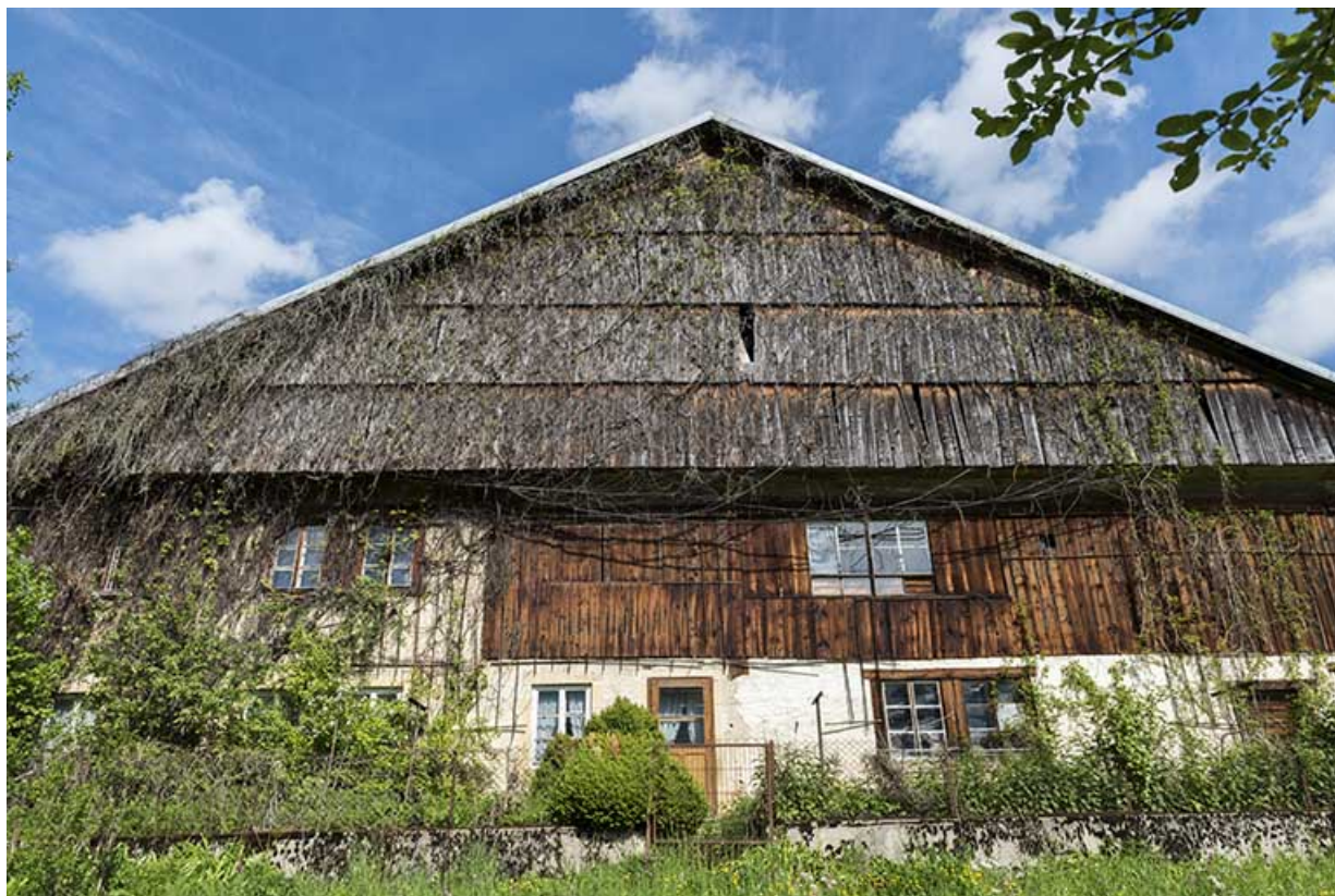
Façade antérieure, vue en contre-plongée.

25, Les Gras, 10 rue les Jean-Jacquot, lieudit : les Jean-Jacquot