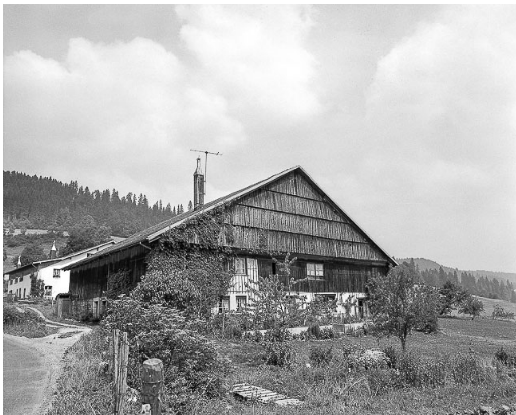
Ferme située au lieu-dit Les Jeanjacquots, cadastrée ZB 24 : façades antérieure et latérale gauche. 25, Les Gras, 10 rue les Jean-Jacquot, lieudit : les Jean-Jacquot