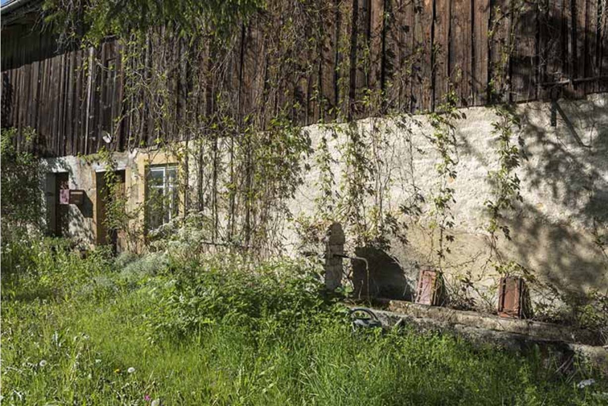
Façade latérale gauche, avec fontaine.

25, Les Gras, 10 rue les Jean-Jacquot, lieudit : les Jean-Jacquot