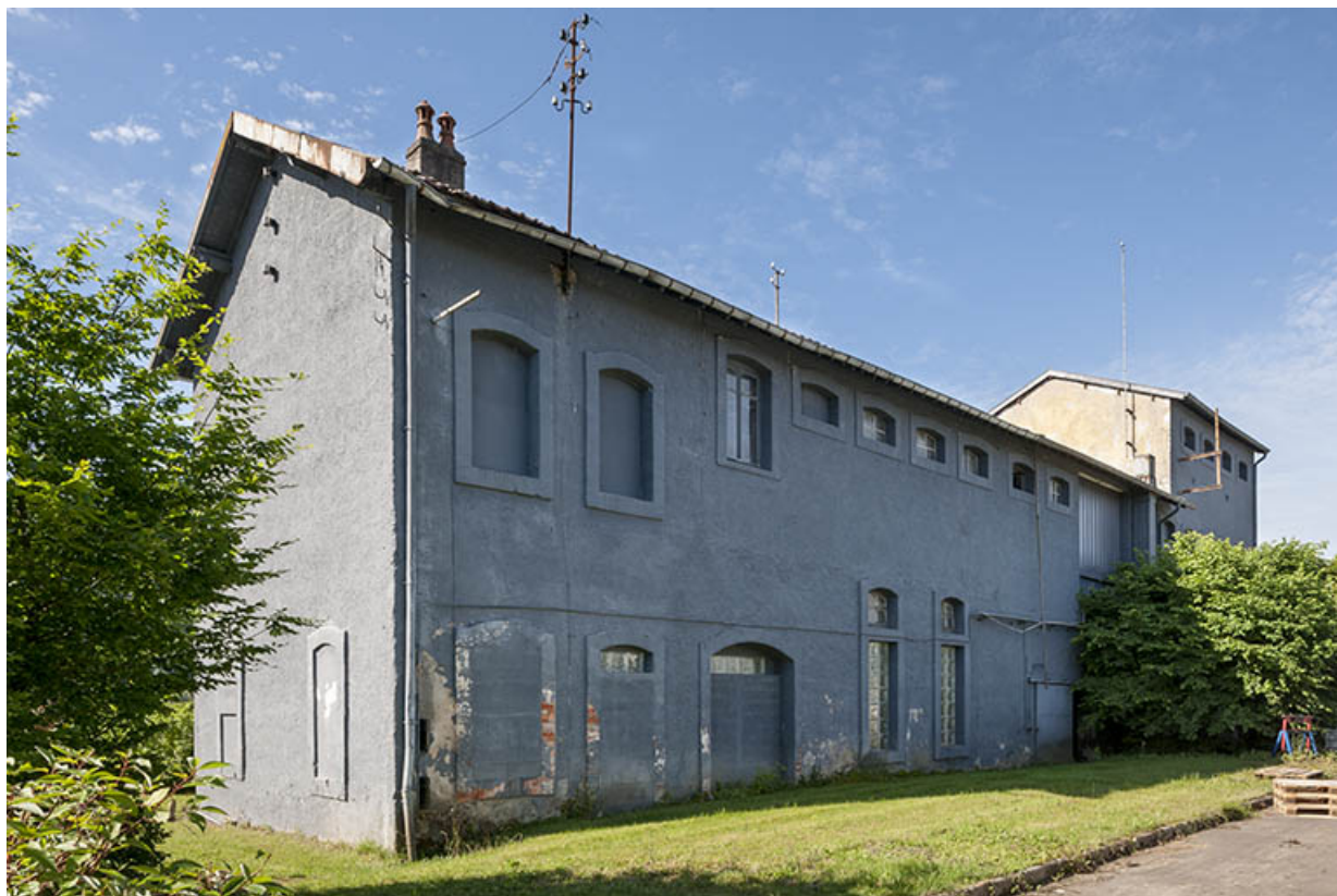
Ancien atelier de dénaturation des alcools et de conditionnement. Vue de trois quarts.

25, Roche-lez-Beaupré, 48 route Nationale