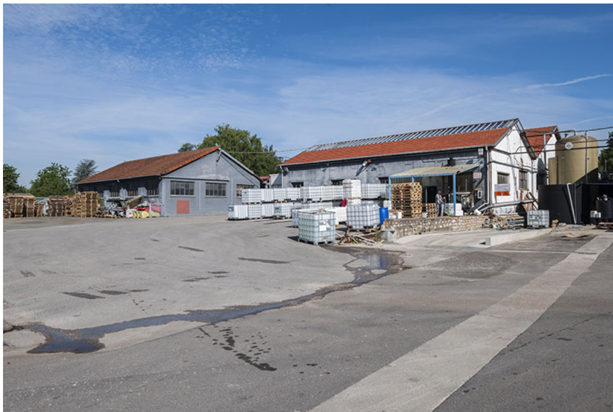
Garages, entrepôts industriels et atelier depuis la cour, au sud-est. 25, Roche-lez-Beaupré, 48 route Nationale