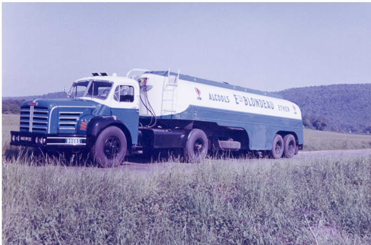
Camion-citerne des Ets Blondeau, fotogr., s.d. [3e quart 20e siècle]. 25, Roche-lez-Beaupré, 48 route Nationale