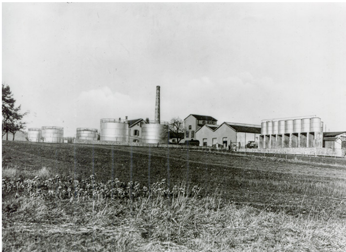
Vue d'ensemble depuis le sud-ouest, fotogr., s.d. [milieu 20e siècle].

25, Roche-lez-Beaupré, 48 route Nationale