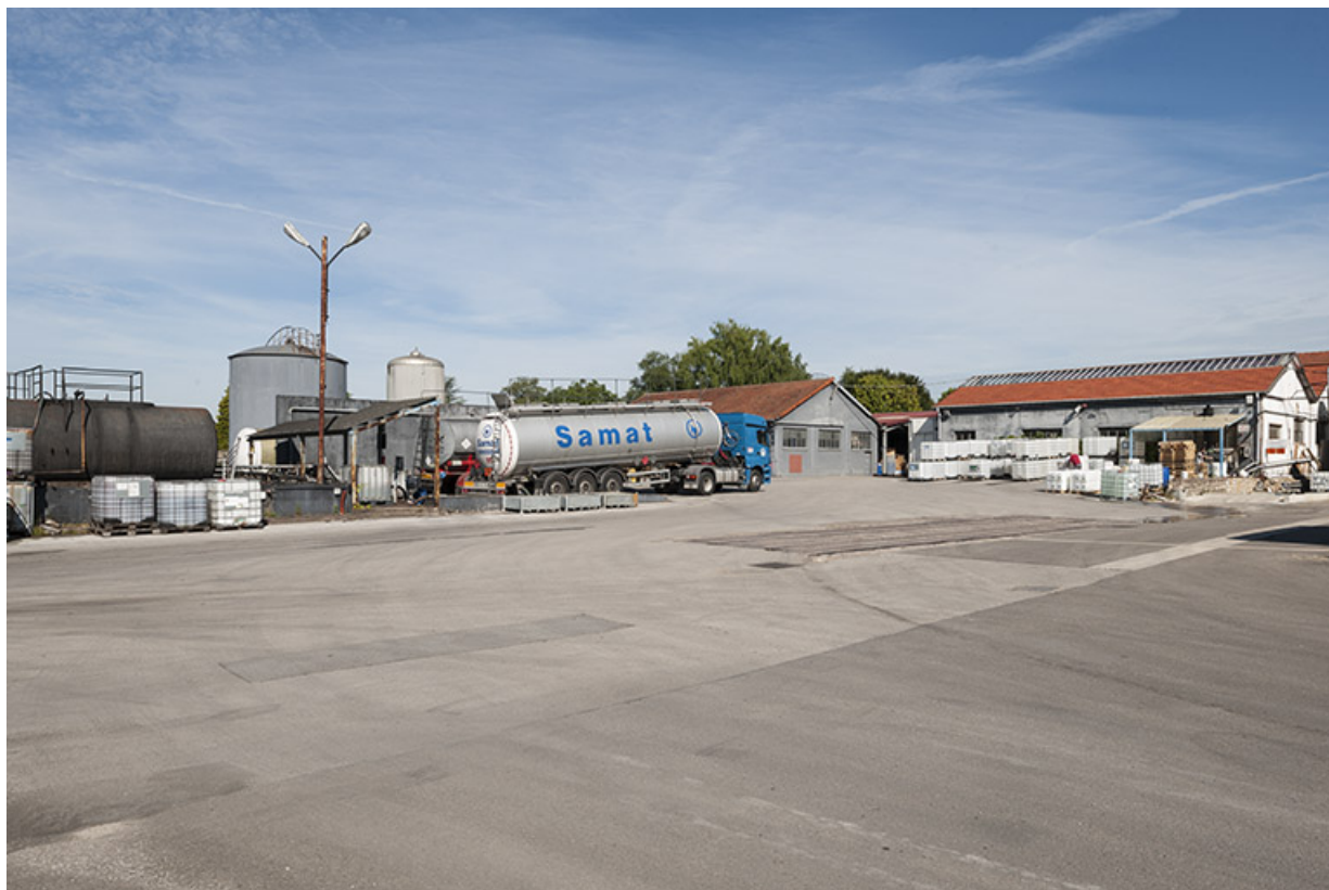
Vue d'ensemble depuis la cour, au sud-est. 25, Roche-lez-Beaupré, 48 route Nationale