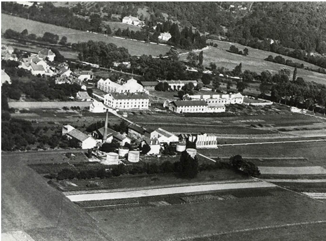
Vue d'ensemble plongeante depuis le nord-ouest, fotogr., s.d. [milieu 20e siècle]. 25, Roche-lez-Beaupré, 48 route Nationale