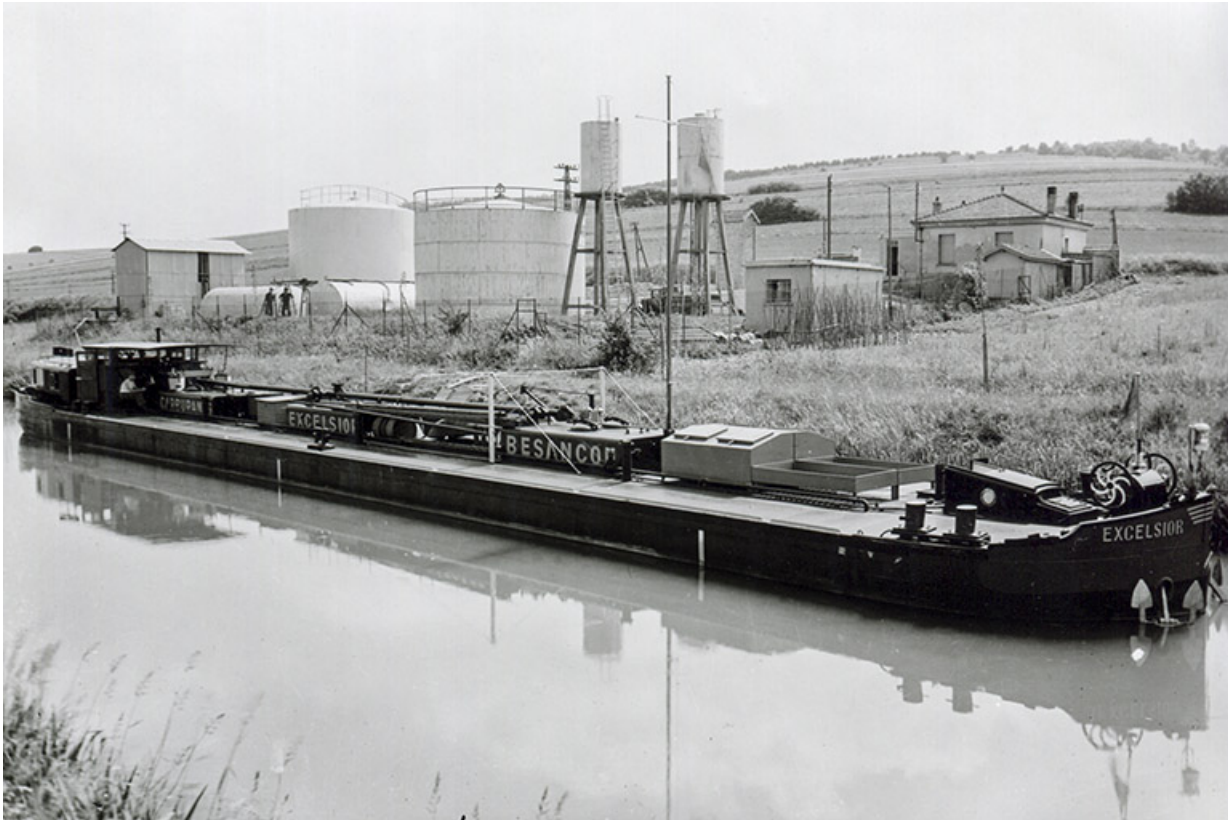
Péniche de transports des carburants Excelsior, fotogr., s.d. [milieu 20e siècle]. 25, Roche-lez-Beaupré, 48 route Nationale