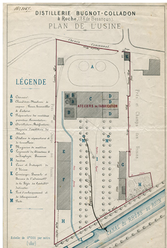
Distillerie Bugnot-Colladon à Roche - Plan de l'usine, s.d. [1870].

25, Roche-lez-Beaupré, 48 route Nationale