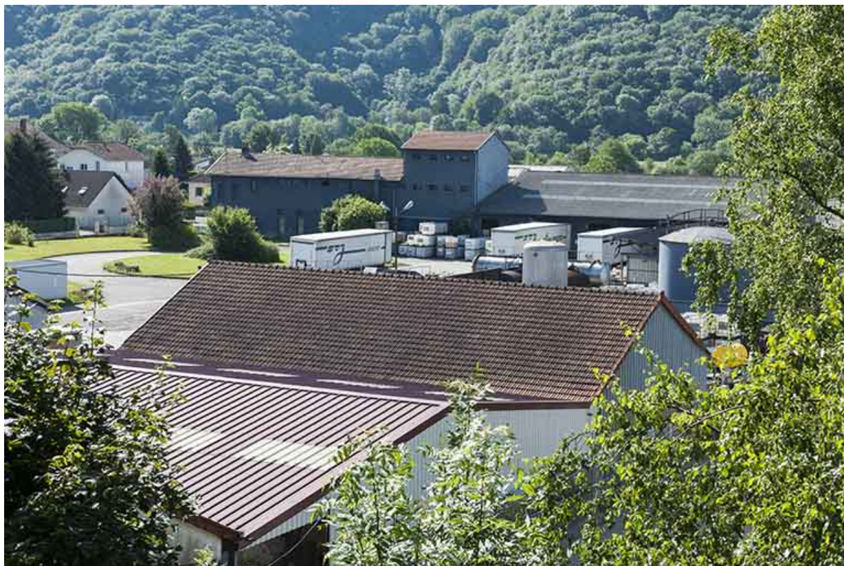
Vue plongeante sur les bâtiments sud (ancien atelier de dénatration).

25, Roche-lez-Beaupré, 48 route Nationale