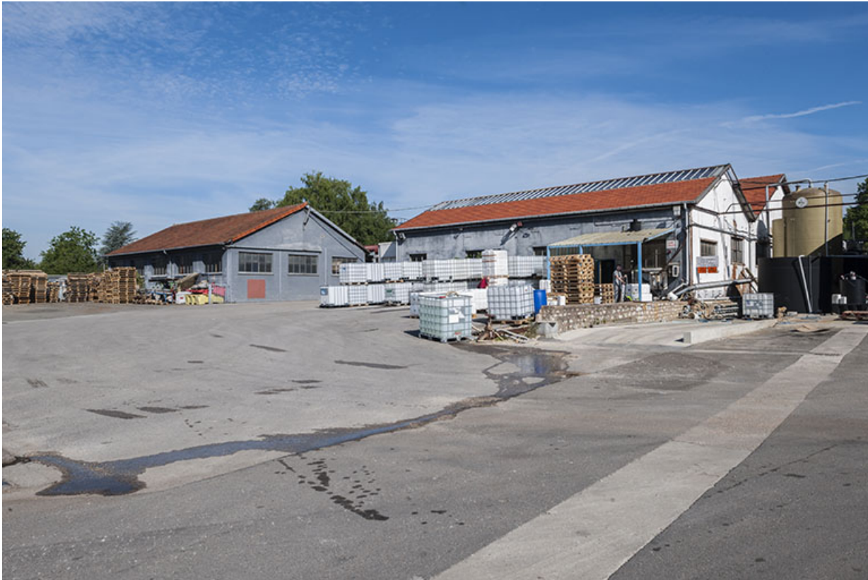
Garages, entrepôts industriels et atelier depuis la cour, au sud-est.

25, Roche-lez-Beaupré, 48 route Nationale