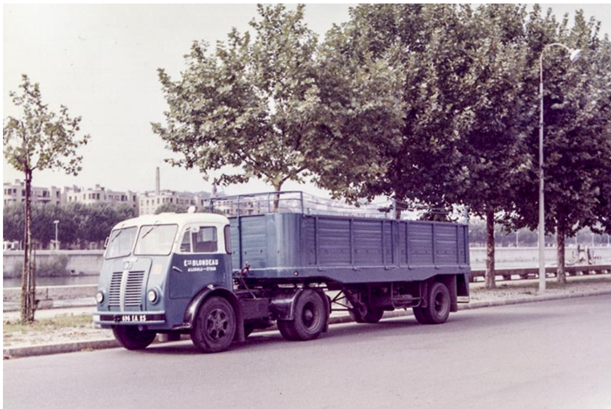
Camion des Ets Blondeau, fotogr., s.d. [milieu 20e siècle]. 25, Roche-lez-Beaupré, 48 route Nationale

Batterie de réservoirs industriels au sud du site. Chargement des wagons-citernes, fotogr., s.d. [milieu 20e siècle].