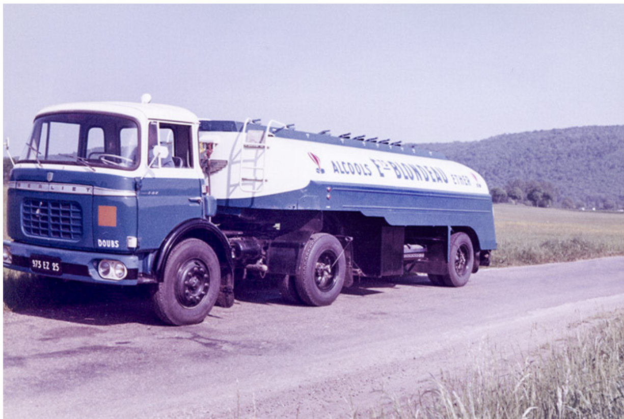
Camion-citerne des Ets Blondeau, fotogr., s.d. [3e quart 20e siècle]. 25, Roche-lez-Beaupré, 48 route Nationale