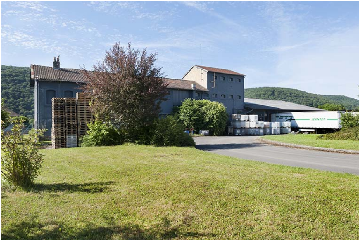
Ancien atelier de dénaturation des alcools et de conditionnement.

25, Roche-lez-Beaupré, 48 route Nationale