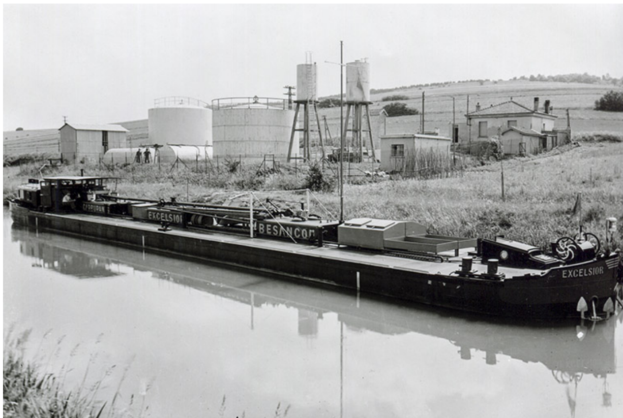
Péniche de transports des carburants Excelsior, fotogr., s.d. [milieu 20e siècle].

25, Roche-lez-Beaupré, 48 route Nationale