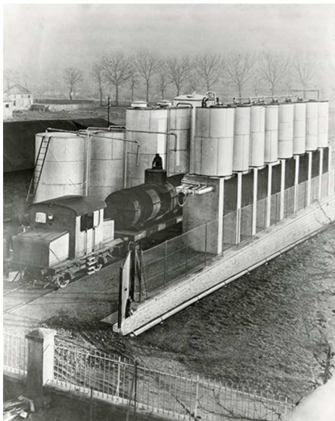
Batterie de réservoirs industriels au sud du site. Chargemen des wagons-citernes, fotogr., s.d. [milieu 20e siècle]. 25, Roche-lez-Beaupré, 48 route Nationale