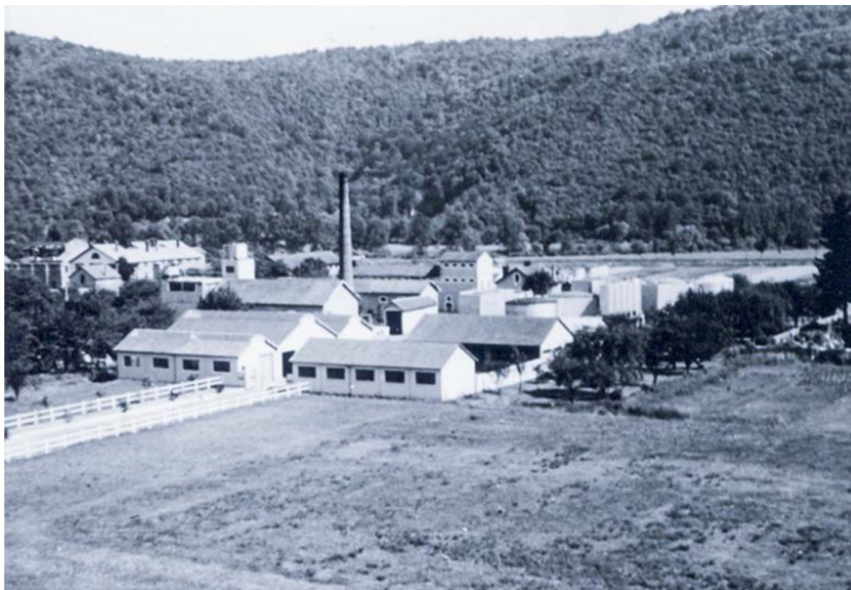
Vue plongeante sur l'usine depuis le nord-ouest, fotogr., s.d. [milieu 20e siècle]. 25, Roche-lez-Beaupré, 48 route Nationale