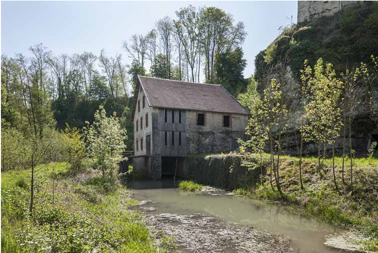
Vue d'ensemble depuis l'ouest, avec le canal de fuite.

25, Rigney, lieudit : Château de la Roche