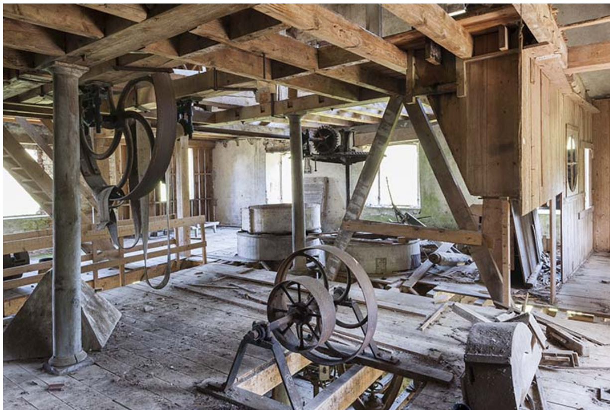
Premier étage. Vue d'ensemble depuis le sud-est.

25, Rigney, lieudit : Château de la Roche