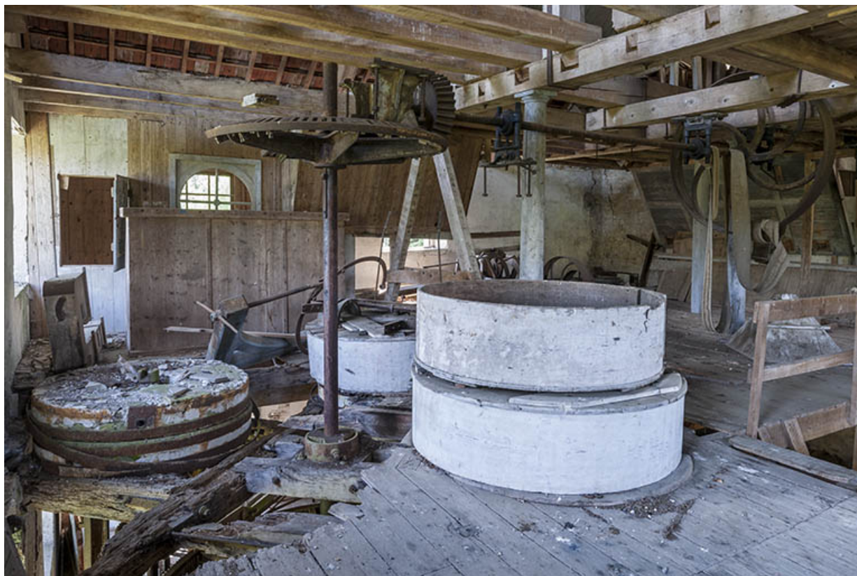
Premier étage. Les meules, leur archure, et les éléments de transmission pour l'étage supérieur. 25, Rigney, lieudit : Château de la Roche