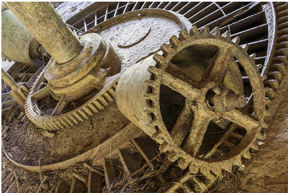
Détail de la partie supérieure de la turbine.

25, Rigney, lieudit : Château de la Roche