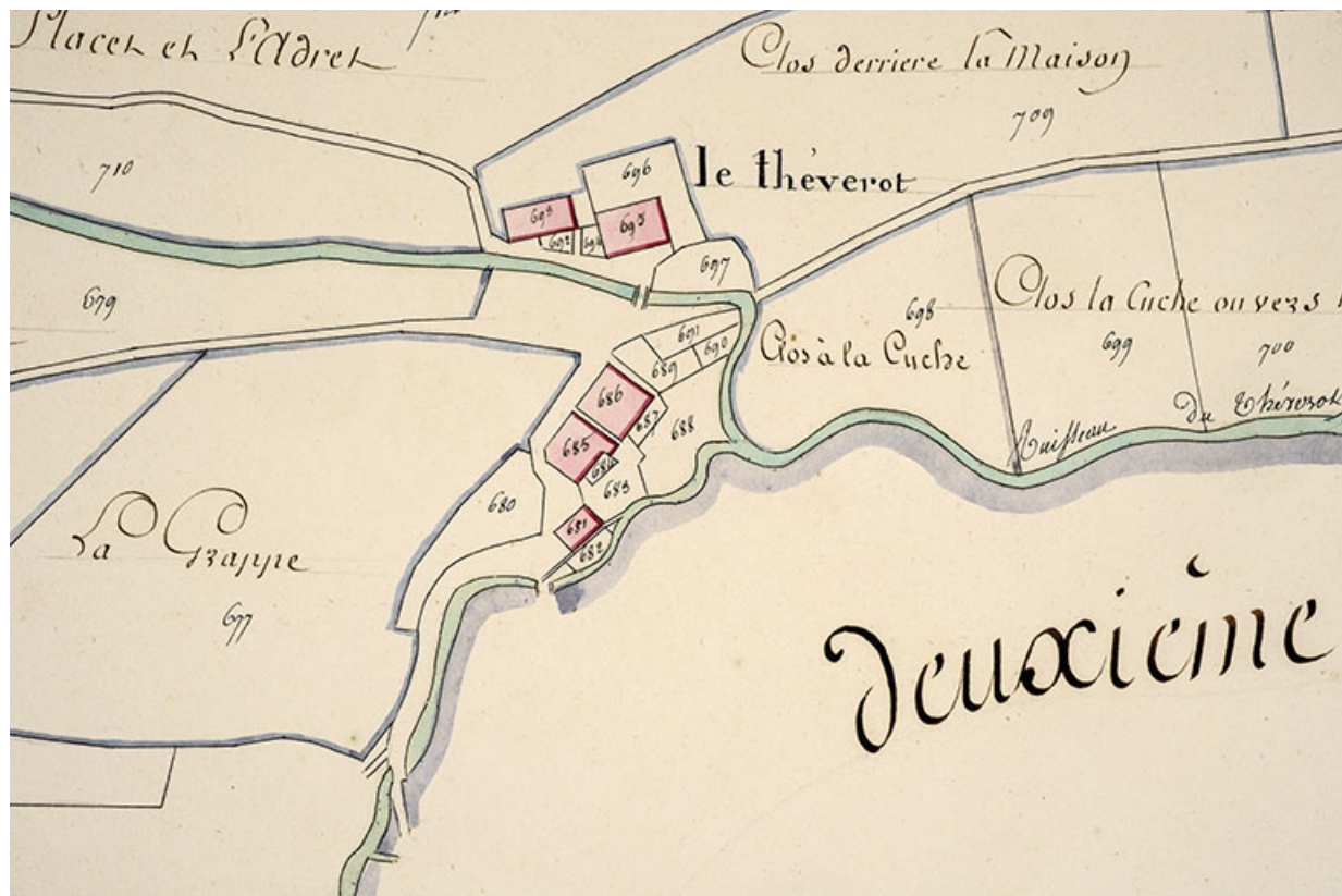
Cadastre de la commune des Gras. Atlas parcellaire, 1816, section D 3e feuille [détail : le Théverot], 1/2 500. 25, Les Gras, lieu-dit : le Théverot