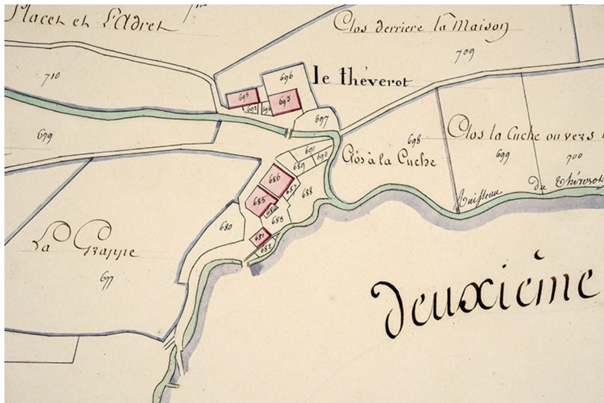
Cadastre de la commune des Gras. Atlas parcellaire, 1816, section D 3e feuille [détail : le Théverot], 1/2 500. 25, Les Gras