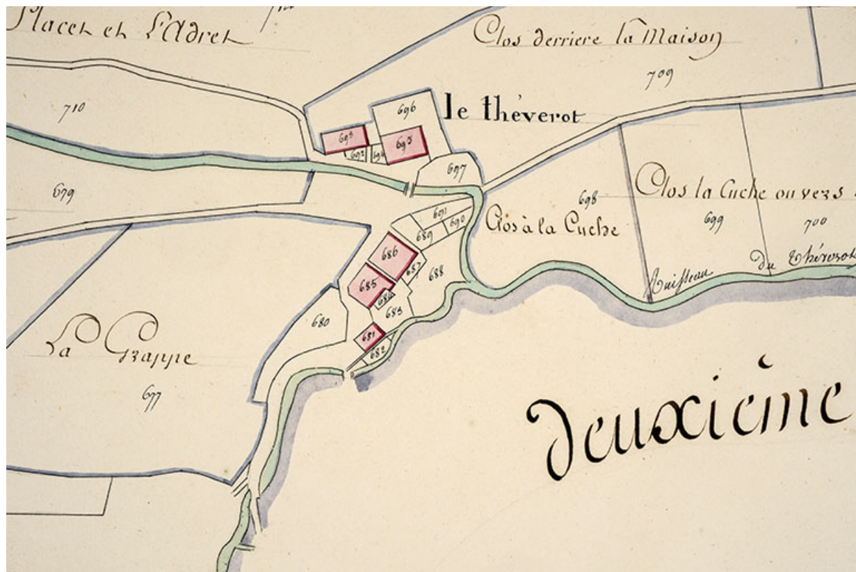
Cadastre de la commune des Gras. Atlas parcellaire, 1816, section D 3e feuille [détail : le Théverot], 1/2 500. 25, Les Gras, lieu-dit : le Théverot