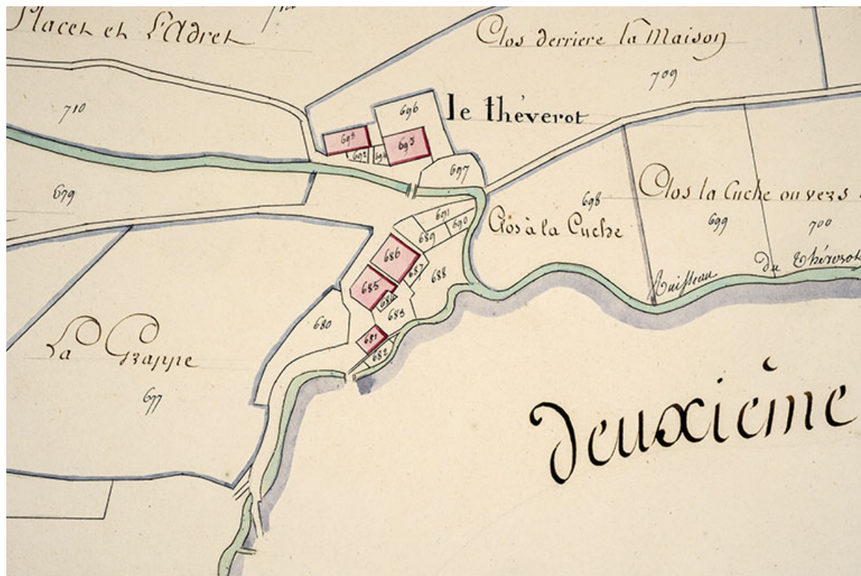
Cadastre de la commune des Gras. Atlas parcellaire, 1816, section D 3e feuille [détail : le Théverot], 1/2 500. 25, Les Gras