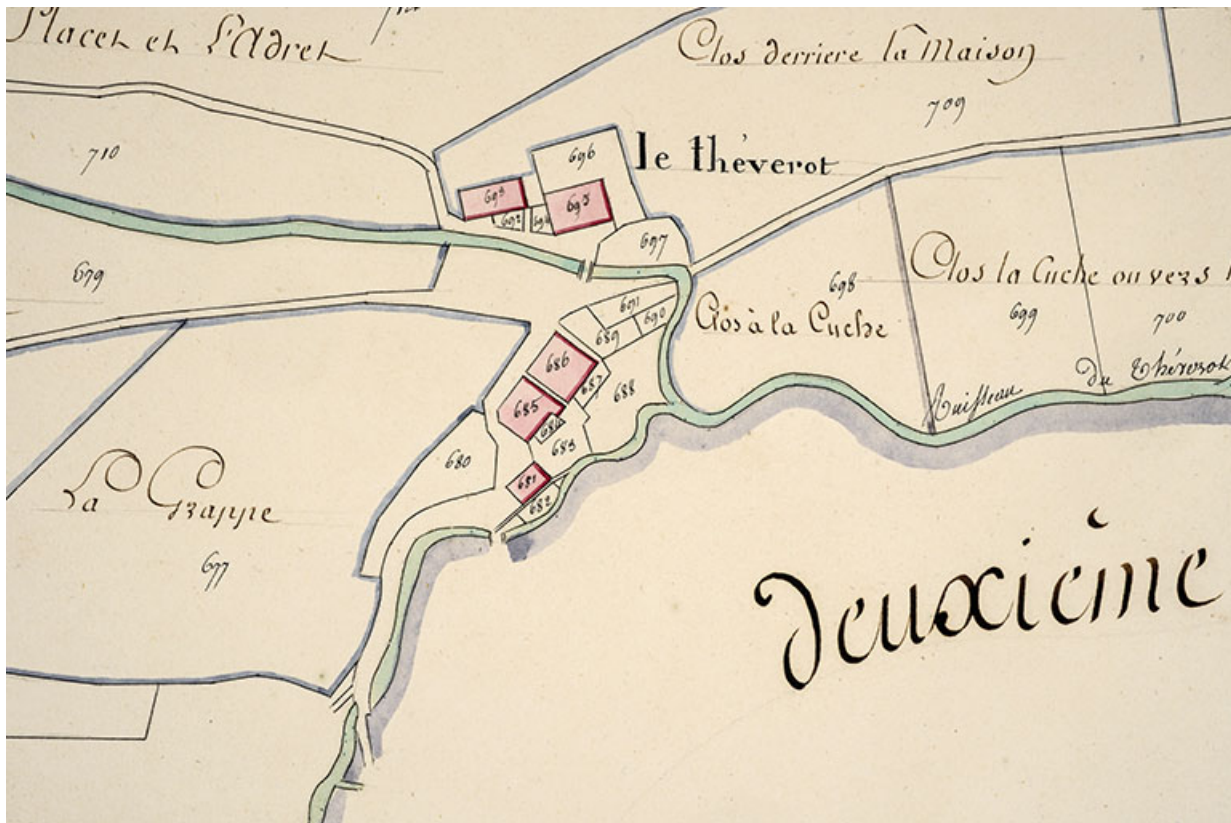
Cadastre de la commune des Gras. Atlas parcellaire, 1816, section D 3e feuille [détail : le Théverot], 1/2 500. 25, Les Gras