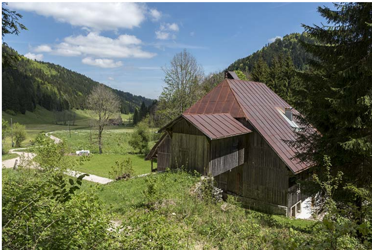
Façade postérieure, de trois quarts droite.