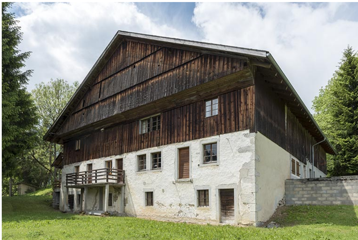
Façade antérieure, de trois quarts droite. 25, Les Gras