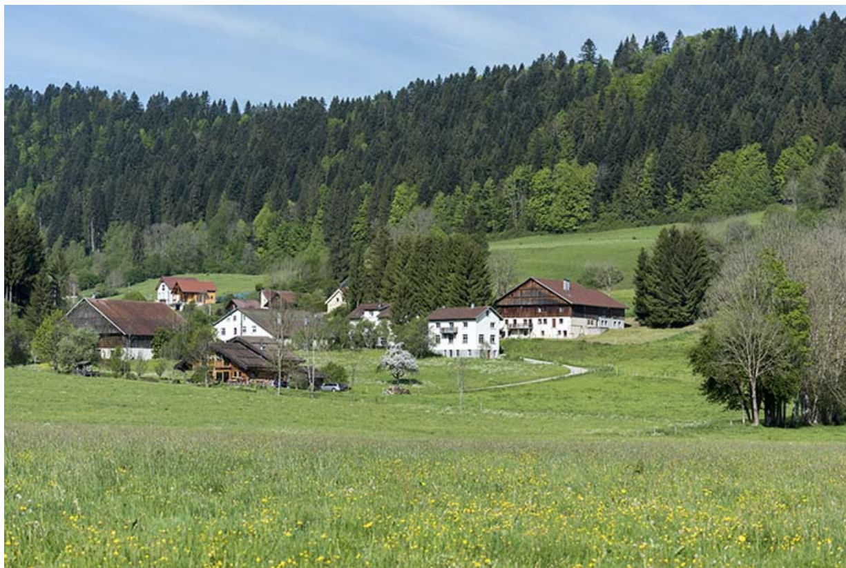
Vue d'ensemble des Jean-Jacquot, depuis l'est. 25, Les Gras