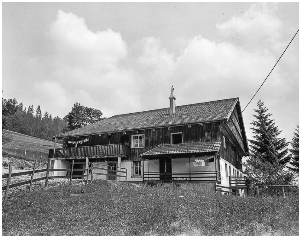
Ferme située au lieu-dit Les Jeanjacquots, cadastrée ZB 22 : vue d'ensemble. 25, Les Gras, 24 rue les Jean-Jacquot, lieudit : les Jean-Jacquot