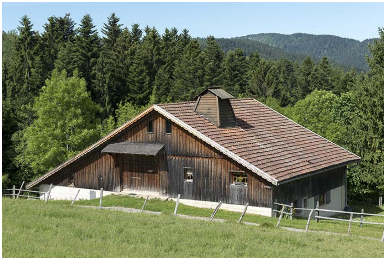
Elévations est (avec sa levée de grange) et nord.