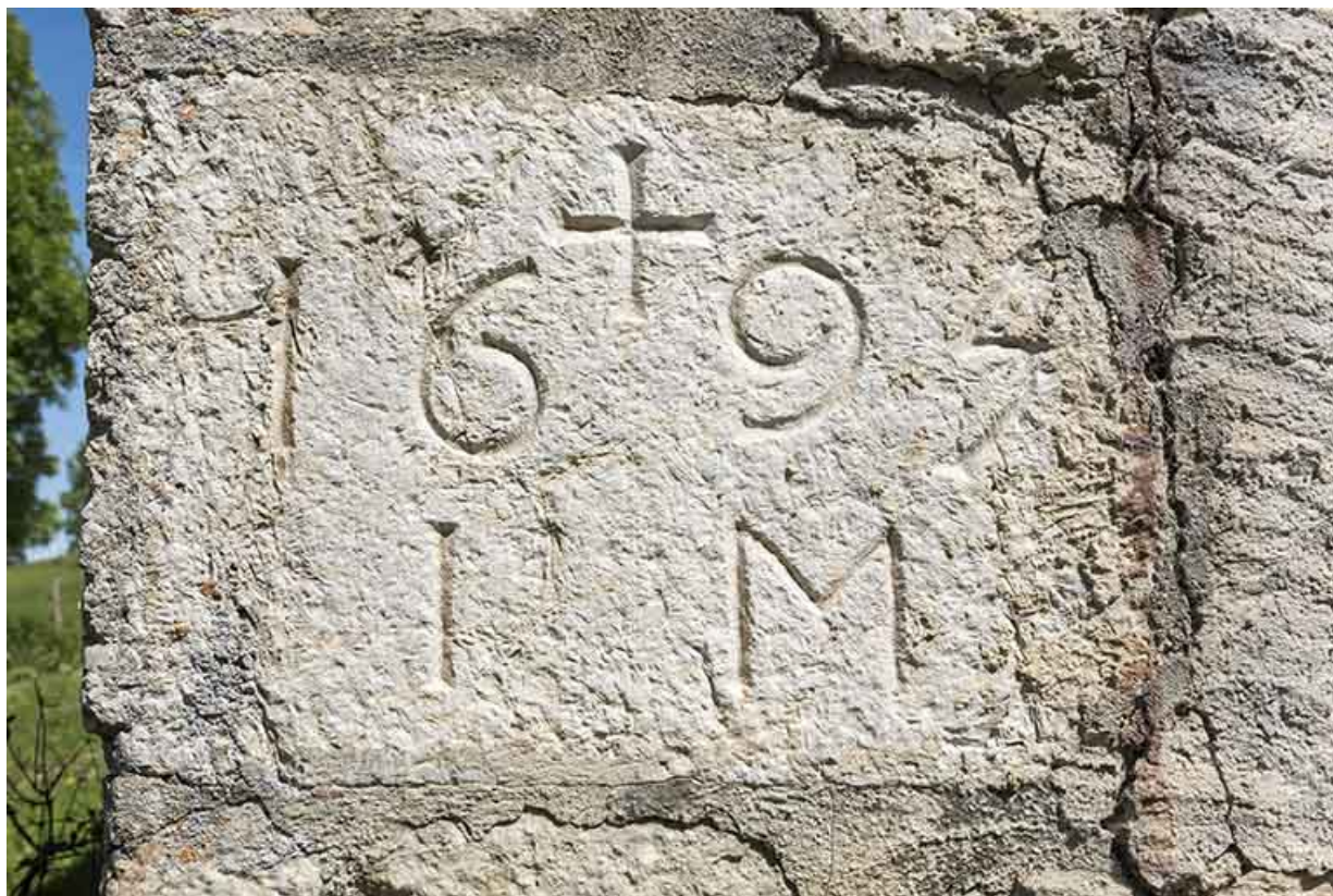
Date 1695 (façade antérieure, angle sud-ouest). 25, Les Gras, lieudit : chez Voynot