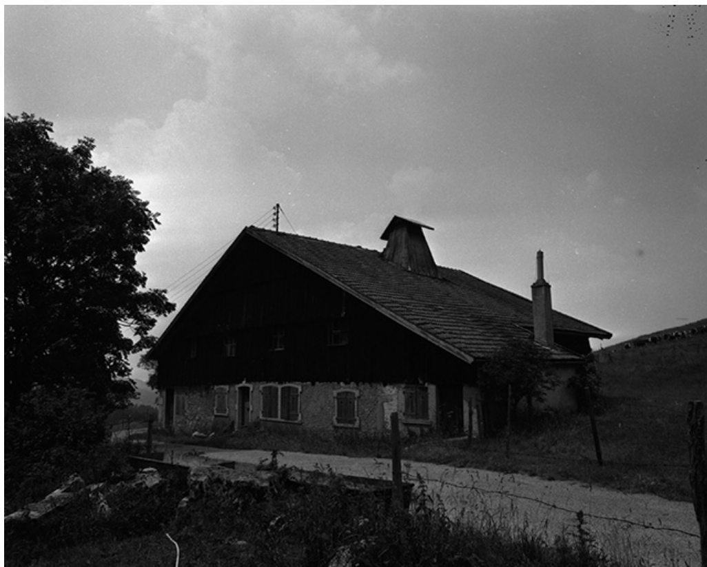
Ferme située au lieudit Le Nid du Fol, cadastrée ZD 51 : façades antérieure et latérale droite. 25, Les Gras, lieudit : chez Voynot