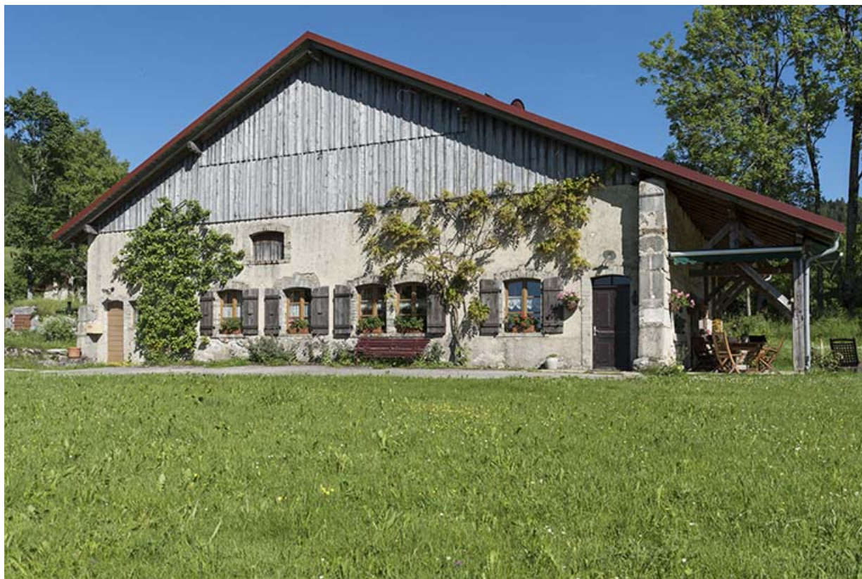
Façade antérieure, de trois quarts droite. 25, Les Gras