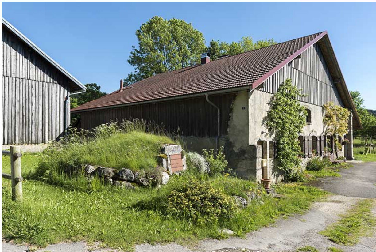
Façades antérieure et latérale gauche (avec la citerne au premier plan).

25, Les Gras, 2 rue le Nid du Fol, lieudit : le Nid du Fol